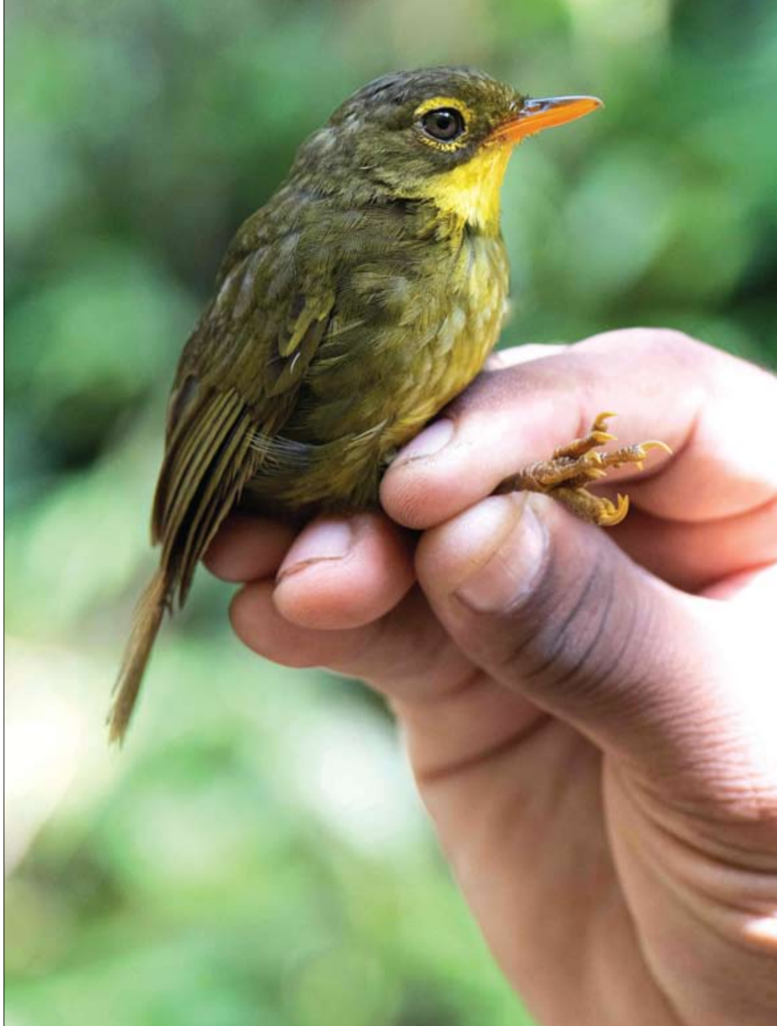
طائر التتراكا الداكن وهو طائر مغرد أصفر الحلق وموطنه الأصلي في مدغشقر.

لم يتم العثور بعد على الرابط الدقيق بين الكورتيزول و كوفيد طويل الأمد، لكن نتائج جامعة ييل يمكن أن تفتح الباب لتفسير فرضية جديدة لما يسبب المرض الغامض. أفادت مراكز السيطرة على الأمراض والوقاية منها (CDC) بأن حوالي ثمانية بالمائة من البالغين الأمريكيين يعانون من أحد أشكال كوفيد الطويل. جمع الباحثون الذين أتاحت نتائجهم قبل الطباعة عبر الإنترنت ومراجعة الأقران المعلقة بيانات من 215 شخصا، من بين تلك المجموعة، كان لدى 99 حالة إصابة بكوفيد طويل الأمد و 40 لم تسجل إصابتهم ب كوفيد 19، بينما تعافى الـ 76 الآخرون من الفيروس دون مضاعفات طويلة الأمد. تشمل الأعراض الأكثر شيوعا التي عانى منها مرضى كوفيد طويل الأمد ضباب الدماغ والتعب ومشاكل الجهاز العصبي، و تم أخذ عينات دم من كل مشارك وقياس مستويات الكورتيزول التي تم العثور عليها. والكورتيزول هو هرمون التوتر الرئيسي في الجسم، ينشط في الغدد الكظرية الموجودة حول الكلى وينتشر في جميع أنحاء الجسم. بمجرد اكتشاف كمية كافية من الهرمون في مجرى دم الشخص، ينتقل الدماغ إلى حالة تأهب قصوى، مما يؤدي إلى الشعور الذي نعرفه باسم «التوتر». تم ربط مستويات الكورتيزول المنخفضة بمتلازمة التعب المزمن وأمراض أخرى مماثلة في الماضي، والتعب هو أيضا أحد أبرز أعراض مرض كوفيد الطويل. ولاحظ فريق البحث بجامعة ييل أن بعض مرضى كوفيد لفترة طويلة الذين عولجوا من خلال زيادة مستويات الكورتيزول لديهم أظهروا بعض التحسن.