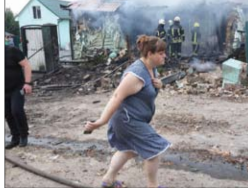
امرأة تفر من موقع تضرر بعد هجوم صاروخي على قرية خارج كييف.

قتل شخصان أمس إثر هجوم روسي بالمسيرات والصواريخ على كييف وصف بأنه الأقوى منذ الربيع، بحسب ما أعلنت السلطات العسكرية للعاصمة الأوكرانية. من جهتها استهدفت روسيا بعدة هجمات بطائرات مسيرة. أحدها، وفي حدث نادر يشمال غرب البلاد، دمر عدة طائرات عسكرية في مطار بسكوف. وأعلن الجيش الروسي من جانب آخر أنه قام بتحديد عدة مقنذوات فوق مناطق غربية في موسكو، بريانسك، أوريل وكالوغا وريازان وكذلك في القرم، شبه الجزيرة التي ضمتها موسكو في 2014. في أوكرانيا، استيقظ سكان كييف على دوي انفجارات ناجمة عن