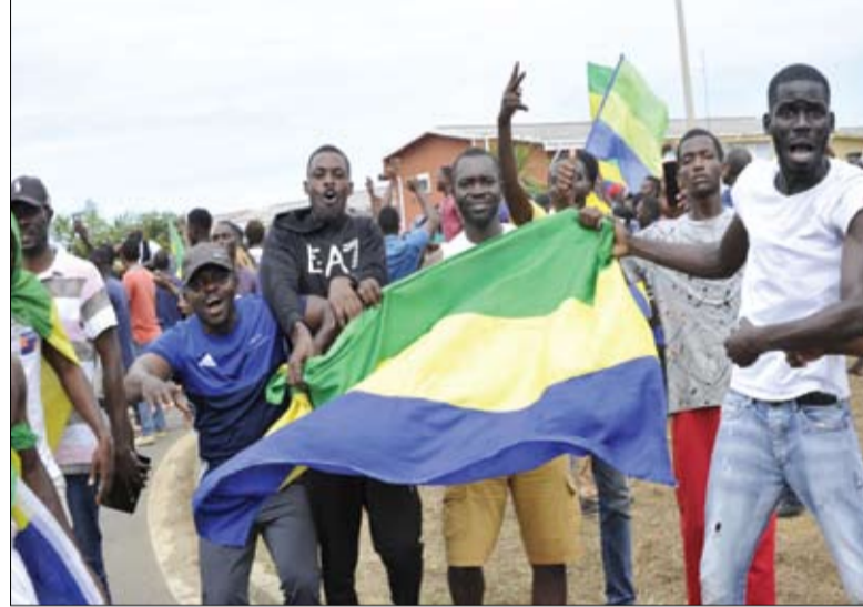
السكان يلوون بالعلم الوطني للجانغون أثناء احتفالهم بالانقلاب العسكري في ليبرفيل. (ا ف ب)

ضباط من الجيش أمس الاستيلاء على السلطة. وأضاف تتابع الوضع عن كتب. مسؤول السياسة الخارجية بالاتحاد الأوروبي أمس الأربعاء على عملية الانقلاب التي شهدتها الغابون، قائلاً إن وزراء دفاع دول الكتلة سيبحثون الموقف في الغابون وإذا تأكد وقوع انقلاب هناك، فسوف يدعوون لوقف التصرفات في المنطقة. وأضاف بوريل متحدتاً أمام اجتماع لوزراء دفاع دول الاتحاد في توليدو بإسبانيا إذا تأكد ذلك، فسوف يكون انقلاباً عسكرياً آخر يفاقم عدم الاستقرار في المنطقة. هذه مشكلة كبيرة لأوروبا.