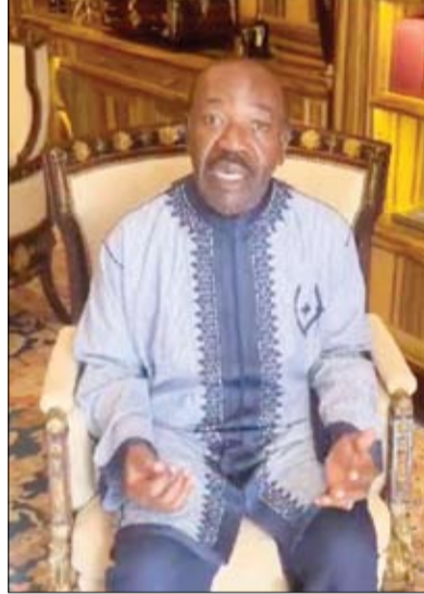
رئيس الغابون المخلوع في رسالة عبر الفيديو