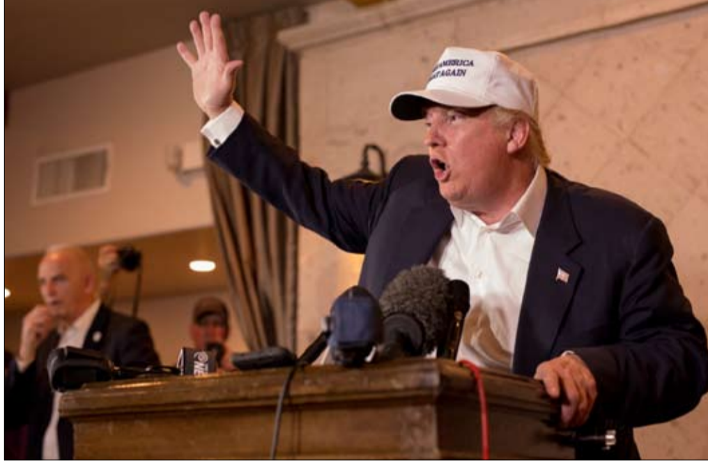
ترامب... استراتيجية رقمية ناجحة