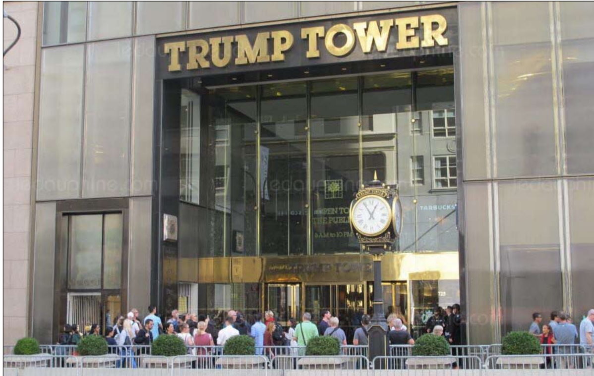
من هنا انطلقت المحمة الالكترونية

خصص لرئاسية 2020 ما يزيد على 21 مليون دولار للشبكة الاجتماعية، مقابل 44 مليون عام 2016