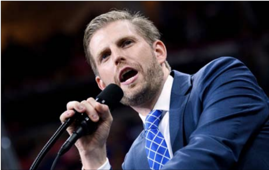
اريك ترامب يمنح عبرية الواب ماستر