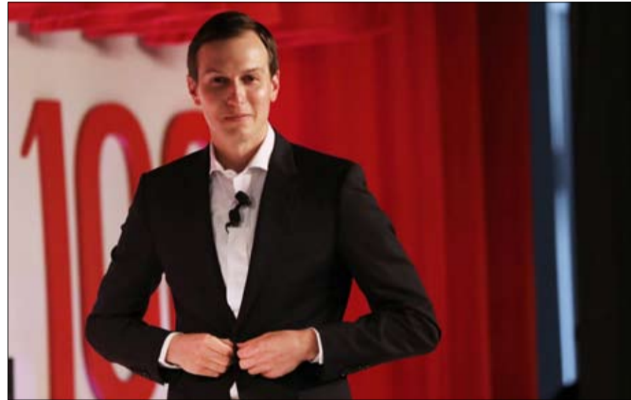
جاريد كوشنر فتح له طريق الثراء