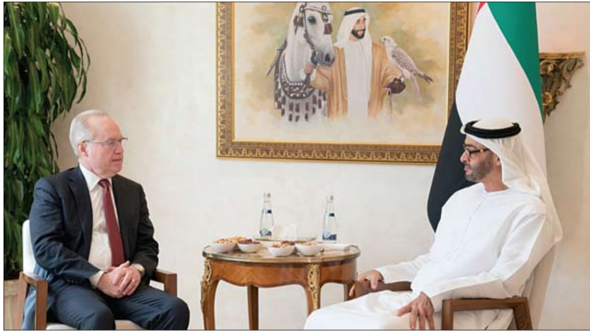
محمد بن زايد خلال استقباله رئيس شركة رايشيون الأمريكية