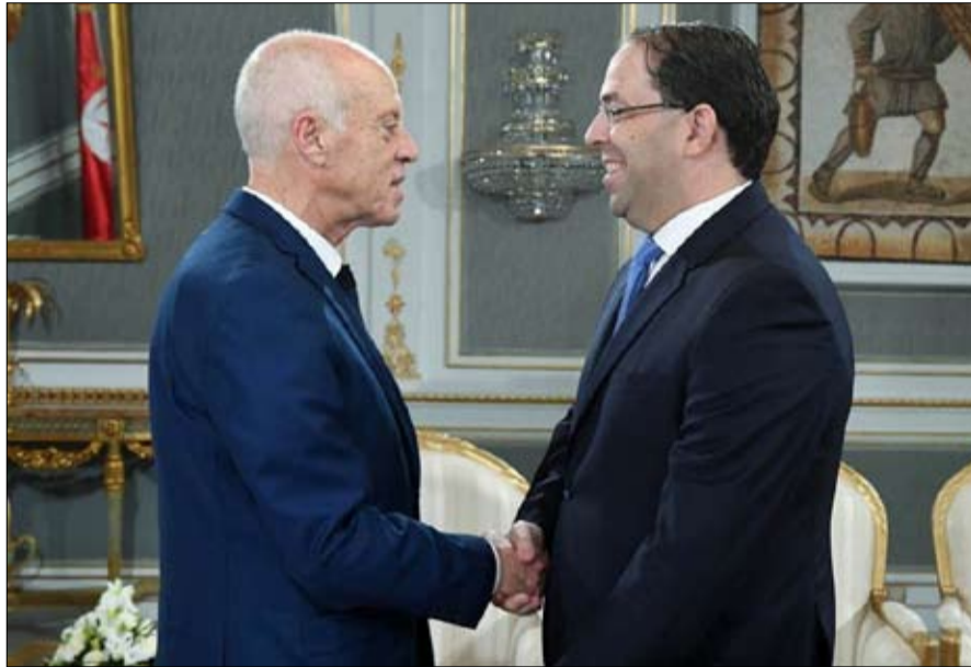
هل هو اتفاق بين الرئيسين؟

يترأس مستشار الأمن القومي الجديد للرئيس دونالد ترامب الوفد الأمريكي إلى قمة شرق آسيا، وفق ما أعلن البيت الأبيض في أول خفض لمستوى التمثيل الأمريكي منذ دعوة الولايات المتحدة للمرة الأولى إلى المنتدى الإقليمي. وفيما يواجه ترامب تحقيرا يرمي إلى عزله، فإن خفض التمثيل في القمة التي تعقد في 3 و4 تشرين الثاني/نوفمبر في باتوك، سيحدد الانتقادات بأن الولايات المتحدة لا تركز على آسيا في وقت يتنامى النفوذ الصيني. وقال البيت الأبيض إن روبرت أوبراين الذي تولى المنصب في أيلول-سبتمبر خلفا للمتقدم جون بولتون، سترأس الوفد الأمريكي الذي يضم في صفوفه وزير التجارة ويليور روس، وسيزور روس بمفرده إندونيسيا وفيتنام. ورغم عدم حضور ترامب إلا أنه من المتوقع أن يتوجه في الأسبوع الذي يليه إلى قمة أخرى لكتلة منتدى التعاون الاقتصادي لآسيا والمحيط الهادئ (أبيك) في سانتياغو. ولسنوات قام بالترويج للقمة رئيس الوزراء الماليزي المخضرم مهاتير محمد المدافع الشرس عن مستقبل القارة الذي تصور كتلة في نهاية المطاف تشبه الاتحاد الأوروبي. غير أن الولايات المتحدة أصبحت على نحو مثير للجدل من القمة الافتتاحية في كوالالمبور عام 2005، ما أثار تعليقات واسعة في آسيا بأن واشنطن متشغلة جدا بالشرق الأوسط. وبعد أن تعهد الرئيس باراك أوباما تحويل الاهتمام الأمريكي إلى آسيا، دُعيت الولايات المتحدة -- وكذلك روسيا -- بصفة مشارك إلى القمة اعتبارا من 2011. وواظب أوباما على الحضور كل عام باستثناء 2013، أثناء مواجهة الجمهوريين في الكونغرس بشأن إغلاق حكومي، وأوفد نيابة عنه وزير الخارجية جون كيري.