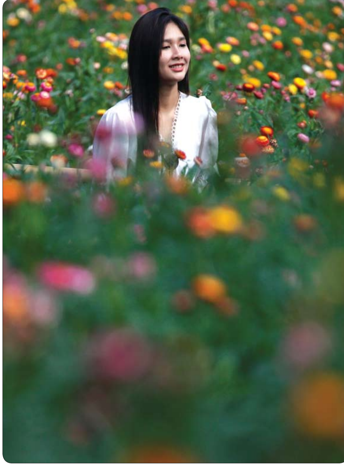
سانحة تستمتع بين الزهور في حديقة فوهين رونج كلا الوطنية، مقاطعة فيتسانولوك، تايلاند.

- تراجع في حدة الإبصار: إذا شعرت بتراجع في الإبصار بشكل مفاجئ مع التهاب في العين، وشعور بالحكة، والإصابة باحمرار العين، فعليك التوجه للطبيب لمعرفة سبب تلك الأعراض؛ لأنها قد تكون ناتجة عن الإصابة بجفاف العين.