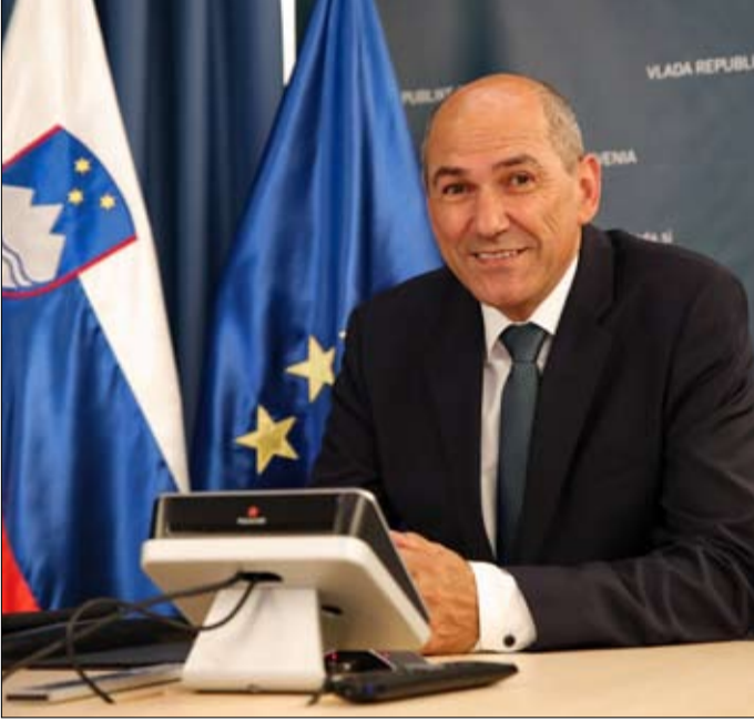
يفترض ألا تقلب الحرب الرأي العام المعادي لجانيز جانسا

أدى تسلسل الصراع في أوكرانيا إلى زعزعة العديد من التوازنات السياسية الداخلية، كما تدخل في النقاشات الانتخابية للعديد من بلدان أوروبا الوسطى والبلقان.