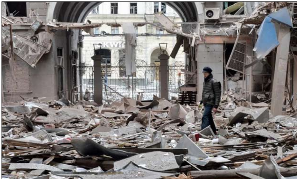
هل سواجه الغرب حقيقة الحرب الشاملة؟