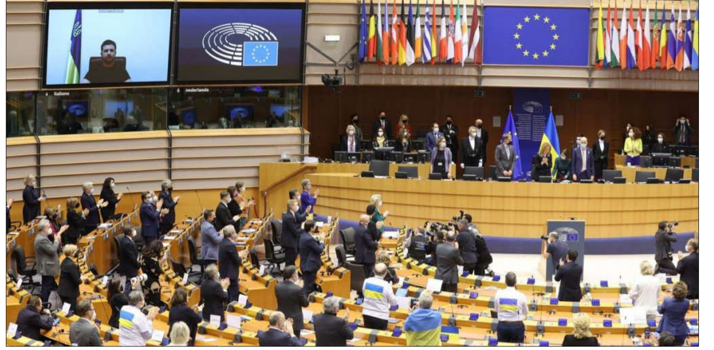
الاتحاد الاوروبي قد يجبر على دخول الحرب

الغزو قوة المقاومة الأوكرانية فحسب، بل أظهر أيضاً نقاط ضعف الجيش الروسي، الذي لا يزال في الواقع ذاك الجيش المتهالك للاتحاد السوفياتي (وهو أمر لا يعيق للأسف تماماً قدرته على الإيذاء).