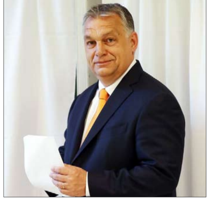
الصراع في أوكرانيا يتدخل في النقاش الانتخابي للعديد من البلدان الأوروبية

بدلة رئيس الدولة على كتفيه، يخلق إيمانويل ماكرون في استطلاعات الرأي، بينما يتعرض جان لوك ميلينشون أو مارين لوبان لانتقادات بسبب تعاطفهما مع نظام موسكو، وتجد فاليري بيكريس صعوبة في التوقع بين الوحدة الوطنية والمعارضة المتشددة. لكن فرنسا أبعد ما تكون عن كونها الدولة الأوروبية الوحيدة التي ترى موعداً للانتخابي الأعلى يهتز بسبب الشؤون الخارجية... نظرة عامة: