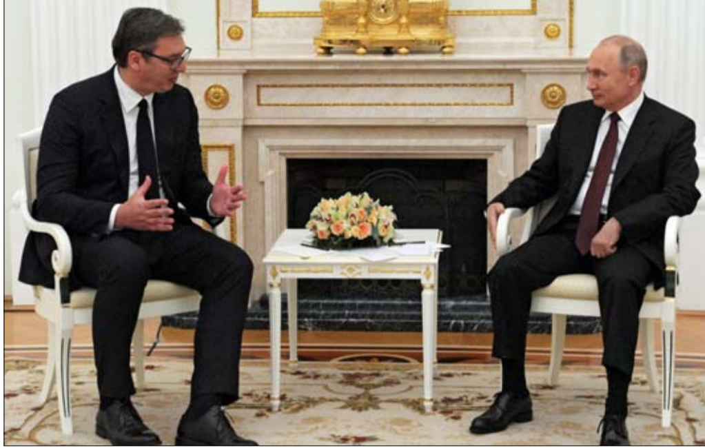
الرئيس الصربي في ورطة