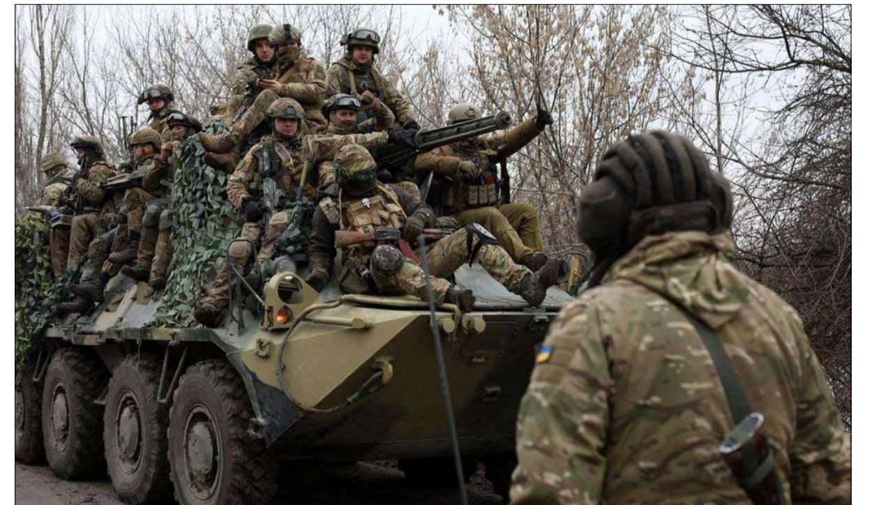
الجيش الأوكراني والمدد الغربي