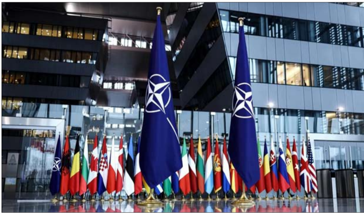
الاطلسي... امتناع محفوف بالمخاطر

عن العالم الأنجلو ساكسوني والفرنسية، ناهيك عن التبعية في ظل الإمبراطورية الروسية. من ناحية أخرى، بالنسبة إلى نوفوستي، فإن إعادة هيكلة القارة هذه بدون الأنجلو ساكسونيين وبدون الاتحاد الأوروبي، ستسرع "بناء نظام عالمي جديد": "الصين، الهند، أمريكا اللاتينية، إفريقيا الشمالية، العالم الإسلامي وجنوب شرق آسيا، لا أحد يعتقد