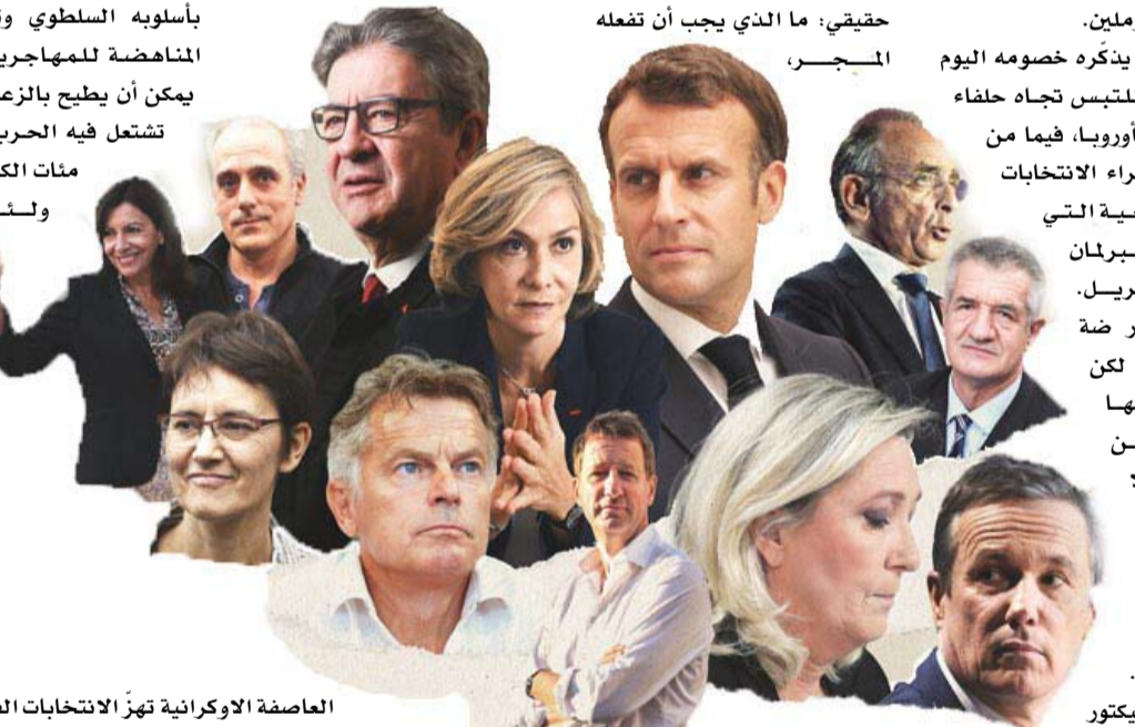
العاصمة الأوكرانية تهبّ الانتخابات الفرنسية

الحاصرة بين الشرق والغرب؟ أوربان ورقة الخبرة الدولية ضد خصم يركز بشدة على السياسة الداخلية، تضيف كاترين هوريل. ورغم موافقه المؤيدة لروسيا، يمكن لرئيس الوزراء الاستفادة من الأزمة من خلال تأكيد مكانته كرئيس للدولة. ومهما كانت نتيجة الانتخابات، فإن الصراع في أوكرانيا قد أعاد إحياء سؤال لم يعد موضع نقاش حقيقي، ما الذي يجب أن تفعله المجر.