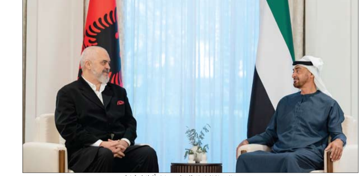
محمد بن زايد خلال استقبله لرئيس وزراء ألبانيا

عبدالله بن زايد وبلينكن يبحثان هاتفياً العلاقات الثنائية والمستجدات الدولية أبوظبي-وام: بحث سمو الشيخ عبدالله بن زايد آل نهيان وزير الخارجية والتعاون الدولي خلال اتصال هاتفي مع معالي اتوني بلينكن وزير خارجية الولايات المتحدة الأمريكية العلاقات الثنائية الإماراتية - الأمريكية والسبل الكفيلة بتعزيزها وتطويرها في مختلف المجالات. كما بحث الجانبان عدداً من القضايا الإقليمية والدولية ذات الاهتمام المشترك والمستجدات على الساحة الأوكرانية وأهمية العمل على الوصول لتسوية سياسية للأزمة.