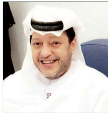
بحضور ورعاية سعيد بن طحتون والسفير المصري