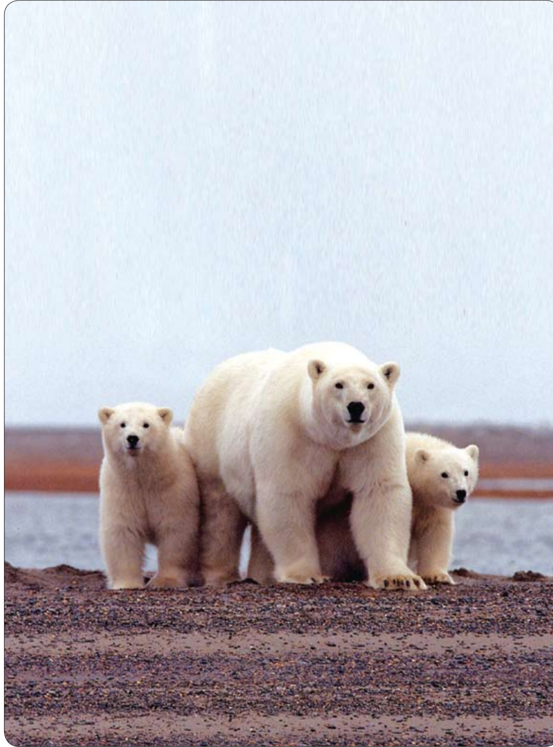
أنثى الدب القطبي على مقربة من صغارها على ساحل بحر بوفورت في محمية القطب الشمالي الوطنية للحياة البرية، ألاسكا.

بعد ارتفاع الكوليسترول السبب الرئيسي للنوبات القلبية، ويوجد مكمل واحد يمكن أن يخفض نسبة الكوليسترول المرتفع، هو خميرة الأرز الأحمر، التي تحتوي على مادة تسمى موناكولين K. وعند استخدام موناكولين K يوميا، يمكن أن يقل الكوليسترول الضار LDL بنسبة 15 إلى 25% في غضون ستة إلى ثمانية أسابيع. ويمكنه أيضا خفض الكوليسترول بمقدار مماثل. ومن المهم ملاحظة أن المكملات ليست هي الطريقة الوحيدة للحفاظ على صحة قلبك. يُعد التدخين أحد الأسباب الرئيسية لأمراض القلب والأوعية الدموية، لذا فإن التوقف عن التدخين هو أهم شيء يمكنك القيام به لتحسين صحة قلبك، كما تنصح مؤسسة القلب البريطانية (BHF). كما يعتبر النشاط البدني المنتظم والأكمل الصحي أفضل طريقة للحفاظ على الصحة الجيدة.