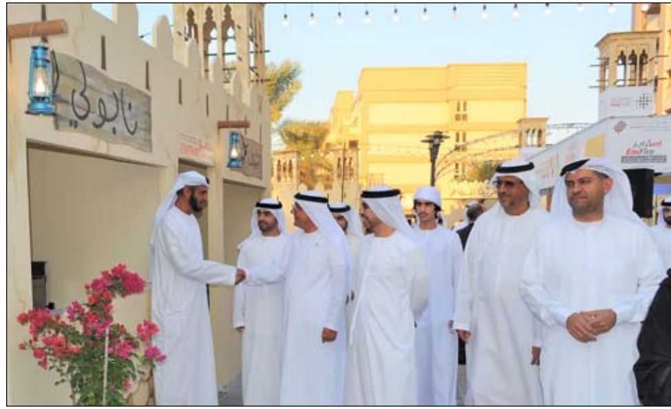
في افتتاح فعاليات مهرجان «قرية المطاعم»