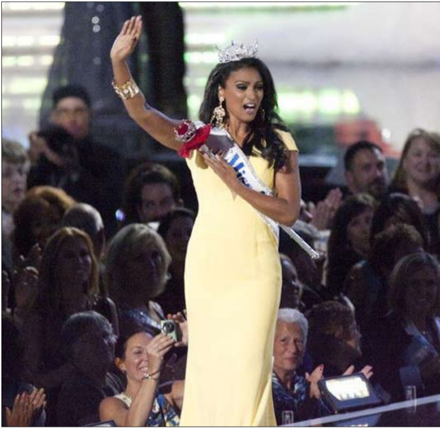
هندية ملكة جمال امريكا

آخر. على عكس الهند، حيث يتم تشجيع "النقاش والحجاج"، فإن الثقافة الصينية الغارقة في الكونفوشيوسية تثبط التعبير العلني عن الآراء والنقد البناء، وهو ما يعتبر في الولايات المتحدة "تقصاً بالثقافة بالنفس وفي الحافز والدافع وفي الإيمان"، كتب مايكل موريس، أحد مؤلفي الدراسة. لقد صوتوا بأعداد كبيرة ورغم أن ثلثي المهاجرين الهنود وصلوا بعد عام 2000، إلا أنهم يحتلون مكانة متزايدة الأهمية