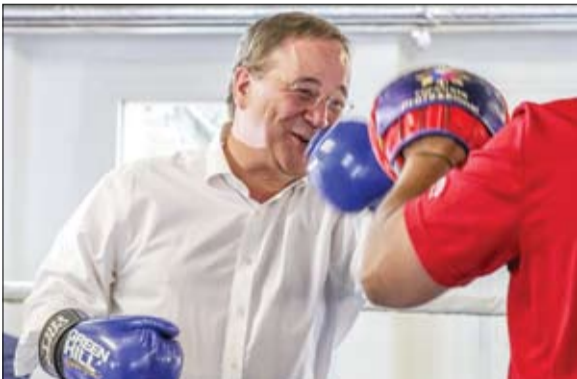
وضع القفازات لا يعطي لاشيت لقب ملاكم

أعلنت خلية الإعلام الأمني العراقية، أمس، إحباط ما وصفتها بأنها محاولة إرهابية كانت تستهدف تجمعات للمواطنين في العاصمة بغداد، كما أعلنت القبض على خلية لداعش مسؤولة عن استهداف أبراج الطاقة في محافظة ديالى.