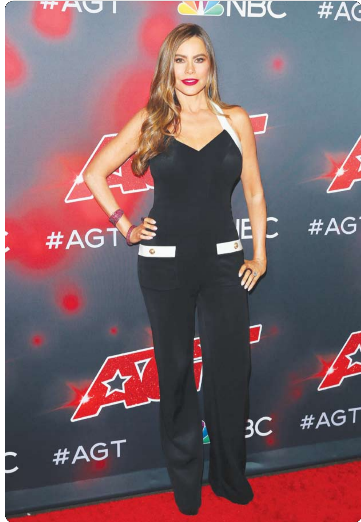
الممثلة الكولومبية الأمريكية صوفيا فيرغارا تصل لحضور عرض «مواهب أمريكية» في مسرح دولبي في هوليوود.

أطلق أساتذة متقاعد في جامعة بريغهام يونغ الأمريكية الممولة من كنيسة المورمون، عريضة تطالب بإلغاء قانون داخلي يفرض على الطلاب والموظفين أن يكونوا حليقي اللحي بالكامل. ويعود منع إطلاق اللحي في حرم الجامعة الواقعة في ولاية يوتا الأمريكية إلى ستينات القرن العشرين حين كانت اللحية والشعر الطويل مرتبطين بحركة الهيبيز وبمفاهيم ثقافية لا تتناسب مع قيم طائفة المورمون واسمها الرسمي "كنيسة يسوع المسيح لقديسي الأيام الأخيرة". ولا تزال قواعد المظهر في جامعة بريغهام يونغ تحمل آثارا من تلك الحقبة وهي تفرض أن يكون "الرجال حليقي الذقن مع منع اللحي". أما على صعيد شعر الوجه، فيسمح فقط بتطويله على الجانب شرط ألا ينزل تحت مستوى ضمة الأذن، كما يُسمح بالشارب بشرط أن يكون "مشدبا بصورة جيدة ولا يتخطى طرية الفم". وحاول طلاب على مر السنوات تحدي هذه القيود، لكنهم لم يفلحوا في مسعاهم ما عدا بعض الاستثناءات الممنوحة لطلاب دينية، للطلاب المسلمين على سبيل المثال، أو لدواعٍ طبية. ويعتبر الأساتذة الضخري في الجامعة وورنر وودوورث أن الوقت حان لإلغاء هذه القواعد، وهو أطلق عريضة للمطالبة بسياسة "أكثر أخلاقية وإنسانية تسمح بإطلاق اللحي في الحرم الجامعي، على غرار ملايين الرجال حول العالم، سواء انتموا أم لا إلى كنيسة المورمون.