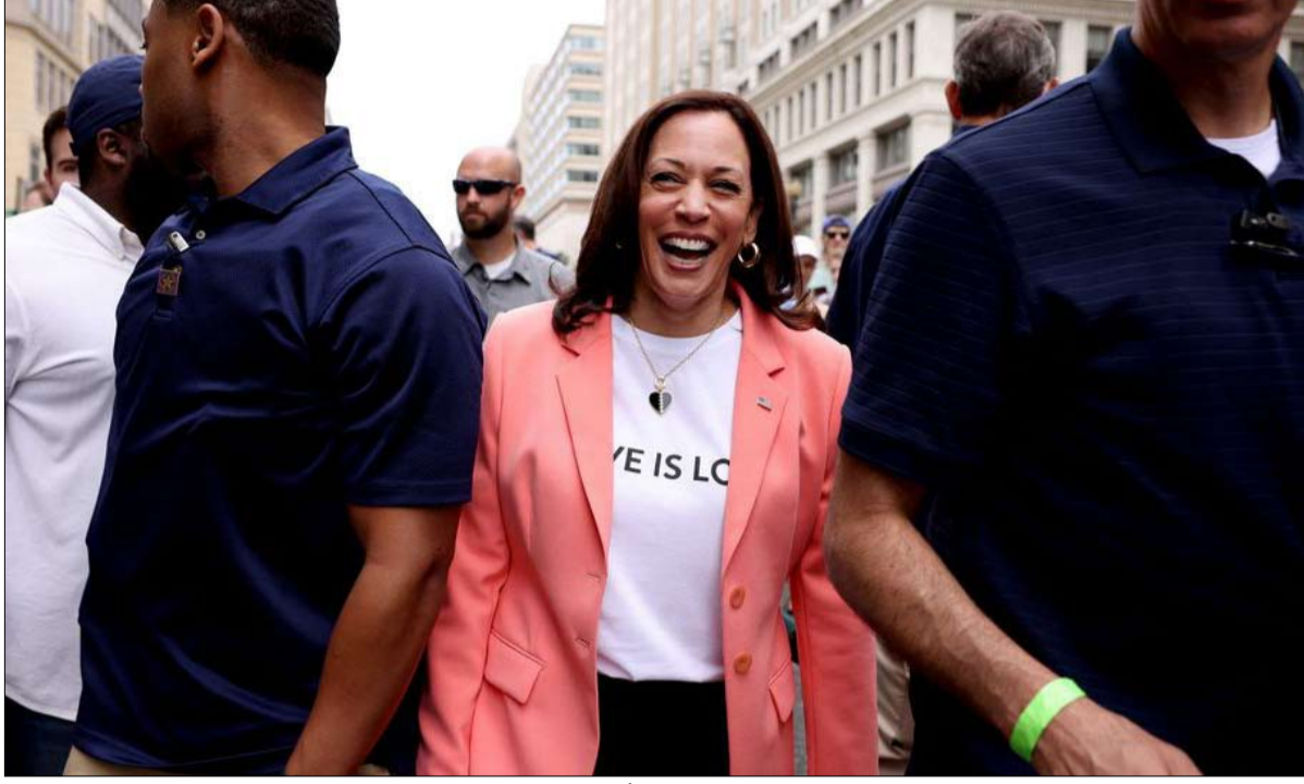
تعيين كامالا هاريس يؤكد أن الأبواب مفتوحة أمام الهنود