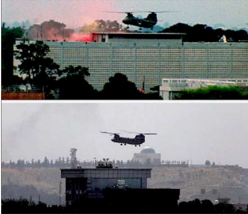
صورتان وحقتان لنتيجة واحدة