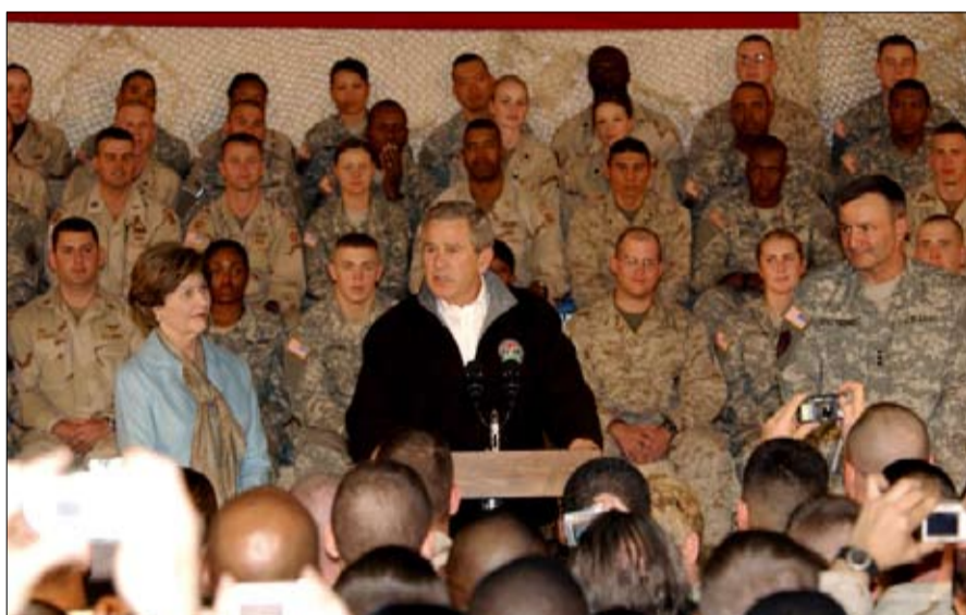
بوش في أفغانستان خطأ الفطرسة