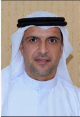
التاسع عشر من شهر أغسطس من كل عام باليوم العالمي للعمل الإنساني، يجب أن يوجه لخير الانسان في كل مكان في كل المجالات

التنموية والإغاثية. وأضاف الخوري ان العمل الإنساني يمثل أهمية كبيرة خصوصاً في ظل ما يشهده العالم في الوقت الحاضر من تحد كبير لمواجهة فيروس كورونا، الأمر الذي يتطلب المزيد من التعاون والتسهيلات وتقديم المساعدات والرعاية الطبية للمحتاجين حول العالم. وأشار الخوري الى ان مفهوم العمل الإنساني في دولة الامارات يلقى اهتماماً رسمياً وشعبياً كبيراً على مستوى القيادة وعلى مختلف المستويات الحكومية والمؤسسات الإنسانية والخيرية العاملة في الدولة.