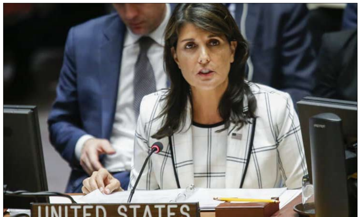
نيكي هالي في السباق للرئاسة