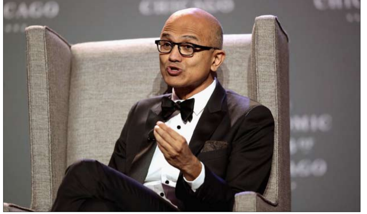
ساتيا ناديللا مدير شركة مايكروسوفت

في السنوات القادمة، سيلعبون دورًا حاسمًا في الولايات الرئيسية، يتابع نيل مخيجا، مدير إمبات، في جورجيا، يبلغ عددهم 100 الف، وفي تكساس 500 الف، ويفضل مجتمعنا سيتمكن الديمقراطيون يوماً ما من دفع هذه الولايات إلى معسكرهم..