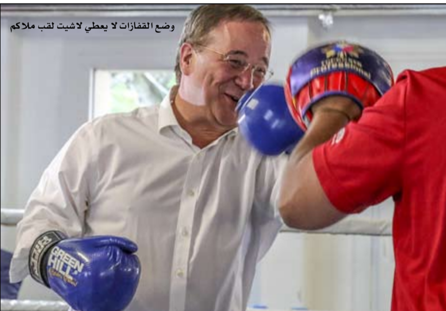
وضع القفازات لا يعطي لاشيت لقب ملاكم