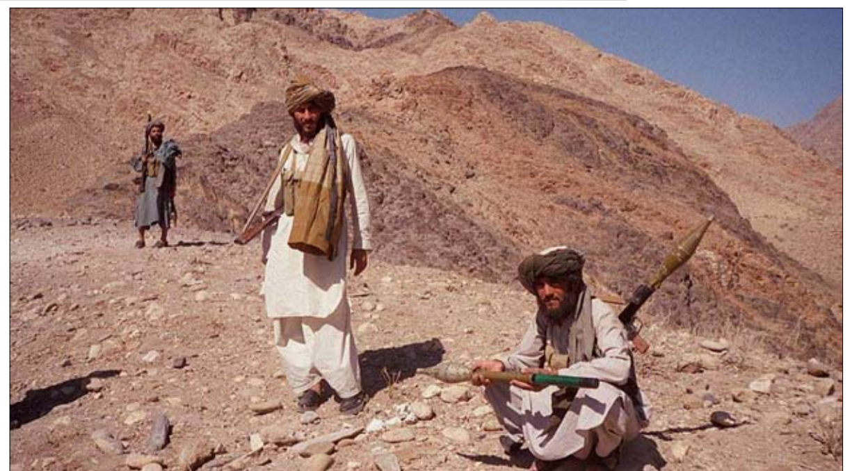
مقاتلو طالبان على تل بالقرب من جلال آباد، 14 أكتوبر 2001