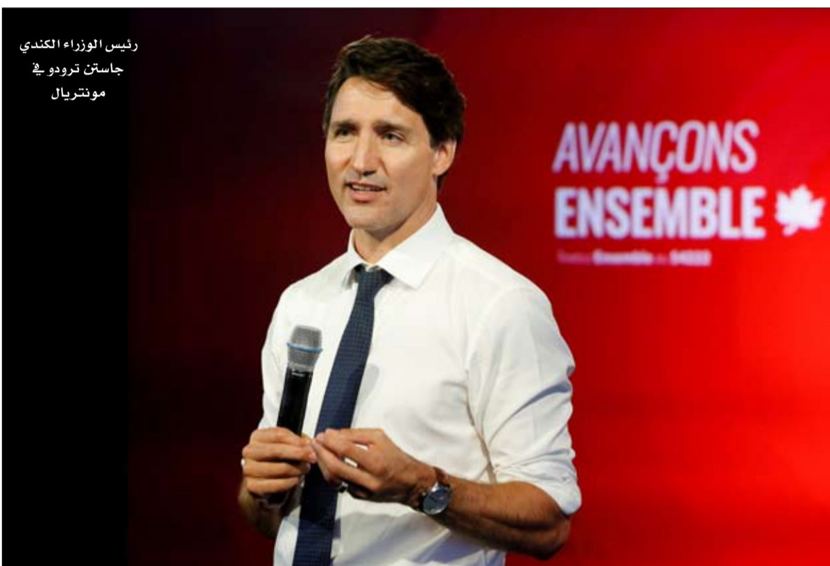
رئيس الوزراء الكندي جاستن ترودو في مونتريال

حزب المحافظين تم اختلافه من قبل اليمين الديني الترامبي. جاستن ترودو، الذي حوّل كندا إلى دولة ما بعد التسمية بنزغته الطائفية، أصبح هو نفسه ما بعد السياسي.