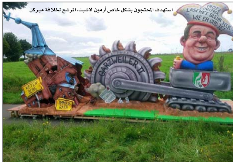
استهداف المحتجون بشكل خاص أرمن لاشيت، المرشح لخلافة ميركل