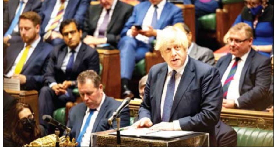
رئيس الوزراء البريطاني خلال مناقشة في البرلمان حول ما حدث في أفغانستان

أظهرت فيديوهات مروعة، إطلاق النار من قبل مقاتلي حركة طالبان، وسط مجموعة من المتظاهرين، مما أدى لسقوط قتلى بين المواطنين، في أولى أيام المواجهة. وأظهرت فيديوهات انتشرت على وسائل التواصل الاجتماعي، تظاهر عدد من الأفغان في مدينة جلال آباد، ورفضهم العلم الأفغاني. وبعدها سمع صوت إطلاق نار كثيف، وظهر عدد من مقاتلي طالبان وهم يفرقون الحشد بإطلاق النار. وأشارت مصادر عدة، بالإضافة لشهود عيان، إلى وقوع 3 ضحايا على الأقل حتى الآن، خلال المواجهات بين المواطنين ومقاتلي طالبان. ومن ناحيته، قال مسؤول أمني في حلف شمال الأطلسي، إن 17 شخصا أصيبوا، الأربعاء، في تدافع عند إحدى بوابات مطار العاصمة الأفغانية كابل، مع تكثيف الدول الغربية عمليات إجلاء دبلوماسيها وآخرين من هناك.