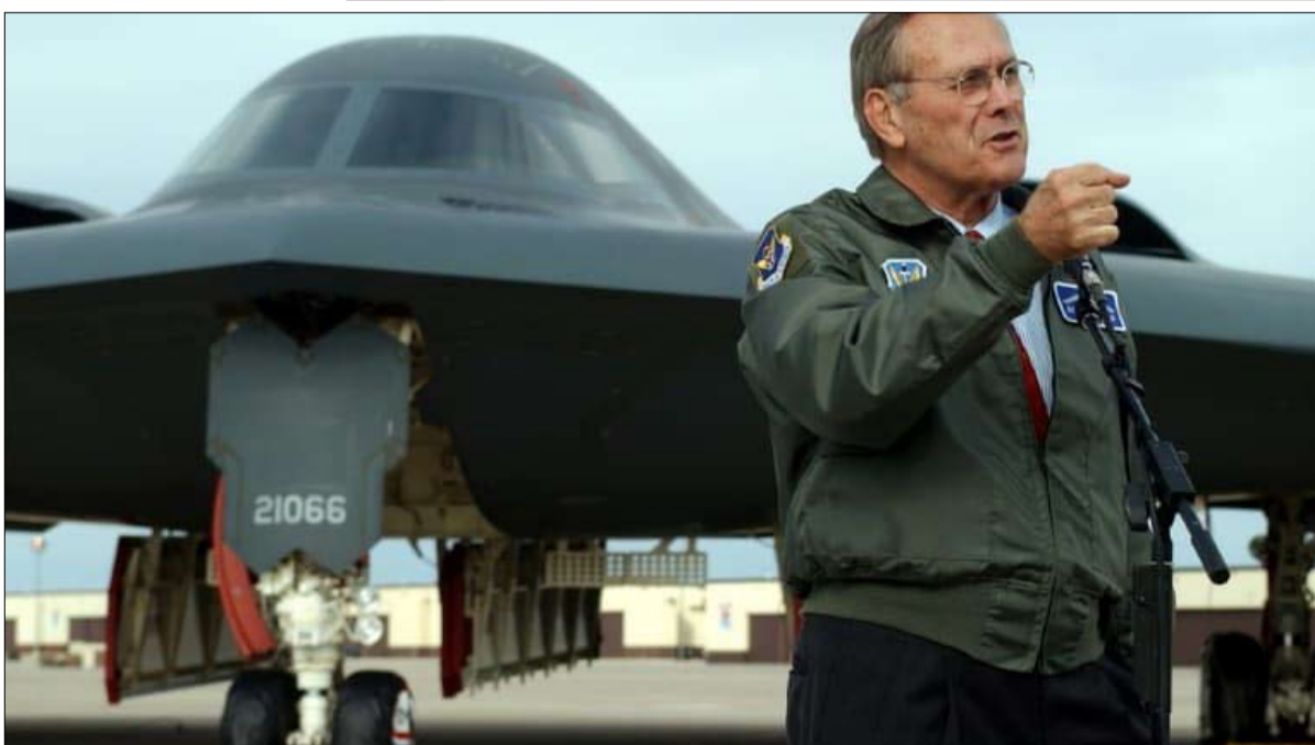
رامسفيلد لم تكن تعرف من هو عدونا