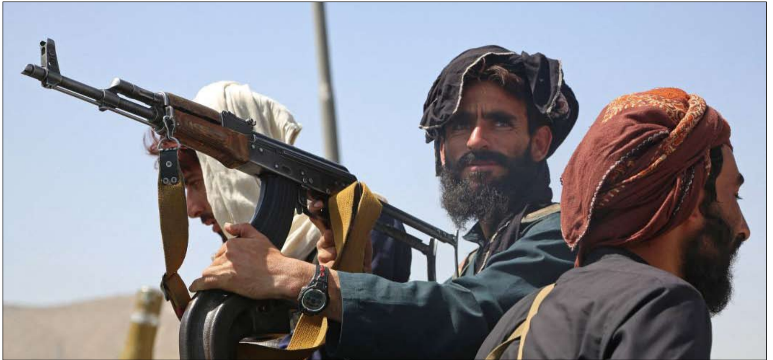
استعاد طالبان أفغانستان بدخولها العاصمة في 15 أغسطس 2021