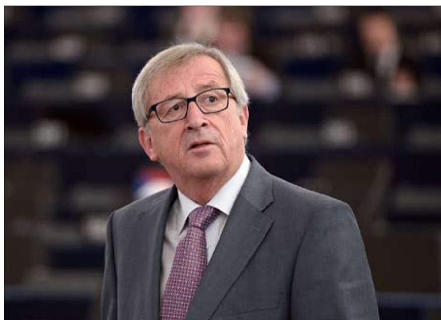
يونكر يضمن سقوط بوريس جونسون

الدعم الأنجلو أمريكي لروما سيخفف بالتأكيد الهوى الروسي لسالفيني، والهوى الصيني لدي مايو