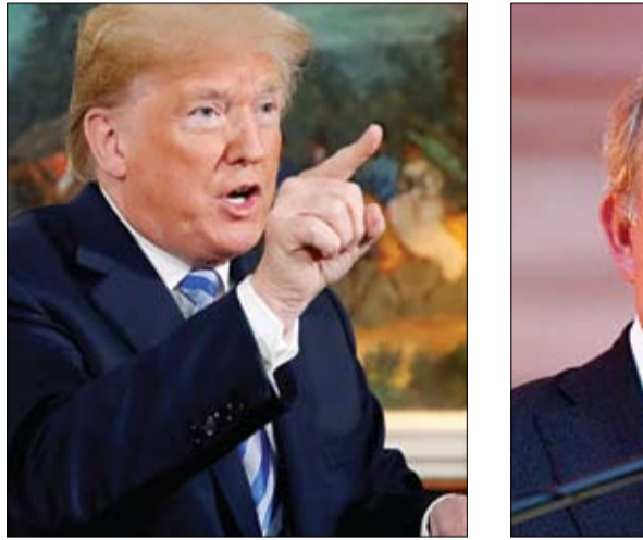
الرئيس الأمريكي دونالد ترامب

استهدفة الأعيان المدنية. وقال العقيد الركن تركي المالكي المتحدث الرسمي باسم قوات التحالف - في تصريح بثته وكالة الأنباء السعودية "واس" - إن الأداة الإجرامية الإرهابية الحوثية مستمرة في إطلاق الطائرات بدون طيار لتنفيذ الأعمال العدائية والإرهابية باستهداف المدنيين والمنشآت المدنية، ولم يتم تحقيق أي من أهدافها ويتم تدميرها وإسقاطها، مؤكداً استمرار تنفيذ الإجراءات الرادعة ضد هذه المليشيا الإرهابية وتحييد القوات الحوثية ويكل صرامة، وبما يتوافق مع القانون الدولي الإنساني وقواعده العرفية. إلى ذلك، أصدرت مليشيات الحوثي الانقلابية، الثلاثاء، أحكاماً بإعدام 30 مختطفاً مشمولين باتفاق تبادل الأسرى. وأكدت مصادر حقوقية أن الأحكام صدرت عن المحكمة التابعة لمليشيا الحوثي هو حكم متعمد قانوناً كونه صادراً عن محكمة صادرة عن مجلس القضاء العاصمة اليمنية صنعاء، وذلك