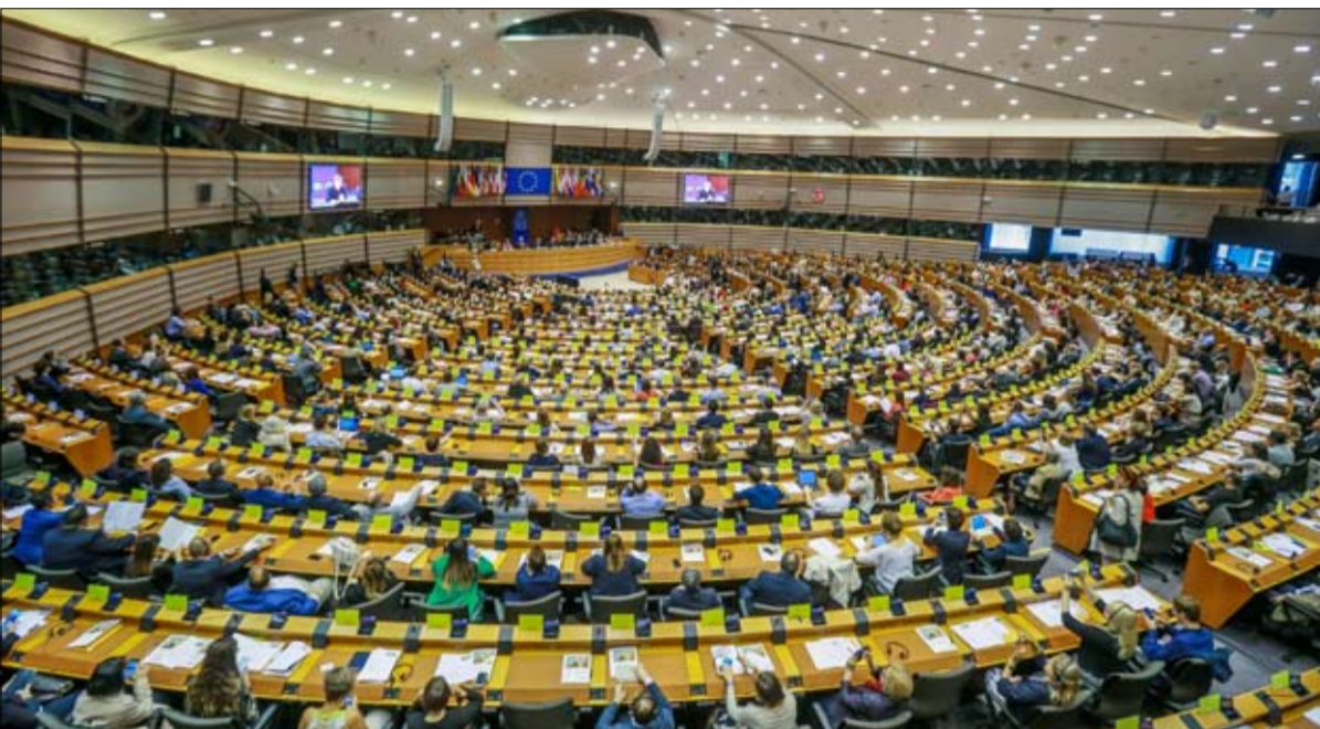
المشروع الأوروبي في خطر