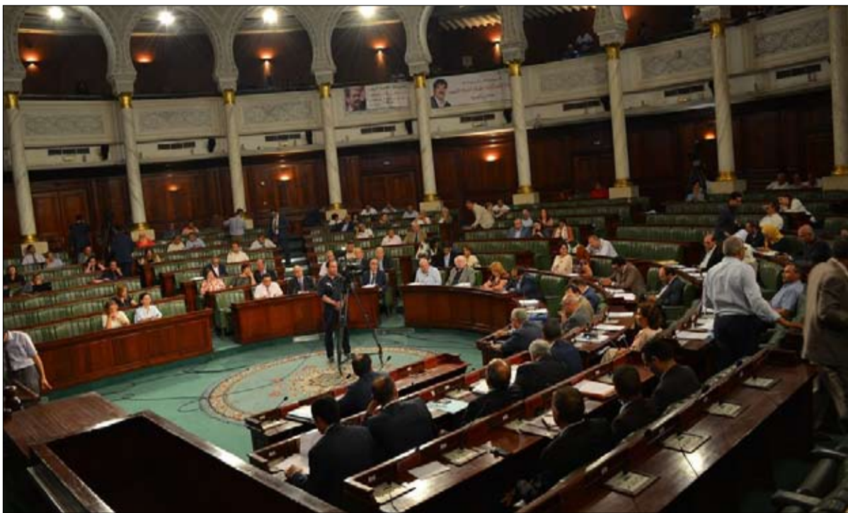
رفض طعن نواب في تنقيح قانون الانتخابات