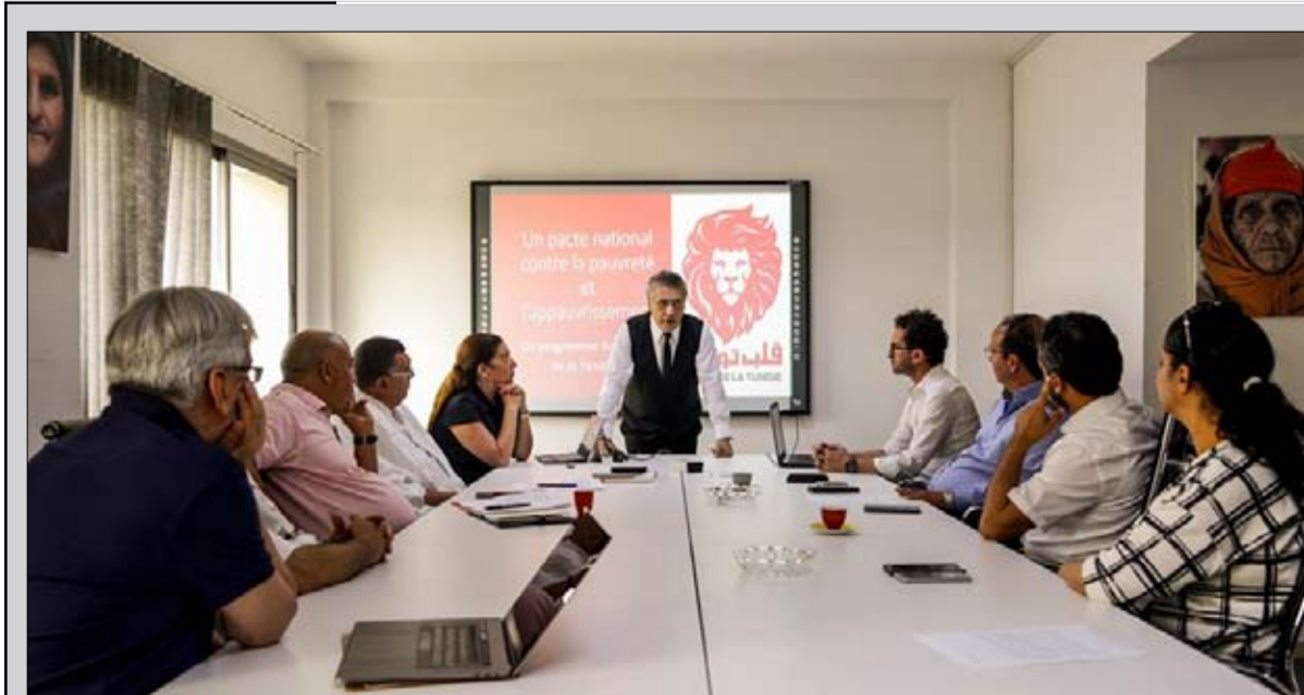
المكتب السياسي لقلب تونس يدين

ثلاثة سيناريوهات وسيحال القانون على الرئيس التونسي الذي يمنحه الدستور صلاحيات ختمه وإحالته على رئاسة الحكومة لنشره في الرائد الرسمي للجمهورية التونسية ليصبح نافذا، أو الرد عليه وإعادةه إلى مجلس نواب الشعب للتداول فيه، مع ضرورة التعليل. ويرى مختصون انه ستكون أمام الرئيس قائد السبسي 3 سيناريوهات: الأول الختم عليه ونشره في الرائد الرسمي في غضون 4 ايام من تاريخ إصدار الهيئة والسيناريو الثاني استعمال حق الرد (النقض) في غضون 5 ايام من إصدار القرار وبالتالي يعود للبرلمان للتصويت عليه من قبل النواب، وهنا يجب ان يصوت عليه 132 نائبا للمصادقة على التعديلات من جديد. أما السيناريو الثالث، حسب بعض القراءات، فيحدده الفصل