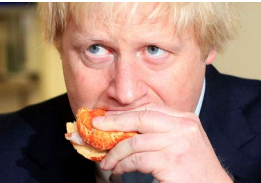
صعود بوريس جونسون يزعج بروكسل

لا تنظر باريس وبرلين إلى الحكومة الإيطالية كند لهما رغم أن إيطاليا عضو مؤسس