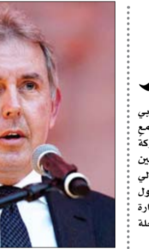
السفير البريطاني لدى واشنطن