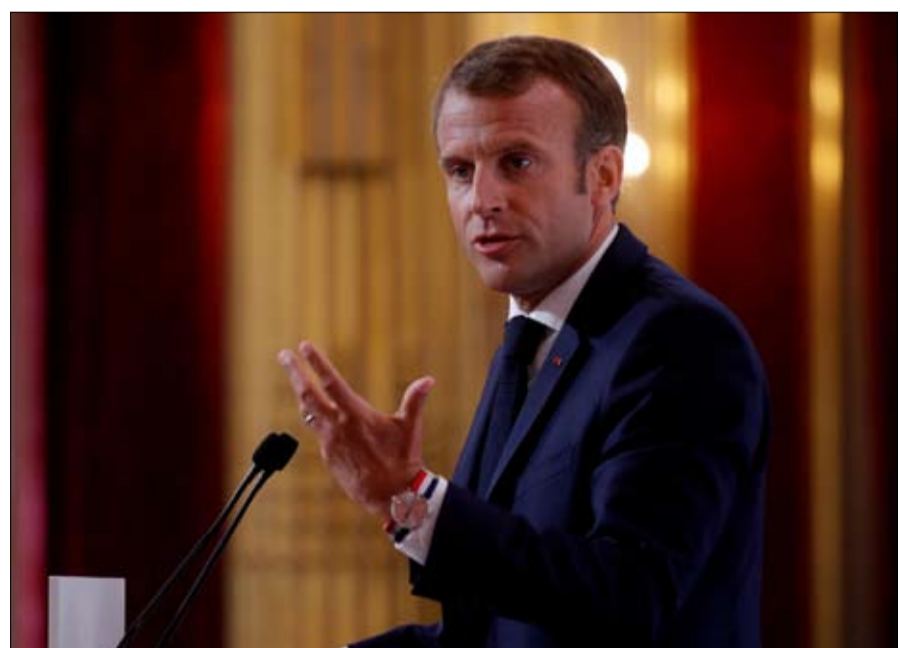
ماكرون.. الاستقطاب يزداد حدة

لم يتحقق السيناريو الكارثي بوصول الشعبويين إلى السلطة، فحياة الإيطاليين تستمر بل تتحسن