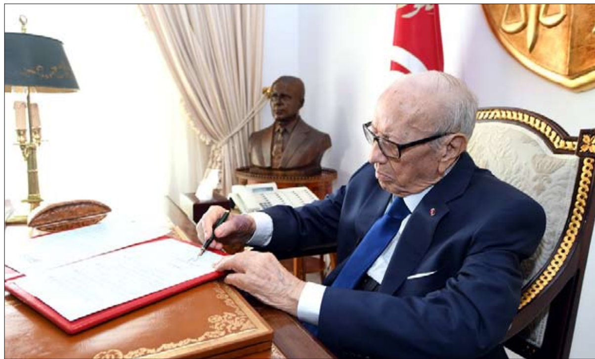
في انتظار ختم السبسي