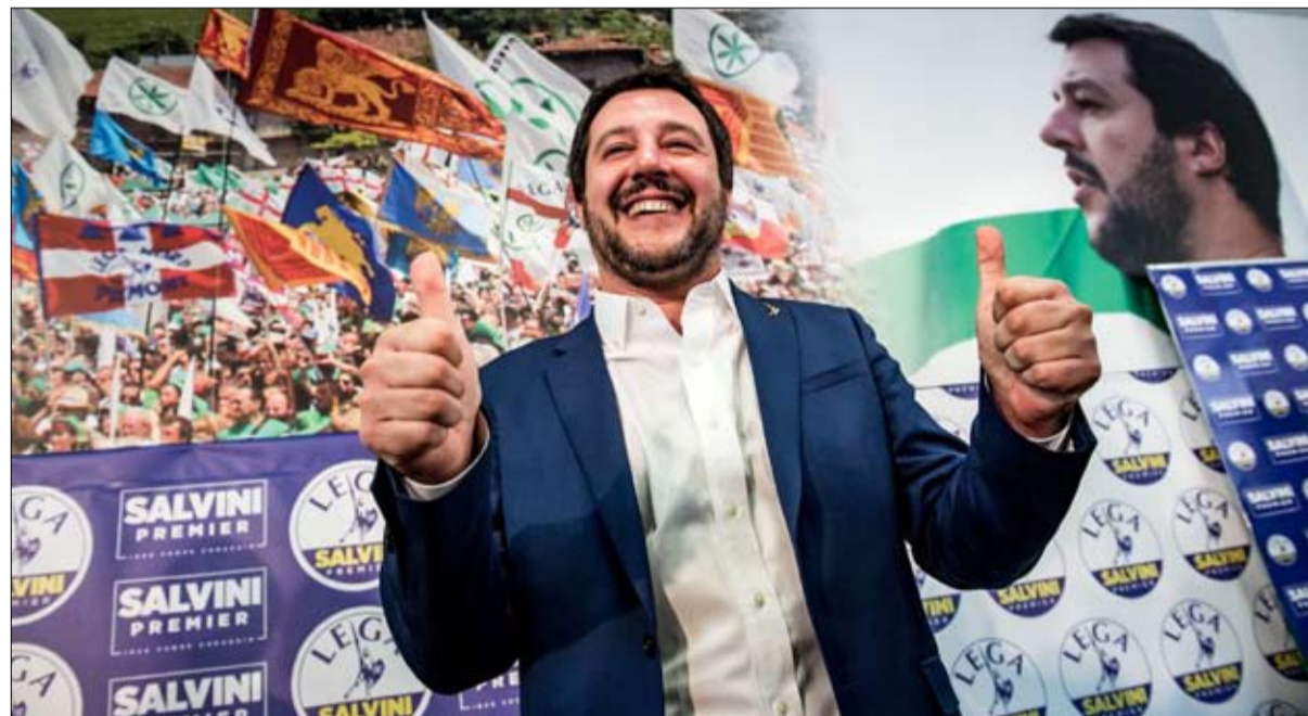
ماتيو سالفيني تهديد جدي للمشروع الأوروبي

أغلبية معادية للاتحاد الأوروبي في البلدين: