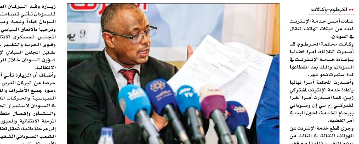
محام سوداني يعرض في مؤتمر صحفي قرار قطع خدمة الانترنت والدعوى التي قدمها لاعادة الخدمة

الحرية والتغيير في السودان. جاء ذلك خلال لقاء عقده حميدتي مع الدكتور مشعل بن فهم السلمي رئيس البرلمان العربي وأعضاء وفد البرلمان العربي، الذي يمثل عدداً من المجالس والبرلمانات العربية في الخرطوم. وأطلع حميدتي رئيس البرلمان العربي ووفد البرلمان بتطورات الأوضاع في السودان، مؤكداً التزام المجلس العسكري الانتقالي بالاتفاق الموقع بين المجلس وقوى إعلان الحرية والتغيير. كما ضمن حميدتي وقوفه وتضامنه مع البرلمان العربي مع السودان في المرحلة الدقيقة التي يمر بها ودعمه لتطلعات الشعب السوداني. من جهته، أكد السلمي أن