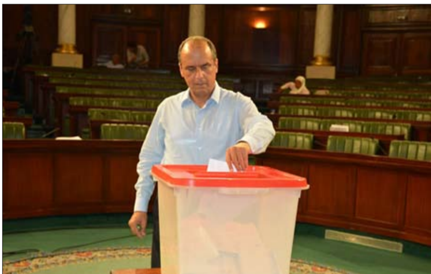
محمد الفاضل بن عمران.. مفاجئ ومتشدد

يتمكن رئيس الجمهورية من تعديل المسار القانوني الذي وصفه بالجائر في حق أكثر من 50 بالمائة من الناخبين في الانتخابات القادمة. من جانبه قال النائب عن حركة الشعب زهير المغزاوي، صاحب مبادرة عرضة الطعن في القانون الانتخابي، إن النواب الذين تقدموا بالطعن كانوا على اقتناع تام بأن هذا القانون إقصائي ولا دستوري وجاء نتيجة لإرادة أغلبية داخل البرلمان تريد تغيير قوانين اللعبة الانتخابية قبيل الانتخابات. وأكد احترام القرار القضائي الصادر عن الهيئة رغم عدم الاطلاع على التعليل المصاحب له والأسباب التي جعلتها ترفض الطعن المقدم من قبل 51 نائبا . من جهة أخرى لفت إلى أن عمل هيئة الانتخابات سيشهد إرباكا لوجود شروط وقوانين جديدة للترشح لا بدّ للهيئة أن تعمل عليها، معبرا عن عدم اطمئنائه للمسار الانتخابي الذي سيشهده البلاد خاصة أنّ هيئة الانتخابات نفسها قد عبرت عن الصعوبات التي ستعرضها إذا ما تمّ رفض الطعون المقدمة. وأعرب المغزاوي عن أمله في أن يكون القرار الصادر عن الهيئة الوقتية مستقلا ومستمداً من الدستور دون أن تكون هناك ضغوط قد مورست على الهيئة، مشيرا في الآن نفسه إلى أن كلّ البوادر تؤكد أنّ رئيس الجمهورية