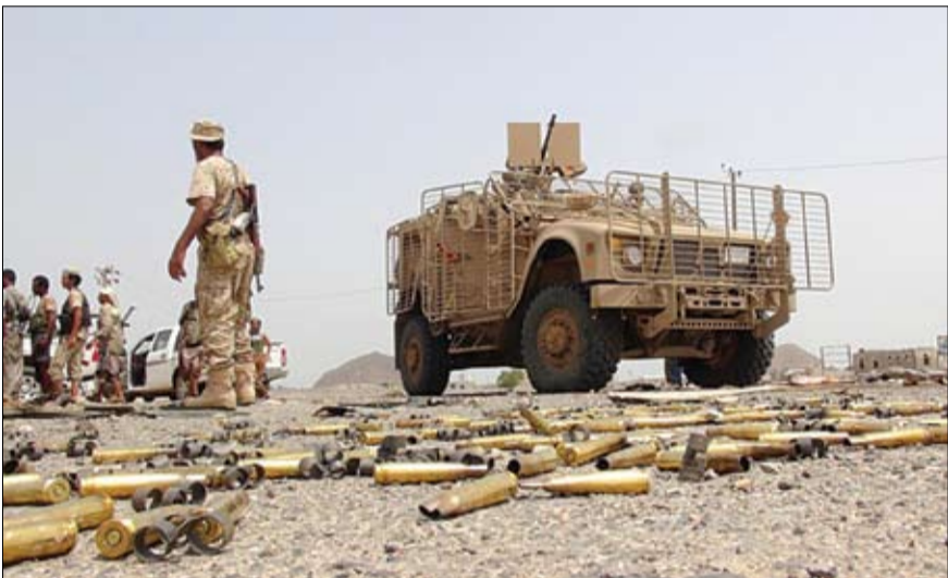
قوات الجيش الوطني اليمني تواصل تحقيق تقدم على عدة محاور في صعدة

الأخيرة التي حجزت فيها القضية للحكم، وهي الجلسة التي أرغمت فيها المحكمة هيئة الدفاع بالرد على "تقرير العمل الجنائي" الذي قدم مكتوباً في خمس أوراق. وذكرت منظمة "سام"، أن الأحكام الصادرة عن محاكم مليشيا الحوثي هي أحكام لا قيمة لها، بل إنها تشكل جنائيات في سجل أصحابها من متحلي الصفات الرسمية للقضاة وأعضاء ورؤساء النيابة وغيرهم من الجناة. وكانت منظمات حقوقية دولية، حذرت في وقت سابق من مغبة استمرار المحاكم التابعة لمليشيا الحوثي بإصدار أحكام إعدام بحق معارضين سياسيين، دون أدنى اعتبار لشروط المحاكمة العادلة. واتهم بيان مشترك للمرصد الأورومتوسطي لحقوق الإنسان ومنظمة "سام"، للحقوق والحريات ومنظمة "إفدي"، الدولية، جماعة الحوثي بتحويل المنظومة القضائية في المناطق التي تسيطر عليها إلى أداة سياسية، لتصفية الحسابات مع خصومها السياسيين.