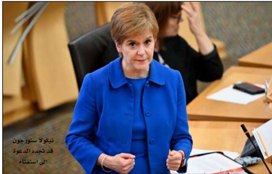
نيكولا ستورجون قد تجدد الدعوة إلى استفتاء

أكثر تجاه السبعة والعشرين من أجل تجنب عدم الاتفاق. وقد أعطى استطلاع للرأي نشرته صحيفة «الاسكتلندي» يوم الجمعة الماضي أصنار اسكتلندا المستقلة الصدارة «52 بالمائة مقابل 38 بالمائة»، مؤكداً توجهها أساسياً. وقبل أقل من خمسة أشهر من تجديد البرلمان الاسكتلندي، فإن