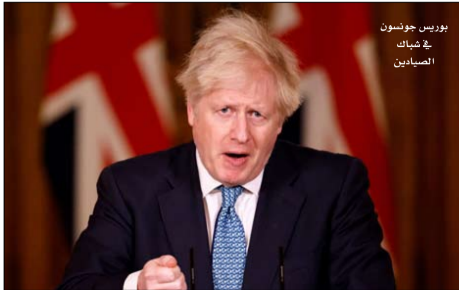
بوريس جونسون في شبك الصيادين

إن احتمال الخروج دون اتفاق من الاتحاد الأوروبي في 31 ديسمبر لا يخيف اتحاد صيادي الأسماك البيضاء وأعضائه البالغ عددهم 1400. ويفضل رئيس الجمعية الإسكتلندية لمنتجي الأسماك البيضاء، التي تقول أنها «أكبر نقابة للصيادين في أوروبا»، أن تنتهي المفاوضات بين لندن والاتحاد الأوروبي بصفقة، لكن مايك بارك مقتنع بأن صيادي أسماك القند والحدوق والبياض، سيستمرون في النمو حتى دون اتفاق. وقال هذا الأسبوع «لستنا خائفين لأننا نعتقد أنه يمكننا التفاوض مع جيراننا للوصول إلى مناطق الصيد والحصص على أساس القواعد الدولية». وتكمن مشكلة بوريس جونسون في أن ما ينطبق على صيادي الأسماك البيضاء الإسكتلنديين لا ينطبق، على وجه الخصوص، على مزارعي السلمون. «يجب على بوريس جونسون أن يقرر ما إذا كان يقف إلى جانب المؤسسات أو السياسة»، قال متزججا تافيش سكوت، رئيس منظمة منتجي السلمون.