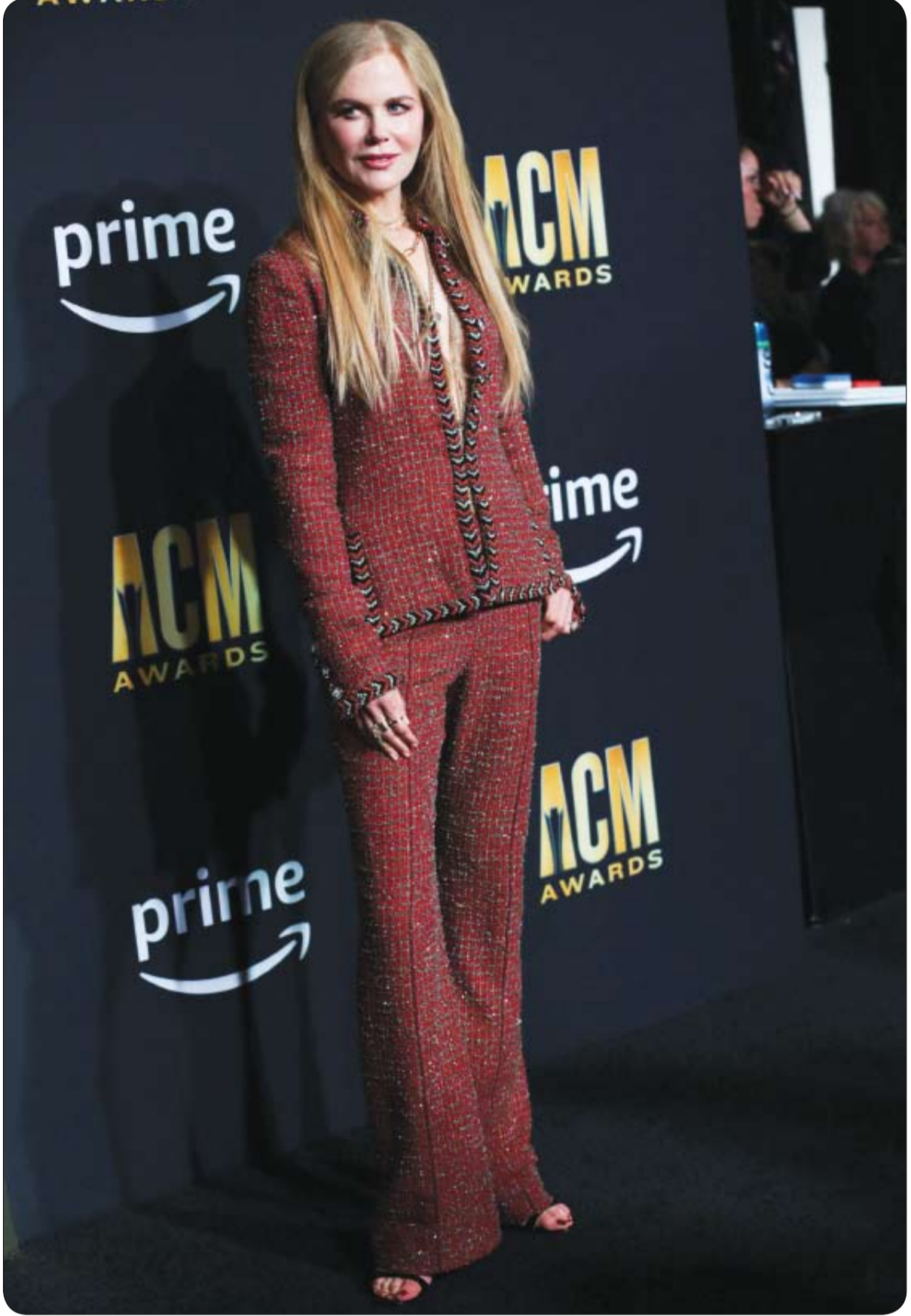
نيكول كيدمان لدى حضورها حفل توزيع جوائز الأكاديمية لموسيقى الريفي في فريسكو، تكساس.

أعلنت وزارة الآثار المصرية، أنه لأول مرة تم الكشف عن أكبر وأكمل ورشتين للتحنيط من العهد الفرعوني إحداهما أدمية والأخرى حيوانية، وذلك في منطقة سفارة بالجيزة جنوبي القاهرة. واتفق مسؤول وزارة الآثار وأستاذ متخصص بجامعة القاهرة في حديثهما لوقع "سكاي نيوز عربية" على أن هذا الكنز الأثري الجديد يكشف بوضوح جانباً من أسرار المصري القديم، يتعلق بالاقتصاد الذي اعتمد عليه، وأنه كانت هناك أركان دولة متكاملة وصناعة التحنيط لم تكن تتم صدفة أو بعشوائية بل كانت لها أسس وقواعد، هذا الجزء من الاقتصاد يمكن وصفه بـ"اقتصاد الجبانة". وكشفت وزارة الآثار المصرية في مؤتمر صحفي عالمي أن الكنز المكتشف يضم إلى جانب ورشتي التحنيط، مقبرتين وعددا من اللقى الأثرية، وأن الكثف جاء خلال استكمال أعمال الحفائر بجبانة الحيوانات المقدسة (البواباسطيون) بمنطقة آثار سقارة، للعام السادس على التوالي. وحسب ما أعلنت الوزارة، فإن الورشتين المكتشفتين تعودان لأواخر عصر الأسرة الـ30 وبداية العصر البطلمي، كما تم الكشف عن مقبرتين من عصر الدولتين القديمة والحديثة، بالإضافة إلى عدد من اللقى الأثرية. ورشة التحنيط الأدمية التي تم الكشف عنها، عبارة عن مبنى مستطيل الشكل من الطوب اللبن مقسم من الداخل إلى عدد من الحجرات تحتوي على سريرين للتحنيط الأدمي وتتراوح أبعاد السريين حوالي مترين طول ومتر عرض و50 سم ارتفاع، وهو مكون من عدة كتل حجرية مغطى من الأعلى بطبقة من الملاط بها ميول ينتهي بميزاب.