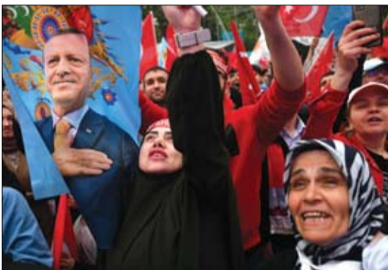
انصار أردوغان يحتفلون أمام مقر حزب العدالة والتنمية في إسطنبول

تصدر الرئيس التركي المنتهية ولايته انتخابات الرئاسة في الجولة الثانية بأكثر من 50% وأعلن رجب طيب أردوغان فوزه في الانتخابات قائلا: فزت في جولة الإعادة بدعم الشعب وأشكره على التصويت مضيفا أن الشعب حملنا مسؤولية الحكم لخمس سنوات مقبلة. وقال من على سطح حافلة متوقفة أمام مقر إقامته في إسطنبول وسط حشد من أنصاره: عهدت إلينا أمتنا مسؤولية حكم البلاد للسنوات الخمس المقبلة. وقال أردوغان أن الفائز الوحيد في الانتخابات هو تركيا.