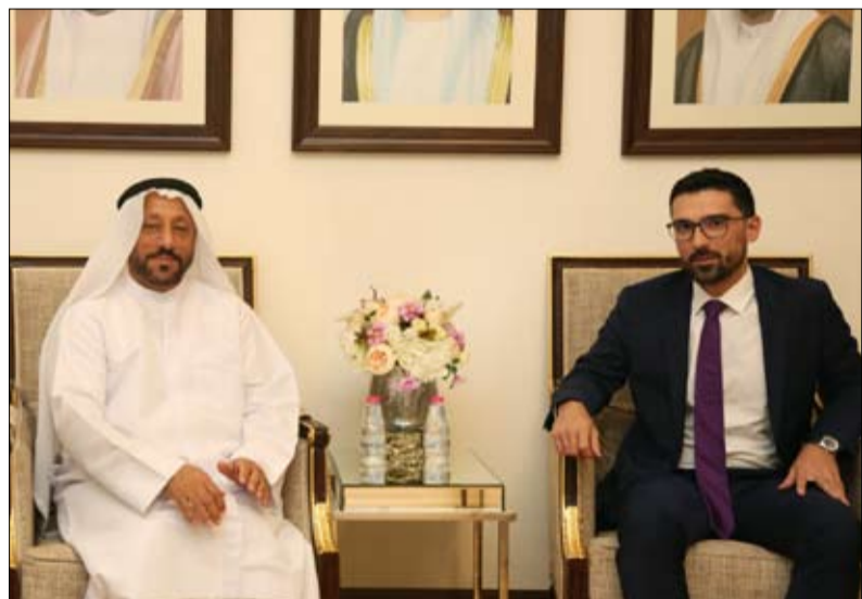
خلال استقبال وفد دبلوماسي