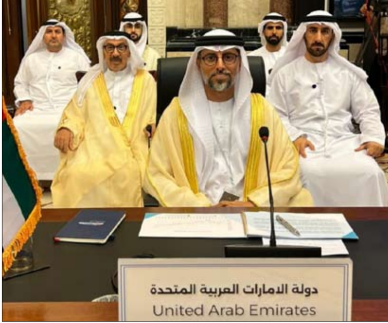
دولة الإمارات العربية المتحدة United Arab Emirates