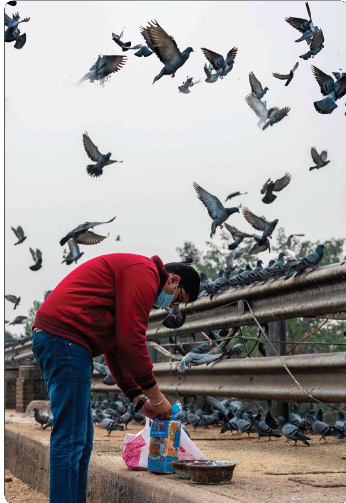
رجل يطعم سرباً من الحمام على جسر في نيودلهي.

بعدما جندت طاقات كبيرة إشر تلقي بلاغ من إحدى المنتزهات عن إمكان العثور على بقايا بشرية في شمال شرق إنكلترا، خلصت الشرطة البريطانية إلى أن الجسم المشبوه ليس سوى... حبة بطاطس. فقد أوفدت الشرطة فريقاً من الخبراء والكلاب البوليسية لتمشيط حقل محول قرب قرية وينالتون حيث ظنت امرأة تنتزه مع كلبها أنها عثرت على بقايا بشرية وأرسلت حتى إلى قوات الأمن صورا لما ظنت أنها قدم إنسان. وأوضحت شرطة نورمبريا أنها اكتشفت بعد تفتيش المكان "أن إصبع القدم ليس سوى حبة بطاطس مع فطر نابت بجانبه".