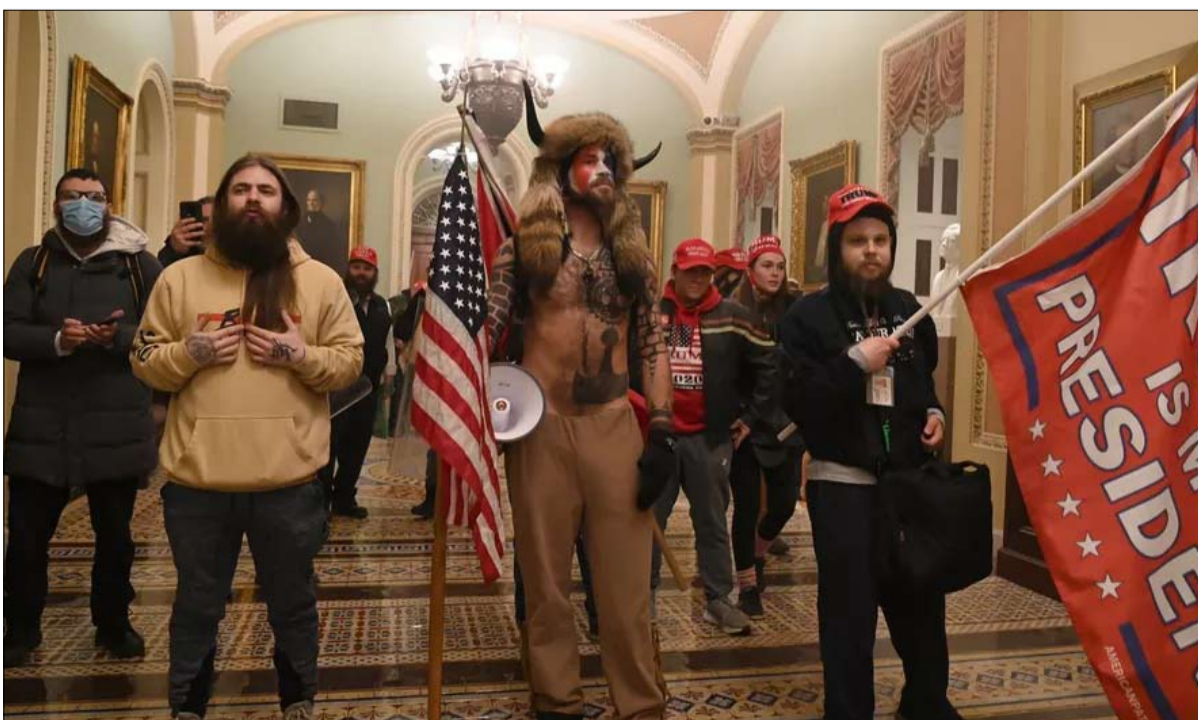
جيك أنجيلي في كل المظاهرات