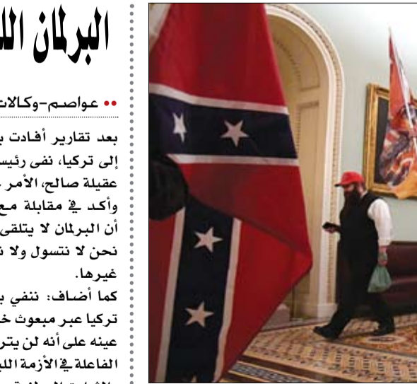
تشجيع على الفتنة أدى إلى الفوضى