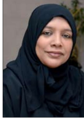
الدكتورة خولة عبد الرحمن الملا

وأوضحت سعادتها أن الخطة الاستراتيجية الجديدة ركزت على تحقيق التكامل بين مختلف إدارات المجلس في كافة عمليات التخطيط والتنفيذ وتطوير الأداء، فضلا عن تعزيز الثقافة الاستراتيجيية والتغيرات الاستراتيجية من خلال تحقيق أربعة غايات استراتيجية تناولت الوصول إلى أسرة مستقرة ممكنة وفاقلة في المجتمع، وتبني سياسات العمل المبتكرة للارتقاء بالأسرة، وتحقيق أداء موابك للممارسات