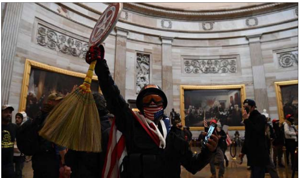
انصار ترامب من شتى الاشكال والالوان