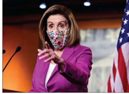
نانسى بيلوسى تطالب بعزل الرئيس ترامب

اعتبر الرئيس الأمريكي المنتخب جو بايدن، أن الرئيس دونالد ترامب ليس لائقاً لوظيفته، لكنه رفض مراراً تأييد دعوات الديمقراطيين المتزايدة لمساءلته مرة أخرى. وقالت رئيسة مجلس النواب نانسى بيلوسى في رسالة إلى أعضاء مجلسها إن النواب قد يتحركون في وقت مبكر من الأسبوع المقبل لمساءلة ترامب لتجريحه على حشد عنيف اجتاح مبنى الكابيتول الأمريكي، إذا لم يقدم الرئيس استقالته على الفور. كما دعت بيلوسى وزعيم مجلس الشيوخ الديمقراطي تشاك شومر نائب الرئيس مايك بنس، وأعضاء الحكومة لاستدعاء التعديل الخامس والعشرين من الدستور الأمريكي لإجبار ترامب على التنحي من منصبه، وهي عملية تجريد الرئيس من منصبه وتصيب نائب الرئيس مكانه. وخلال مخاطبته الصحفيين في مسقط رأسه، ولاية ديلاوير،