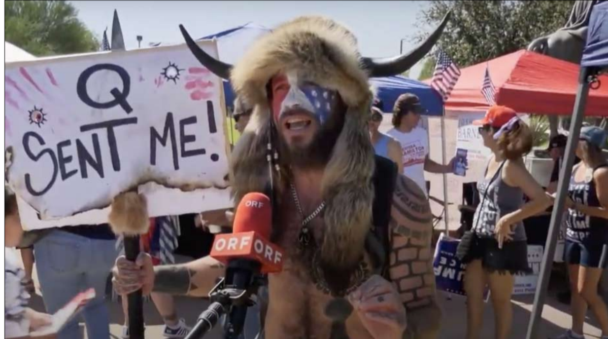
بعيدون عن الزي العسكري التقليدي

إذا كان مظهره يسلي العديد من مستخدمي الإنترنت، فإن أفكاره ليست أقل راديكالية