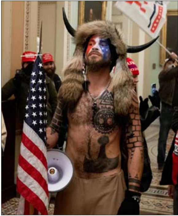
كل الطرق تؤدي إلى الشهرة