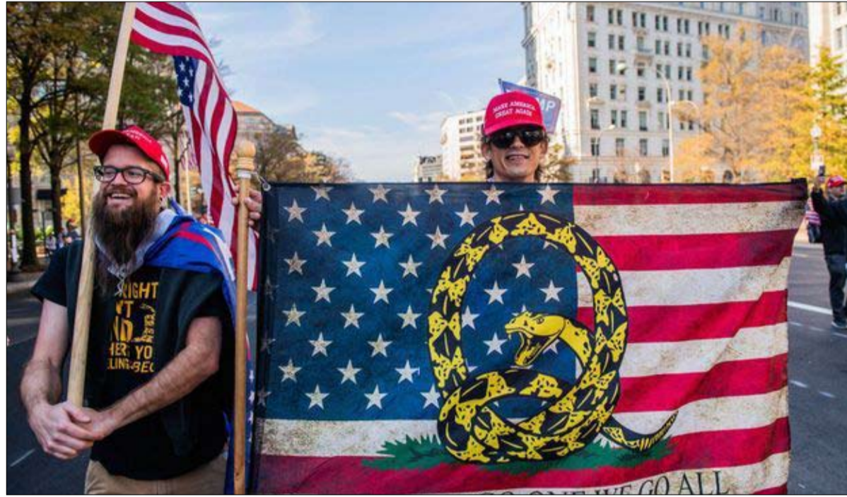
كيو انون نظرية المؤامرة في خدمة ترامب