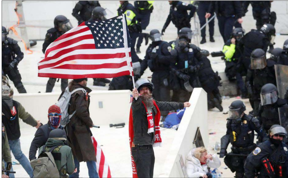
تصبيح على الفتنة أدى إلى الفوضى

ووعد بايدن بتنظيم "قمة" للديمقراطيات في السنة الأولى من ولايته لكي يظهر ان التعددية عند وانهاء الانعزالية التي سادت سنوات حكم ترامب. لكن عقد هذه القمة في واشنطن قد يكون صدها مختلفاً بعد الهجوم السدي شنه آلاف المتظاهرين المناصرين لترامب