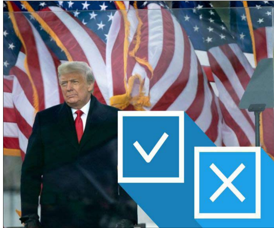
ترامب نهاية مرعبة