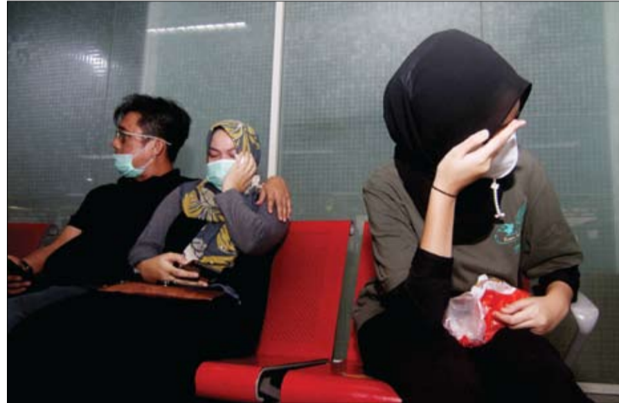
أقارب ركاب الطائرة المتكسرة في مطار سوباديو في بونتياناك في جزيرة بورنيو الإندونيسية.

وحادثة التحطم تلك ومن بعدها كارثة تحطم طائرة في إندونيسيا، تسببت في فرض غرامات على بوينغ بمقدار 2,5 مليار دولار، على خلفية اتهامات بأنها غشيت الهبات المنظمة التي كانت تشرف على الطراز ماكس 737. وتم إيقاف طلعات هذه الطائرة بعد الكارثتين الداميتين.