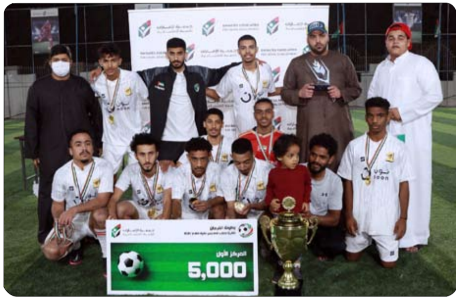
16 فريقاً من مختلف مدارس تقديم أنشطتها وبرامجها لكافة الاستراتيجي بالارتقاء بالخدمات وشرائح المجتمع وصولاً للهدف والبرامج الهادفة والتميزة.