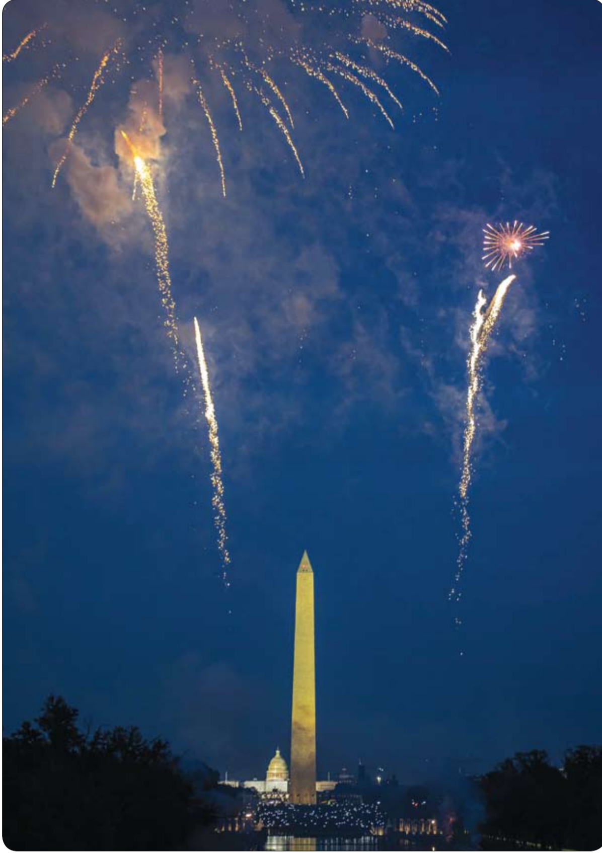
الألعاب النارية تنطلق فوق نصب واشنطن التذكاري في 4 يوليو 2022 واصطف الحشود في المركز التجاري الوطني لمشاهدة عرض الألعاب النارية السنوي للاحتفال بعيد الاستقلال.

أعلنت السلطات في هندوراس أن ستة من أفراد عصابة لقوا مصرعهم في "حادثة" وقعت في سجن يخضع لتدابير أمنية مشددة في شمال غرب البلاد، من دون أن تحدد طبيعة هذه الحادثة. وقالت وزارة الأمن في بيان إن "حادثة وقعت في سجن إيلاما (إل بوزو) في سانتا باربرا، حيث تم الإبلاغ عن مصرع ستة سجناء". وأضافت أن ملايين الحادثة ما زالت قيد التحقيق. من جهة قال بيدرو خواكين أمدور المسؤول في الحكومة عن السجون لوكالة فرانس برس إن السجناء الستة الذين قضاوا بئيمون جميعا إلى عصابة بارايو 18.