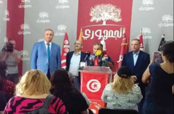
الحملة الوطنية لإسقاط الاستفتاء تقاطع

• الفجر - تونس: أعلن الحزب الدستوري الحر أنه توجه إلى هيئة الانتخابات في شخص ممثله القانوني بتبنيه أخير قبل اللجوء إلى القضاء الجزائي، تضمن مطالبة بإيقاف مسار الاستفتاء وإلغاء موعده 25 يوليو، والامتناع عن عرض النص المنشور بالرائد الرسمي من قبل قيس سعيد على الناخبين.