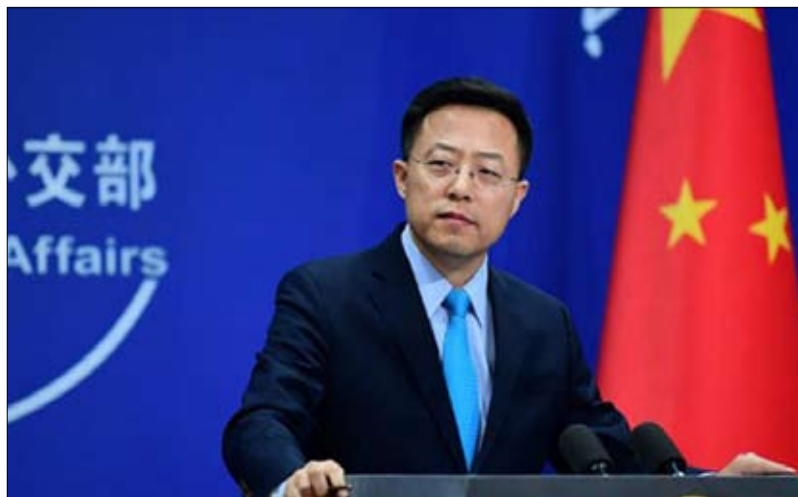
تشاو ليبيان يرد الصاع صاعين على الناطو

الرئيس الأمريكي جو بايدين في مؤتمر صحفي في اليوم الأخير من قمة الناطو في مدريد