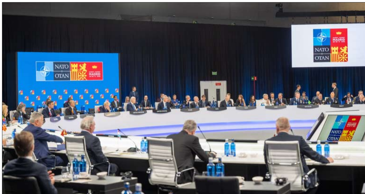
الناطو في مدريد يضم الصين الى خارطة طريقه

اجتماع قمة مدريد، أن بكين تمثل "تحدياً" لـ "مصالح" و "أمن" دول الحلف. و"طموحات الصين المعلنة وسياساتها القسرية تتحدى مصالحنا وأمننا وقيمنا". أكد الناطو في وثيقة "المفهوم الاستراتيجي"، التي لم تتم مراجعتها منذ عام 2010.