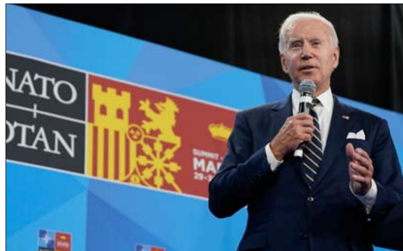
الرئيس الأمريكي جو بايدين في مؤتمر صحفي في اليوم الأخير من قمة الناطو في مدريد