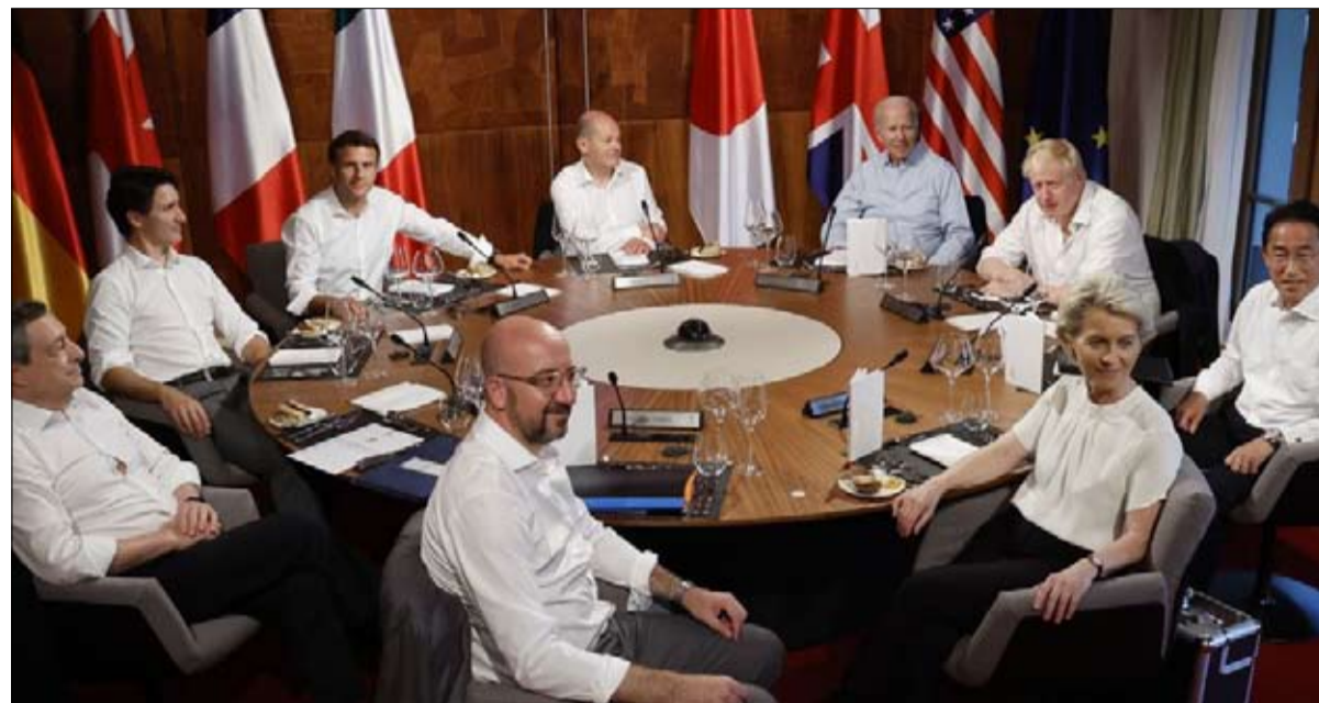
مجموعة السبع تتصدى للاستثمار الصيني