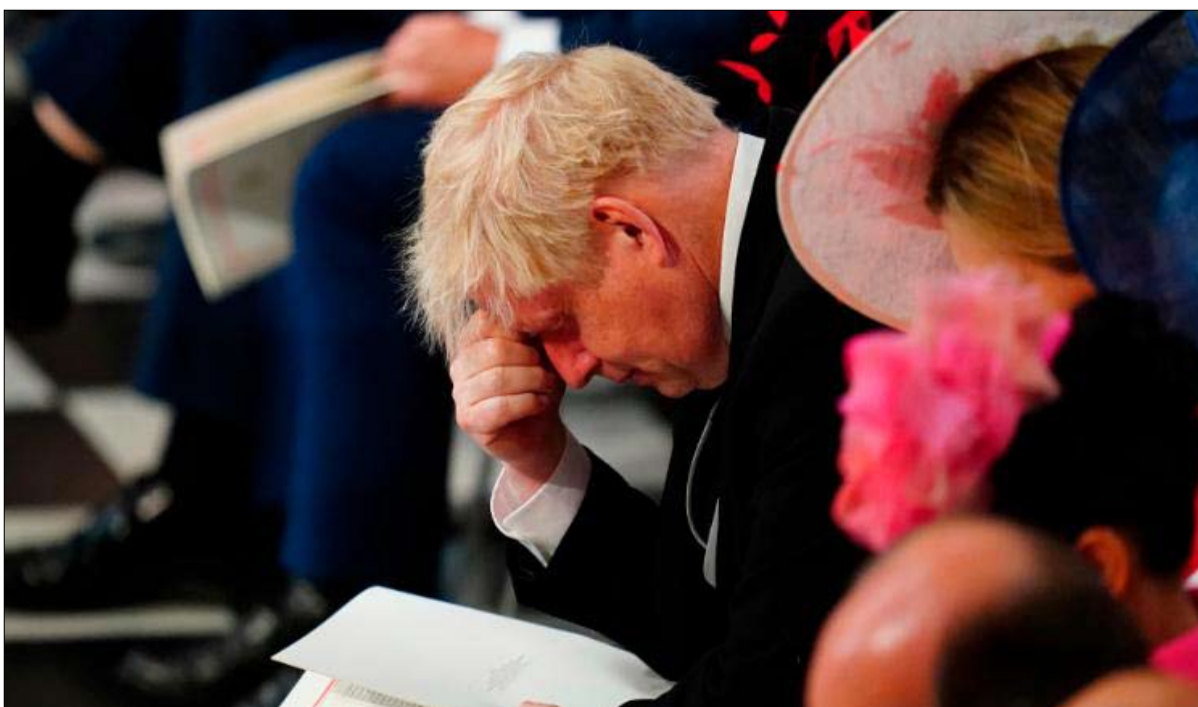
بوريس جونسون في عين الاعصار

ويأتي هذا الوضع في الوقت الذي بدأت فيه عواقب البريكسيت تظهر بشكل ملموس على الاقتصاد. ووفق مركز الإصلاح الأوروبي، انخفض الناتج القومي الإجمالي بنسبة 5 فاصل 2 بالمائة منذ خروج المملكة المتحدة الفعلي من الاتحاد الأوروبي في يناير 2020، وفي الأشهر الأخيرة، قفزت أسعار المواد الغذائية بنسبة 8 فاصل 3 بالمائة، وفقاً لؤسسة ريزوليوشنز. كارثة للأسر الأكثر تواضعاً، التي "سبق أن أضعفتها سياسات التقشف التي نفذتها الحكومات المحافظة منذ عام 2010". تحدد فيونا سيمبكينز. ولتعويض ارتفاع الأسعار، تحاول بنوك الطعام، التي شهدت زيادة بنسبة 33 بالمائة في عدد حزم الطوارئ التي تم تسليمها خلال ثلاثة أيام، مواكبة الأمر.