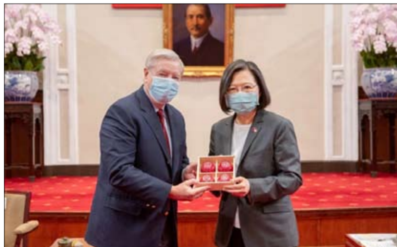
قانون في مجلس الشيوخ قد يسكب الزيت على النار