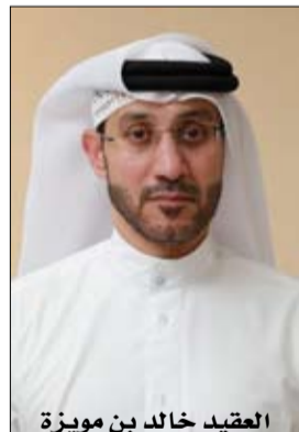
العقيد خالد بن مويضة

أخبرتهم بأنها تتعاطى المخدرات كلما ساءت علاقتها مع الشاب الجديد، ولأن الصمت والسكوت عنها تجاوز الحد والصبر على وضعها أصبح يشكل خطراً عليها، قام أحد أشقائها بإقناع الأب بضرورة التواصل مع مركز حماية الدولي لإنقاذها والاستفادة من المادة 89 من قانون الإماراتي لمكافحة المخدرات والمؤثرات العقلية التي تتعامل مع مريض الإدمان كحالة تحتاج إلى رعاية، وليس كدمتهم في قضايا، وتعفيه من المسؤولية القانونية حال التقدم طواعية للعلاج والتأهيل وقبل إلقاء القبض عليه أو صدور أمر