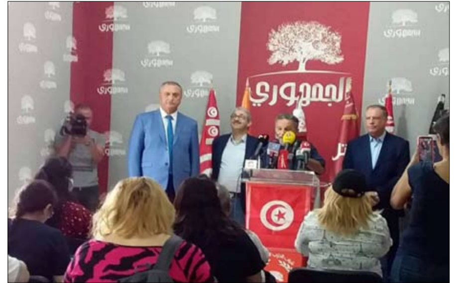
الحملة الوطنية لإسقاط الاستفتاء تقاطع