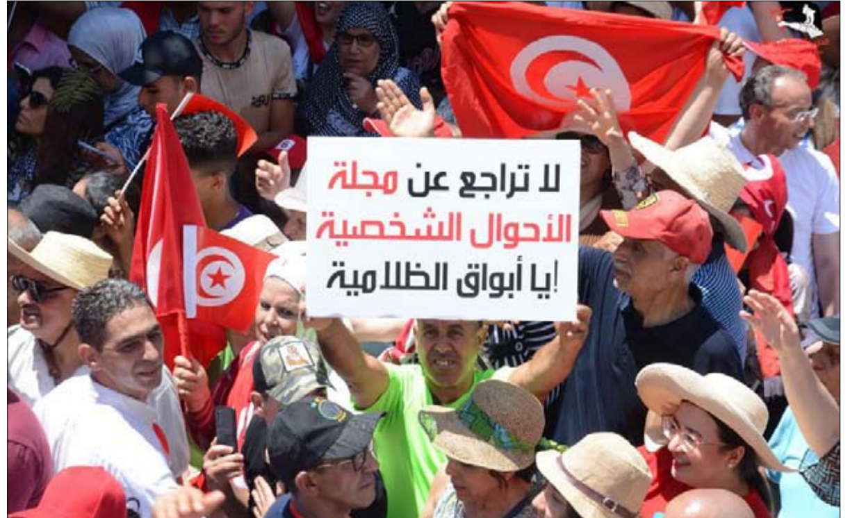
الدستوري الحر في وقفة احتجاجية جديدة