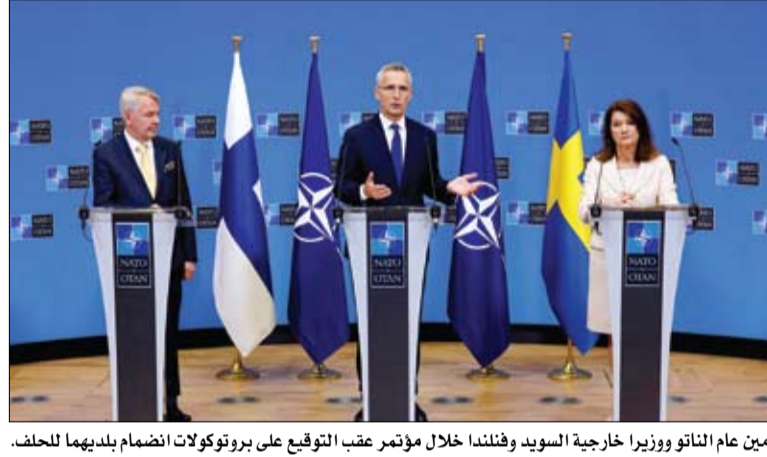
أمين عام الناتو ووزيرا خارجية السويد وفنلندا خلال مؤتمر عقب التوقيع على بروتوكولات انضمام بلديهما للحلف.

وأقر الرئيس الروسي فلاديمير بوتين، يوم الاثنين، بأن القوات الروسية التي قاتلت في لوجانسك بحاجة إلى أخذ قسط من الراحة وتعزيز قدراتها القتالية. ومن جانبه، قال وزير الدفاع الروسي سيرغي شويغو، إن الحرب في أوكرانيا ستستمر حتى تحقيق كل الأهداف التي أعلنها بوتين. إلى ذلك، وقعت الدول الأعضاء في حلف شمال الأطلسي الناتو أمس الثلاثاء، على بروتوكولات انضمام السويد وفنلندا، وأرسلت طلب عضوية الدولتين إلى عواصم دول الحلف للحصول على الموافقات التشريعية. وقال الأمين العام للحلف ينس ستولتنبرغ: