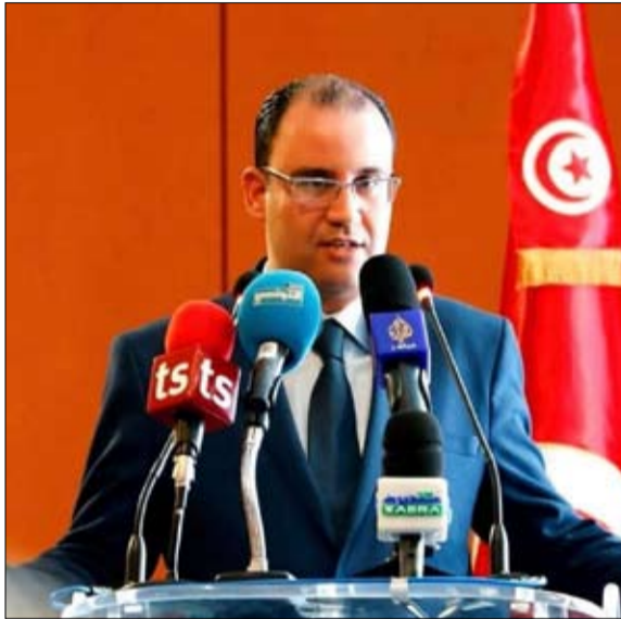
التحالف من أجل تونس يدعو للمشاركة والتصويت بنعم