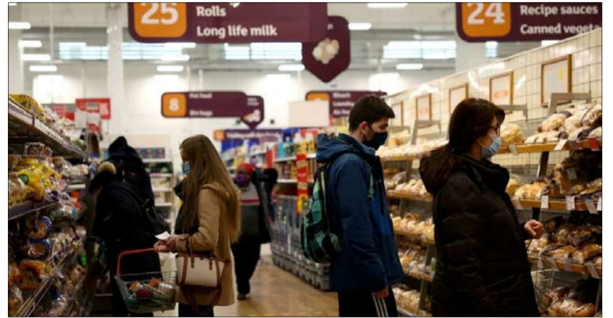
التضخم يدفع البريطانيين إلى شد أحزمتهم

للمطالبة بزيادة الأجور. لكن في نهاية يونيو، رفضت الحكومة المفاوضات وظل الرأي العام منقسماً بشأن الإضرابات.