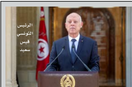
الرئيس التونسي قيس سعيد

أصدرت الرئاسة التونسية صباح أمس الثلاثاء مذكرة تفسيرية لمشروع الدستور الجديد عنوانها "للدولة حقوق وللحقوق والحريات دستور يحميها وللشعب ثورة يدافع عنها من يعاديه". وأوضح قيس سعيد ضمن هذه المذكرة التفسيرية أسباب تجميد