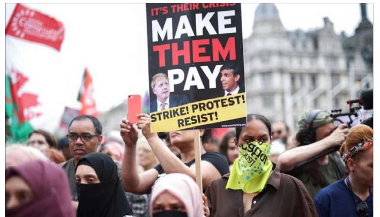
مظاهرة ضد التضخم بدعوة من التنظيم النقابي