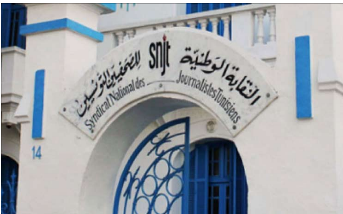
نقابة الصحفيين ترفض الاستفتاء