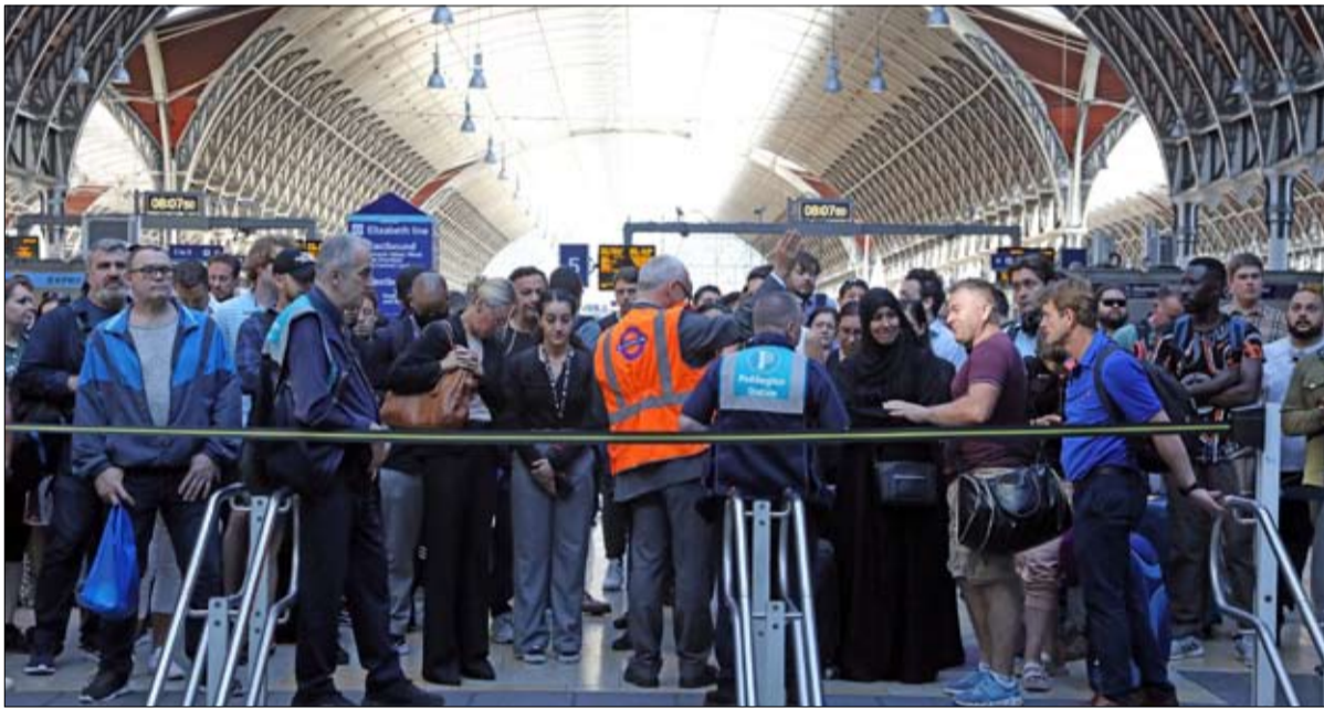
اضراب في النقل

تواجه المملكة المتحدة حالياً أعلى معدل تضخم