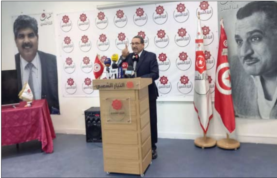
التيار الشعبي يدعو إلى التصويت ب نعم على مشروع الدستور

قال مسؤولون محليون ووسائل إعلام إن ضابطي شرطة في ولاية فيلادلفيا الأمريكية تعرضوا لإطلاق نار بعد "حادثة أمنية" بالقرب من طريق بنيامين فرانكلين باركواي بينما كان الآلاف يستمتعون بحفل موسيقي وعرض للألعاب النارية بمناسبة يوم الاستقلال. وقالت سلطات الطوارئ "وقع حادث أمني على طريق بنيامين فرانكلين باركواي". وأضافت قناة "سي.بي.إس 3 فيلادلفيا" بأن حالة الضابطين مستقرة، وتبحث الشرطة عن مطلق النار.