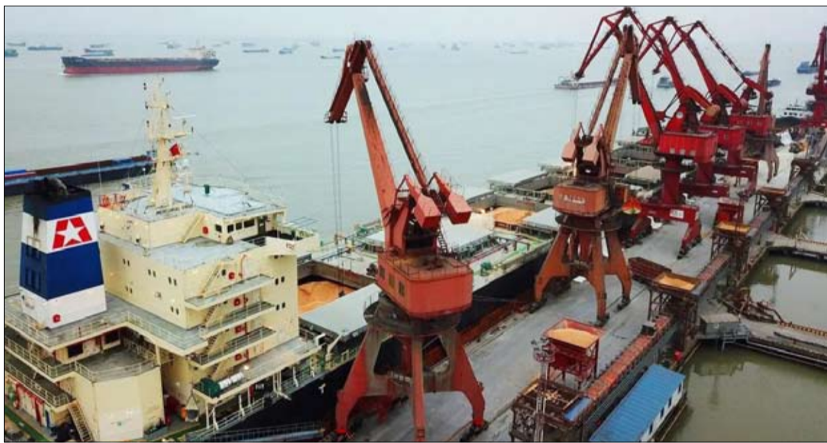
الصين بسوقها الشاسع وقدراتها الصناعية ، أصبحت تداعب أحلام المستثمرين الأمريكيين

الجيلولة دون اعتماد سلسلة التوريد على الصين. و توضع 20 أبريل ذكرت وزيرة الخزانة الأمريكية إن الولايات المتحدة لا تسعى إلى فصل اقتصادها عن اقتصاد الصين، باستثناء بعض القطاعات المفيدة التي تؤثر على أمنها القومي. في هذه الفطاعات، يتم التحكم في الصادرات الأمريكية و