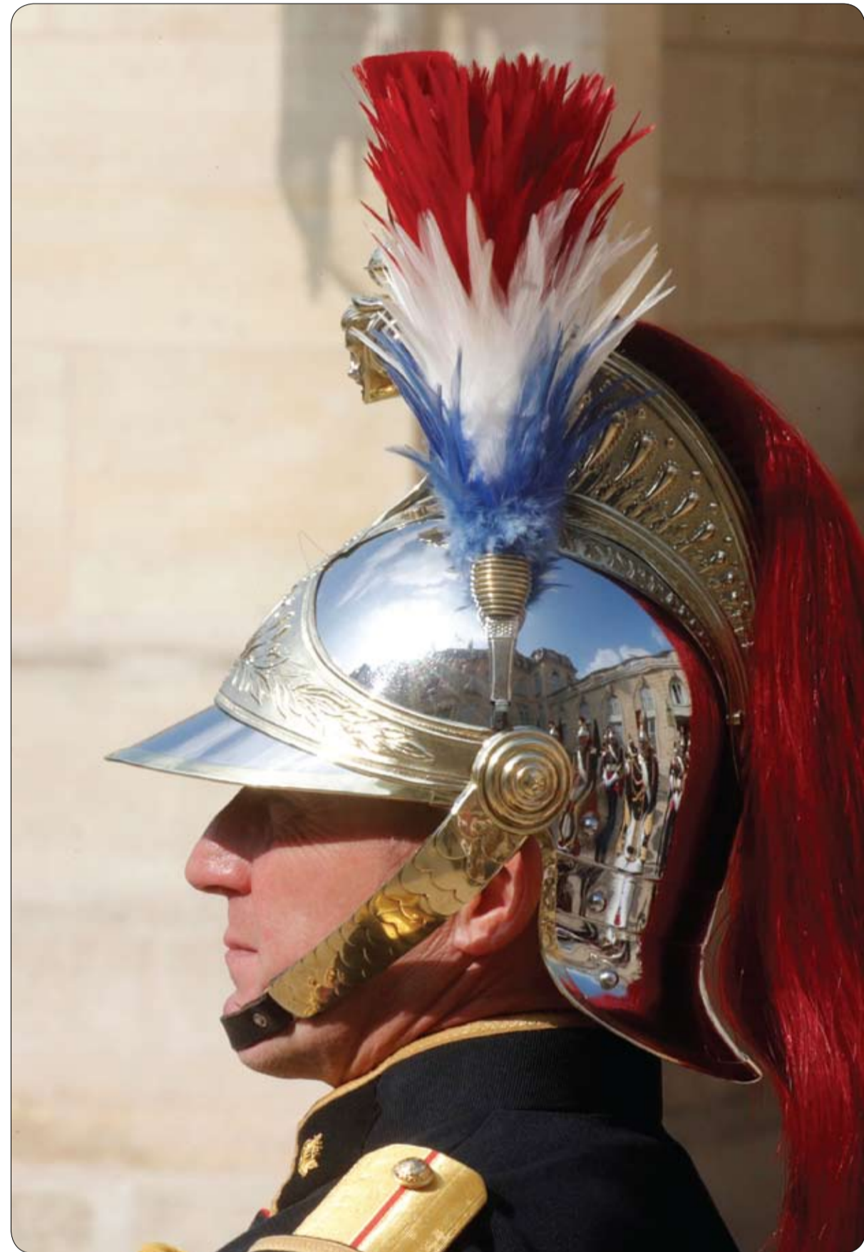
قصر الإليزيه ينعكس على خوذة أحد الحرس الجمهوري في ساحة قصر الإليزيه في باريس

أوردت مجلة Elle أن مستحضر داكسيفاي (Daxxify)، الذي طورته شركة Revance Therapeutics، يغزو عالم التجميل حالياً، خاصة فيما يتعلق بمحاربة الشيخوخة ليتمثل بديلاً للبوتوكس. وأوضحت المجلة العنية بالصحة والجمال أن مستحضر داكسيفاي هو سم عصبي يتم حقنه مباشرة في العضلات باستخدام حقنة طفيفة التوغل، وعلى الرغم من أن تأثير شلل العضلات يحدث أيضاً بسبب "نوكسين البوتولينوم"، إلا أن المستحضر الجديد يحتوي أيضاً على "البيبتيدات"، التي تنقل العنصر النشط مباشرة إلى الخلية العصبية، حيث يتم تكسيرها ببطء أكبر، لذا يعد الاتجاه الجديد لمكافحة الشيخوخة مناسباً بشكل خاص للتجديد العميقة مثل خطوط العيوب.