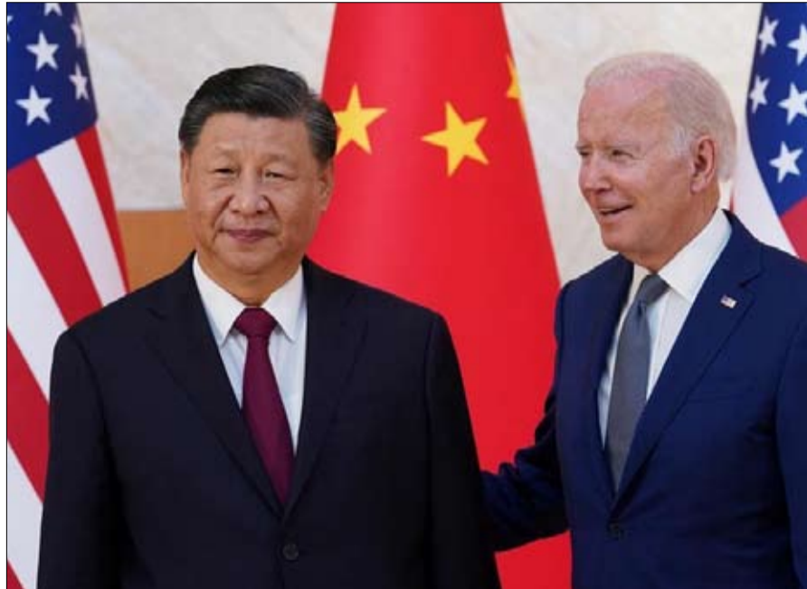
هل تنحي الولايات المتحدة والصين المواجهة وتجهان نحو الحوار الحقيقي؟

تد هنا على اتهامات الرئيس الصيني إذ يستنكر شي جين بينغ رغبة الولايات المتحدة في "احتواء وتطويق" الصين، ويتهتم واشنطن بالسعي إلى "تصفية" قطاعات معينة من الاقتصاد الصيني لمنعها من احتلال المركز الأول عالمياً. نحن هنا في قلب التنافس بين البلدين: من ناحية، القوة الصاعدة، الصين، ومن ناحية أخرى، القوة الراسخة، الولايات المتحدة، الأولى تنوي استخدام كل أسلحتها، الاقتصادية والتكنولوجية والعسكرية - لتغيير النظام العالمي بما يتناسب مع مصالحها. والثانية تستغل نفس الأدوات للحفاظ على النظام الليبرالي الدولي الذي أسسته في عام 1945. هنا يبدو التوليف صعباً بين الموقفين. في معركة القرن هذه، تحاول السيدة يلين وضع بعض القواعد: نحن لا نتعرض إلى الأنشطة التجارية، لكننا نحمي قطاعات معينة مثل أشباه الموصلات لأنها مسألة تتعلق بالأمن القومي. لشرح موقفها، تريد جانيت يلين الذهاب إلى بكين. وتري "فاينانشيال تايمز" أن