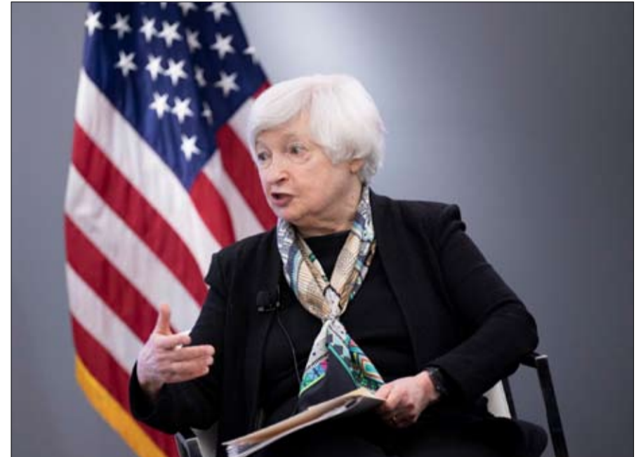
جانيت يلين وزيرة الخزانة الأمريكية

كان نسمة من الهواء التدي الطري بدأت تهب في سماء العلاقات الدولية، معلنة عن تبشير الربيع في أوروبا، بحثاً عن أدنى علامة على الانفراج الأمريكي الصيني، تتطلع للسماء، وتتصفحها وتساءل عن اتجاه القيوم و مسارها، ونحاول فك رموز تصريحات هذا الطرف و ذاك و نتساءل، على خلفية قائمة نوعاً ما ، وبينما تستقر الصين والولايات المتحدة في مرحلة المواجهة التاريخية ، هل ستكون هناك ، هذه الأيام ، إمكانية لبدء الحوار بينهما ؟