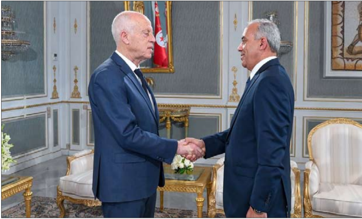
لقاء لم يثمر بين الرجلين