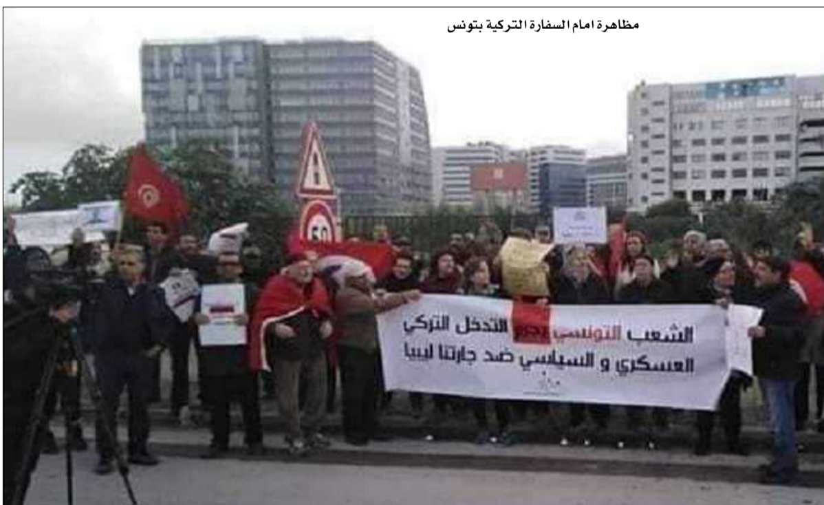
مظاهرة امام السفارة التركية بتونس

ملاذ لهم.. يشار إلى ان تقارير إعلامية اشارت أمس السبت إلى انه يمكن أن يصل عدد الوافدين من الجانب الليبي نحو تونس إلى 25 ألف أو حتى 50 ألف لاجئ ليبيين ومن جنسيات أخرى، خاصة بعد ما شهدته ليبيا من تطورات أمنية خطيرة قد تتحول إلى حرب دامية في أي لحظة. ويبدو أن هذه التوقعات دفعت تونس والجزائر إلى تعزيز التواجد الأمني على كل الواجهات الحدودية تحسبا لأي مخاطر أمنية أو إمكانية تسلس عناصر إرهابية إلى القطرين. وافاد مصدر أمني، أن