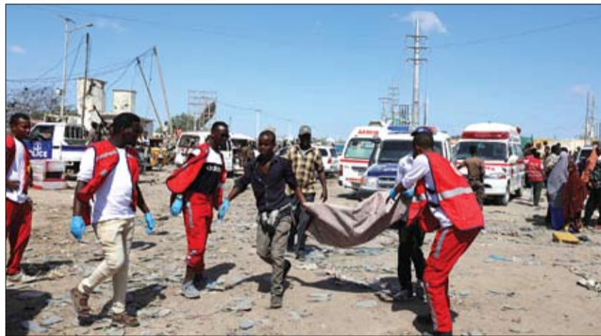
رجال الإنقاذ يخلون جثامين الضحايا من موقع الهجوم الإرهابي في مقديشو

الحملة سجلت 7.2 مليون صوت من مختلف أنحاء العالم الإمارات تعلن 31 ديسمبر الجاري آخر موعد للتصويت لاختيار الهوية الإعلامية المرئية دبي - وام: أعلن المشروع الوطني للهوية الإعلامية المرئية لدولة الإمارات استمرار التصويت المفتوح لاختيار شعار الهوية محليا وعالميا حتى 31 من ديسمبر 2019 أي في آخر يوم من العام الحالي وذلك بعد أن حققت عملية التصويت لاختيار شعار الهوية الإعلامية المرئية لدولة الإمارات من بين التصميم الثلاثة المطروحة على الجمهور رقما قياسيا عالميا جديدا بتسجيلها 7.2 مليون صوت من مختلف أنحاء العالم. تأتي المشاركة المليونية بعد أقل من اسبوعين على فتح باب التصويت أمام الجمهور من كل مكان حول العالم للمشاركة في اختيار تصميم الهوية الإعلامية المرئية لدولة الإمارات من بين الخيارات الثلاثة المروضة على موقعها الإلكتروني، لهوية إعلامية مرئية متميزة تسرد قصة النجاح المهمة لدولة الإمارات وتجسد منظومتها القيمية الفريدة للعالم وتكون علامة فارقة لها ولإنجازاتها خلال السنوات الخمسين المقبلة. البحرية الأمريكية: إيران تخطط لاستفزات جديدة في هرمز واشنطن - رويترز: قال توماس مودلي القائم بأعمال وزير البحرية الأمريكي إن إيران قد تقوم بأعمال استفزازية في مضيق هرمز وأماكن أخرى في المنطقة في المستقبل على الرغم من فترة هدوء نسبي. وأضاف مودلي في مقابلة مع رويترز: أعتقد أنهم سيواصلون القيام بأعمال استفزازية هناك... وأعتقد أنهم سيتجنبون كل فرصة ليقعوا ذلك دون أن يوضح عن تفاصيل أو إطار زمني.