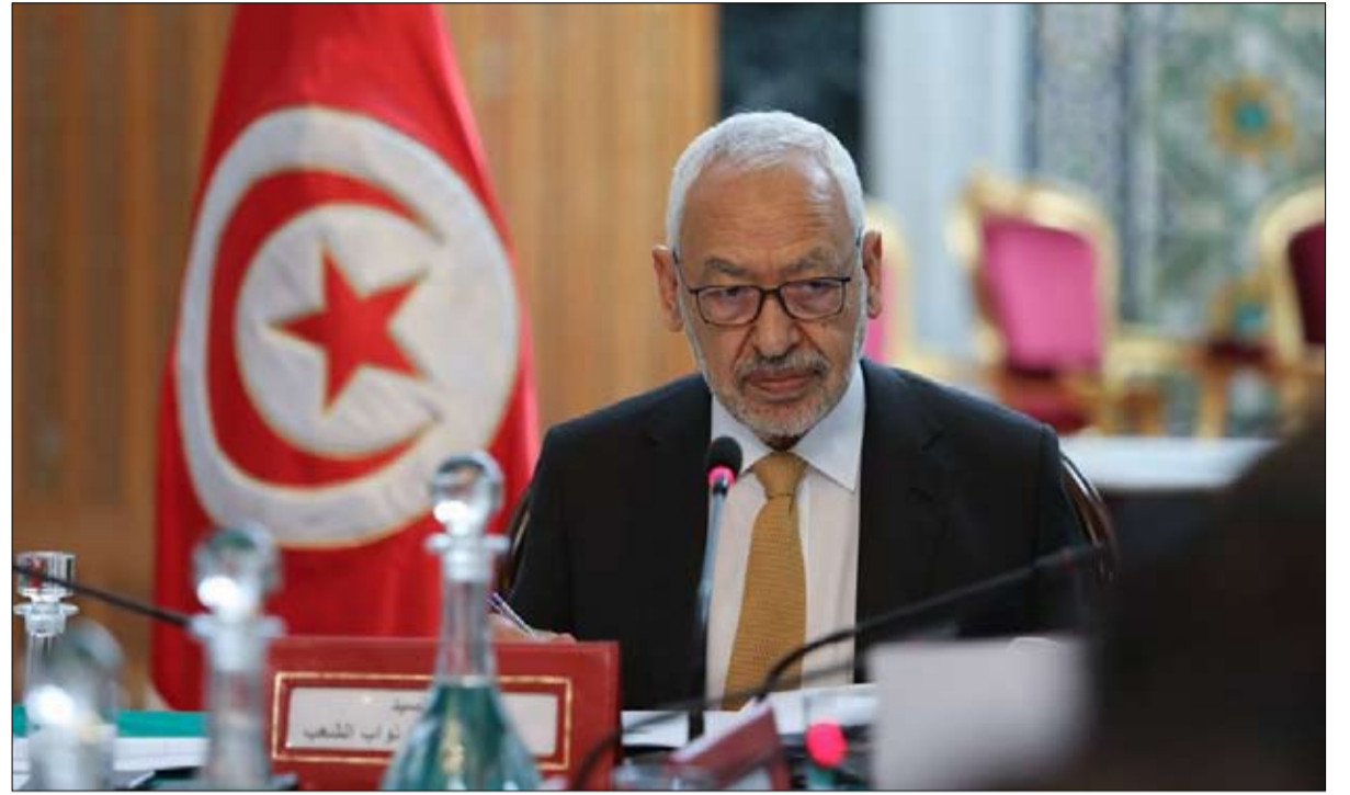
صراع بين الغنوشي وسعيد