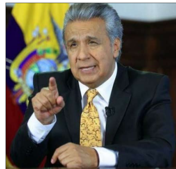
لينين مورينو... الإكوادور منزعج نيو ليبرالي

في الأرجنتين، سيشكل انتصار البرتو فرنانديز عودة البيرونيين إلى السلطة، ضد موريسيو ماركري الذي وقع عام 2015 عودة اليمين الليبرالي - يمين كان يريد أن يكون تجسيدا للبرالية تقدمية -، وهدفه الأساسي طي صفحة الحكومات اليسارية، أو القومية الشعبية، بشكل أدق، نهائياً. كل شيء يشير إلى أن هذا الرهان لن ينجح، لأن البيرونيين سيعودون إلى السلطة عبر تحالف بُني داخل هذه الحركة بين الرئيسة السابقة كريستينا كيرشنر (التي تجسد اليسار داخل البيرونية) -مرشحة لمنصب نائب الرئيس بناء على مبادرة لهذا النموذج الرئاسي- ومير ديوانها السابق البرتو فرنانديز. وهذا الأخير، هو المرشح للرئاسة، والأقرب إلى قطاعات أخرى من البيرونية، وخاصة للذين يرفضون ترشيحها جديدا للرئيسة السابقة، لكنه على توافق أيضاً مع ناخبين بيرونيين آخرين.