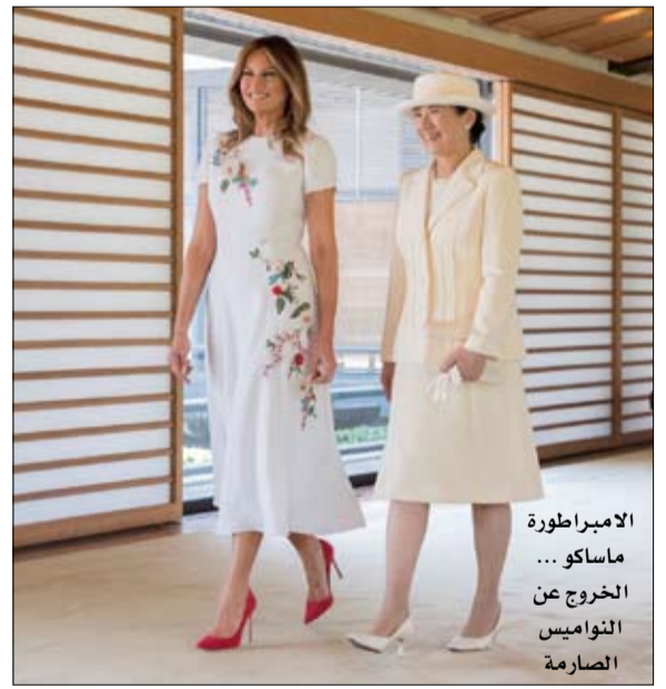
الامبراطورة ماساكو... الخروج عن النوااميس الصارمة

هناك فجوة متزايدة بين حراس تقاليد البيت الإمبراطوري والحدأة النسبية لآخر الأباطرة