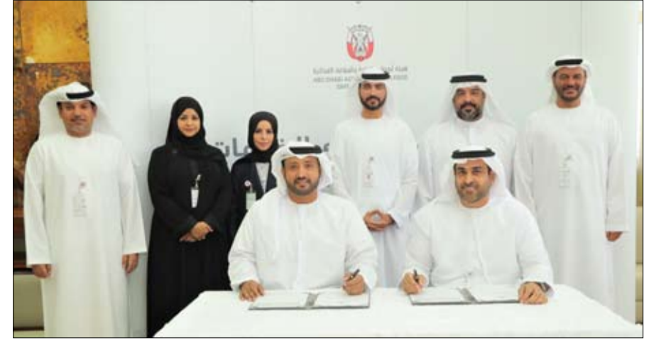
•• أبوظبي - الفجر

طبقت هيئة أبوظبي للزراعة والسلامة الغذائية اتفاقيات مستوى الخدمة داخلياً لتعزيز كفاءة عمليات سلسلة توريد الأعلاف وتحسين مستوى الخدمات المقدمة للمتعاملين في مجال توريد وصرف الأعلاف، وذلك التزاماً باستراتيجيتها المستمرة لتحسين الخدمات وفق أفضل الممارسات العالمية. وتمثل اتفاقيات مستوى الخدمة نموذجاً للتفاهم وتقاسم المسؤوليات والمهام وتنفيذها ضمن إطار زمني متفق عليه بهدف إنجاز العمليات التشغيلية بأعلى قدر من الكفاءة وتقديم الخدمة بالسرعة والجودة التي تلبى تطلعات