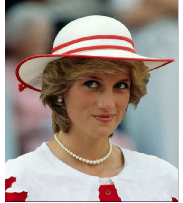
شبح ديانا يخيم من جديد