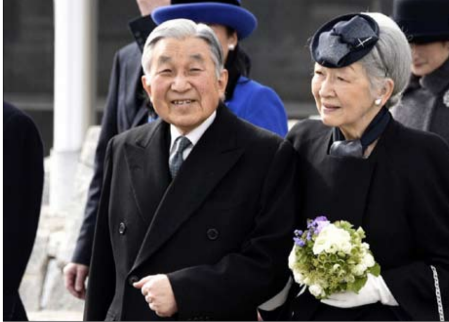
أكيهيتو... رائد التحدي

تستعد بوليفيا لإضراب عام بعد ساعات من اندلاع أعمال عنف في عدة مدن إثر رفض مرشح المعارضة نتائج الانتخابات الرئاسية التي أظهرت أن الرئيس اليساري المنتهية ولايته إيفو موراليس يتجه للفوز من الدورة الأولى في تحول مفاجئ في النتائج اعتبره مرشح المعارضة تزويراً. وفي سوكري، العاصمة الدستورية، أضرم حشد النار في مبنى المحكمة الانتخابية بالمقاطعة، فيما دارت اشتباكات بين متظاهرين من أنصار مرشح المعارضة كارلوس ميسا والشرطة في كل من لاياز ويوتوسي، بحسب ما أفادت وسائل إعلام محلية ومراسلو وكالة فرانس برس. وذكرت تقارير في الإعلام المحلي أن أعمال عنف البلاد "لن تعترف بهذه النتائج التي تندرج في إطار عملية تزوير مخزية تضع المجتمع البوليفي في حالة توتر غير ضرورية". وأتى موقف ميسا، الرئيس السابق للبلاد بين عامي 2001 و2005، بعيد إبداء بعثة منظمة الدول الأمريكية لمراقبة الانتخابات "قلتها العميق وهدهشتها" إزاء التحول المفاجيء في نتيجة الانتخابات الرئاسية.