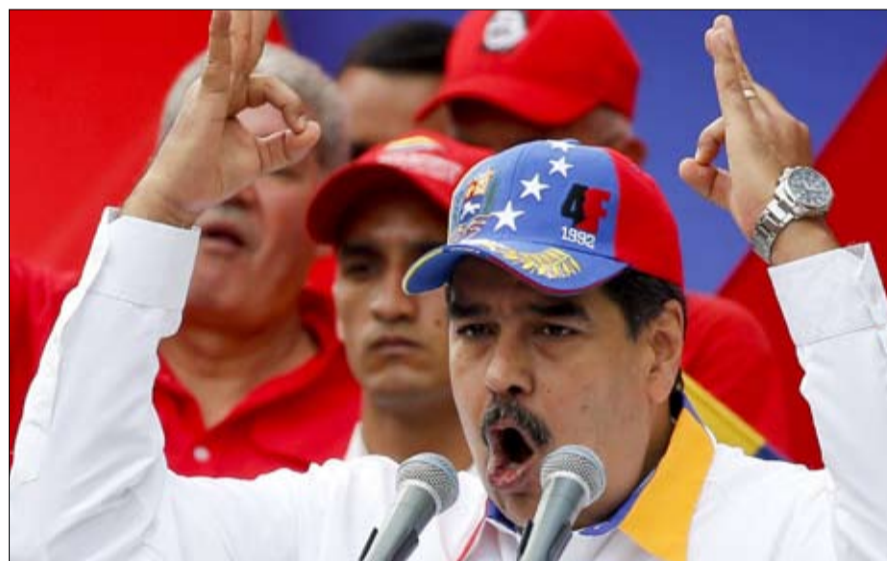
فينزويلا مصدر تصعد في أمريكا اللاتينية