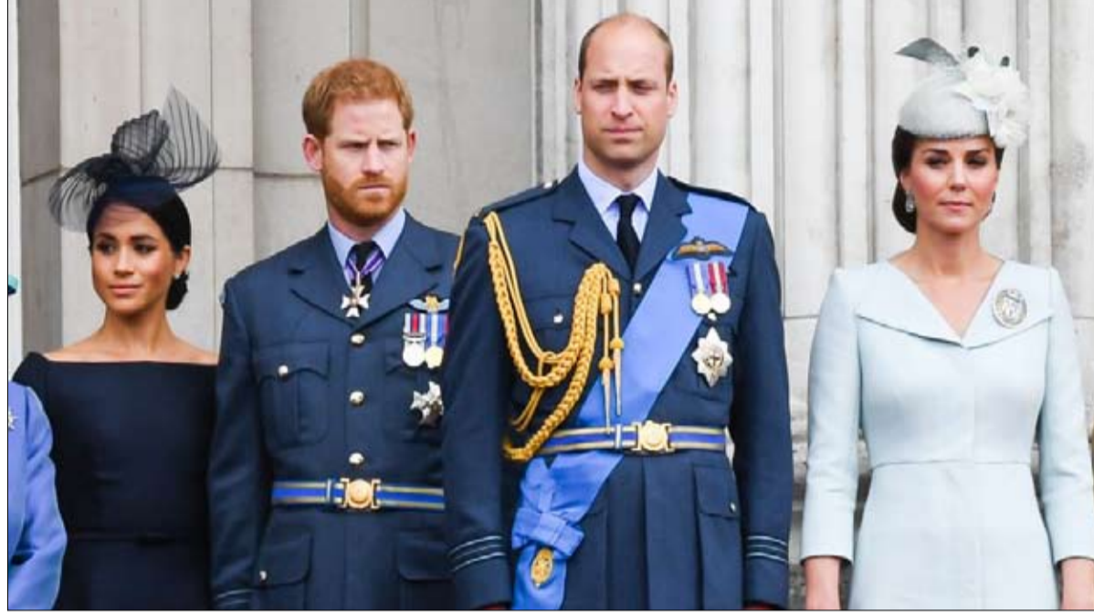
الأمير وليام على خطى الملكة