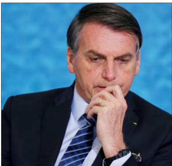
بولسونارو منزعج من عودة البيرونية