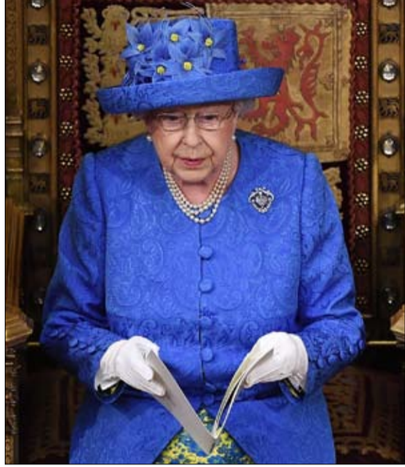
الملكة ترفض التدخل وتفضل الصمت على الردود

وقال توسك للاتحاد الأوروبي إنه يدرس طلب رئيس الوزراء البريطاني بوريس جونسون تأجيل موعد الخروج لما بعد الموعد المقرر في 31 أكتوبر- تشرين الأول مع زعماء باقي دول الاتحاد وأن قرارا سيُتخذ خلال الأيام القادمة.