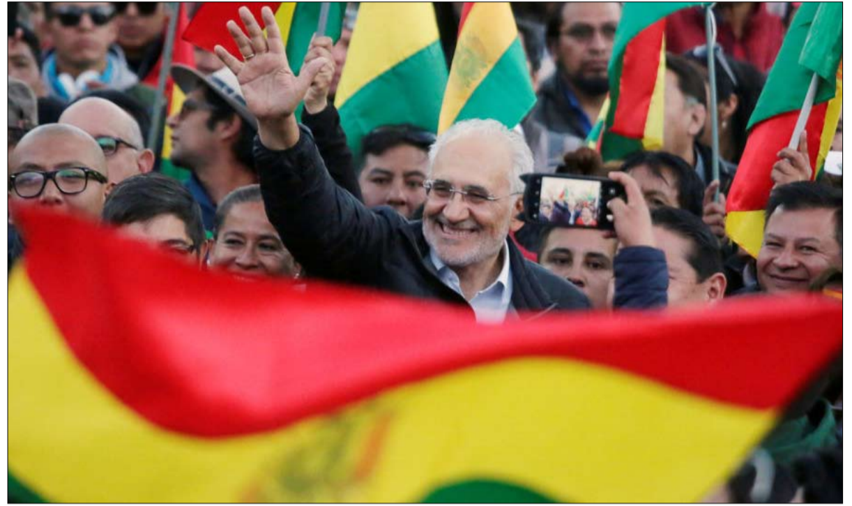
كارلوس ميسا... عودة اليمين إلى بوليفيا