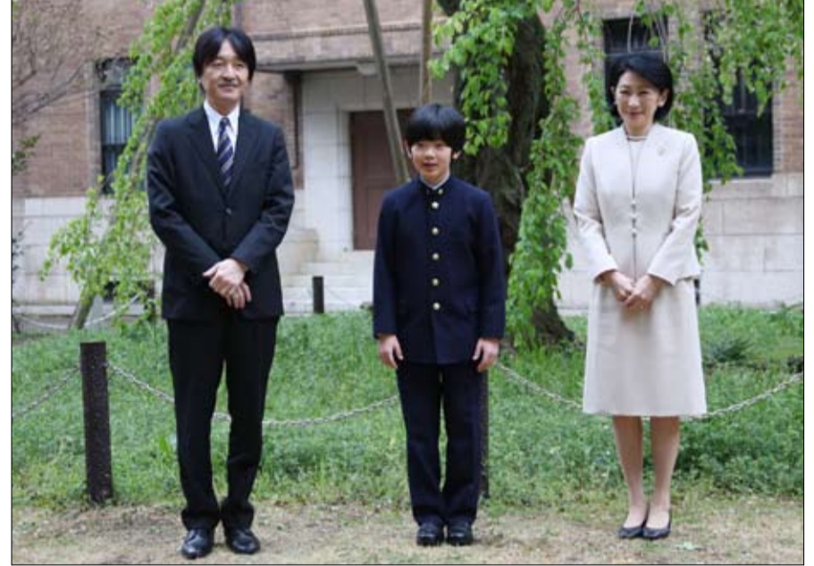
الامير هارهييتو... وسط- الوريث الوحيد للعرش