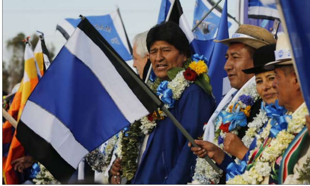
موراليس... رمز اليسار الأمريكي اللاتيني

الأوروغواي: سيحتفظ ائتلاف يسار الوسط المنتهية ولايته، بالسلطة التنفيذية دون أغلبية