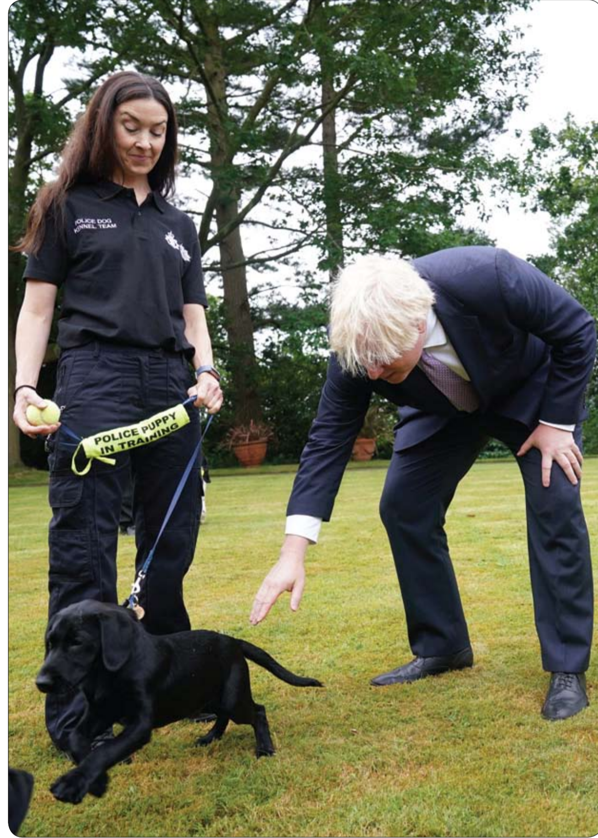
رئيس الوزراء البريطاني مع إحدى موظفات تربية الكلاب البوليسية خلال زيارة لمقر شرطة ساري بالتران من مع

وقال بوريك: "قد لا يكون الأمر سهلاً لأن استخراج جثة من وسط الثلوج يتطلب كثيراً من الجهد، وهو أمر غير ممكن على هذا الارتفاع". مضيفاً أنه من الممكن، كخيار ثان، دفن الجثث هناك إذا وافقت عائلاتهما.