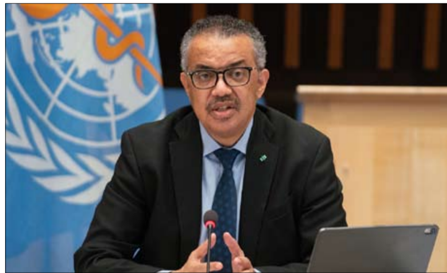
منظمة الصحة العالمية تريد تحقيقاً جديداً

"الوضع لا يسمح بأية شكوك، يصز تسنغ بيشينغ، الباحثون على يقين من عدم وجود دليل على وجود تسرب من المختبر. إذن، لا يمكن أن يكون الفيروس قد تنسّق جزءاً تسرب من المختبر هذه الدراسة الجديدة التي اقترحتها منظمة الصحة العالمية لفحص أصول الفيروس، هي في نفس الوقت عدم احترام للمنطق السليم، وتعارض في بعض النواحي مع العلم، وهذا هو سبب استبعادنا تماماً قبول هذا المقترح. ومن هذا المنطلق، اليك السبب، أجد في هذا البرنامج عدم احترام للمنطق السليم، وغطرسه تجاه العلم." في الأيام الأخيرة، قال المدير العام