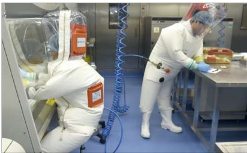
هل تسرب الفيروس من المختبر؟