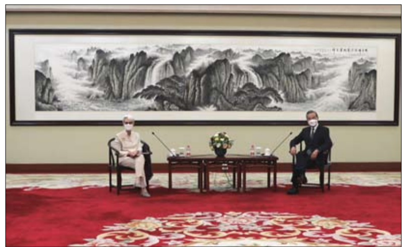
ويندي شيرمان، مع وزير الخارجية الصيني في مدينة تيانجين