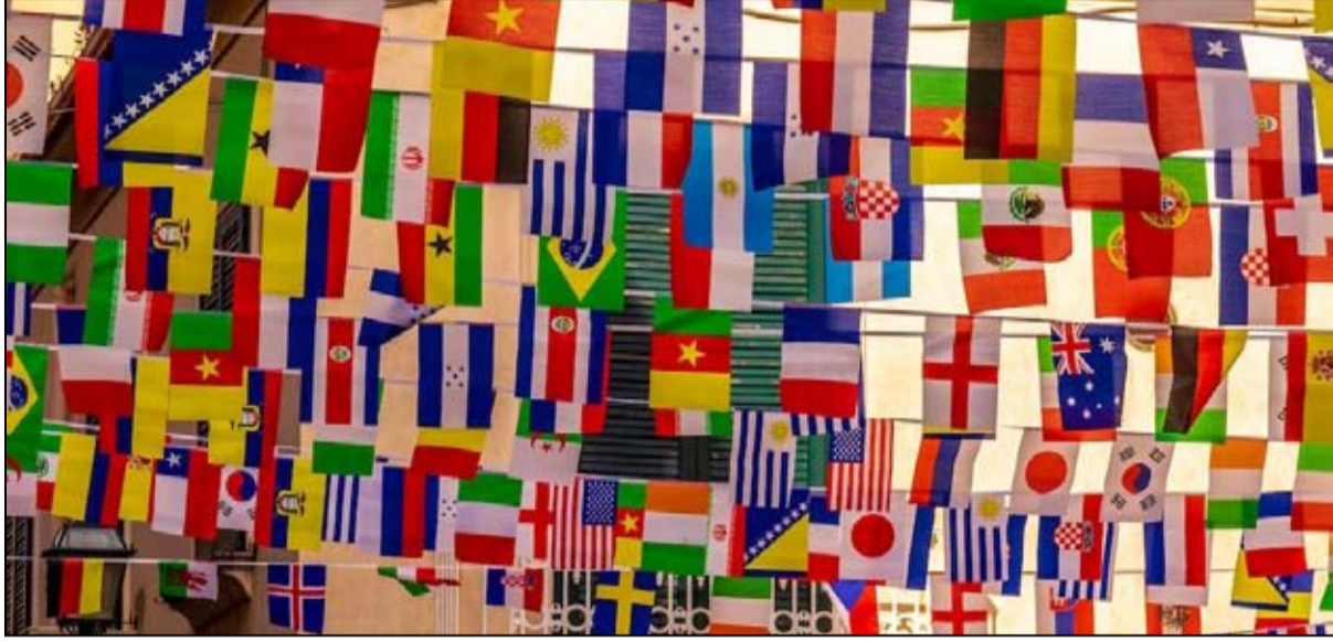
اختلاف بين الجغرافيا الرياضية والجغرافيا السياسية