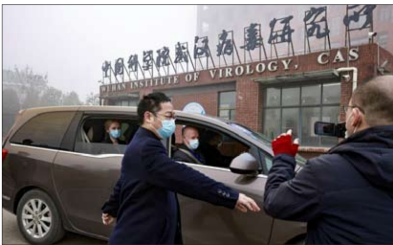
فريق التحقيق عمل في ظروف صعبة

مؤلف حوالي خمسة عشر كتاباً مخصصة للصين والتحديات والتبث والهند والتحديات الآسيوية الرئيسية. عام 2020، نشر كتاب "الزعامة العالمية محورية، الصدام بين الصين والولايات المتحدة" عن منشورات لوب.