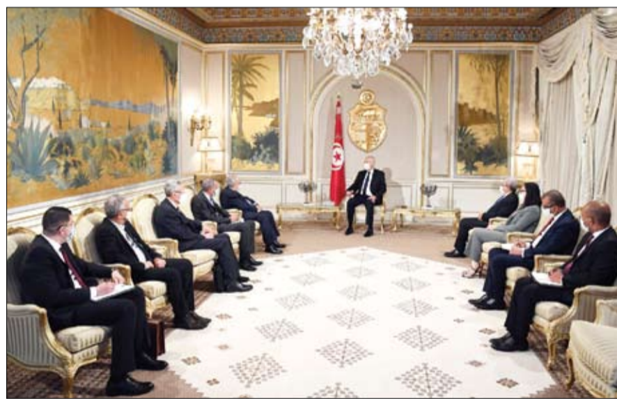
الرئيس قيس سعيد يستقبل وزير خارجية الجزائر

استمرار الاحتجاجات في إيران واشغال النار في صور خامني