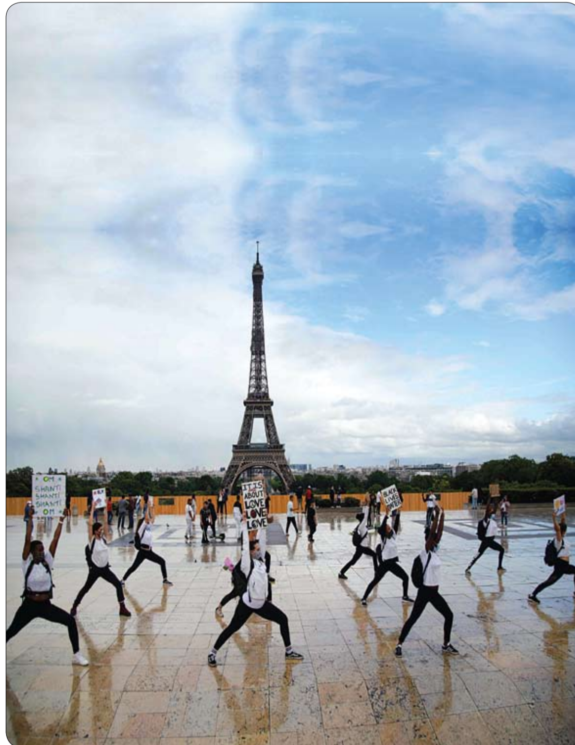
أعضاء مجموعة هيرمين برونير لليونغا يعلقون لافتات أثناء قيامهم برقصة لأغنية هندية من أجل السلام العالمي والاحتجاج على العنصرية وإظهار دعمهم لحركة «حياة السود مهمة»، في باريس، خلال المهرجان الفرنسي للموسيقى.

نصيحة: تخلي عن المأكولات المصنّعة وتلك الجاهزة الغنية بالدهون والسكريات والفقيرة بمضادات الأكسدة، وأكثر من تناول الخضار والفواكه على أنواعها نظراً لغناها بالفيتامينات والمعادن التي تحفّز جهاز المناعة في الجسم.