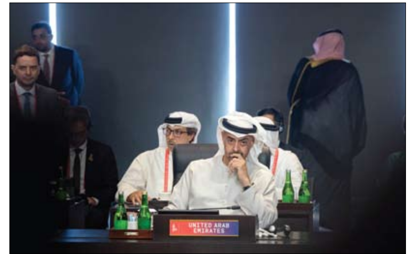
رئيس الدولة خلال مشاركته في قمة قادة مجموعة العشرين

الدولية. واستهل صاحب السمو رئيس الدولة كلمته في القمة .. بتوجيه الشكر إلى الرئاسة الإندونيسية لجهودها الكبيرة في قيادة أعمال مجموعة العشرين وتنسيقها .. متمنياً التوفيق والنجاح لجمهورية الهند الصديقة في رئاسة المجموعة خلال العام المقبل. وقال سموه : نحن نؤمن في دولة الإمارات بأن النهج المتوازن هو الأنجح لتحقيق الاستدامة .. مؤكداً التزام الدولة بدورها المسؤول في أسواق الطاقة وأجندتها الرائدة في قطاع