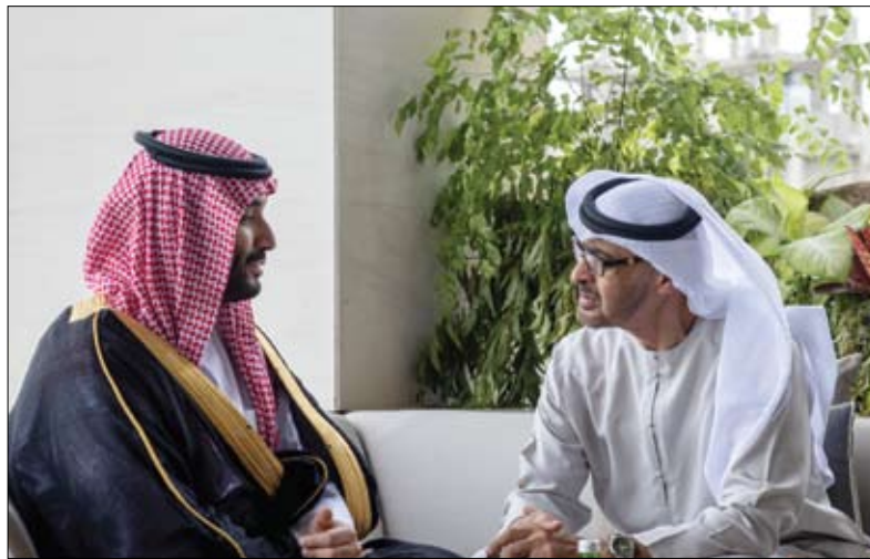
رئيس الدولة خلال لقائه محمد بن سلمان على هامش قمة بالي

مكتوم، نائب حاكم دبي نائب رئيس مجلس الوزراء وزير المالية، جمعاً من أعيان البلاد ورؤساء ومديري الدوائر والهيئات والمؤسسات ورجال الأعمال. من جهة أخرى كرم سموه للفائزين بجائزة دبي التقديرية لخدمة المجتمع في قصر زعبيل في دبي أمس (الثلاثاء) بحضور سمو الشيخ حمدان بن محمد بن راشد آل مكتوم، ولي عهد دبي رئيس المجلس التنفيذي، وسمو الشيخ مكتوم بن محمد بن راشد آل