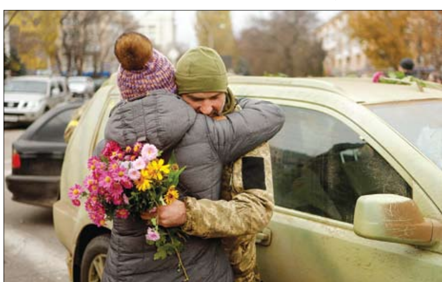
أحد سكان خيرسون يحتضن جندياً أوكرانياً بعد انسحاب روسيا من المدينة.

وكيف وأوديسا وعدد من المناطق الأوكرانية، وذلك رداً على الهجوم الروسي. وعلق مكتب الرئاسة الأوكرانية على القصف الروسي ببيان جاء فيه: روسيا ترد على خطاب الرئيس الأوكراني في قمة العشرين بهجوم صاروخي جديد على العاصمة. وتساءل البيان: هل يعتقد أحد بجدية أن الكرملين يريد السلام حقا؟