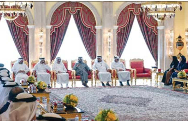
محمد بن راشد خلال لقائه أعيان البلاد ومسؤولي الدوائر الحكومية في دبي

يومية - سياسية - مستقلة www.alfajrnews.ae