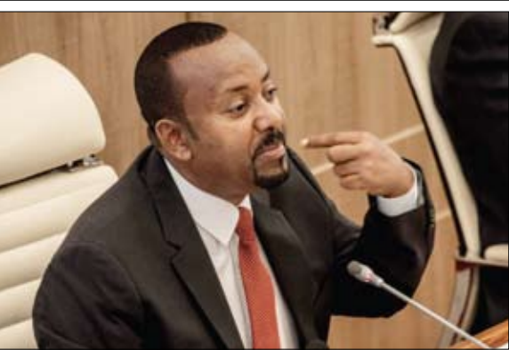
رئيس الوزراء الإثيوبي يلقي كلمة أمام جلسة للبرلمان في أديس أبابا

أعلن الأسطول الخامس بالبحرية الأمريكية، الثلاثاء، أنه اعترض سفينة صيد كانت تهرب كميات ضخمة من المواد المتفجرة أثناء عبورها من إيران على طريق خليج عمان يستخدم لتهريب الأسلحة إلى جماعة الحوثيين.