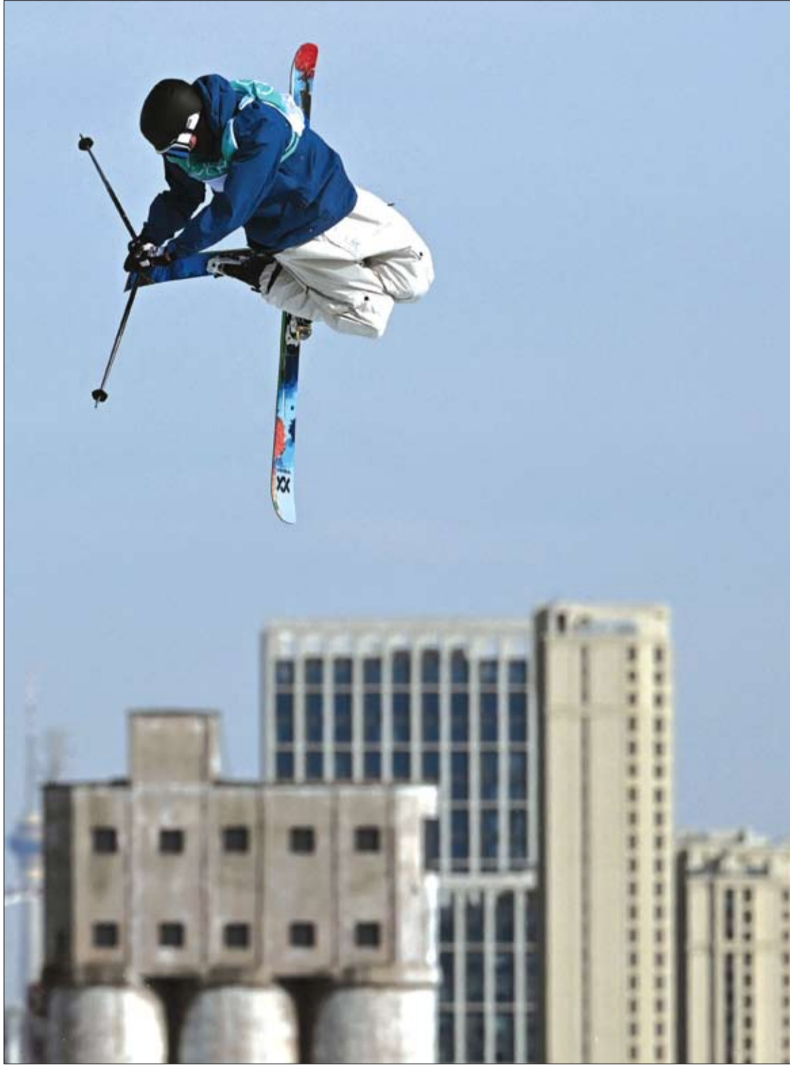
السويسري أندري راجيتلي يتنافس في سباق التزلج الحر للرجال خلال دورة الألعاب الأولمبية الشتوية في بكين 2022

وأضافت أن "بذور السمسم الأسود تغذي الفيتامينات مثل الكالسيوم والمغنيسيوم وفيتامين ب 1 والنحاس والزنك والفسفور والأحماض الأمينية والألياف الغذائية والسيلينيوم. وبالإضافة إلى ذلك، تحتوي هذه البذور المغذية أيضاً على مضادات الأكسدة الطبيعية مثل السوسمولين والسموسول والسمسمين". ووفقاً لمجموعة من الأبحاث، تساعد مضادات الأكسدة الموجودة في بذور السمسم الأسود في مواجهة أو تحييد آثار الجذور الحرة التي تعزز تلف الخلايا وتسبب علامات الشيخوخة. وتتمتع بذور السمسم الأسود بالعديد من الفوائد الغذائية للجسم. وتشتهر هذه البذور بكفاءتها في تعزيز نمو الشعر ولون الشعر. وتابعت كوموفا: "إن مكونات مضادات الأكسدة الموجودة في بذور السمسم الأسود تغذي الشعر وتحفز نموه وتغذي فروة الرأس لأنها تزيد من تدفق الدم إلى منطقة فروة الرأس. ومن خلال القيام بذلك، تحل بذور السمسم الأسود مسار جدر الشعر الرمادي، ما يمنح شعرك لونا أسود جديداً. كما أنها تعزز نشاط الخلايا الصباغية - وهذا يزيد من إنتاج صبغة الميلانين المسؤولة عن إعطاء الشعر لونه الأسود، وعكس ظروف الشعر الرمادي". وتحتوي البذور على عدد من المركبات النشطة بيولوجياً التي تدعم استخدامها للأغراض الأخرى المرتبطة بالشيخوخة بما في ذلك فقدان السمع وضعف الذاكرة وضعف البصر.