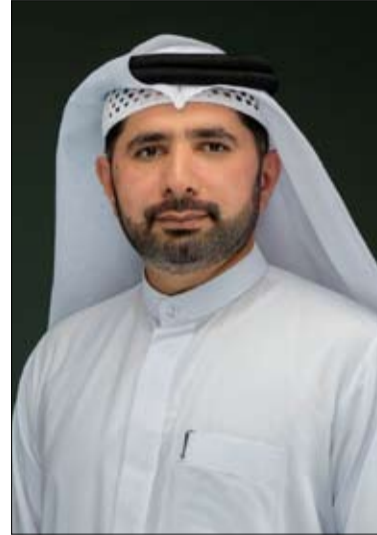
من رسالة الهيئة ورؤيتها في تقديم أفضل الممارسات الإعلامية المبتنية على أسس من المهنية والتخصصية، ناهيك عن الاستفادة

شهادات معتمدة بعد إنهاء المتطلبات العملية والنظرية.