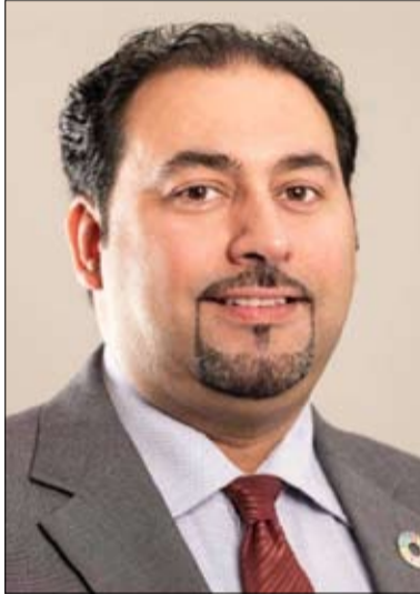
المبادلة من مختلف الخبرات التي سيقدمها كلا الطرفين بما يسبب بمصلحة تكريس ثقافة إعلامية فاعلة ومتطورة..

ويشتمل المركز على بنية تحتية تمتاز بأعلى المعايير العالمية المتبعة في مجالات التدريب الإعلامي حيث يضم 4 استوديوهات وقاعات مزودة بأحدث الأجهزة والأنظمة المساندة للتدريب حيث استطاع وخلال السنوات الماضية أن يقدم 981 دورة متخصصة أشرف عليها 28 مدرساً متخصصاً في مختلف الحقول، واستفاد منها 4800 متدرب ممن حصلوا على شهادات معتمدة بعد إنهاء المتطلبات العملية والنظرية.