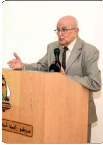
الانتهاء منه والموافقة عليه. وفي عام 1973 قام زايد الخير بتفقد

وأضاف الدكتور نصر أنه في عام 1971 أمر الشيخ زايد بتأسيس حديقة حيوانات العين، وبقي مشرفاً على المشروع إلى أن تم