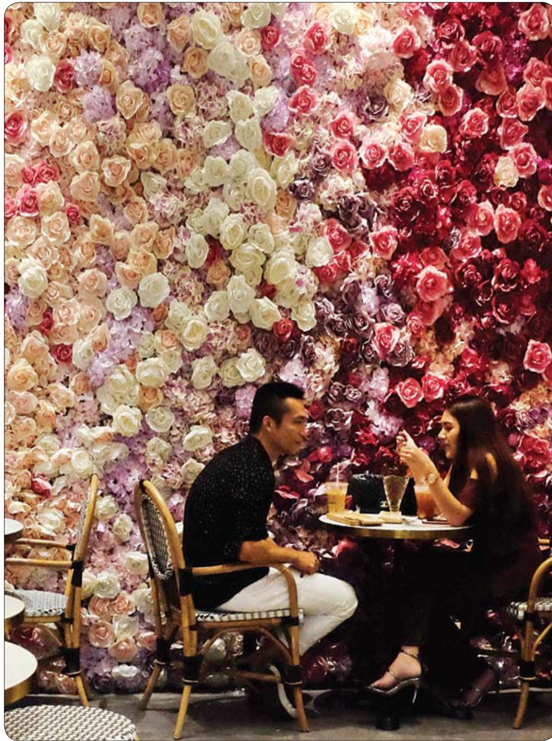
زوجان يتناولان مشروبات في مقهى في بانكوك.

- ما هي العاصمة العربية التي يطلق عليها «الفيحاء»؟ دمشق - ما هو أكبر بحر في العالم من حيث المساحة؟ البحر الأبيض المتوسط - ماذا كان اسم العاصمة الأردنية «عمان» قديماً؟ فيلادلفيا - ما النهر الذي سمي بنهر العواصم؟ ولماذا سمي بذلك؟ نهر العواصم هو نهر الدانوب. وسمي بذلك لأنه يمر بعدة عواصم أوروبية وهي: فيينا، بودابست، بلغراد. - ما هو أطول نهر في أوروبا؟ نهر الفولغا