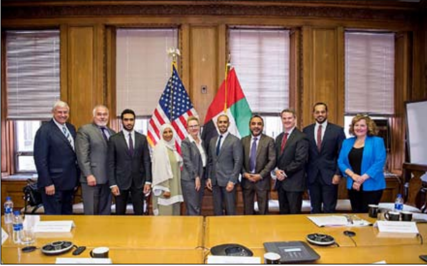
خلال ملتقىين للأعمال نظمهما مكتب «استثمر في الشارقة» بمدينة دبي بيتسبرغ ودرهام