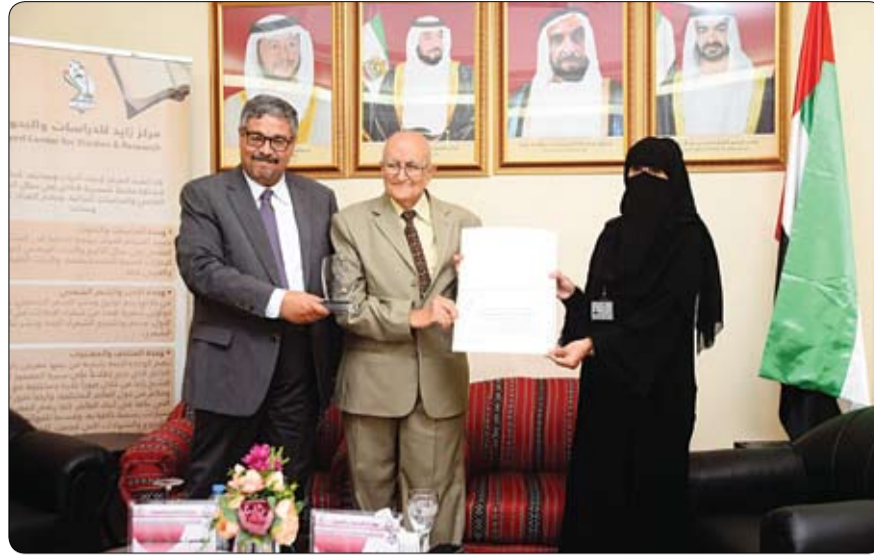
ضمن موسمه الثقافي