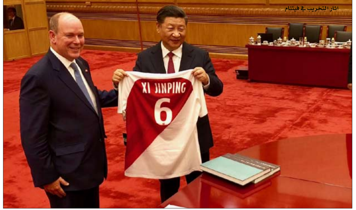
القوة الناعمة الصينية تزحف بهدوء