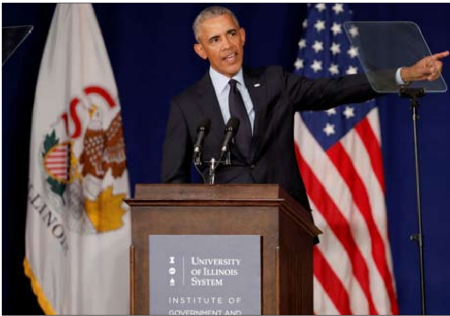
باراك اوباما نعمة الحلم الامريكى

ويمكن أن نشير أيضا إلى أسطورة في قلب القيم الأمريكية: الحلم الأمريكي، تلك الامكانية للبدء من الصفر والوصول إلى قمة الهرم الاجتماعي. وإذا كانت المسلسلات الدولية جيدة، ويتم إنتاجها في جميع أنحاء العالم، تبقى الولايات المتحدة إلى حد بعيد المرجع، مثل هوليوود في الإنتاج السينمائي. ولئن كانت أسس القوة الأمريكية الناعمة متينة، فإن نصيب السياسي لتأديب، مما يترك فرصة جيدة للاعبين مثل الصين وفرنسا، ولما لا الاتحاد الأوروبي.