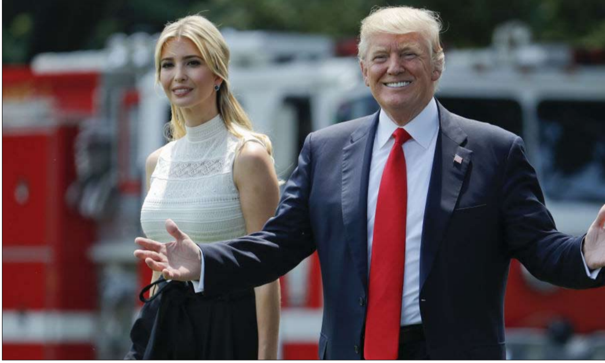
ترامب والقوة الناعمة اخر اهتماماته