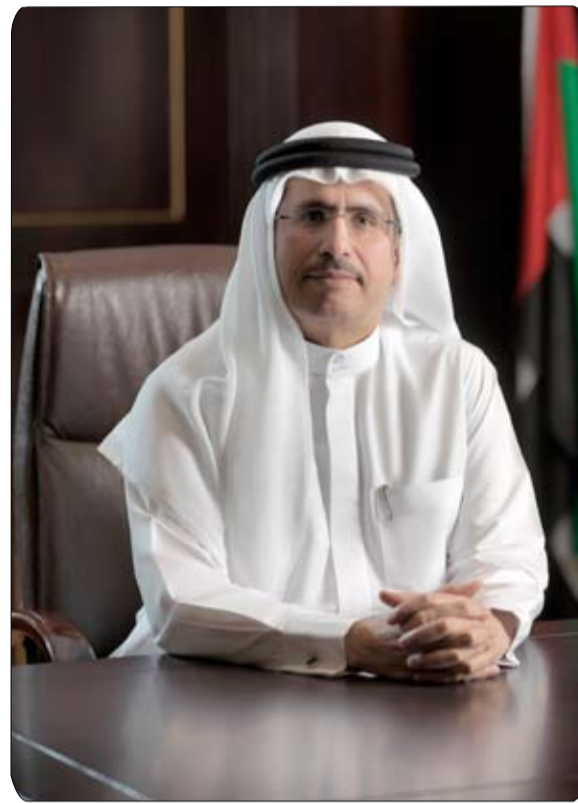
كهرباء ومياه دبي بكفاءة في الحفاظ على البيئة والتنمية

الكهربائية مجاناً وعبر محطاتها العامة حصرياً لغاية 31 ديسمبر 2019. ويهدفه المناسبة، قال سعادة سعيد محمد الطاير، العضو المنتدب والرئيس التنفيذي لهيئة كهرباء ومياه دبي، «مبادرة الشاحن الأخضر»، لمحطات شحن السيارات الكهربائية في سياق دعم مبادرة دبي الذكية التي أطلقها صاحب السمو الشيخ محمد بن راشد آل مكتوم نائب رئيس الدولة رئيس مجلس الوزراء حاكم دبي، لتحويل دبي إلى المدينة الأكثر والأسعد عالمياً وتعزيز مفهوم التنقل الأخضر. وتساهم المبادرة بفعالية في تحقيق رؤية الإمارات 2021 وخطة دبي 2021 التي تهدف إلى جعل دبي مدينة ذكية ومتكاملة ومتربطة ومستدامة بمواردها وذات عناصر بيئية نظيفة وصحية ومستدامة. وبالتالي، تساعد المبادرات الذكية