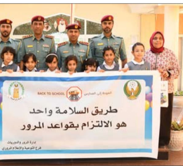
طالب أولياء المرور باصطحابهم للحفلات