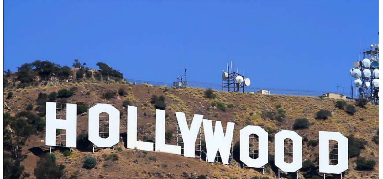
هوليوود من اهم اسلحة القوة الناعمة الامريكى