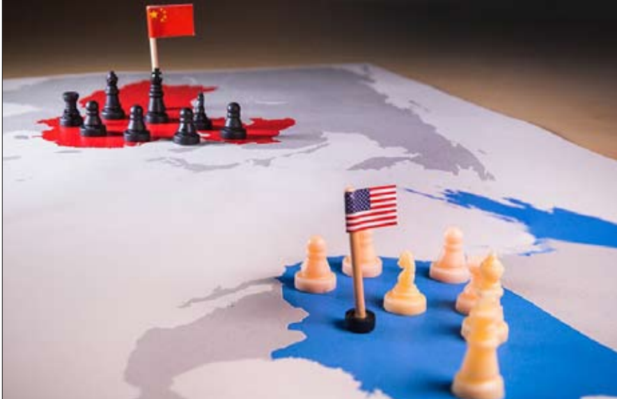
منافسة بين الصين والولايات المتحدة