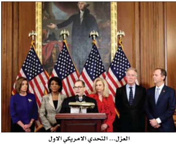
العزل... التحدي الأمريكي الاول

تعزيزات أمنية حول المصالح الأمريكية في الأردن عمان-وكالات: عززت السلطات الأردنية إجراءاتها الأمنية حول المصالح الأمريكية في المملكة، تحسبا لهجمات انتقامية، بعد اغتيال قائد فيلق القدس الإيراني قاسم سليماني، في غارة أميركية بالعراق. وكشفت مصادر أمنية تعزيز الحماية الأمنية حول الأماكن التي يوجد فيها زعماي الولايات المتحدة، خاصة السفارة في عمان، وبعض المناطق التي تضم خبراء عسكريين، إضافة إلى مقر المنظمات الأمريكية العاملة في مجال المساعدات الإنسانية، مثل الوكالة الأمريكية للتعاون الدولي، والتي تنتشر مقارها في العديد من المناطق الأردنية. كما عززت الأجهزة الأمنية حضورها حول المراكز التجارية الكبرى التي يرتادها أمريكيون والمقاررات الاستراتيجية. وحسب ما قال شهود عيان، فإن بعض الشوارع الموصلة للسفارة الأمريكية، شهدت انتشارا لعربات أمنية.