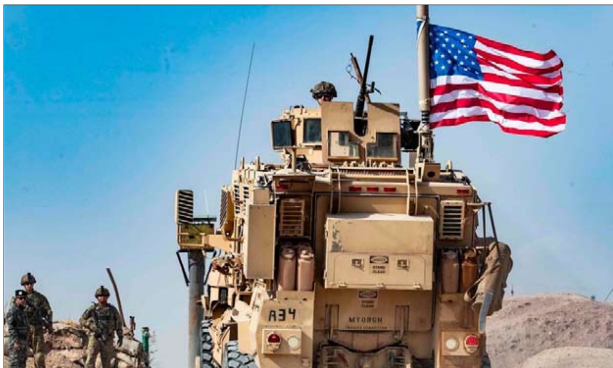
الانسحاب الأمريكي من الشرق الاوسط

ومع ذلك، في ضوء قمة السبع التي ستعظمها الولايات المتحدة في كامب ديفيد، يونيو 2020، أعلن دونالد ترامب أنه سيدعو الرئيس