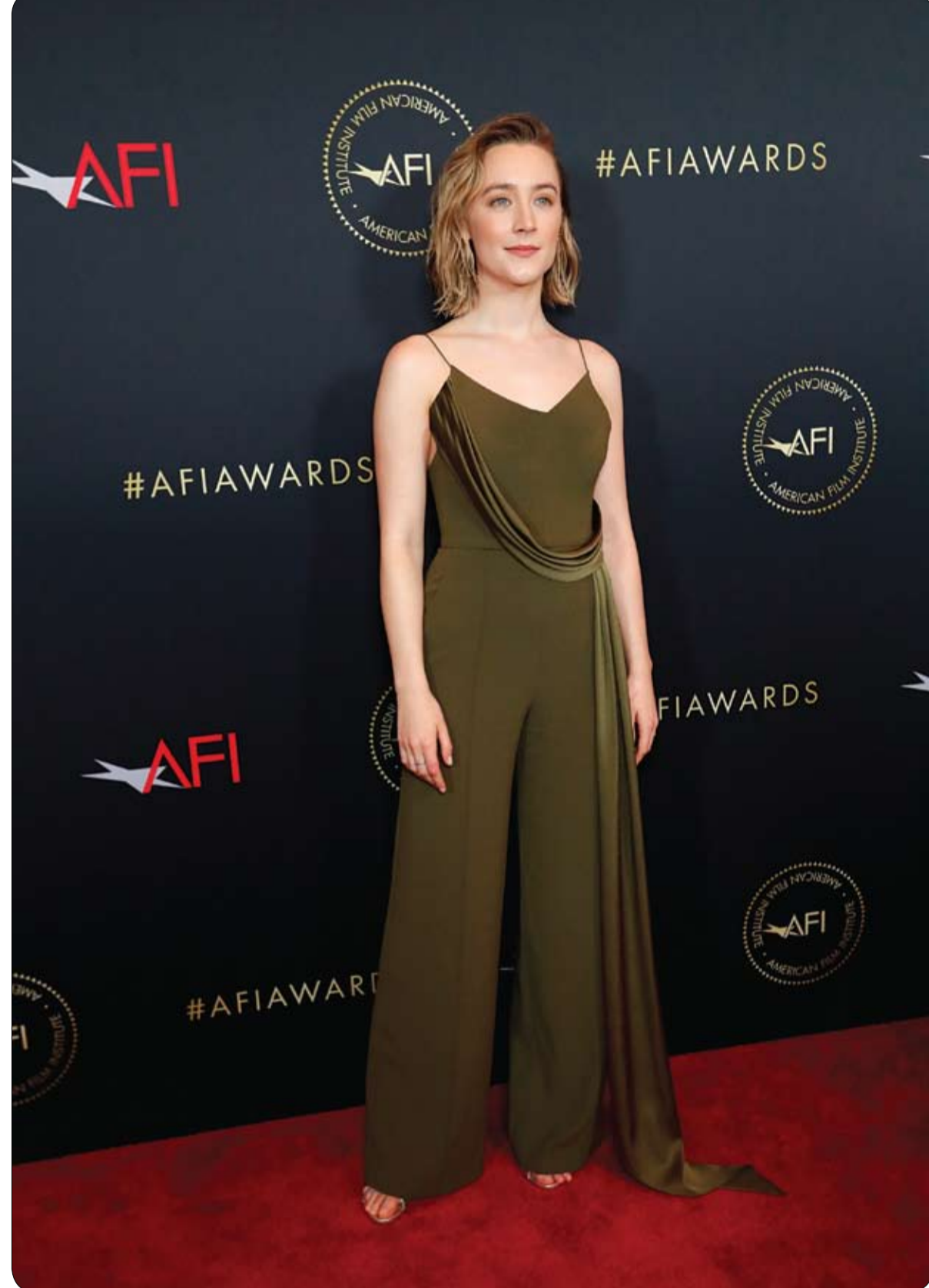
الممثلة ساويرس رونان خلال حضورها مهرجان الجوائز السنوية التاسع للأكاديمية الأسترالية لفنون السينما والتلفزيون AACTA في لوس أنجلوس.