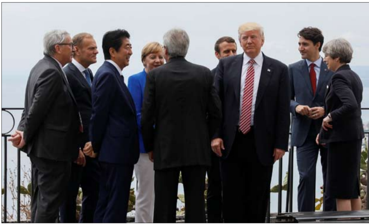
السياسة الخارجية ستعيق عن المشهد

وترك شبح تهديد تدخل عسكري ضد إيران يلوح في الأفق، منح الرئيس السابق نفسه صفة صقر قادر على الدفاع عن الحلفاء التاريخيين للولايات المتحدة، وذبح أعدائها التقليديين. ولكن هذا ليس سوى حراك للواجهة؛ واقع السياسة الأمريكية في المنطقة هو فك الارتباط، في العراق وسوريا وتركيا. وقد استفادت القوى الإقليمية استفادة كبيرة من الانسحاب الأمريكي، بدءاً من روسيا، التي أعادت بناء نفوذها في المنطقة خلال خمس سنوات.