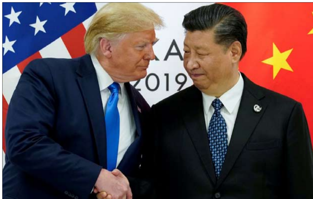
هل من سياسة جديدة تجاه الصين

السؤال هو معرفة ما إذا كانت هناك سياسة خارجية أخرى ممكنة تجاه الصين