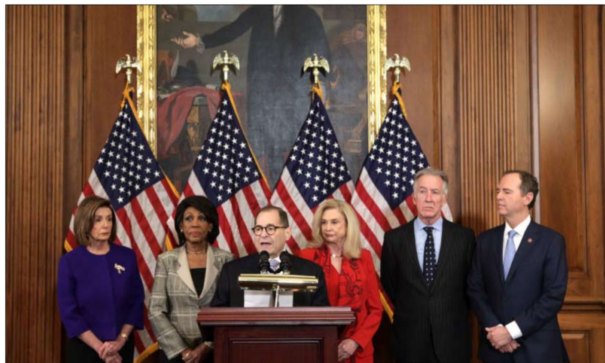
العزل التحدي الأمريكي الاول