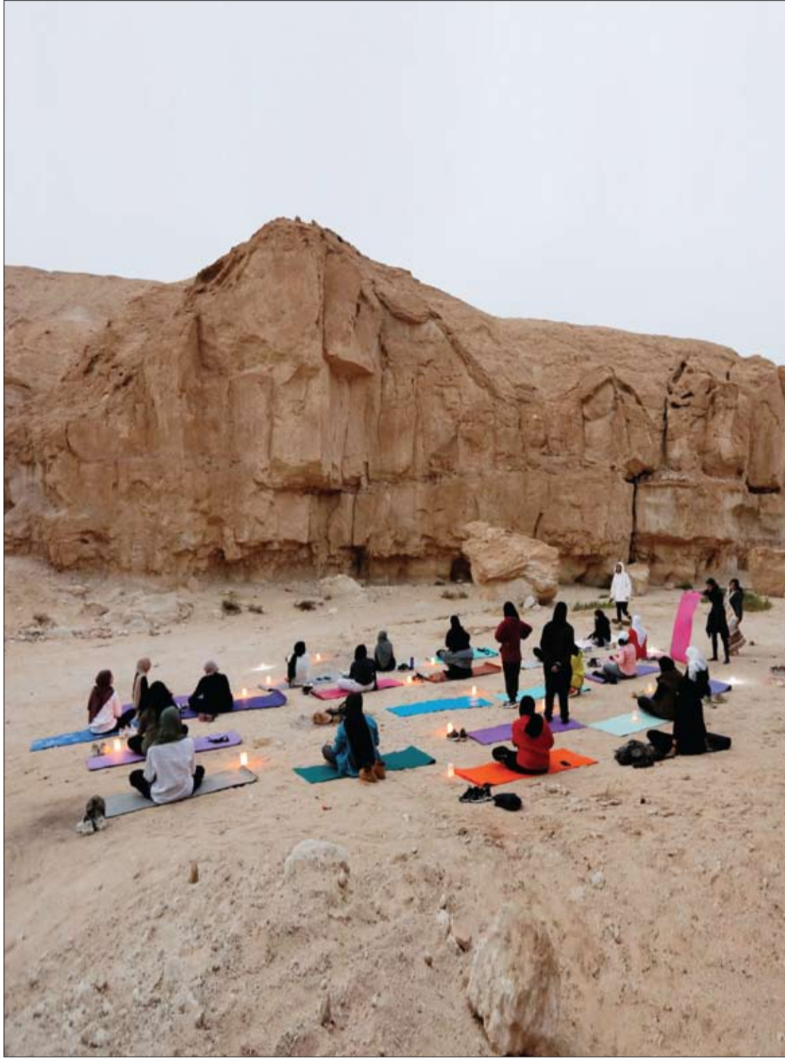
نساء سعوديات يمارسن اليوغا خلال رحلة يوغا إلى جبال الأحساء بالمملكة العربية السعودية.