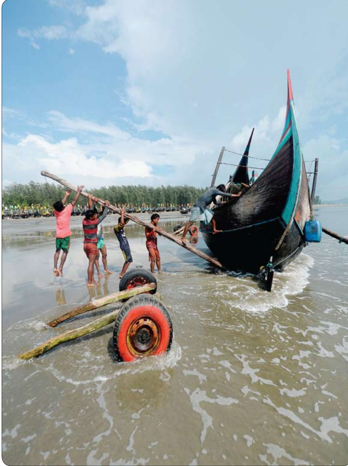
صيادون يسحبون قاربهم عند عودتهم بعد اصطياد السمك من خليج البنغال في كوكس بينجلاديش.

المكتئب له نمط حياة يضمن بداخله جميع السلوكيات الأضفة الذكر؛ كالانعزال، والغضب، وإهمال تفرّش الأسنان، والشخير، وغيرها من نوبات البكاء الطويلة، جميعها مسببات للأزمات القلبية بشكل مباشر، وفقًا لموقع جامعة هارفارد الأمريكية.