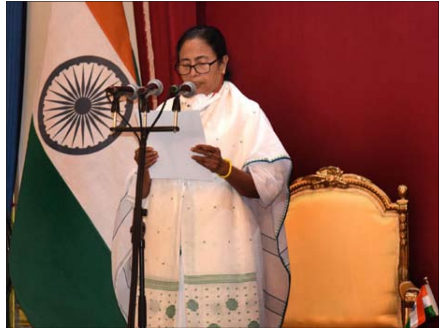
ماماتا بانيرجي رمز المعارضة

•• الفجر - خيرة الشيباني فشل الحزب الحاكم القوي في اختطاف ولاية البنغال الغربية من رئاسة حكومة تلك الولاية، مما يعزز مكانتها باعتبارها الشخصية المعارضة رقم 1. هل وجد ناريندرا مودي أخيراً خصماً في حجمه؟ بعد أن ألحقت هزيمة لاذعة بحزب الشعب الهندي، الحزب الحاكم، خلال انتخابات إقليمية، في بداية مايو، تبرز ماماتا بانيرجي، 66 عاماً، كبطلية، للمعارضة الراكدة من البلاد. ففي ولاية البنغال الغربية، التي تحكمها منذ عام 2011، أقامت حصناً حقيقياً ضد القوميون الهندوس، بقيادة رئيس الوزراء.