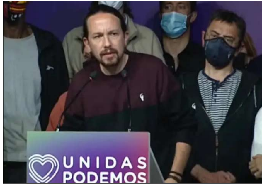
بابلو إغليسياس لعب دوره في فشل اليسار