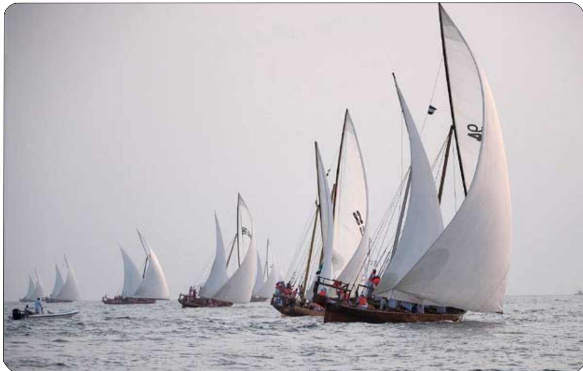
الظفرة بتنظيم نادي أبوظبي بالشراكة مع لجنة إدارة التراثية في أبوظبي ومجلس للرياضات الشراعية واليخوت