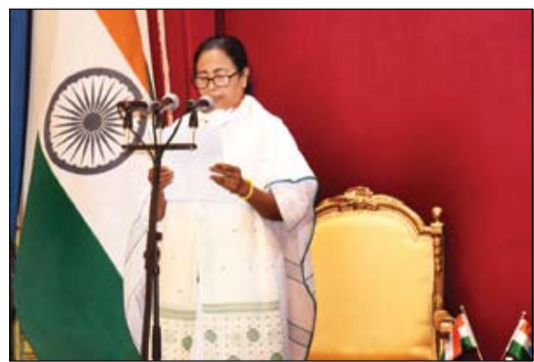
ماماتا بانيرجي رمز المعارضة

لقد واجهت ديدي (الأخت الكبرى باللغة البنغالية) من قبل أنصارها، ونمرة البنغال من قبل خصومها، بحكمة وحماس الآلة الانتخابية الهائلة لحزب بهاراتيا جاناتا. بعد إصابته في بداية الحملة، جابت الاجتماعات والتجمعات على كرسي متحرك بدم في الجبس، بقدمي الوحدة الصالحة، سأخرج حزب بهاراتيا جاناتا من اللعبة.