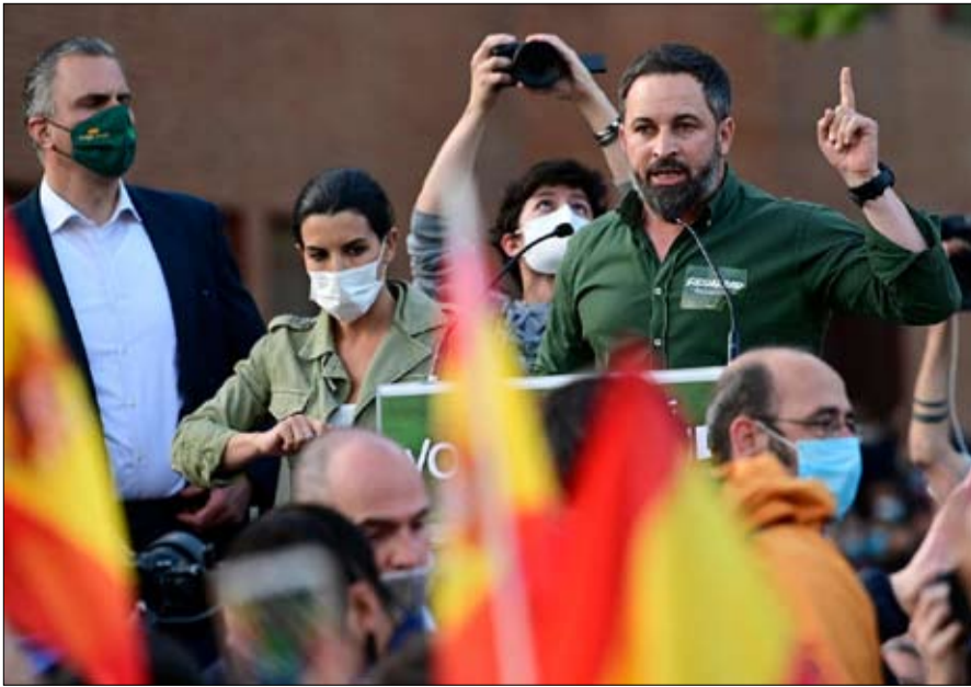
فوكس اليمين المتطرف رقم في العادة