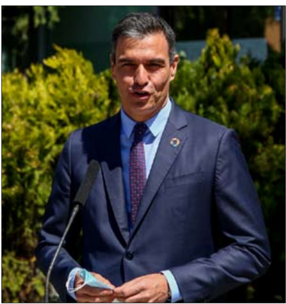
رئيس الوزراء بيدرو سانشيز يواجه مشكلة