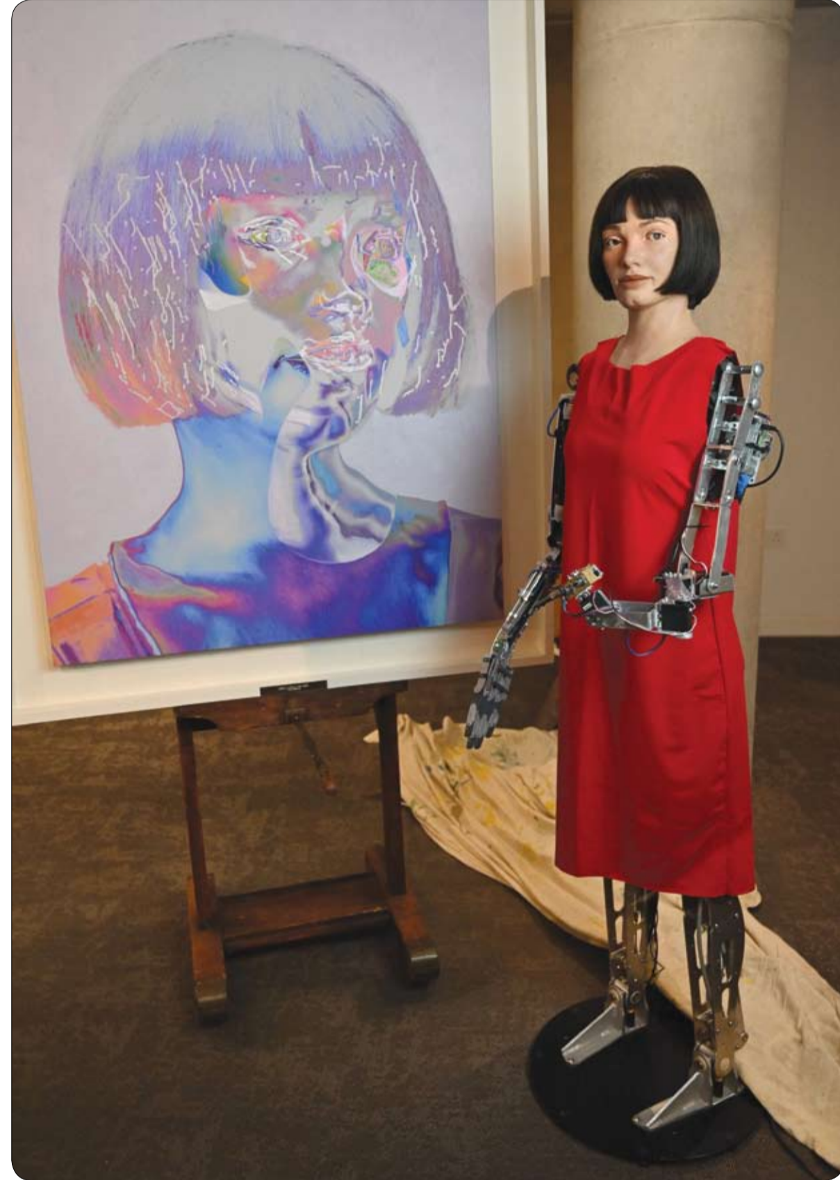
Ai-Da أول فتاة روبوت تتمتع بذكاء اصطناعي فائق الواقعية في العالم ويمكنها الرسم والتلوين، تم تصويره جنباً إلى جنب مع صورتها الذاتية في متحف التصميم في لندن.

وتمكن الأطباء من زراعة قلب صغير للطفلة كان قد توقف عن النبض في جسد متبرع يحمل فصيلة دم مختلفة. وقال خوان ميغيل خيل خاورينا، رئيس قسم جراحات قلب الأطفال في مستشفى مدريد: "السحر أصبح سحريين"، موضحاً أن هذه التقنيات لم تكن موجودة في جراحات الأطفال الصغار منذ ثلاث سنوات كما لم تستخدم من قبل مطلقاً مع طفل رضيع صغير الحجم.