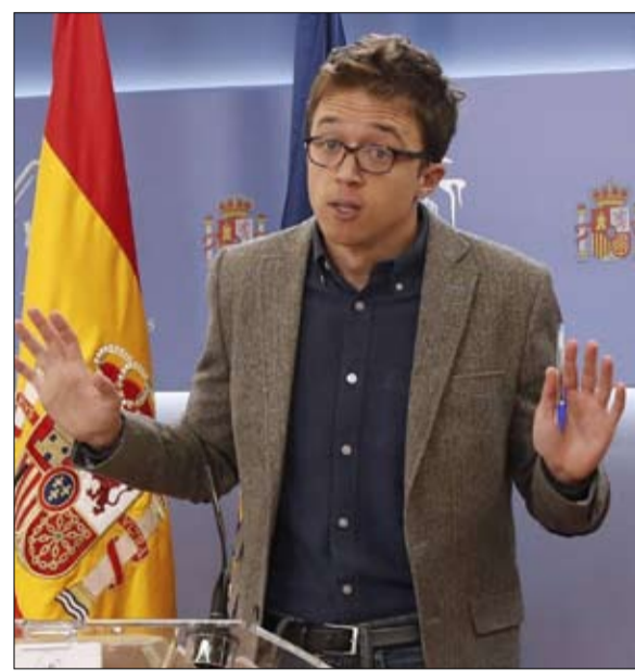
إينيفو أريجون نقل الانقسام الى صفوف اليساريين

استغل المستشار (الوزير الإقليمي) المسؤول عن الصحة منصبه لتطعيم ضد كوفيد-19 - متجاوزاً شروط السنّ - خشيت إيزابيل دياز أيوسو، التي تحكم من خلال تحالف مع الوسط في مدريد، من أن تكون زمام المبادرة من خلال حل البرلمان والانفصال عن شريكها الوسطي. علماً أن العلاقة مع نائب رئيسها إغناسيو أغوادو كانت سيئة جداً. لم يكن هذا مجرد صراع فضائل، بل هناك رهان وطني وراء هذه الحوادث الاشتراكية للإطاحة بالحكومات الإقليمية المحافظة. فبالإضافة إلى قضاة للسلطة الإقليمية للحزب الشعبي واطهار زلته السياسية، كان الحزب الاشتراكي - ونعني بيدرو سانشيز - يأمل في رسم تطور استراتيجيته السياسية، فمن خلال اقتراح اتفاقات محلية على الوسطيين، فهو يدعوهم إلى ان يصحوا لخطته القادمة لكي ينسى شعور القلق والتقدم. ومن الواضح أن الوجدان سيكون محفوظاً بالمخاطر