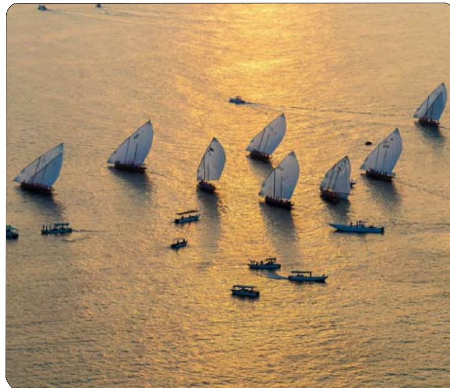
ويقيم "مهرجان دلما التاريخي الرابع" تحت رعاية كريمة من سمو الشيخ حمدان بن زايد آل نهيان ممثل الحاكم في منطقة الظفرة بتنظيم نادي أبوظبي بالشراكة مع لجنة إدارة التراثية في أبوظبي ومجلس للرياضات الشراعية واليخوت

أبوظبي-وام: أعلن نادي أبوظبي للرياضات الشراعية واليخوت أمس تأجيل موعد انطلاق نسخة الرابعة من "سباق مهرجان دلما التاريخي" للمحامل الشراعية لمدة 24 ساعة ليقام غدا الخميس بدلاً من اليوم الأربعاء، وذلك بناءً على تقرير المركز الوطني للأرصاد الذي أكد تعذر إقامة السباق صباح الغد بسبب بظء الرياح. وتحدد حالة الطقس وسرعة الرياح إمكانية إقامة سباقات المحامل الشراعية التي تعتمد دوماً في تحريكها على اتجاه الرياح. وكان نادي أبوظبي للرياضات الشراعية واليخوت قد أعلن أن اليوم الأربعاء سيكون موعداً لإقامة نسخة الرابعة من سباق دلما التاريخي، كما أعلن عن تحديد يومي الخميس أو الجمعة المقبلين