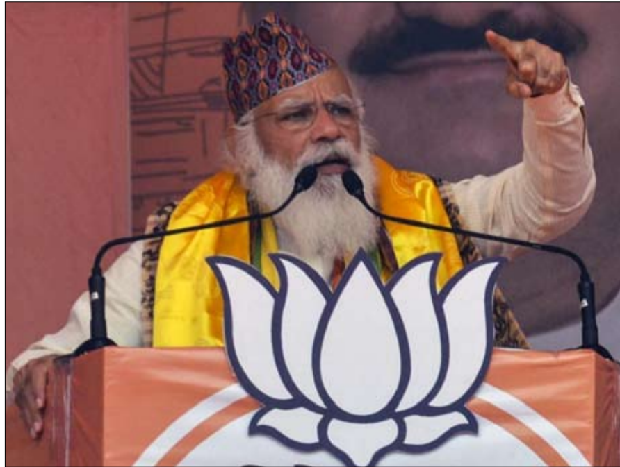
ناريندرا مودي سيد الهند يجده منافسا

مؤتمر ترينامول هذا الضعف، وتزداد هذه الاستراتيجية فعالية مع تنامي الغضب ضد رئيس الوزراء. بالنسبة للكثيرين، أدى تراخيه إلى الموجة الثانية المروعة من كوفيد-19 التي تعصف بالبلاد. وقد ظهر على الشبكات الاجتماعية، هاشتاغ «مودي استقل». وقالت الكاتبة أرونداتي روي، في صحيفة الغارديان البريطانية اليومية، غاضبة: «لقد خذلتنا الحكومة»، واصفة الوضع بأنه «جريمة ضد الإنسانية».