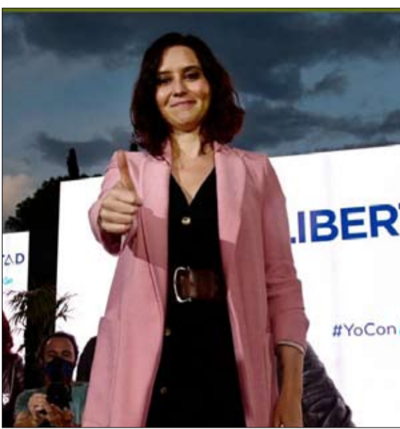
إيزابيل دياز أيوسو نجمة اليمين الإسباني