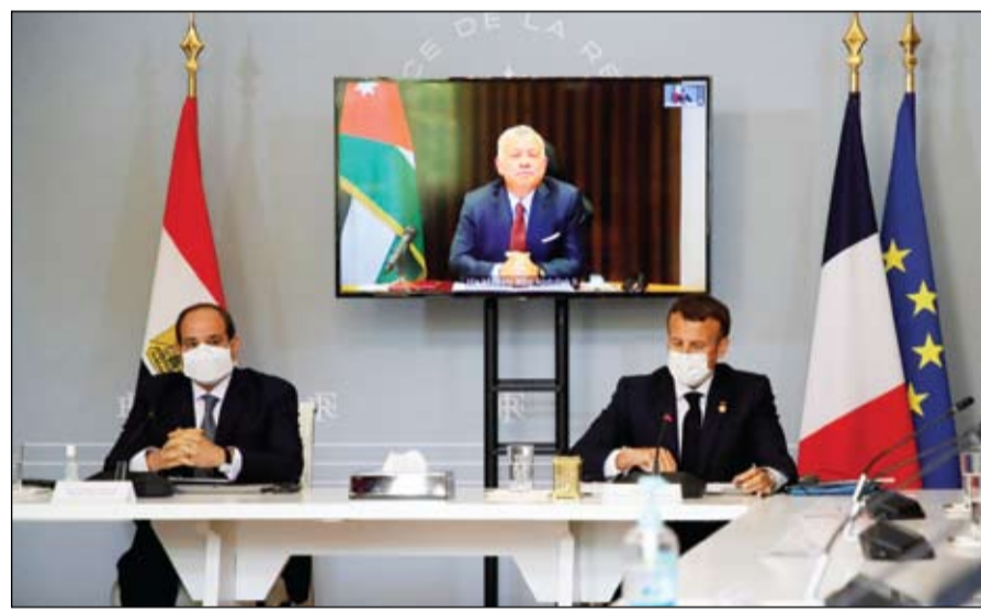
الرئيسان المصري والفرنسي خلال قمة شارك فيها عبر الفيديو عاهل الأردن

المصري في القمة الثلاثية بشأن تطورات الأوضاع في الأراضي الفلسطينية، التي عقدت بعد ظهر امس بقصر الإليزيه في باريس بمشاركة الرئيس الفرنسي إيمانويل ماكرون، والعهال الأردني الملك عبد الله الثاني بن الحسين للعمل على اقتراح ملموس لوقف إطلاق النار والتوصل الى حوار بين الفلسطينيين والإسرائيليين. هذا وتصاعدت حدة القصف المتبادل على جانبي الحدود مع قطاع غزة، مع تأكيد وزير الدفاع الإسرائيلي بأن الحرب مستمرة، فيما شهدت الضفة الغربية احتجاجات وصلت حد الاشتباكات المسلحة بين مسلحين فلسطينيين والقوات الإسرائيلية في بيت إيل. تفصيلا، أفادت مصادر