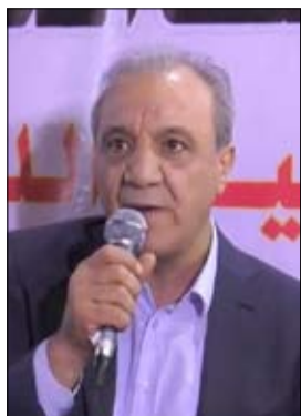
•• رام الله-وكالات

بعد ساعات من كشف اللقاء بين وزير الخارجية الإسرائيلي يائير لبيد ورئيس جهاز المخابرات الفلسطينية، ماجد فرج، أصدرت وزارة الخارجية والمغتربين في الحكومة الفلسطينية في رام الله، بياناً، تهاجم فيه بشدة السياسة الإسرائيلية، ونعتها بالتخريب وإغلاق آفاق السلام. وقالت الخارجية، إن "أركان الائتلاف الإسرائيلي الحاكم تبرر موقفها الدمر للمعلمية السلمية، بنزعية ضعف تركيبة الحكومة الإسرائيلية وهشاش الائتلاف، وعدم قدرته على تحمل تبعات دفع استحقاقات السلام مع الجانب الفلسطيني. ولكنها في الوقت ذاته، تستكمل إجراءاتها على الأرض لإحداث تغييرات جوهرية في واقع