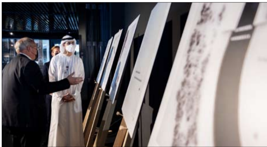
وتعد تجربة الطعام المعد بتكنولوجيا ليتوانيا، فمن خلال ضخمة زر واحد في الطباعة ثلاثية الأبعاد، يحصل الزائر على وجبة خفيفة متميزة أخرى يقدمها جناح

متميزة مدعومة بالتكنولوجيا، تنقل الزائر بين أشهر الأماكن وصولا لمناطق من البلاد لم تطأها قدم إنسان، كما تعرف من خلال هذه التجربة الافتراضية على معالم الثقافة الثرية لمجتمع ليتوانيا، تتضمن الفن الحديث والتقليدي، والمؤتمرات العلمية، والفرص السياحية وغيرها من المجالات. وأشاد عمر سلطان العلماء بجمالية تصميم جناح ليتوانيا والتجارب الاستثنائية التي يقدمها للزوار، والتي تمكنهم من التعرف بصورة شاملة على مختلف جوانب النشاط الإنساني بطريقة مبتكرة وإبداعية، وشكر القائمين على الجناح على حسن التنظيم والتجربة المتميزة التي يقدمونها للزوار. ويعكس جناح ليتوانيا فن العمارة الذي يتخذ الانفتاح على الإبداع والاستدامة والابتكار شعارا، أسلوب عمارة مبتكر يزاوج بين التقليدي والحداثي، بتصميم خارجي ملفت يركز على هيكل خشبي مزين