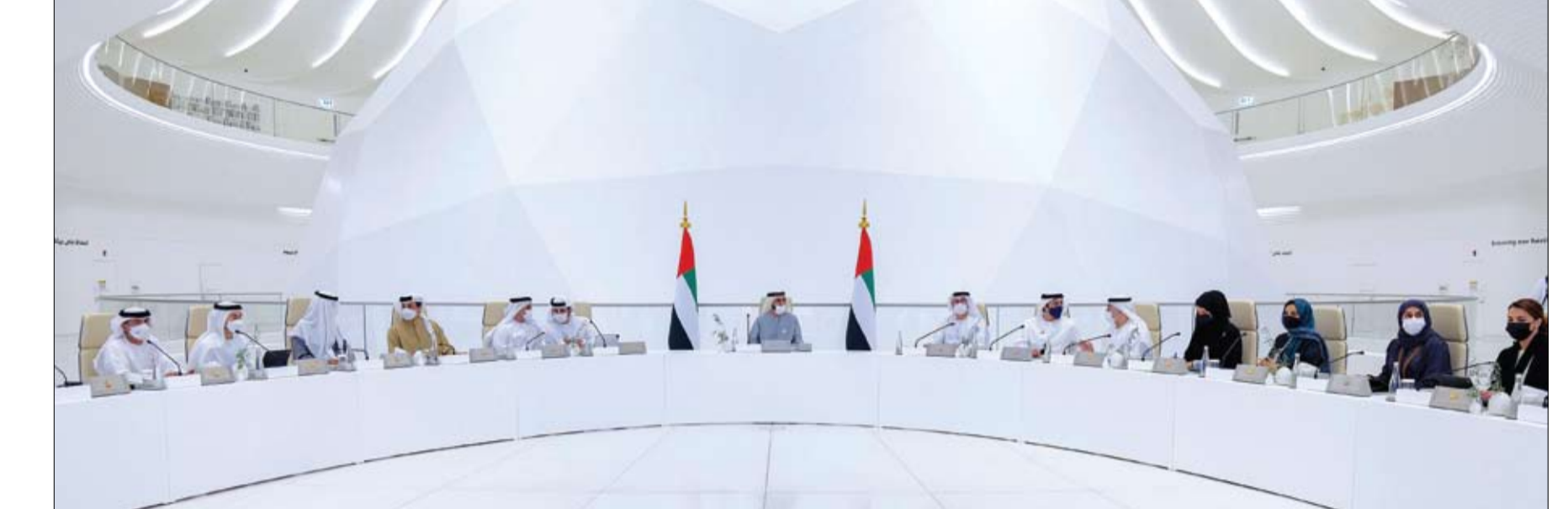
محمد بن راشد خلال ترؤسه اجتماع مجلس الوزراء في إكسبو 2020 دبي (وام)

أرسل القمر الاصطناعي النانوي ديو سات 1 الذي أطلقت هبته كهياء ومياه دبي مساء أمس الأول أولى إشارات من الفضاء، ومن المقرر أن يستقر في مداره المنخفض حول الأرض على ارتفاع يتراوح بين 525 و530 كيلومتراً ويدير بسرعة نحو 7.5 كيلومترات في الثانية أي أنه سيكمل دورة كاملة حول كوكب الأرض كل 90 دقيقة. وأوضح معالي سعيد محمد الطاير العضو المنتدب الرئيس التنفيذي لهيئة كهرباء ومياه دبي أن ديو-سات 1 قمر اصطناعي نانوي من نوع 3U تم إطلاقه ضمن برنامج الهيئة للفضاء سبيس دي بهدف تعزيز عمليات الهيئة وتحسين صيانة وتخطيط شبكات الكهرباء والمياه بالاعتماد على الأقمار الاصطناعية النانوية وبالاستفادة من تقنيات الثورة الصناعية الرابعة بما في ذلك انترنت الأشياء والذكاء الاصطناعي والبلوك تشين وتبادل المعلومات عبر الاتصالات الفضائية وتقنيات مراقبة الأرض والاستشعار عن بعد. (التفاصيل ص3)