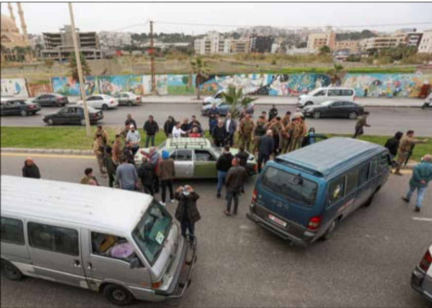
في مناطق المدنيين أو قريبها، سرب حزب الله روايات عدة عما جرى، حيث ذكر مصدر أمني لبنان مقرب من الميليشيات أن ما حصل هو حريق اندلع في مودل كهربائي، وطال خزائناً للمحروقات. وقصة اندلاع حريق في مودل كهربائي نفسها استخدمت أيضاً في الحديث عن الانفجار الذي وقع قبل فترة في موقع لحركة حماس

انفجار جديد شهده جنوب لبنان وقع بين بلدتي حومين ورومين شمال مدينة النبطية، وهو ثاني انفجار يقع خلال فترة قريبة بعد انفجار وقع الأسبوع الماضي في موقع ميليشيا حزب الله في الجبال المحيطة ببلدة جنتا البقاعية، وهو ليس الانفجار الأول الذي يقع في الجنوب، ففي السنتين الماضيتين وقعت تفجيرات متعددة في بلدات جنوبية، اثنين منها في بلدة عين قانا، أي تدمير مخازن صواريخ "دقيقة" للميليشيات. وحسب مصادر موقع 24 في المنطقة، فإن الانفجار وقع في مكان بعيد عن المنازل، وشوهت سحب الدخان تنظلي سماء المنطقة مع سلسلة انفجارات، وانتشر عناصر حزب الله في المكان، حيث دخلت سيارات إسعاف تابعة لما يعرف بـ "الهيئة الصحية" التي تملكها الميليشيات،