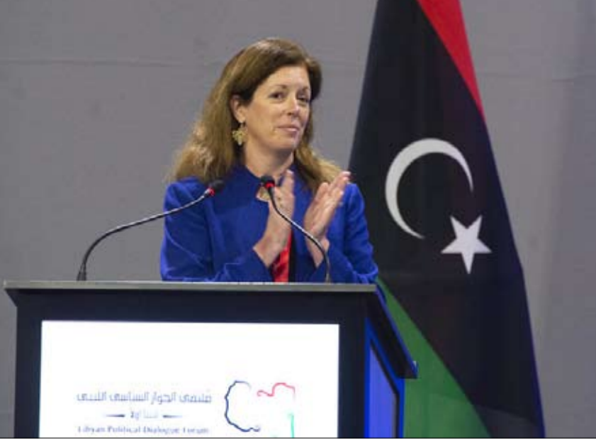
زهان على الدور العربي

على الدور العربي لسانده في إنجاز الانتخابات الرئاسية والبرلمانية المتأزمة والتي تم إرجاؤها الشهر الماضي، للخروج من حالة الفوضى والانقسام التي تعيشها ليبيا. وقد وعدت لقيح موجود في نهر بالمنطقة يعرف باسم نهر بلدة عزرة في وادي حومين، ما تسبب باتساع رقعة الحريق لتشمل مناطق إضافية