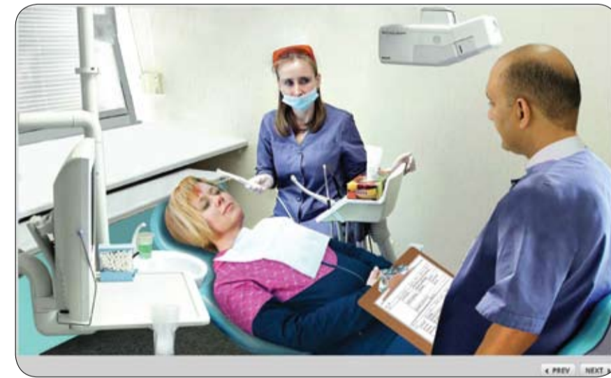
نقلة نوعية في تعليم طب الأسنان بجامعة الخليج الطبية