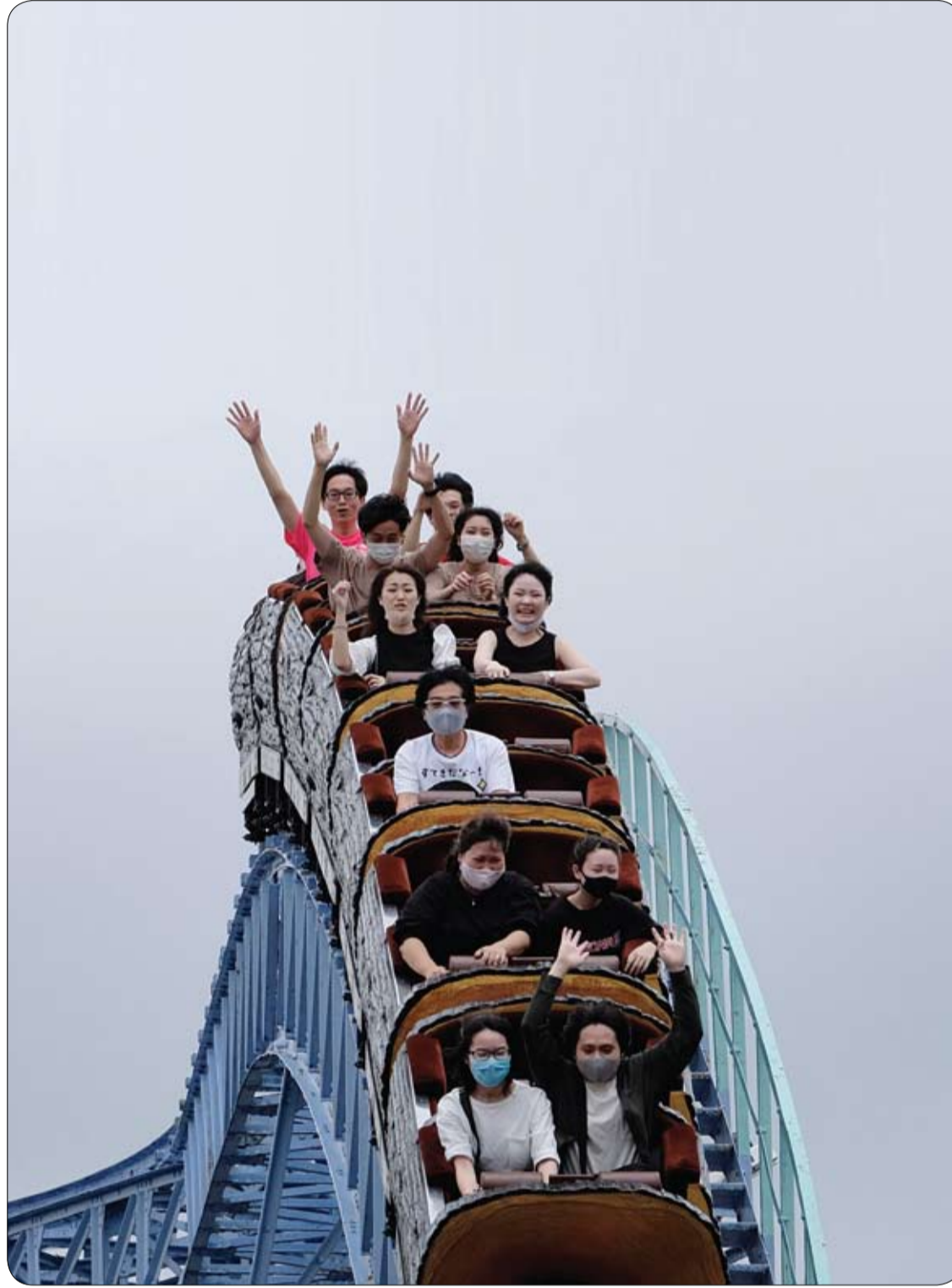
زوار يستمتعون في الأفعوانية في متنزه توشيمان الترفيهي في طوكيو.

الحفاظ على مستوى الكوليسترول في الدم من عوامل الوقاية من مضاعفات السكري. استبدل الأطعمة الكربوهيدراتية، وتناول الخضروات والفواكه الطازجة.