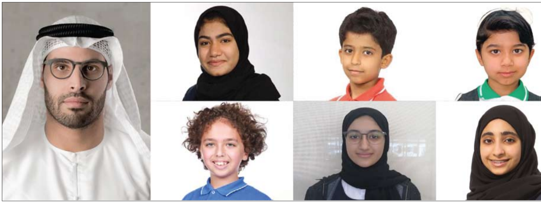
برئاسة محمد خليفة المبارك