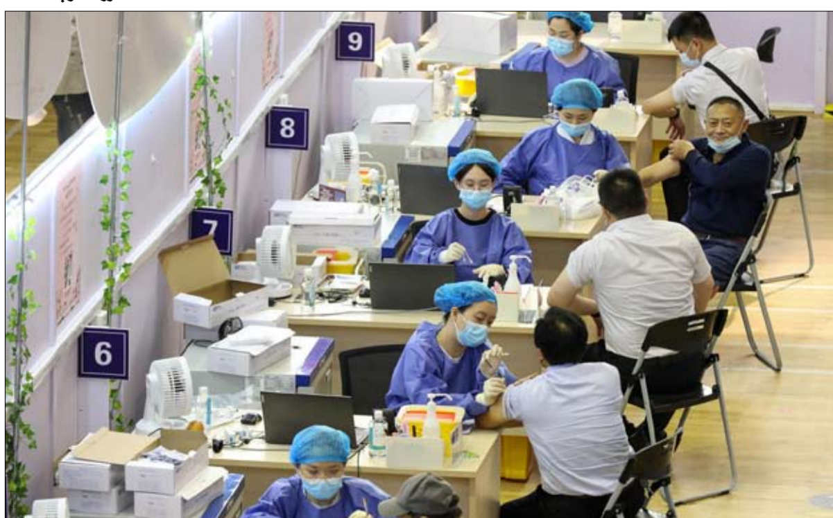
حملة تلقيح ضخمة

والجذر والتوصيات الجديدة من الخبراء الصينيين أشار جياو فو، رئيس مركز مكافحة الأوبئة الصينية، في مؤتمر صحفي يوم 12 أبريل إلى أن اللقاحات الصينية لم تكن فعالة بما يكفي. وتسبب هذا البيان في ضجة كبيرة في الصحافة الدولية، مما دفع جياو لاحقاً إلى الإدعاء بأن كلماته