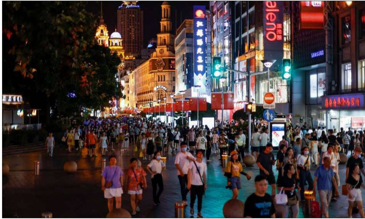
التردد في فرض اللقاح في الصين