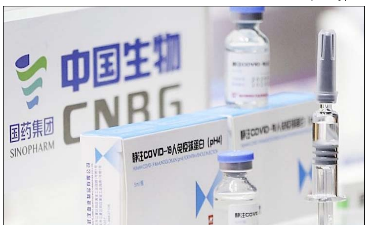
طاقة إنتاج من الجرعات تفيض على حاجيات الصين