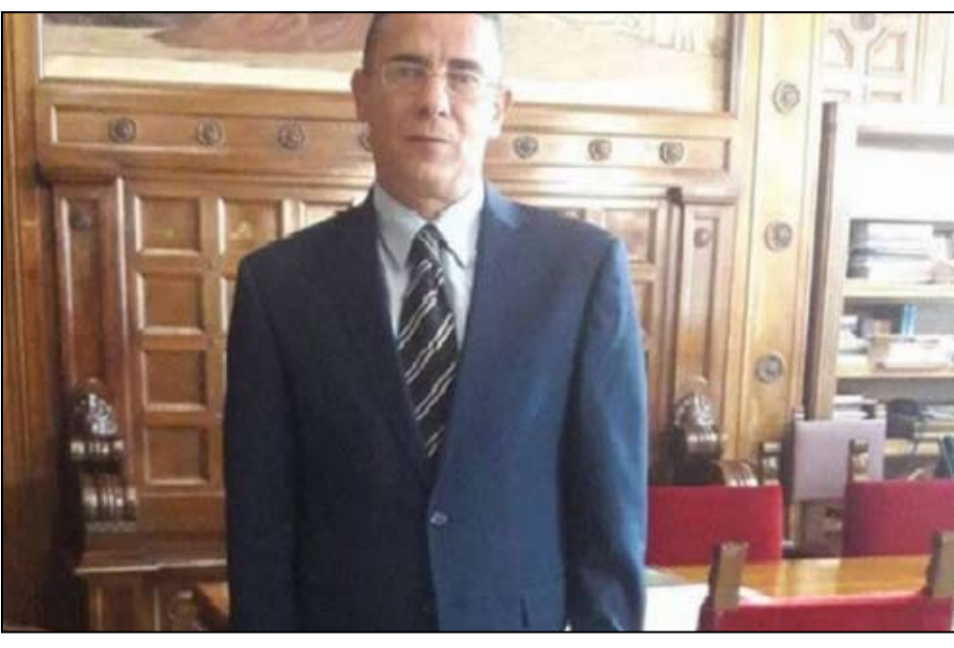
محسن الدالي الناطق الرسمي باسم المحكمة الابتدائية بتونس والقطب القضائي

أذن يوم 29 يوليو وكيل الجمهورية للمحكمة الابتدائية بتونس، بفتح بحث تحقيقي في خصوص شكاية تقدمت بها نقابة الامن الجمهوري واعوان مصلحة الأبحاث بمطار