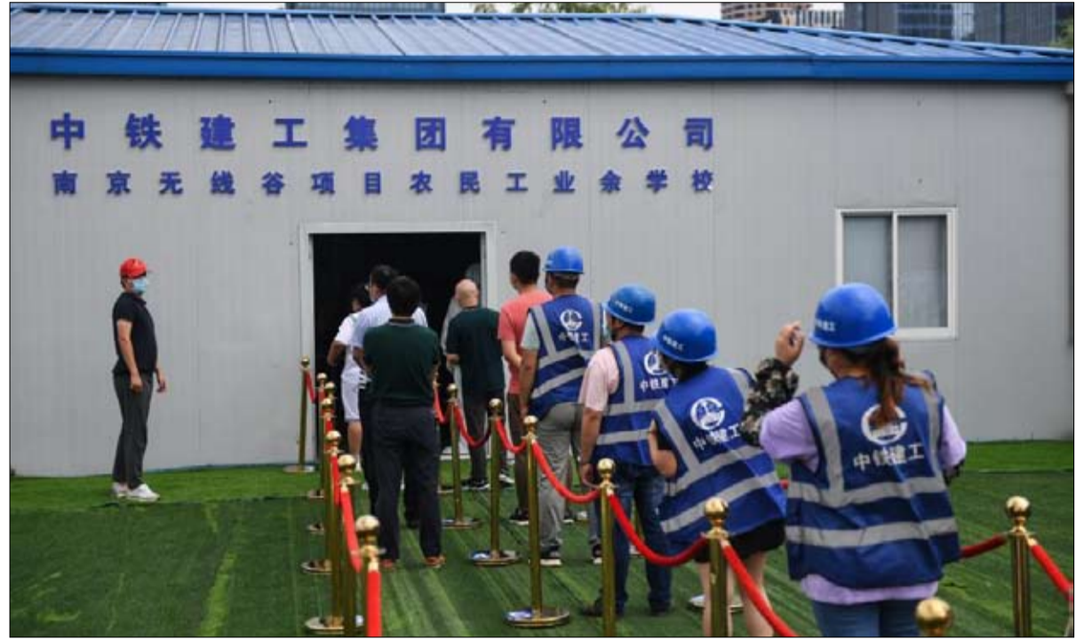
الهدف مناعة القطيع

أوقفها الحكومة، التي لا ترغب في هذه المرحلة، إشارة جدل لا داعي له. وقال مسؤولو الصحة الصينيون إن التطعيم يجب أن يكون "مستثيراً ومقبولاً وطوعياً".