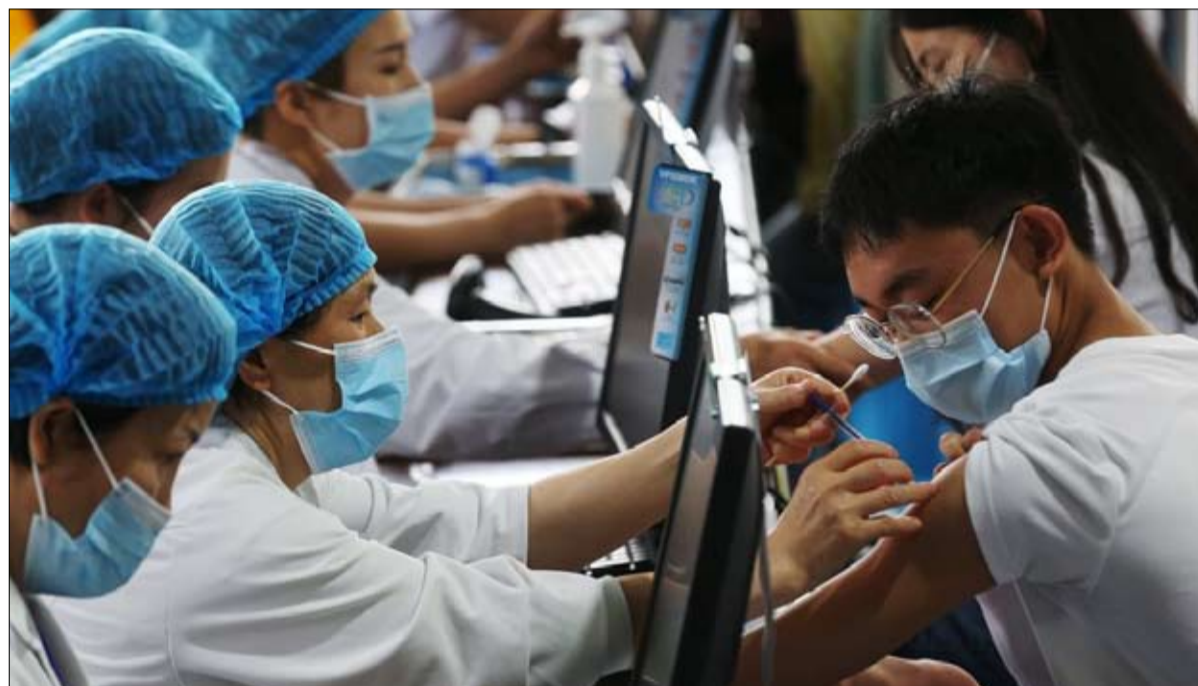
تطعيم طلاب المدارس الثانوية في منطقة تشيانجيانغ في تشونغتشينغ.

تعتمد على الحمض النووي الريبي المرسال. بالإضافة إلى ذلك، بدأت المرحلة الثالثة من التجارب السريرية لأول لقاح صيني للحمض النووي الريبي المرسال في أبريل 2021. وهو لقاح تم تطويره بشكل مشترك