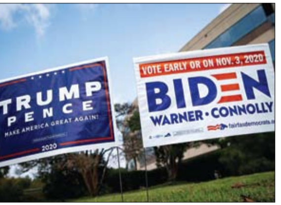
عوامل عديدة تحكم نتيجة السباق