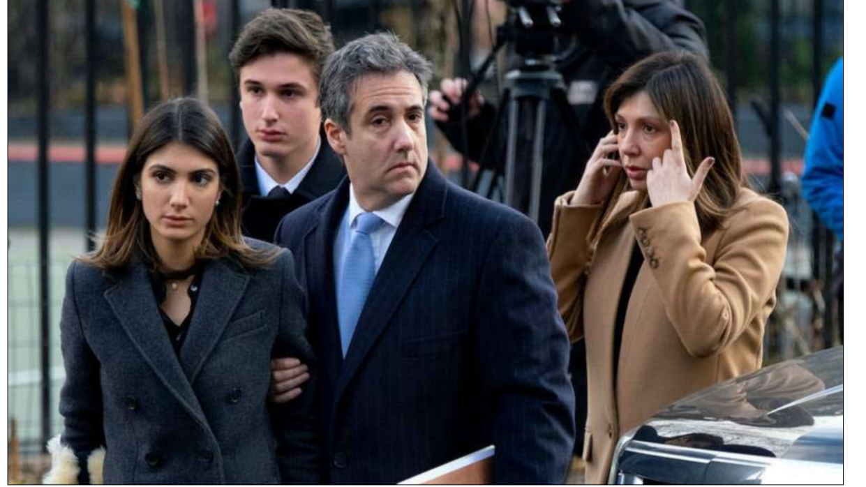
كان مايكل كوهين على تواصل مباشر مع الكرملين