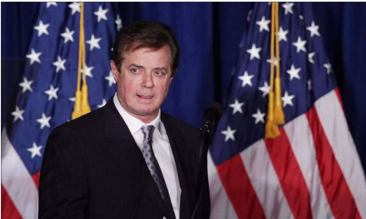
بول مانافورت... اتصالات مباشرة مع المخابرات الروسية

تقرير حديث يتحدث عن عدد لا يحصى من الاتصالات المباشرة بين مقربين من ترامب والمخابرات الروسية