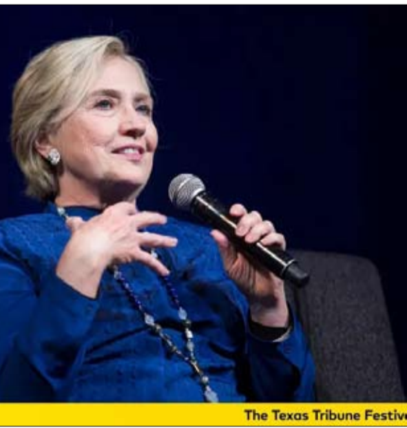
سبق ان توقعوا هزيمة هيلاري عام 2016

جون أنتوناكيس، لكن الحقيقة هي أن خطابه كان ناجحاً إلى حد ما، وأنه كان قادراً على عكس درجات اليمين الديني والمؤيد للسلاح. على مدار 484 جملة في خطابه، استخدم الجمهوري 269 عنصراً من "الخطابة الكاريزمية"، مقارنة بـ 155 فقط لثانسه الديمقراطي، الذي نطق 298 جملة فقط، وهكذا حصل الرئيس على درجة كاريزما نسبية تبلغ