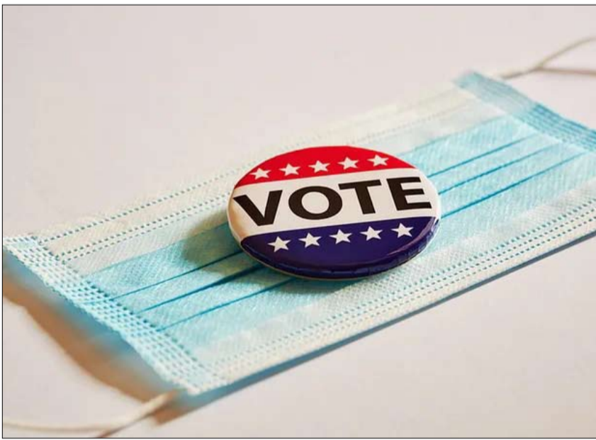
قد يكون لوباء كورونا تأثيره