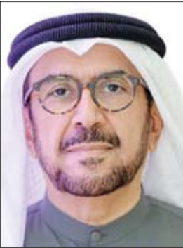
العين - الفجر

في اجتماعه الأول للعام الدراسي الجديد، برئاسة معالي سعيد أحمد غياش الرئيس الأعلى لجامعة الإمارات وافق مجلس الجامعة على تعيين عمداً جدد لكليات الهندسة والطب والعلوم الصحية والعلوم كما اعتمد المجلس في اجتماعه الذي عقد عبر الفيديو برنامج بكالوريوس وماجستير مسرع جديد في التربية «التخصص: التربية الخاصة» والذي يسمح للطلاب ذوي الأداء العالي بالحصول على درجة البكالوريوس والماجستير بعد 5 سنوات. كما اطلع المجلس