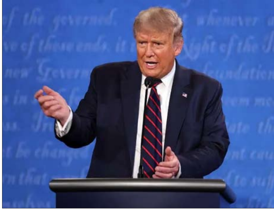
ترامب... معيار الكاريزما في صاحبه