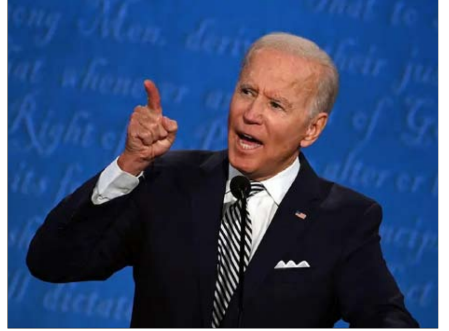
بايدن... حضور باهت على الوب

الأربعاء، تبرأت فيه من كل الحوارات مؤكدة رفضها القاطع التعامل مع الطرف الآخر، في تحد واضح لجهود الأمم المتحدة، وهو ما يطرح تساؤلات عن سبل تنفيذ أي اتفاقيات قد يتم التوصل إليها بين الأطراف المتحاربة، على الأرض. فقد أعلنت غرفة عمليات سرت الجفرة التابعة لقوات الوفاق والتي تسيطر على جزء من وسط ليبيا، رفضها لمخرجات "أي مؤتمر خارج ليبيا لا يلبى أهداف ثورة فبراير"، مشددة على أنها "لا تقبل الحوار مع من وصفها بالأمس بالإرهابيين مهما كانت الدوافع"، في إشارة إلى القائد العام للجيش الليبي خليفة حفتر. كما أكدت في بيان مصور، أنها لن تقبل "أن تكون مدينة أخرى غير طرابلس عاصمة لليبيا"، مشددة على أن "أي حوار ليبي يجب أن ينطلق من الاستفتاء على الدستور وإجراء انتخابات فقط،.