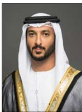
عبدالله بن طوق

مساعدة المتعاملين في التغلب على التحديات، والاستفادة من التقنيات الرقمية في التعامل مع الأفراد والمؤسسات لتحقيق التوجه الذي يرتقي بالمجتمع وفي جميع الخدمات بما يضمن الاستعداد بشكل استراتيجي للمخمين سنة القادمة». ومن جانبه أعرب سعادة عبدالله ناصر لوتاه، المدير العام لهيئة الاتحادية للتنافسية والإحصاء عن بالغ شكره إلى كافة الشركاء الاستراتيجيين في الجهات الحكومية والمحلية ومراكز الإحصاء الوطنية والشركاء من القطاع الخاص على ما يبذلونه من جهود وما يبديونه من تعاون لتعزيز تنافسية الدولة وتقديمها في جميع المؤشرات والتقارير العالمية، ورفع اسم دولة الإمارات عالمياً في المحافل الدولية بقوله: «تولي حكومتنا الرشيدة في دولة الإمارات أهمية كبرى لدور الشراكات الفعالة بين كافة الجهات الحكومية الاتحادية