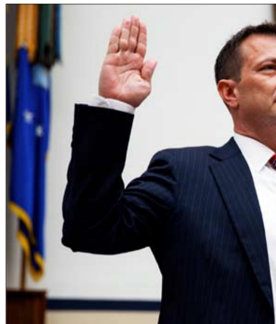
يتساءل بيتر سترزوك عما إذا لم يكن ترامب تحت تأثير موسكو

مانافورت في فريق الحملة وقربه من ترامب، منح أجهزة المخابرات الروسية فرصا للتأثير على حملة ترامب والحصول على معلومات سرية... وكان محامي دونالد ترامب في ذلك الوقت،