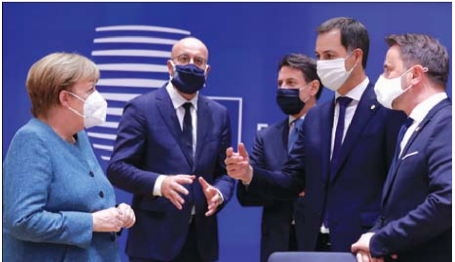
قادة أوروبا يناقشون القضايا المشتركة قبيل بدء اجتماعهم في بروكسل (رويترز)

دعم أوروبي كامل لليونان وقبرص ضد تركيا بروكسيل-وكالات: أعلن رئيس المجلس الأوروبي شارل ميشيل، أمس الخميس، التضامن الكامل مع اليونان وقبرص في قضيةهما حول المتوسط مع تركيا، مشدداً على أن القمة التي بدأت أمس ستركز على شرق المتوسط والعلاقة مع أنقرة، قائلاً: نريد المزيد من الاستقرار. بدوره، دعا الرئيس القبرصي نيكوس أناستاسيادس، لرد موحد وشاب وحادس تجاه عمليات التنقيب التركية غير القانونية في مياه بلاده. فيما أكد رئيس الوزراء اليوناني، دعم بلاده الكامل لقبرص، وكان وزير الخارجية اليوناني، نيكوس ديندياس، قد أعلن دعم بلاده لدعوة قبرص لتجديد المفاوضات الأوروبية على أفراد وشركائها في تنقيب تركيا عن الغاز. وأضاف بعد محادثات مع خريستودوليديس، مساء الأربعاء، أن احتمال اتخاذ مزيد من الإجراءات الاقتصادية ضد تركيا يجب أن يظل مطروحاً في حال مضت تركيا قدماً في تحركاتها غير القانونية. من جانب آخر، أعربت وزيرة الخارجية الإسبانية، أريبا، عن رفض بلادها بحث تركيا أحادي الجانب عن احتياطيات الطاقة في شرق البحر المتوسط، مضيفة أن مثل هذه الإجراءات تعرقل سبيلاً لتفاوضاً للخروج من نزاع أدى إلى تصاعد التوترات الإقليمية. وأعربت أرنانشا غونزاليس لاي، عن دعمها لقبرص، عضو تحركاتها غير القانونية. من جانب آخر، أعربت وزيرة الخارجية الإسبانية، أريبا، عن رفض بلادها بحث تركيا أحادي الجانب عن احتياطيات الطاقة في شرق البحر المتوسط، مضيفة أن مثل هذه الإجراءات تعرقل سبيلاً لتفاوضاً للخروج من نزاع أدى إلى تصاعد التوترات الإقليمية. وأعربت أرنانشا غونزاليس لاي، عن دعمها لقبرص، عضو قادة أوروبا يناقشون القضايا المشتركة قبيل بدء اجتماعهم في بروكسل (رويترز)