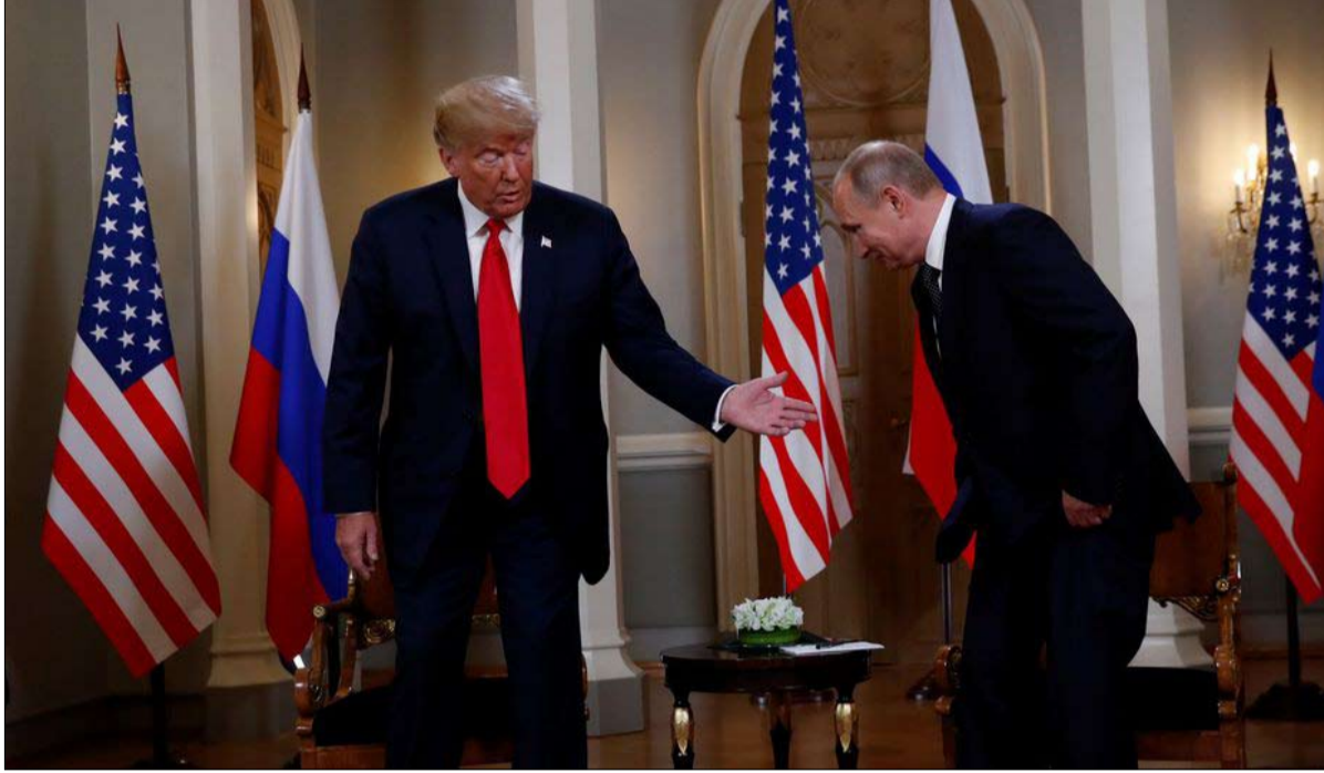
لقاء هلسنكي اثار اسئلة