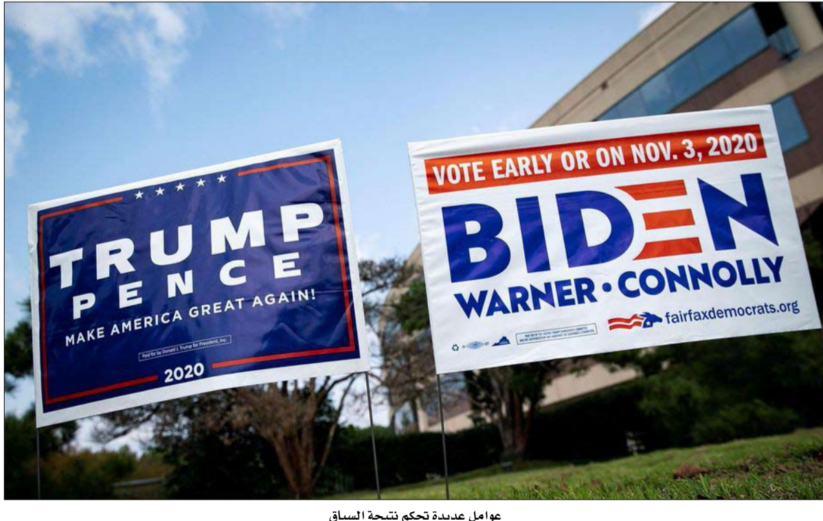
عوامل عديدة تحكم نتيجة السباق

المعايير الأكثر تعقيداً تتنبأ بفوز المرشح الديمقراطي وسابقة 2016 تستدعي الحذر عن لوطنون