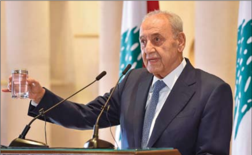
نبيه بري خلال مؤتمر صحفي في بيروت

بنان يعلن عن اتفاق إطار للتفاوض مع إسرائيل بشأن الحدود بيروت-وكالات: أعلن رئيس مجلس النواب اللبناني نبيه بري، الخميس، عن التوصل إلى اتفاق على إطار عمل للتفاوض مع إسرائيل بشأن الحدود البحرية والبرية بين البلدين. وأضاف رئيس مجلس النواب اللبناني خلال مؤتمر صحفي في العاصمة بيروت، أن الجيش اللبناني سيقود المحادثات مع الجانب الإسرائيلي. وأوضح بري أن الاجتماعات ستعقد في قاعدة للأمم المتحدة قرب الحدود في جنوب لبنان، تحت رعاية الأمم المتحدة، مشيراً إلى أن لبنان وإسرائيل طالبا الولايات المتحدة بأن تكون وسيطا في ترسيم الحدود. وقال إن الاتفاق الإطار ينص على أن تبذل الولايات المتحدة جهوداً من أجل تهيئة أجواء إيجابية لإنجاح المحادثات بين لبنان وإسرائيل بأسرع ما يمكن. وأشار إلى أن ممثلي الولايات المتحدة ومنسق الأمم المتحدة الخاص في لبنان سيشاركون في الاجتماعات المتعلقة بترسيم الحدود بين بيروت وتل أبيب. وأوضح رئيس مجلس النواب اللبناني أنه بمجرد التوصل إلى اتفاق بين الطرفين سيتم توقيع اتفاق بهذا الخصوص من جانب لبنان وإسرائيل وقوة الأمم المتحدة، المعروفة باسم اليونيفيل. وفي السياق ذاته، أكد وزير