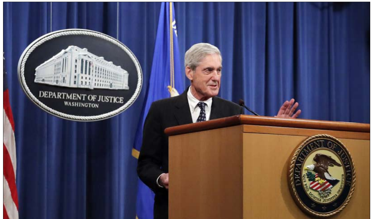
تقرير مولر استبعد وجود تواطؤ بين حملة ترامب وروسيا