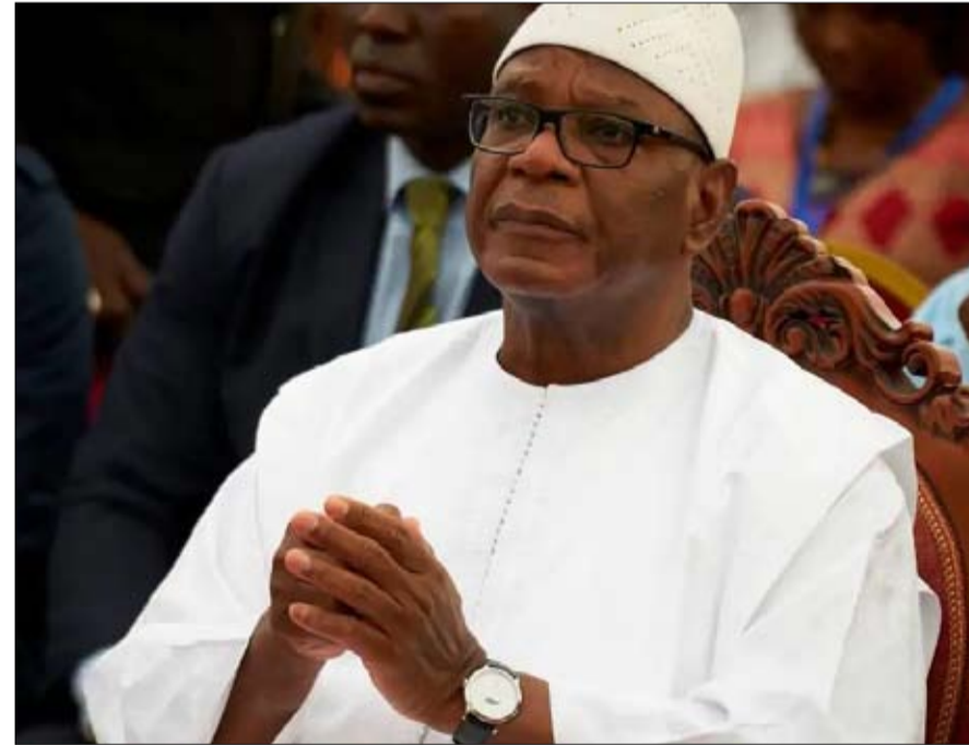
الرئيس المالي المقال