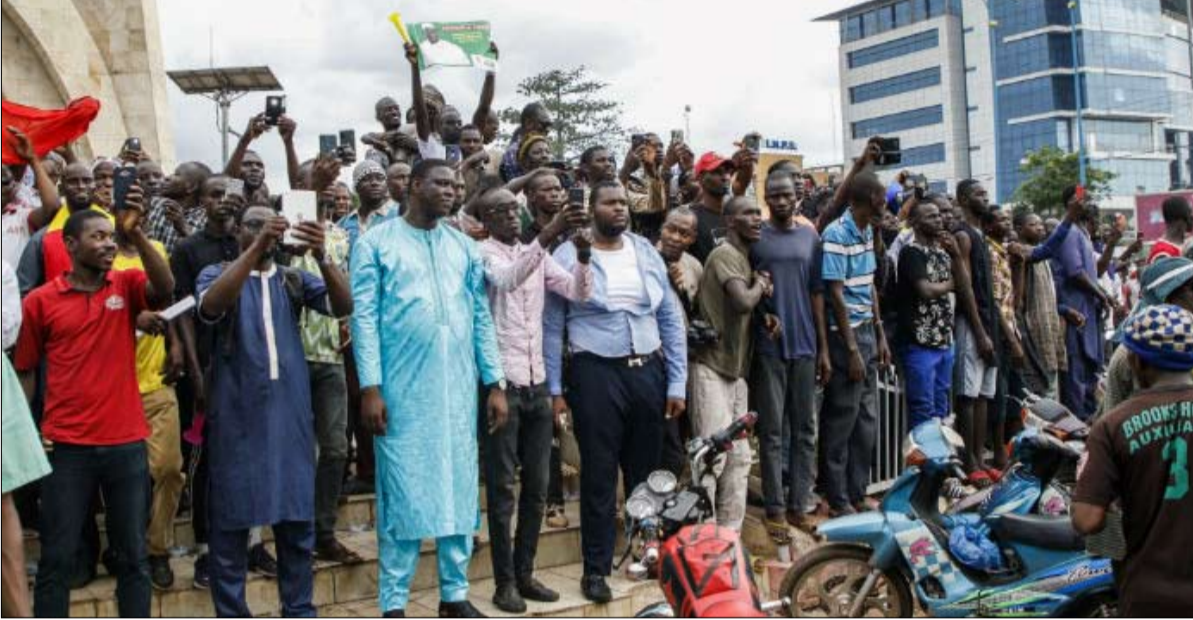
فرحة شعبية بعزل الرئيس