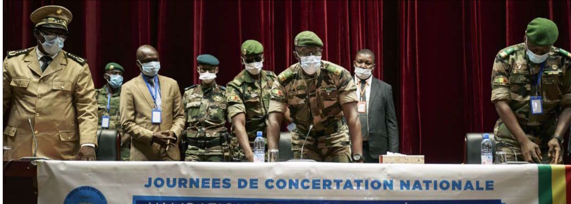
من سيقود الانتقال... المدني او العسكري؟