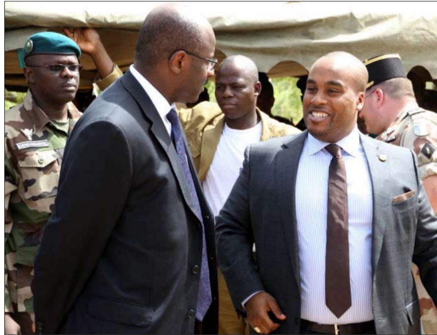
كريم كيتا-يمين- اساء لوالده

ولئن كان هذا الانقلاب مفاجئاً في الخارج، وحتى لبعض الشركاء الدوليين المميزين مالي، منهم السلطات الفرنسية التي لم تتوقعه، فقد سبق أن انتشرت شائعات في البلاد منذ عدة أسابيع. على الساحة الدولية، تبنى مالي انعدام الأمن والهجمات الجهادية، لكنها بلد أيضاً عرفت عدة أشهر في أزمة سياسية معقدة تجاوزت قدرات الرئيس إبراهيم بوبكر كيتا، في السلطة طيلة سبع سنوات. منذ يونيو، اجتمع ائتلاف متنوع، مؤلف من وزرائه السابقين وزعماء دينيين داخل حركة 5 يونيو -تجمع القوى الوطنية في مالي للمطالبة برحيله. ويلقى المعارضون اللوم على النظام جراء الفساد والمحسوبية، وعدم فعالته في محاربة الجماعات الجهادية، والبطالة، وانعدام الآفاق للشباب. لا ان مصادفة المحكمة الدستورية على انتخاب، متنازع عليه، في مارس وأبريل، عشرات من نواب الحزب الحاكم هي القطرة التي اقتضت الكاس والشعرة التي قصمت ظهر الجبير. واتهمت هذه المحكمة، بالعمل لصالح رئيس الجمهورية. تصاعد التوتر، ونظمت مظاهرات حاشدة في باماكو للمطالبة باستقالة الرئيس وتنصيب حكومة انتقالية.