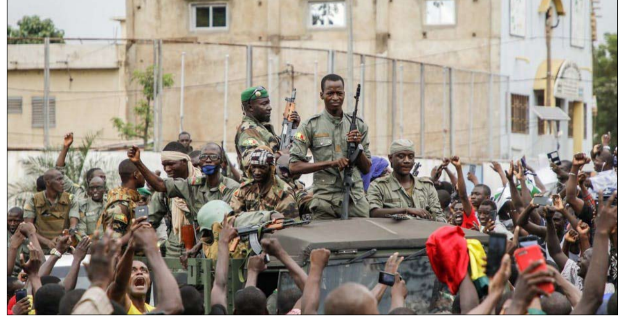
انقلاب رابع في مالي

تشير إلى نفس الملاحظة. "من وجهة نظر ديمقراطية، لا يمكننا أن نكون سعداء بالطريقة التي غادر بها إبراهيم بوبكر كيتا. في المقابل، من حيث الجوهر، فإن الاصابات المقدمة شرعية تماماً. هذا الانقلاب، الذي لا اسمه على هذا النحو، هو ثمرة سنوات عديدة من الإحباط والإهمال وازدراء حقوق الشعب المالي وكرامته. ففي السنوات الأخيرة، تدهور الوضع، وتضاعفت المجازر والفضائح السياسية والمالية في جميع أنحاء البلاد. ولواته تم اتخاذ قرارات وردود فعل حازمة مع كل طعنة تم توجيهها إلى الشعب المالي، ما كنا لنصل إلى هذا الوضع..