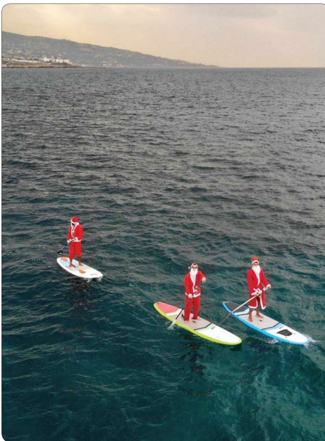
لبنانيون يرتدون ملابس سانتا كلوز ويركبون مجاديف في مدينة البترون الساحلية شمال لبنان.

وقال معد البحث وعالم الأوبئة أوغوستو دي كاستلنوفو من Mediterranean CardioCentro في نابولي: "وفقاً لتحليلاتنا، يلعب فائض السكر دوراً، لكنه لا يمثل سوى 40% من مخاطر الوفاة المتزايدة. فكرتنا هي أن جزءاً مهماً لتعبئة المعالجة الصناعية نفسها، القادرة على إحداث تغييرات عميقة في هيكل وتكوين العناصر الغذائية." وقال الفريق إن الناس بحاجة إلى إدراك أن الأكل الصحي هو أكثر من مجرد حساب السرعات الحرارية، بينما يجب على الشباب التفكير مرتين قبل تناول الأطعمة المعلبة." وأضافت إياكوفيللو: "هذه الدراسة وغيرها من الأبحاث الدولية التي تسير في الاتجاه نفسه، تخبرنا أنه في عادات التغذية الصحية، يجب أن تكون الأطعمة الطازجة أو المعالجة بالحد الأدنى من الأهمية يمكن. إن قضاء بضع دقائق أخرى في طهي وجبة غداء بدلاً من تسخين وعاء في الميكروويف، أو ربما تحضير شطيرة لأطفالنا بدلاً من وضع وجبة خفيفة معبأة مسبقاً في حقيبة الظهر، هذه هي الإجراءات التي ستكافئنا."