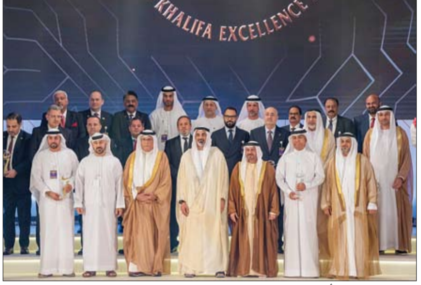
ولي عهد أبوظبي خلال تكريمه الفائزين بجائزة الشيخ خليفة للامتياز

البيت الأبيض يحذر من كارثة اقتصادية أمريكية ● واشنطن - أف ب: حذر البيت الأبيض من أنه في حال لم تتراجع المعارضة الجمهورية عن رفضها رفع سقف الدين العام، فإن الولايات المتحدة ستشهد كارثة اقتصادية إذا ما وقعت في حالة تخلف عن السداد لفترة طويلة. وقال المستشارون الاقتصاديون للرئيس جو بايدن أنه في حال تخلفت أكبر قوة اقتصادية في العالم عن الوفاء بالتزاماتها المالية في مواعيدها المحددة وطال أمدا هذا التخلف عن السداد فإن سوق العمل الأمريكي قد يفقد هذا الصيف أكثر من ثمانية ملايين وظيفة. وأضافوا أنه إذا تحقق هذا السيناريو الكارثي فإن الناتج المحلي الإجمالي سيتقلص بنسبة 6% في حين ستخسر الأسواق المالية من جهتها 45% خلال الربع الثالث من العام. أما إذا شهدت الولايات المتحدة حالة تخلف عن السداد لفترة قصيرة، فإن المستشارين المتضوين في مجلس المستشارين الاقتصاديين بالبيت الأبيض يتوقعون عندها أن يعاني الاقتصاد الأمريكي من ارتفاع في معدلات البطالة وركود بنسبة أدنى. وبشكل هذا الموضوع مجازفة كبيرة للولايات المتحدة، إذ لم يسبق للبلاد أن وجدت نفسها أبدا في حالة تخلف عن سداد ديونها. ويرفض الجمهوريون الموافقة على رفع سقف الدين العام الفدرالي، وهو في العادة إجراء روتيني، ما لم يوافق الديموقراطيون أولا على تخفيضات كبيرة في النفقات. وتحذر الإدارة من أن عدم رفع سقف الدين العام سيؤدي إلى تخلف الولايات المتحدة عن سداد مستحقات ديونها البالغة قيمته 3.4 تريليون دولار، في سابقة تاريخية من شأنها أن تحدث صدمة في الولايات المتحدة والعالم على حد سواء.