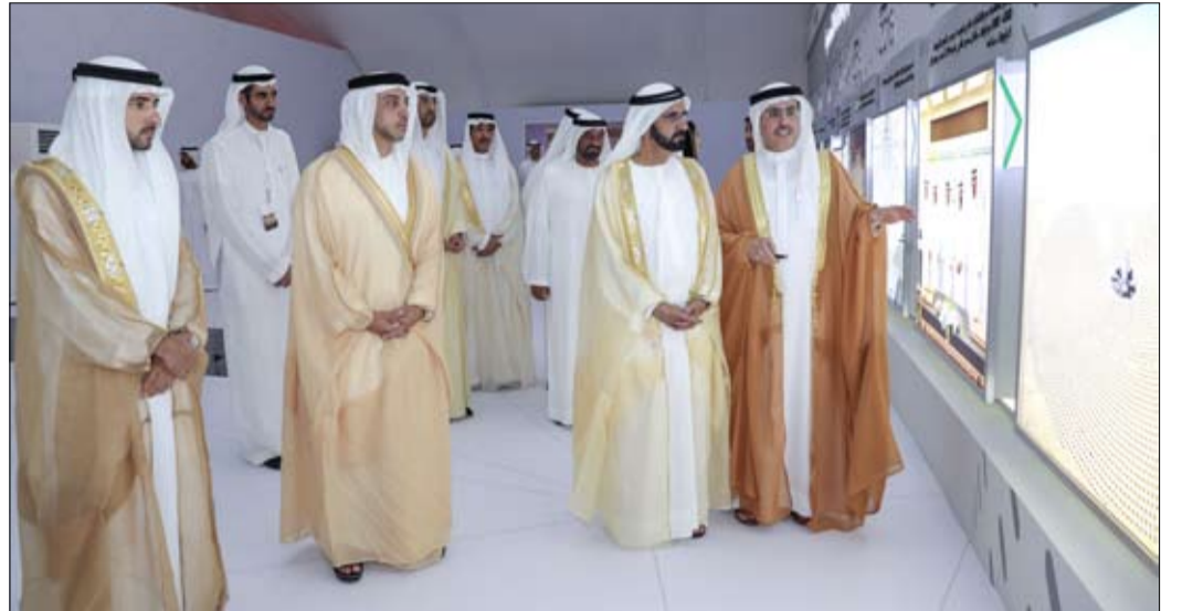
«كوب 28» منصة مهمة لإبراز مسيرة الدولة نحو تحقيق التنمية المستدامة