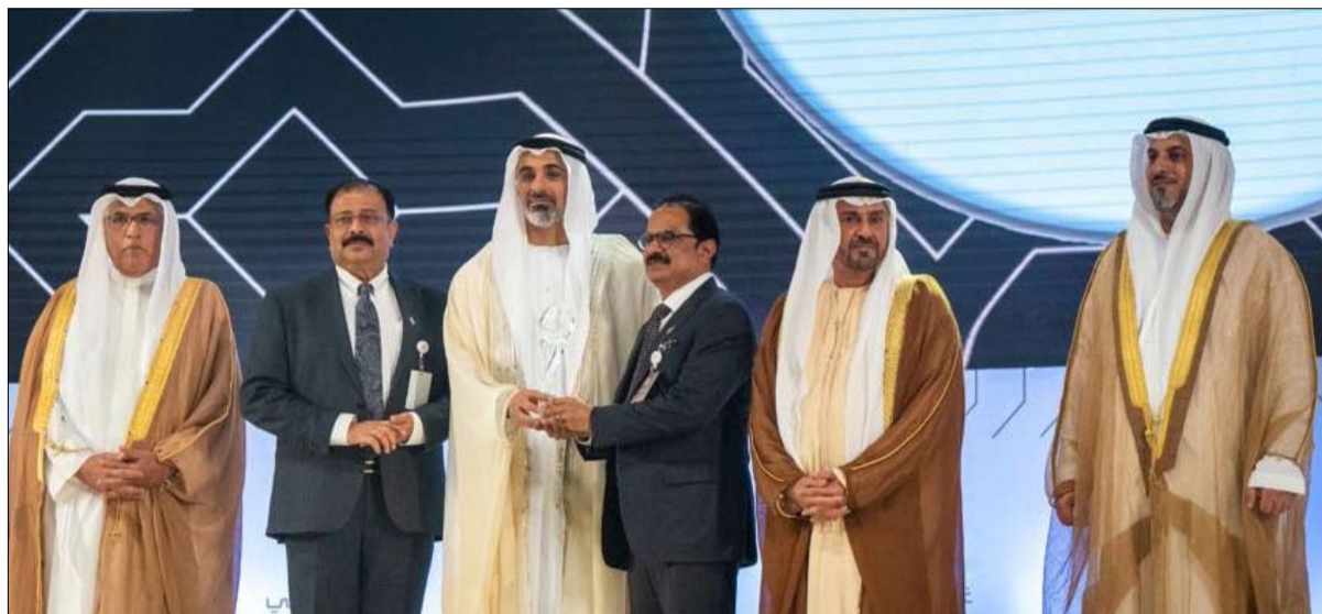
لولو على تلبية احتياجات العملاء وأصحاب الصلحة الآخرين فحسب، بل تتجاوزهم العديد من الجوائز المرموقة في الفترة الماضية مثل جائزة دبي للوجود، جوائز تجارة الشرق الأوسط لتجزئة RetailME بالتميز في الأعمال.