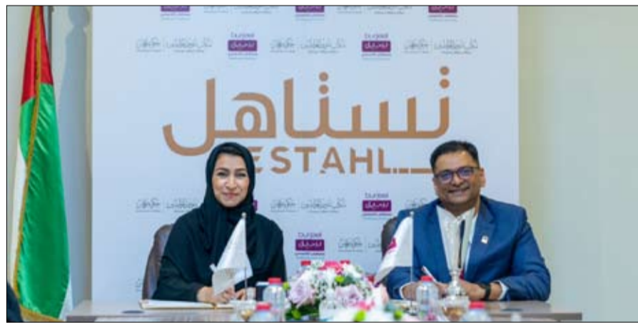
بداية جلسة العمل بين مكتب شؤون المواطنين في عجمان وبرجيل القابضة، بحضور مدير مكتب شؤون المواطنين في عجمان، ومدير مكتب شؤون المواطنين في برجيل القابضة.

المريض، وتقديم أفضل الخدمات الطبية عالية المستوى. وتنص المذكرة على تقديم الرعاية الصحية للمواطنين ومنح حاملي بطاقة "ستاهل" خصم يصل إلى 30% وذلك يشمل المستشفيات التابعة لبرجيل القابضة، ومنها مستشفى عجمان التخصصي، مستشفى برجيل العالمية التي تتميز بها منشأتنا للمواطنين، كما نحرص على أن تكون على قدر هذه الثقة بتوفير