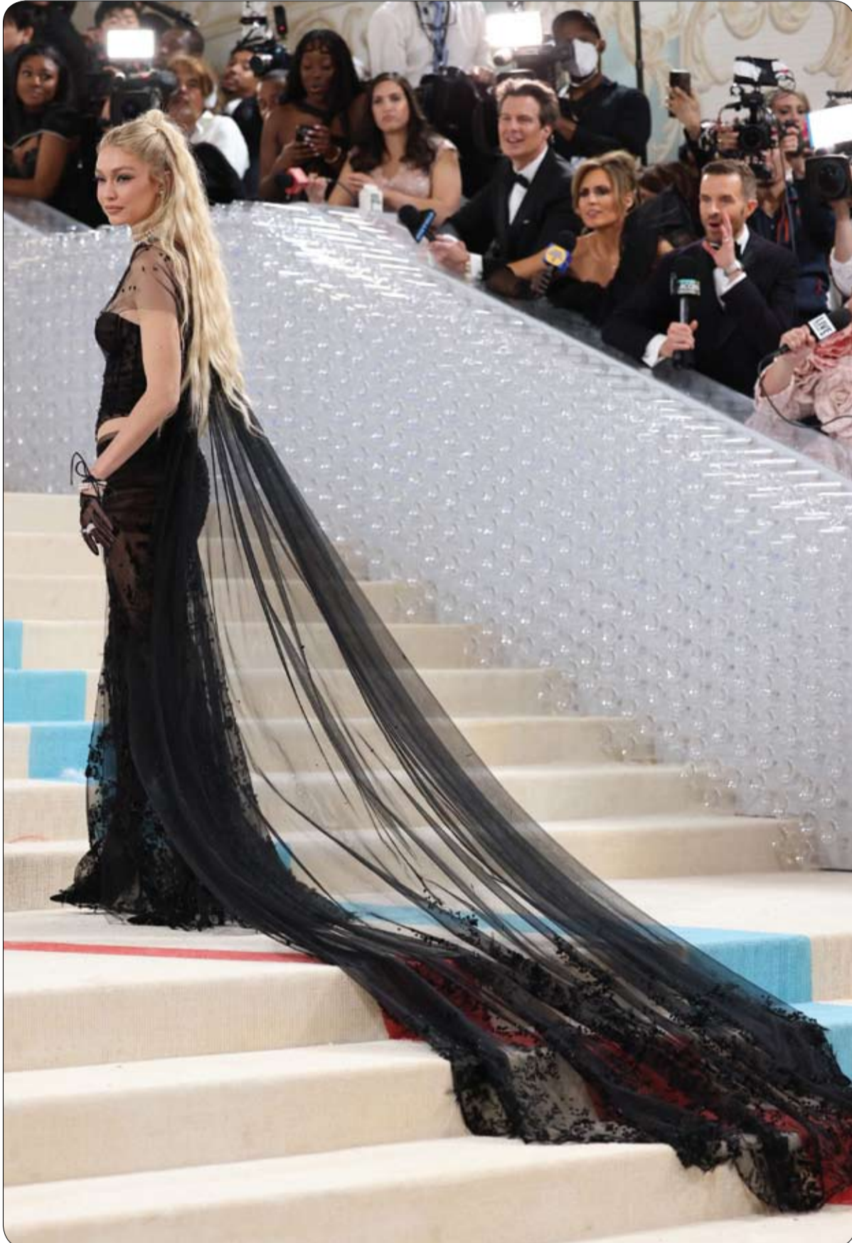
جيجي حديد خلال حضورها حفل Met Gala السنوي لجمع التبرعات لصالح معهد متروبوليتان للفنون للأزياء، في نيويورك.

قال جوش مارانو، عالم الآثار البحرية في حداثق جنوب فلوريدا الوطنية في بيان: "هذا الاكتشاف المثير للاهتمام يسلم الضوء على إمكانية وجود قصص غير مرئية في منتهز فوق وتحت الماء".