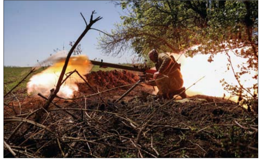
جندي أوكراني يطلق قنابل يدوية مضادة للدبابات في خط المواجهة، بالقرب من باخموت

موسكو تتهم واشنطن بالمسؤولية عن هجوم الكرملين روسيا ترد على محاولة اغتيال بوتين بالصواريخ ● عواصم-وكالات: اتهمت الرئاسة الروسية، أمس الخميس، الولايات المتحدة بالمسؤولية عن الهجوم الذي استهدف مقر الكرملين، وأشار بوتين لا يعززم إلغاء كلمة أو عقد اجتماع مجلس الأمن القومي ولا تغيير في وتيرة العملية العسكرية الخاصة في أوكرانيا. وقال المتحدث باسم الرئاسة الروسية، دميتري بيسكوف إن واشنطن ترقف وراء هجوم كييف على الكرملين ومحاولات لولايات المتحدة للتصلب سخيفة. وأضاف أنه من المهم أن تدرك واشنطن المتورطة في الهجوم على الكرملين خطورة مثل هذا التدخل المباشر في الصراع. وقال بيسكوف إن واقعة الطائرات المسيرتين تتطلب تحقيقا شاملا وعاجلا ولا يمكن القبول متى ستظهر النتائج، مضيفا «نعلم أن الضربات المتعلقة بهذه الأعمال الإرهابية تم اتخاذها في واشنطن وليس في كييف، وأوضح الكرملين أن