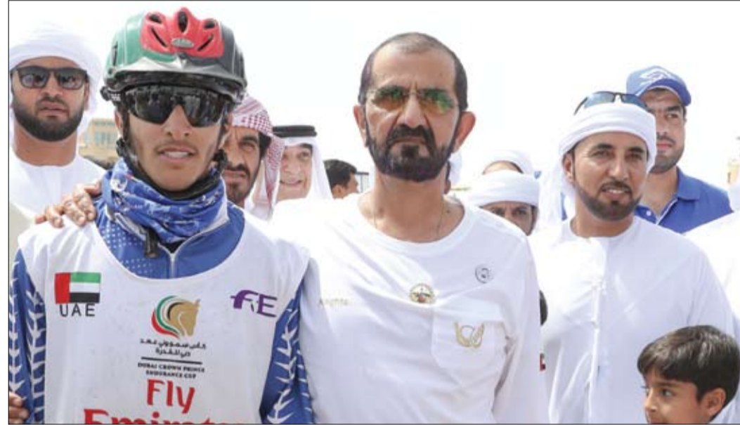
محمد بن راشد خلال حضوره السباق الرئيسي لمهرجان ولي عهد دبي للقدره

تلقت مبادرة مليون مبرمج عربي التي أطلقها صاحب السمو الشيخ محمد بن راشد آل مكتوم نائب رئيس الدولة رئيس مجلس الوزراء حاكم دبي رعاه الله، أكثر من 1.1 مليون طلب مشاركة من جميع الدول العربية. (التفاصيل ص3)