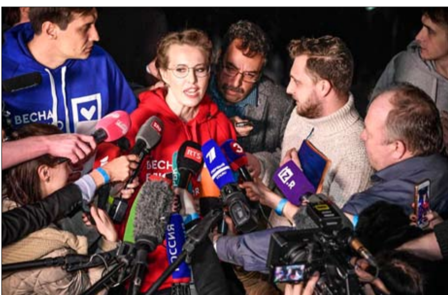
كسينيا سوبتشاك لا تشكل تهديدا للقبصر