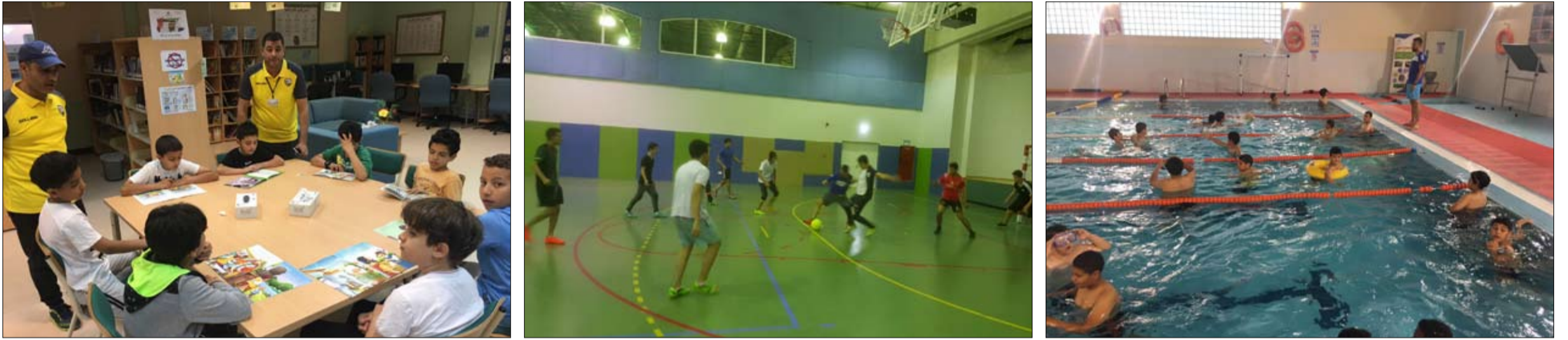
مدرسة الظفرة المجتمعية في مدينة زايد تجذب الطلاب بفعاليتها المتميزة