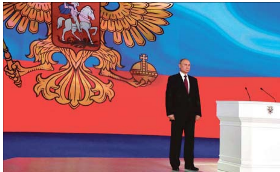
بوتين الدولة نحن

لم يخطط بوتين أبدا ليصبح رئيسا ولم يكن يوماً سياسياً وأول انتخابات شارك فيها هي الرئاسية