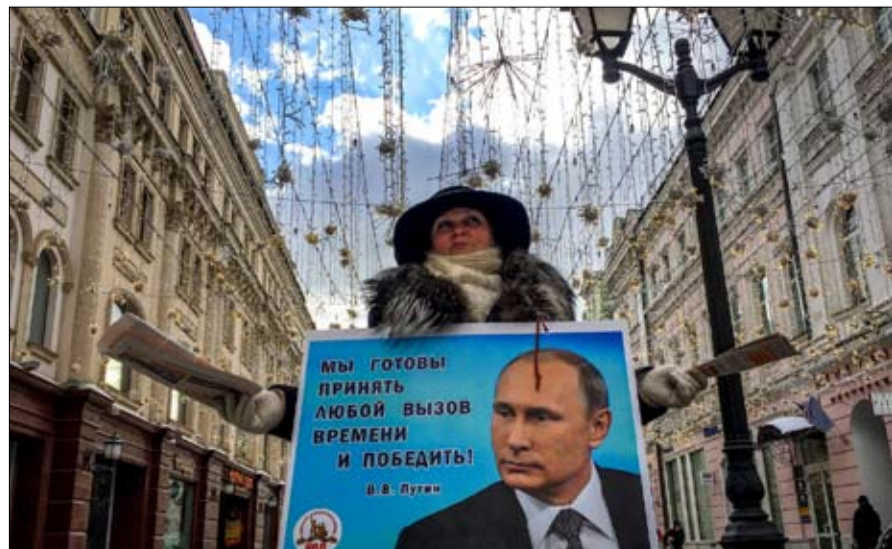
سباق العداة الوحيد