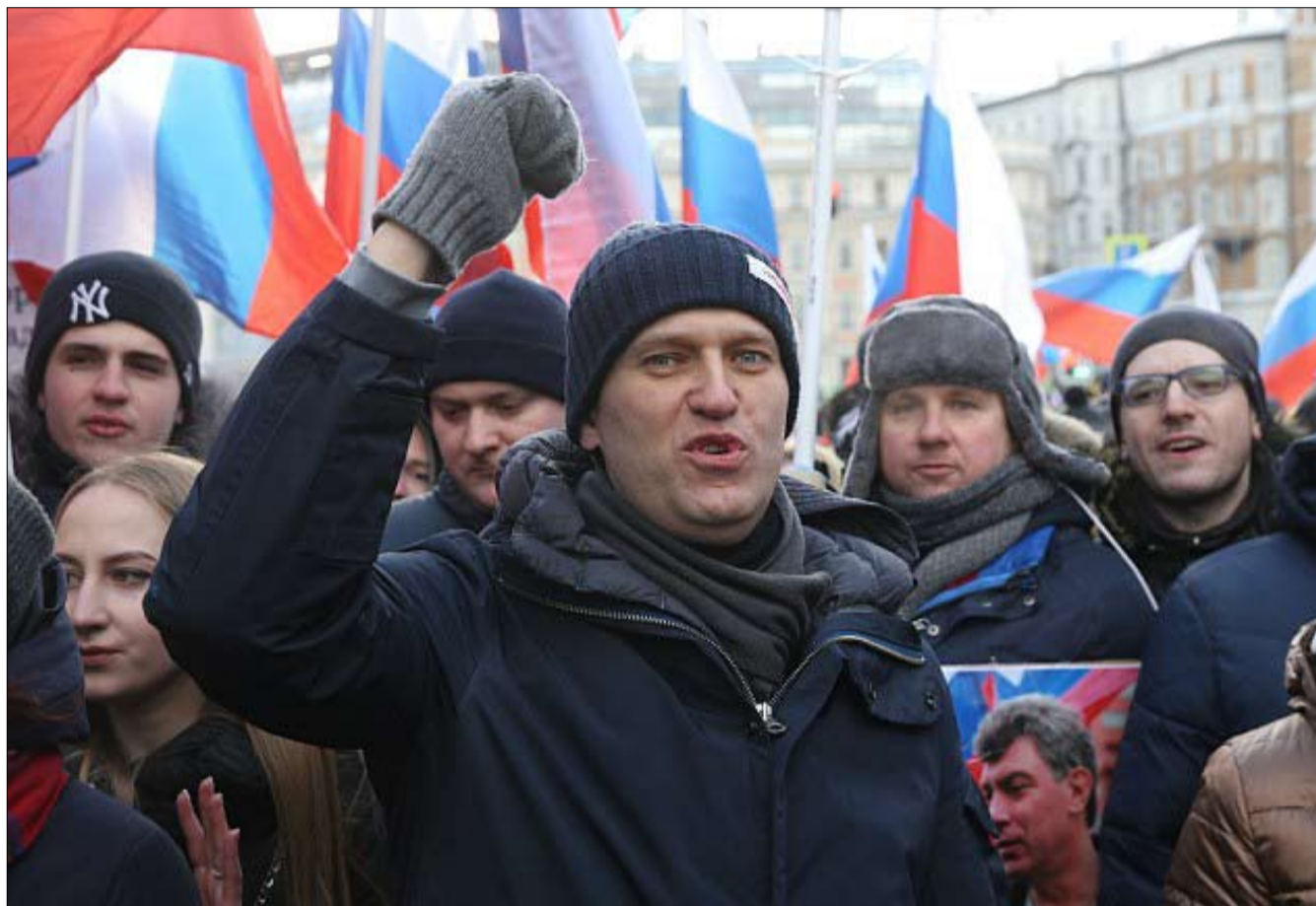
نافالني التهديد الوحيد خارج المنافسة

لا أحد يعلم، ومن سيتم اختياره قد لا يعرف أيضا. ربما سيجادل جميع أعضاء الدائرة القريبة من بوتين التأثير عليه.. لكن في النهاية، هو الذي سيقدر عن لوجورنال دو ديماش