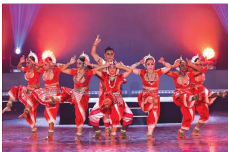
شارك في الحفل عازفو الطبول والفرع بالأيدي الذين أبدعوا بالعزف على الطبول وآلة البزق من ماليزيا HANDS Percussion وغيرها.