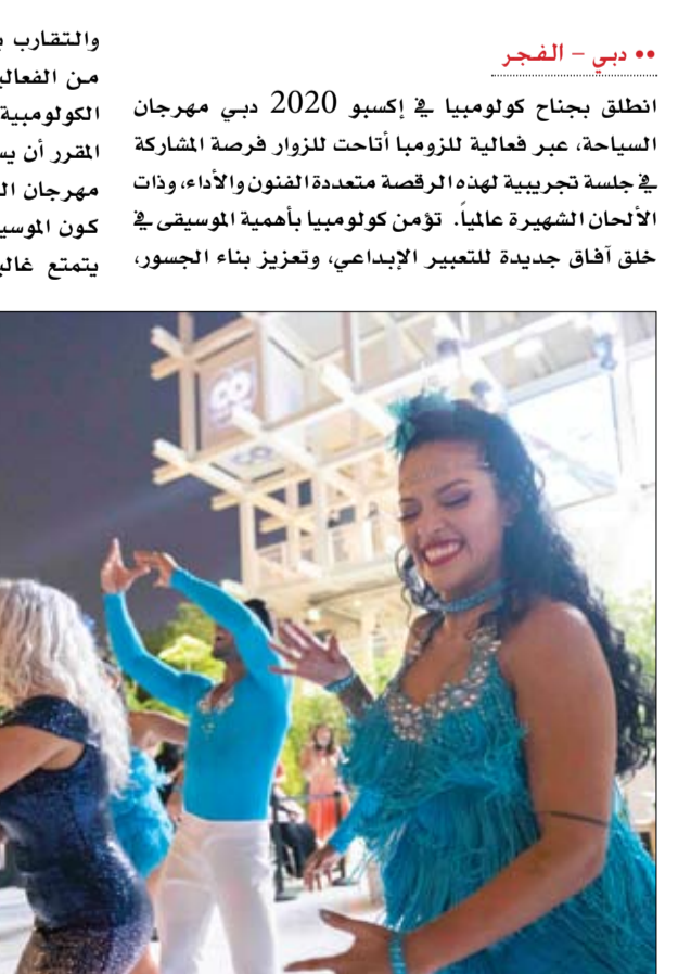
دبي - الفجر

انطلق بجناح كولومبيا في إكسبو 2020 دبي مهرجان السياحة، عبر فعالية للزوار فرصة المشاركة في جلسة تجريبية لهذه الرقصات متعددة الفنون والأداء، وذات الألحان الشهيرة عالمياً. تؤمن كولومبيا بأهمية الموسيقى في خلق آفاق جديدة للتعبير الإبداعي، وتعزيز بناء الجسور،