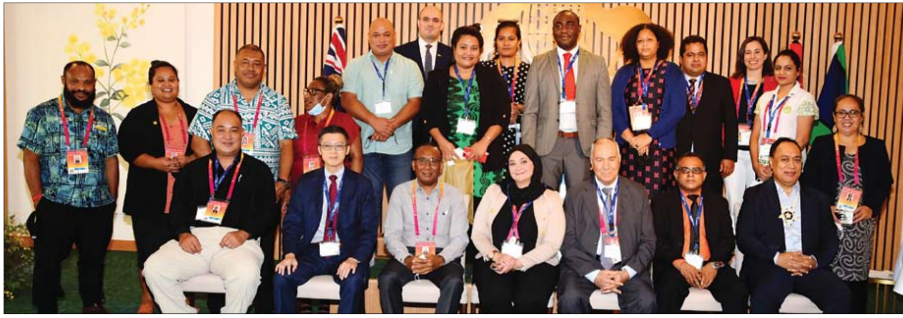
ندوة تستقطب سفراء ومفوضين من 13 دولة وجناباً