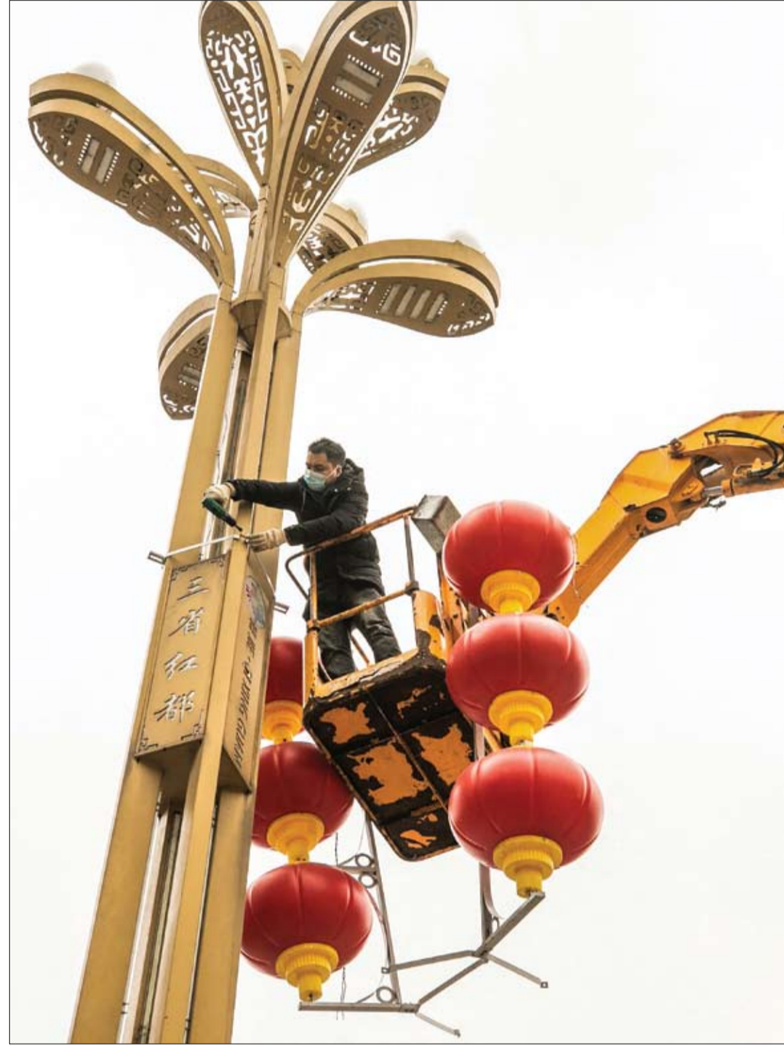
عامل يقوم بتركيب زخارف فانوس للعام القمري الجديد القادم في بيجي بمقاطعة قويتشو جنوب غرب الصين.