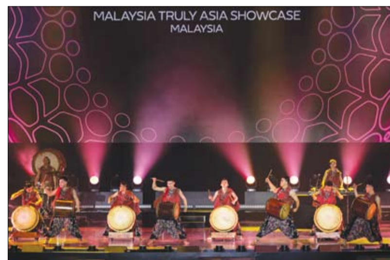
بعنوان "ماليزيا حقاً آسيا" جسد التنوع الثقافي ماليزيا بأناقة وحيوية. Surya (الشمس) الساحرة. كما قدمت مجموعة "إستانا بودايا" عرضاً