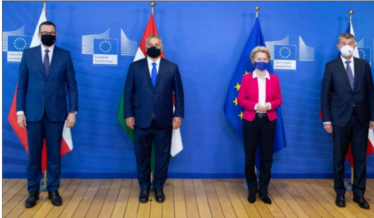
أوروبا تدفع ثمن هذه التحولات