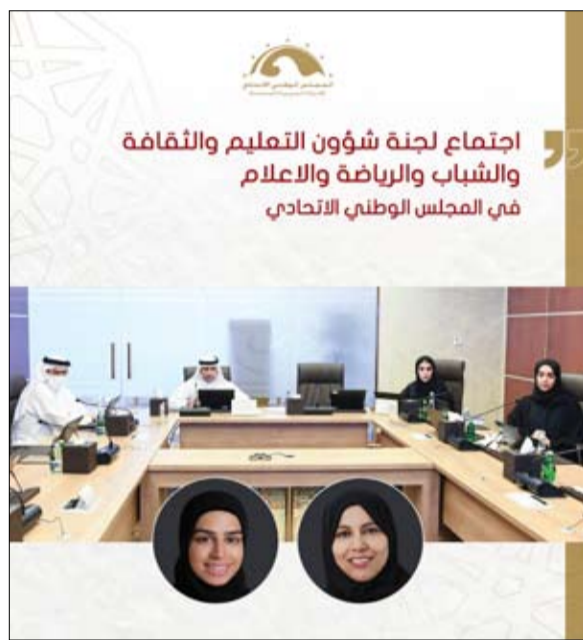
اجتماع لجنة شؤون التعليم والثقافة والشباب والرياضة والإعلام في المجلس الوطني الاتحادي

تم رفع تقرير لرئاسة المجلس بالتوصيات النهائية لعرضها في جلسات قادمة واعتمادها، منها توصيات تدور حول ضرورة التنسيق مع وزارة الطاقة والبنية التحتية بالإسراع في بناء المجمعات المدرسية المتكاملة على مستوى الدولة والقضارة على مواجهة الظروف المناخية والتي تمكن وتشجيع ومنح المستثمرين المواطنين امتيازات للاستثمار في القطاع التعليمي الخاص، وتفعيل الاشتراكات في الباقات الشهرية المحفظة للإنترنت مع مزودي الخدمات خاصة لمن لديهم عدد من الأبناء في مراحل دراسية مختلفة، والعمل على تأمين المنصات التعليمية الإلكترونية من الاختراقات الأمنية بالتنسيق مع الجهات المعنية.