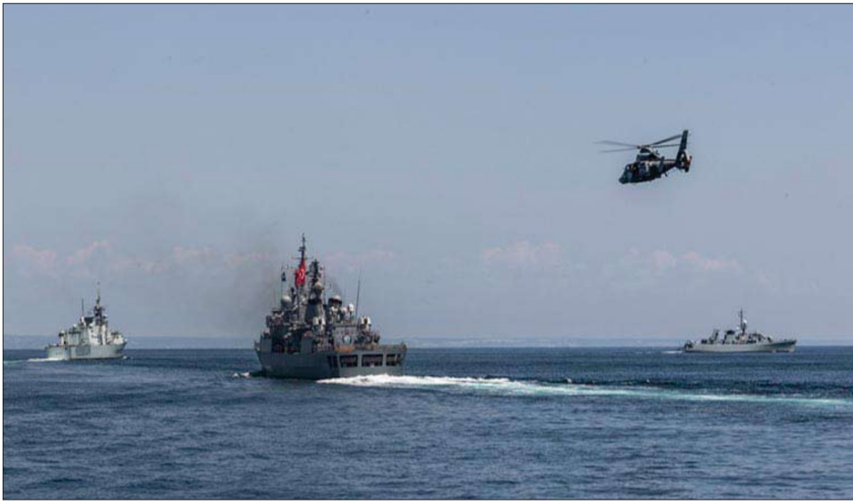
●● واشنطن-وكالات فقط، بل يسلم الضوء على النشاط الصيني، وما يستدعيه من رد أمريكي.

دخلت الولايات المتحدة مرحلة من التنافس مع القوى الكبرى، ولكنها لم تصل إلى مرحلة نزاع يجب الابتعاد عنها في الوقت الذي تتنافس فيه بعفالية ضد النفوذين الروسي والصيني. هذا الكلام الذي أطلقه رئيس هيئة الأركان الأمريكية المشتركة الجنرال مارك مولوي أمام معهد بروكينغز في 2 ديسمبر "كانون الأول" الجاري، استند إليه الكتائبان فليب بريدلووف ومايكل أوهانلون في مقال نشره بموقع "ناشيونال إنترست" الأمريكي لإبراز أهمية منطقة البحر الأسود. وقال الكتائبان إن أمريكيين كثرًا يعتبرون مناطق أوروبا الشرقية، بالقرب من روسيا، بعيدة جداً ويصعب التعامل معها. وفي ذلك الجزء من العالم ثمة دول كبيرة وصغيرة، لا يرد ذكرها عموماً في وسائل الإعلام الأمريكية ولا يتردد عليها السياح الأمريكيون. ومن أجل إضفاء معنى على معظم هذه المنطقة البعيدة، قد يكون مفيداً تصور مفهوم يركز على البحر الأسود وجعله نقطة مرجعية أساسية لمعظم المنطقة. وهذا لا يساعد فقط على فهم ما يمكن أن تفعله روسيا قرب حدودها