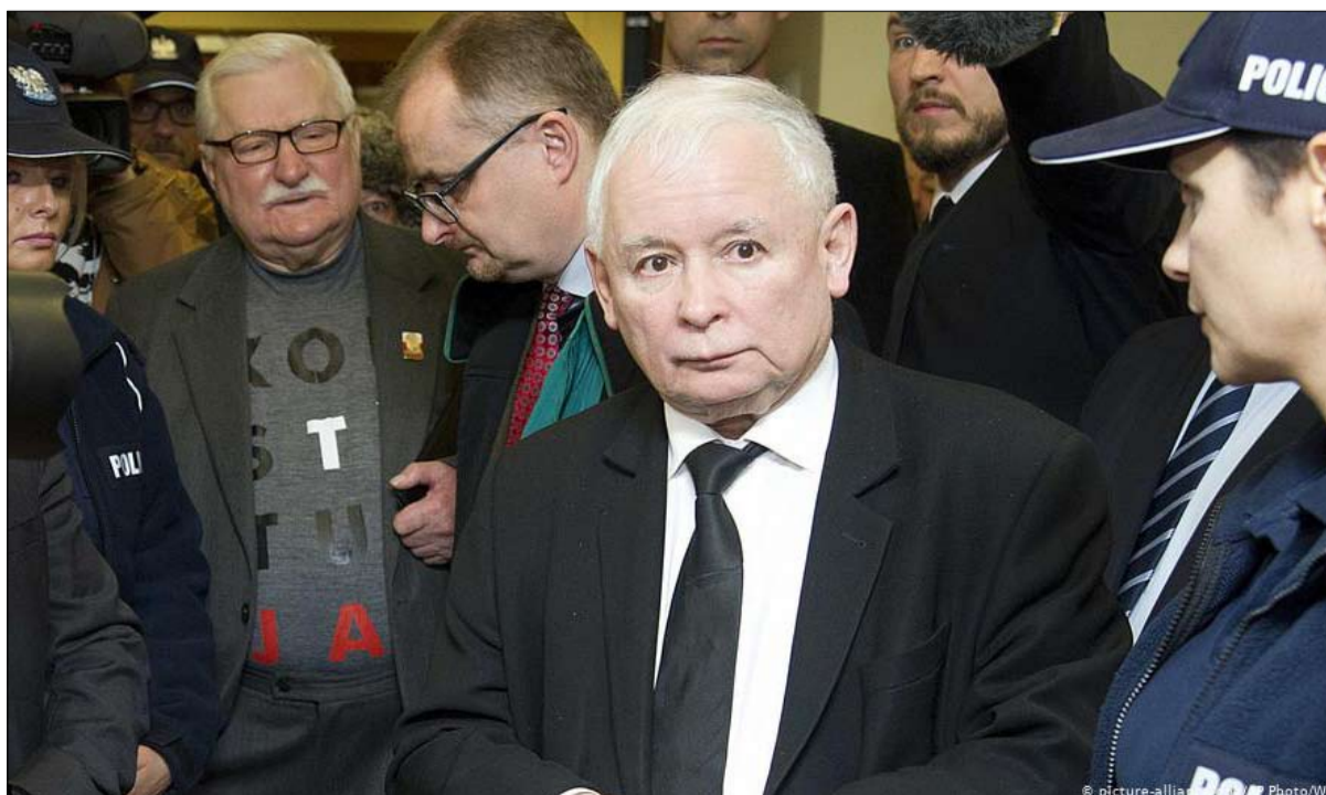
ياروسلاف كاتشينسكي والثورة المضادة

بعد ثلاثة عقود، كشفت أوروبا الوسطى والشرقية عن سلسلة من المخارقات، تتميز المنطقة