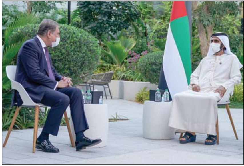
محمد بن راشد خلال استقباله وزير خارجية جمهورية باكستان

محمد بن راشد يستقبل وزير الخارجية الباكستاني •• دبي-وام: استقبل صاحب السمو الشيخ محمد بن راشد آل مكتوم نائب رئيس الدولة رئيس مجلس الوزراء حاكم دبي رعاه الله في دبي ظهر أمس معالي مخدم شاه قريشي وزير خارجية جمهورية باكستان الإسلامية الذي نقل إلى سموه رسالة من دولة عمران خان رئيس وزراء باكستان تضمنت تحيات السيد خان الى صاحب السمو الشيخ محمد بن راشد آل مكتوم والشكر إلى قيادة و حكومة دولة الإمارات على المعاملة الطيبة والرعاية الكريمة التي تحظى بها الجالية الباكستانية في الدولة ، إلى جانب سبل تعزيز وتفعيل العلاقات الثنائية القائمة بين البلدين الصديقين على مختلف الصعد بما يعود بالخير على شعبيهما. وأضاف صاحب السمو الشيخ محمد بن راشد آل مكتوم بدور أبناء الجالية الباكستانية في الدولة الذين يعملون في كافة القطاعات التنموية و مساهمتهم الفعالة في مسيرة التنمية و النهضة التي تشهدها دولتنا . (التفاصيل ص2)