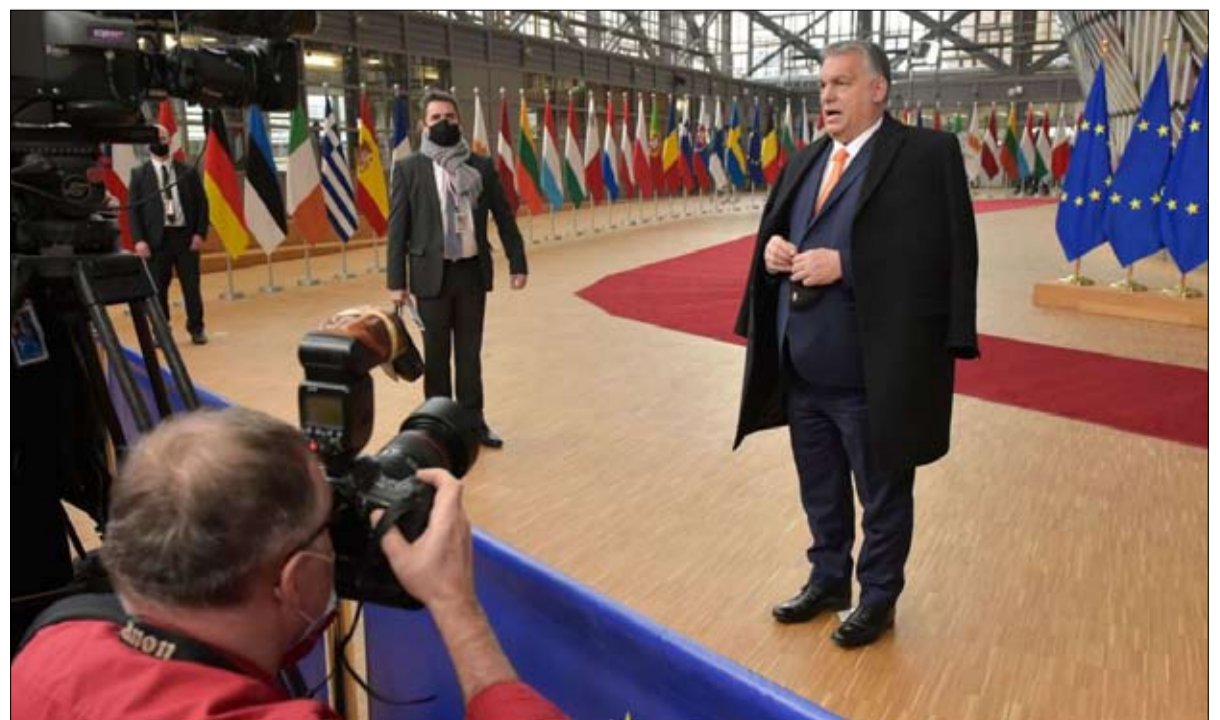
فيكتور أوربان مناهضة الليبرالية