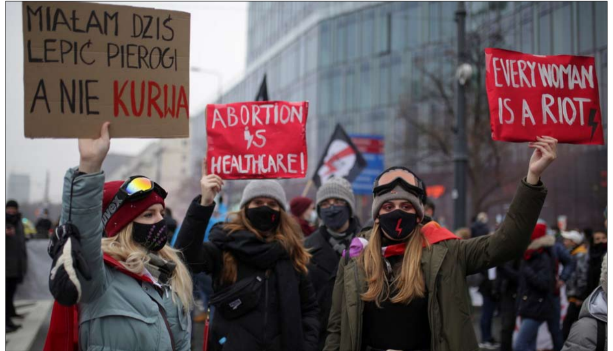
تحولات سياسية مختلفة ايقاعاً ومضموناً

برنامجاً اجتماعياً لصالح الأسر، وفي المجر حد فيكتور أوربان من الحقوق الاجتماعية والاستثمار الاجتماعي. وإذا كانت السياسات التي نفذت في بولندا تبدو وكأنها برامج شاملة تدعم "الخاسرين" في التحول الاقتصادي الثقيل الذي أعقب عام 1989، فإنها في الواقع تستند إلى أفكار محافظة. وإذا كان حزب ياروسلاف كاتشينسكي بعد انتخابه قد حقق أحد الوعود الكبرى للحملة الانتخابية - أي تنفيذ برنامج "500+"، أي 116 يورو من الخصومات الممنوحة لكل عائلة - فإن تدابير أخرى تهدف إلى تقييد الحقوق بشدة، مثل إلغاء قانون الحق في الإجهاض.