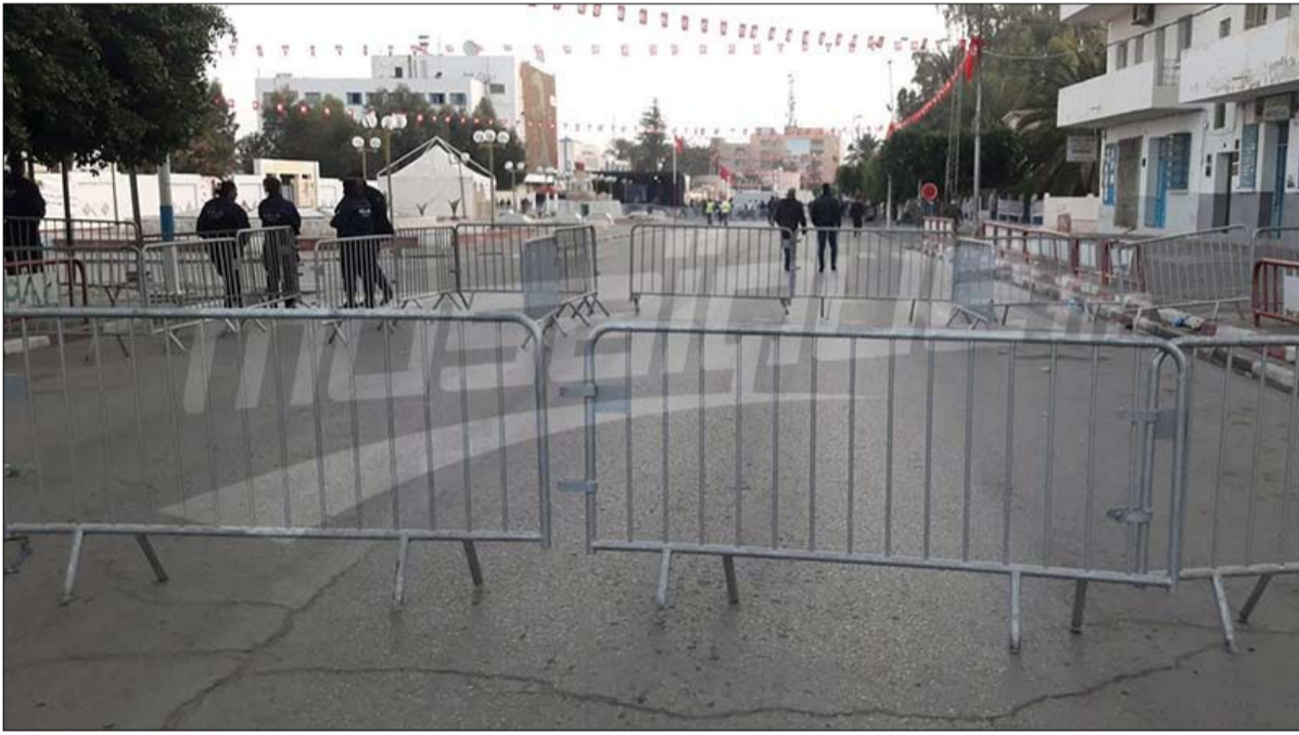
تحولات سياسية مختلفة إيقاعا ومضمونا