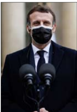
بارنيه، والرئيس الفنلندي السابق الحائز على جائزة نوبل للسلام، مارتى أهتيساري.

الرئيس دونالد ترامب إلى جانب زوجته ميلانيا بفيروس كورونا. ومن الرؤساء والمسؤولين الذين أعلن عن إصابته بـكورونا، رئيسة بوليفيا جاين أنبيز، ورئيس البرازيل جايير بولسونارو، ورئيس هندوراس خوان أورلاندو هيرنانديز. عربياً، أصيب الرئيس الجزائري عبد المجيد تبون، في نوفمبر بـكورونا، ونقل إلى مستشفى ألماني متخصص بعد أيام من العزل الصحي.