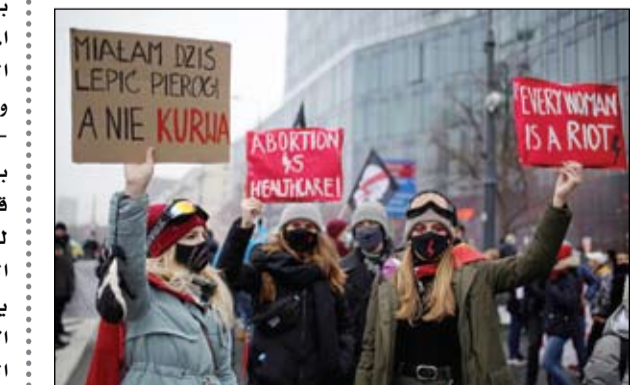
تحولات سياسية مختلفة ابتاعاً ومضموناً

قوات سورية موالية لروسيا تنتشر في البوكمال •• عواصم-وكالات: أفادت مصادر المرصد السوري لحقوق الإنسان في ريف دير الزور الشرقي، أن الفيلق الخامس المدعوم من روسيا، بدأ بالانتشار ضمن عدة نقاط واقعة على الحدود السورية - العراقية قرب مدينة البوكمال. وتسلمت قوات الفيلق الخامس بعض النقاط من الميليشيات الموالية لإيران، أمثال حركة النجباء وحزب الله العراقي والأبدال، وذلك بعد اتفاق روسي - إيراني لم تتضح ملامحه بشكل كامل بعد، والذي كان قد بدأ قبل أسبوع بفتح مكتب للقوات الروسية وسط مدينة البوكمال. يذكر أن الانتشار هذا يعد الأول من نوعه منذ بدء الحرب الروسية - الإيرانية الباردة والتي استمرت لأشهر طويلة.