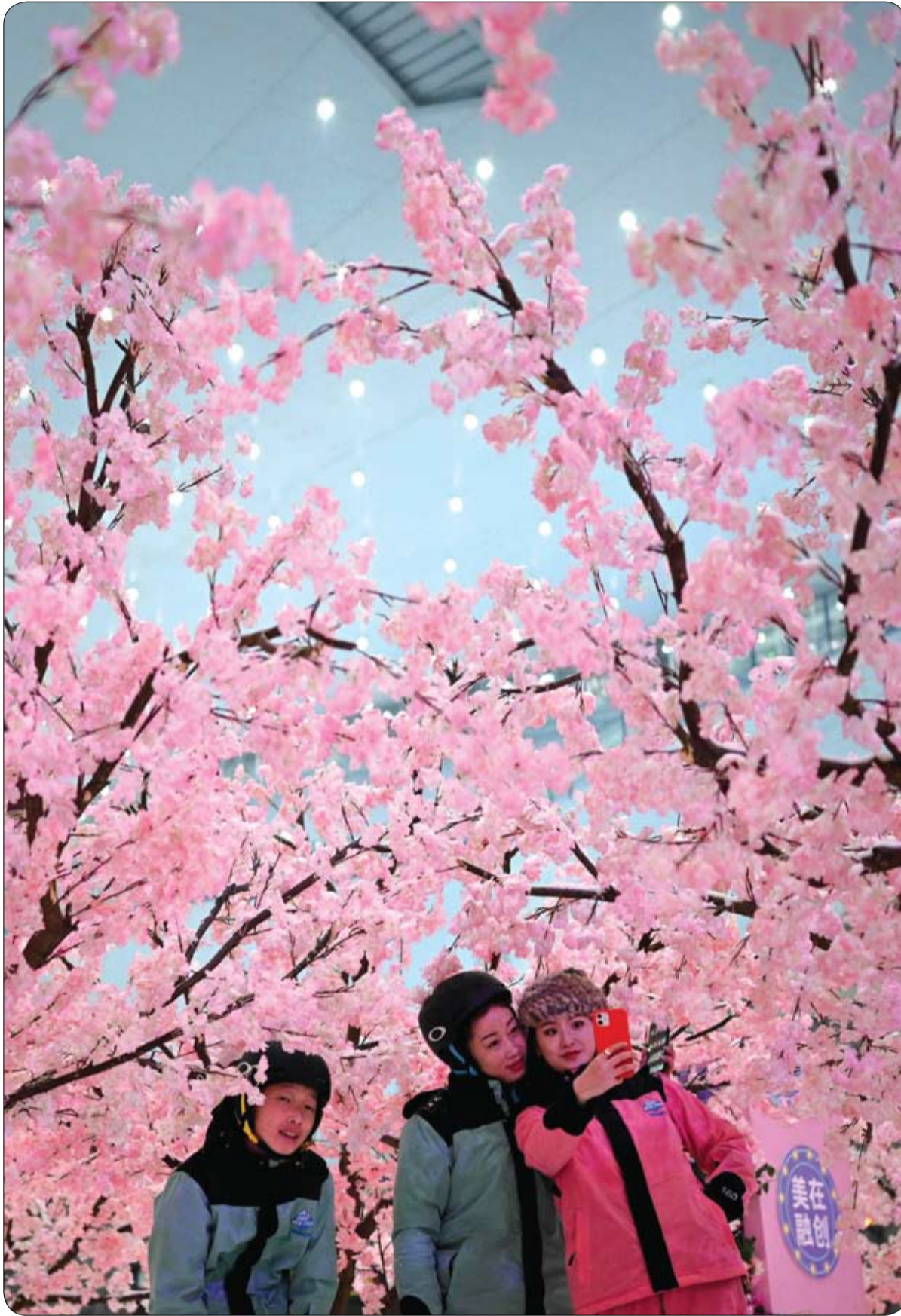
شباب يلتقطون صوراً في منتجع تزلج داخلي، في مركز Sunac للثلج في مدينة تشغندو، عاصمة مقاطعة سيتشوان جنوب غرب الصين.

وحذرت هيئة الأرصاد الجوية اليابانية من انهيارات ثلجية ومزيد من الاضطرابات المرورية في شرق ووسط اليابان والمناطق الساحلية في بحر اليابان، حيث من المتوقع سقوط المزيد من الثلج على مناطق واسعة من البلاد.