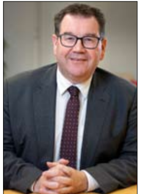
•• واشنطن-أ ف ب

النظامين في يوليو-تموز، وسبتمبر من عام 2019. في 16 أكتوبر-تشرين الأول 2020، تحدث التحذيرات المتكررة من واشنطن، واختبرت المنظمة مظهره استخفاً ملحوظاً بمخاوف واشنطن وبروكسل. ويهدد استحواد تركيا لنظام S-400 بمشاركة النظام مع طائرات أف-35 التي كان مقرراً أن تحصل عليها أفقرة من الولايات المتحدة، مما قد يمكن روسيا وآخرين من الحصول على معلومات استخباراتية قيمة مفيدة لإسقاط طائرات أف 35. ولتج حدوث ذلك، ألغت الولايات المتحدة تدريب طيارين أترك على المقاتلات الحديثة في يونيو-حزيران 2019 وأزالت أفقرة من برنامج أف 35 بعد ذلك بشهر واحد. ويضيف التقرير أن شراء أفقرة منظومة أس 400 هو مجرد جزء واحد من اتجاه مقلق أكبر. فقد انخرطت أفقرة أيضاً في "دبلوماسية