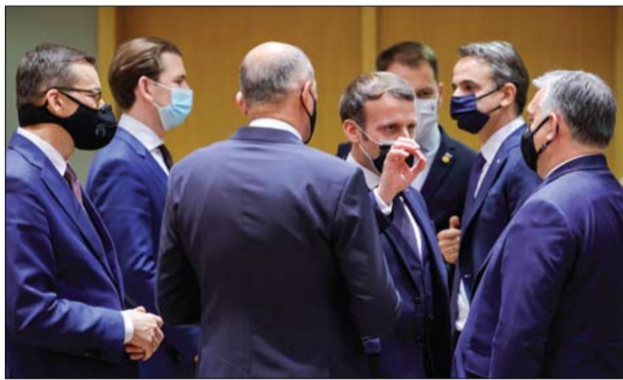
الرئيس الفرنسي مع قادة أوروبا قبيل انعقاد القمة الأوروبية في بروكسل يوم الثلاثاء الماضي

كورونا حول العالم... 1.649 مليون وفاة و74.2 مليون إصابة بدء حملة التلقيح ضد كورونا في السعودية.. وفي الاتحاد الأوروبي 27 ديسمبر