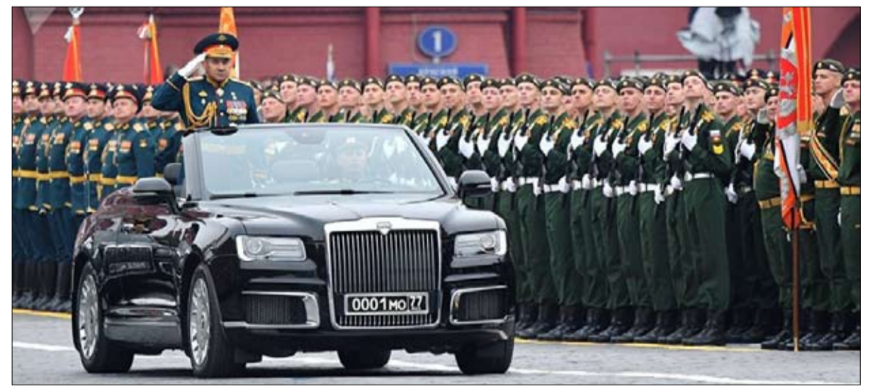
احتفال ضخم بذكرى الانتصار على النازية