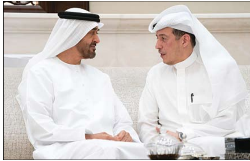
محمد بن زايد خلال استقباله سفير المملكة العربية السعودية لدى الدولة

انطلقت حملة الشبيخة فاطمة الإنسانية، لدعم الأسر الفقيرة والمتعففة في إقليم السند بجمهورية باكستان الإسلامية. وتتضمن الحملة تقديم الدعم اللازم لتلك الأسر من خلال توزيع السلال الغذائية الشاملة - 100 كيلو من المواد الغذائية لكل سلة - وتحتوي على مستلزمات إفطار رمضان، بالإضافة لمياه الشرب المعدنية. (التفاصيل ص 4)