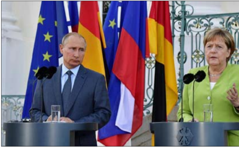
روسيا لا مناص من أوروبا للخلص

كما كان يحدث في دبلوماسية النظام القديم، لا معنى له، نحن لا نستبدل أمريكا بروسيا، كما فعلت فرنسا مع بروسيا والنمسا عام 1756.