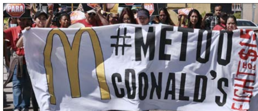
مي تو لا تمر في الدنمارك

من المسكوت عنه، يخيف مصطلح "النسوية" وزيرة المساواة الدنماركية، كارين إيمان، التي صرحت مراراً بأنها ليست في تلك الخانة، معتبرة أنها أكثر نشاطاً من أجل المساواة، والوزيرة ليست وحدها في هذا السجل بما أن البيانات تشير إلى أن ربع النساء الدنماركيات فقط يعتبرن أنفسهن نسويات.