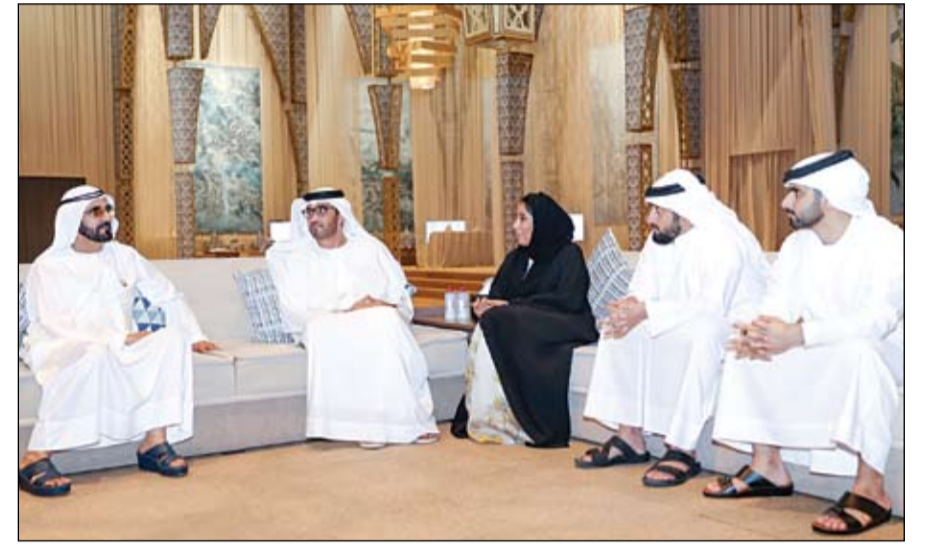
محمد بن راشد خلال لقائه لفيفا من القيادات الإعلامية (وام)

الإسلامي التي تستضيفها مكة المكرمة. تسلم الرسالة صاحب السمو الشيخ محمد بن زايد آل نهيان ولي عهد أبوظبي نائب القائد الأعلى للقوات المسلحة خلال استقبال سموه.. في قصر الطينين - سعادة تركي الدخيل سفير المملكة العربية السعودية لدى الدولة. من جهة أخرى استقبال سموه في قصر الطينين جموع المواطنين المهنيين بشهر رمضان. (التفاصيل ص 2-3)