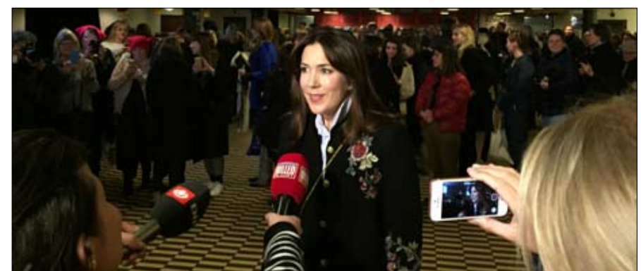
وزيرة المرأة مع المساواة ضد النسوية

• الدنماركيون أكثر تسامحاً مع التحرش بسبب ثقافة تميل إلى التركيز على النوايا لا على الأفعال • أكثر من اثنين من كل خمسة دنماركيين يرفضون حركة مي تو الأمريكية