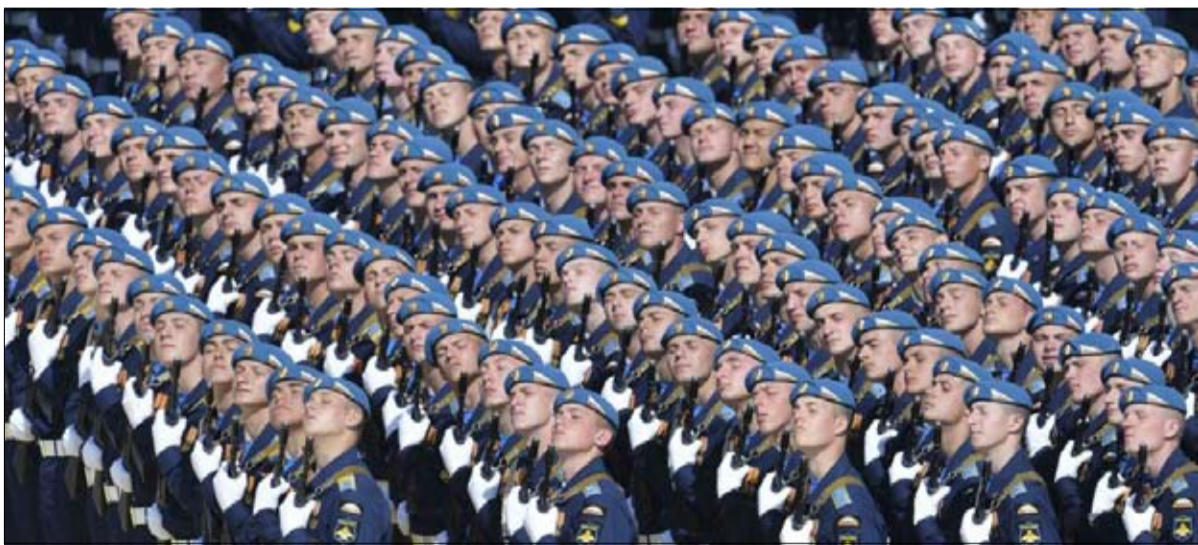
التقييم الموضوعي مطلوب لتوجيه البوصلة

يوجد في الحقيقة تباين كبير بين الطريقة التي تنظر بها روسيا إلى دورها في العالم، والأوراق الموضوعية التي في حوزتها. وحتى إن كانت الخصال التكتيكية، التي لا يمكن إنكارها، فلاديمير بوتين بإمكانها أن تُضلل، وتعطي للروس انطباعاً مجسماً، ولكنه خطير أيضاً، إذ يمنحهم الشعور بأنهم في درجة أعلى مما هم عليه في الواقع. هناك حدود موضوعية للإبهاه الذاتي والمباهة الذاتية. في الواقع، إن روسيا في كل مكان، وليست، كما قال باراك أوباما، مجرد صيغة مهينة مجانية، مجرد قوة إقليمية. إنها تسمع صوتها