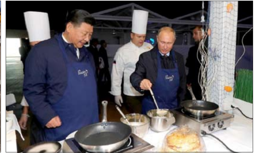
الطبخة الجيدة استراتيجية مع من؟

التقارب بين أوروبا وروسيا شرعي، بل ضروري، والمسألة لا تتعلق بخيانة أوروبا لقيمها