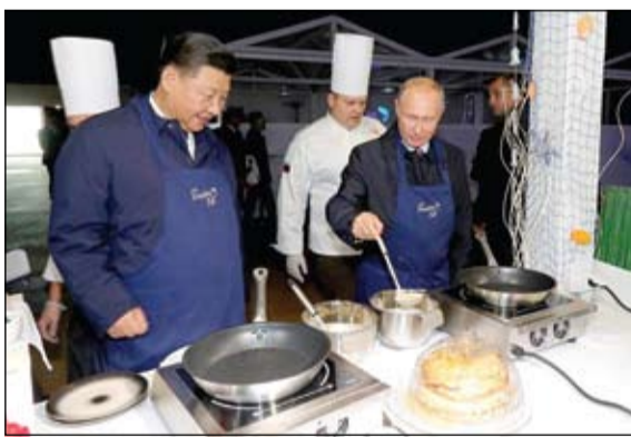
الطبخة الجيدة استراتيجيا مع من؟

كما أذان الأزهر الشريف بشدة، استهداف محطتي ضح أرامكو في محافظة النواصري وعفيف بمنطقة الرياض بالمملكة العربية السعودية. واكد الأزهر في بيان أمس أن مثل هذه الأعمال الإرهابية التي تسعى للنيل من أمن واستقرار المملكة أعمال إجرامية بغضه ترفضها الأديان السماوية وكل الأعراف والقوانين والمبادئ الإنسانية مطالباً المجتمع الدولي بتضاهر الجهود لمواجهة الإرهاب بكل صوره وأشكاله. وكانت المملكة العربية السعودية قد أعلنت عن استهداف محدود لمحطتي الضح البترولية التابعتين لشركة أرامكو بمحافظة النواصري وحفاظة عفيف بمنطقة الرياض. وقال المتحدث الأمني لرئاسة أمن الدولة بالمملكة - في تصريح بثته وكالة الأنباء السعودية «واس»، أمس - بأنه ما بين الساعة السادسة والسادسة والنصف من صباح أمس الثلاثاء حدث استهداف محدود لمحطتي الضح البترولية التابعتين لشركة أرامكو بمحافظة النواصري وحفاظة عفيف بمنطقة الرياض. وذكرت «واس»، أن الجهات المختصة باشرت مسؤولياتها بالموقعين، وسيتم الإعلان لاحقا عن أي مستجدات. (التفاصيل ص 13)