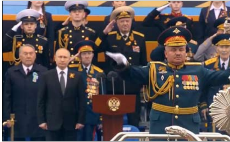
بوتين يحتفي بعظمة الجيش الروسي

يوجد تباين كبير بين الطريقة التي تنظر بها روسيا إلى دورها في العالم وما تملكه من أوراق