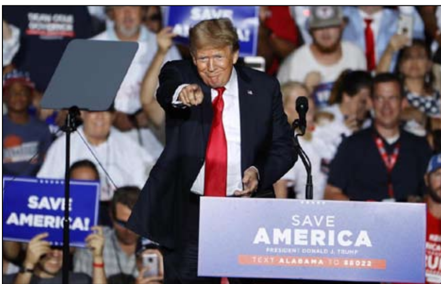
ما كان ليحقق ما هو الأفضل

- المغادرة الكارثية لأفغانستان ثقلها على الرأي العام