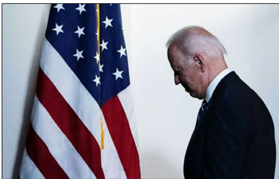
بايدن يتحمل المسؤولية