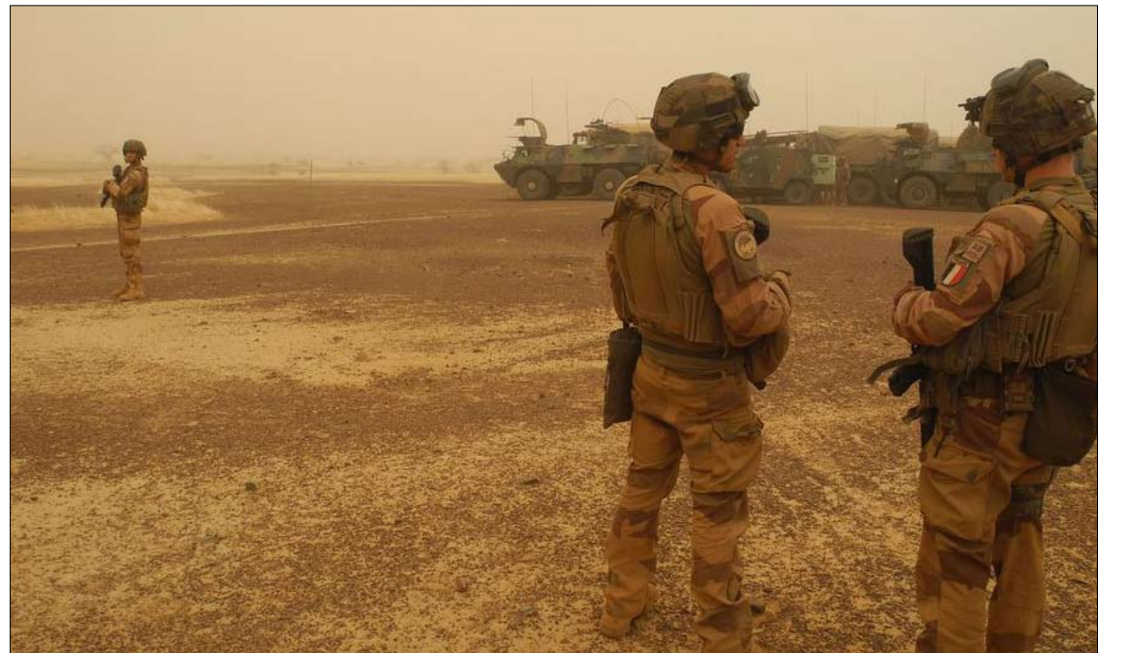
غروب برخان وميلاد عملية اخرى