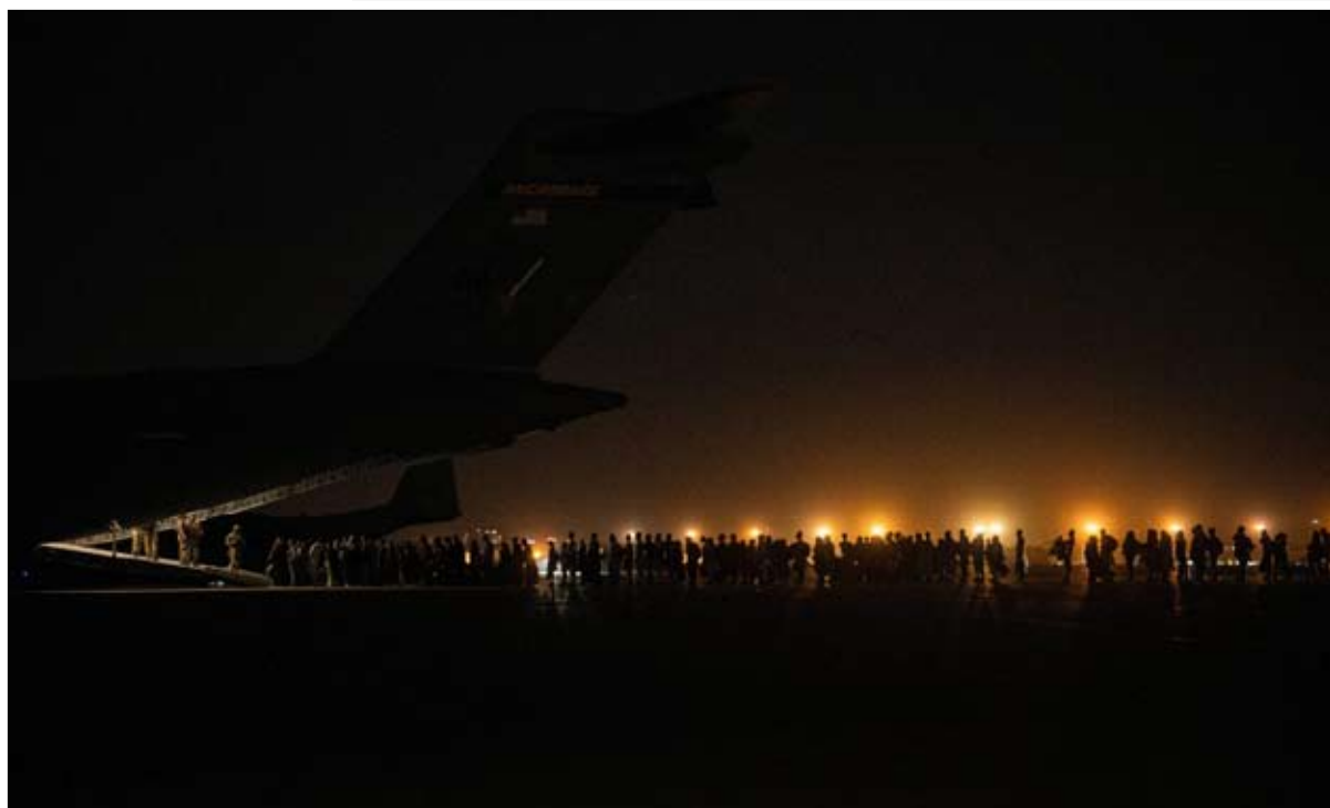
مطار كابول قد يهزم بايدن