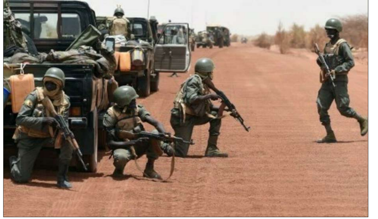
جنود من الجيش المالي في تدريب

عسكري. بالإضافة إلى ذلك، فإن نظام إدارة الموارد البشرية يجعل من المستحيل معرفة بالضبط ما مضى الجنود المدربين.