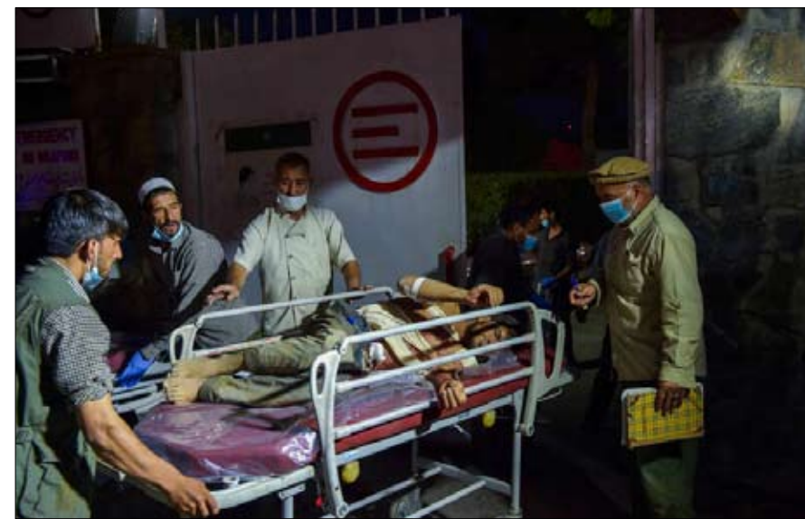
داعش يقبل خارطة التحالفات