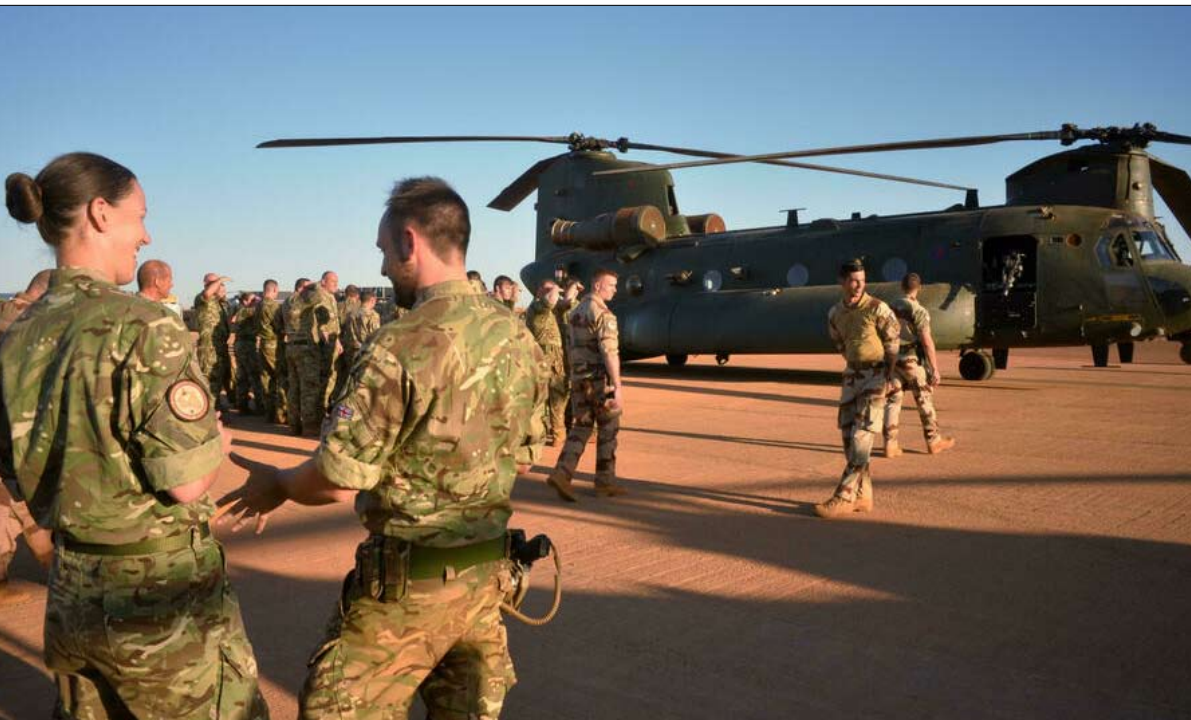
قوات اوروبية في مالي