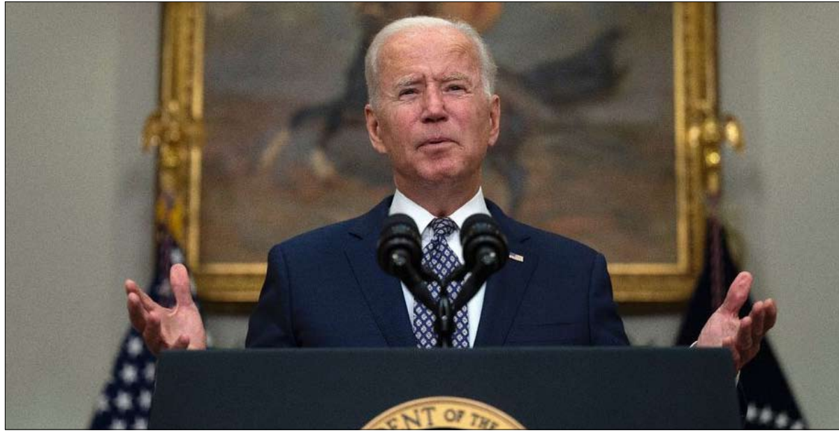
هل يدفع الرئيس الأمريكي الفاتورة بمفرده؟

- صورة الكفاءة والاحتراف التي تمكن الديمقراطيون من إيصالها للجمهور منذ بداية العام، تضررت مؤقتاً