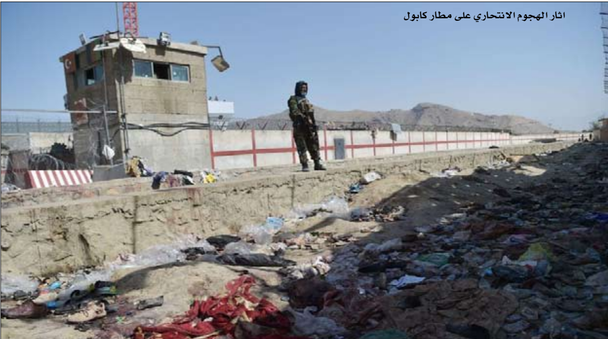
اثر الهجوم الانتحاري على مطار كابول

إنه الهجوم الأكثر دموية الذي تعرضت له الولايات المتحدة في أفغانستان منذ 6 أغسطس 2011 -أسفطت طالبان طائفة هليكوبتر من طراز شينوك في ذلك اليوم "قتل 30 جندياً". وخصوصاً، يأتي هذا الهجوم في لحظة رمزية جداً، تلك التي تخلت فيها واشنطن عن الأراضي الأفغانية، وعلى عجل، لأولئك الذين سبق أن طردتهم قبل عقدين من الزمن، طالبان. لذلك فهو يخاطر بترك وصمة عار لا تحصى على رئاسة جو بايدن، التي تنتقدها جميع الأطراف بسبب سوء إدارتها لهذا الفصل من التغيير الأفغاني. نقطة أخرى تفرح تنظيم داعش: هذا الهجوم، يقوض مصداقية حركة طالبان، العودة للدولة للتنظيم من