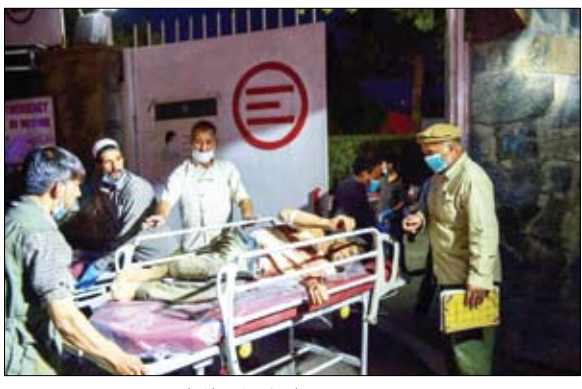
داعش يقلب خارطة التحالفات

بسقوط سايغون عام 1975، ولكن كانت الصور الأولى للهروب في المطار مجرد مقدمات.