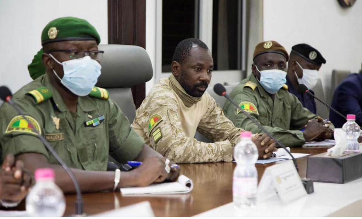
الانقلاب لخبط الاوراق