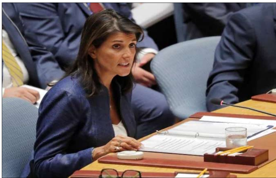
نيكي هالي تقصف بايدن بلا رحمة

خيرة في الولايات المتحدة، ومؤلفة سيرة رونالد ريغان الذاتية، فرانسواز كوست، تترى: "كان الجميع يعلم أن الحرب ستنتهي بشل. على الأقل، جو بايدن، الذي عارض إرسال جنود إضافيين قرره أوباما عام 2009، وكانت لديه الشجاعة لوضع حد لذلك، مدركاً أنه سيتعرض لتيران النقاد. وكان رهانه أنه في غضون شهر، سيتم طي الصفحة، وأن الأمر لن يتعلق سوى بخطة البنية التحتية، التي لا يقارن مبلغها الهائل إلا بصفحة روزفلت الجديدة في الثلاثينات..