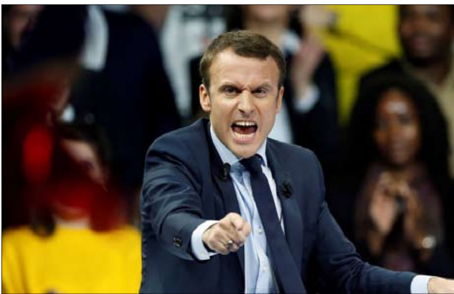
ماكرون: لا حوار مع الإرهاب

”إنهاء القيادة العليا للمنظمين المعادين وفك تنظيمهما“ و ”دعم تطور جيوش المنطقة ومزيد الارتقاء بقدراتها..“ إعادة التوجيه هذه محيرة إلى حد ما. إلى جانب الوجود الرمزي، يمكن التساؤل عما إذا كان الأوروبيون سيأتون ”ليبقوا بأنفسهم“ في مستنقع الساحل إلى جانب فرنسا. بالإضافة إلى ذلك، يبدو أن تطور قوة الجيوش الوطنية في الساحل هدف بعيد المنال بما أنه يبدو من الصعب تحقيق هذه المهمة. وتجد البرامج التدريبية لجنود دول الساحل صعوبة في أن تترجم إلى نجاح فرصة للبلاد للانفتاح على تعاون عسكري جديد، خاصة مع روسيا. من ناحية أخرى، رأى آخرون الأمر على أنه تحويل وجهة من جانب الرئيس الفرنسي. هل انتهاء عملية برخان يعني نهاية الوجود العسكري الفرنسي في مالي؟ الحقيقة هي أن إعلان إيمانويل ماكرون بعيد كل البعد عن الانسحاب التام للقوات الفرنسية، إنه تطور نحو إنشاء قوة أوروبية، وفي هذه الحالة فرقة العمل الأوروبية تاكوبا، المشكلة من 600 شخص نصفهم فرنسي، وكذلك الاستونيون والتشيك والسويديون والإيطاليون. لذلك