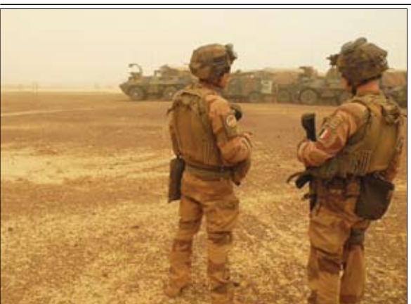
عروب برخان وميلاد عملية أخرى