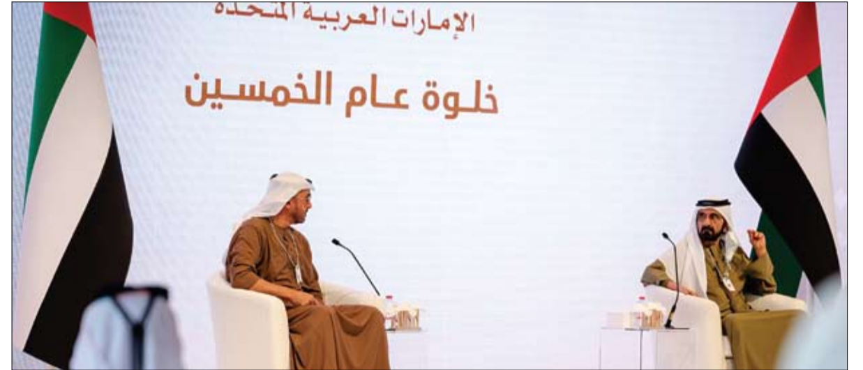
شاركاً في أعمال خلوة عام الخمسين