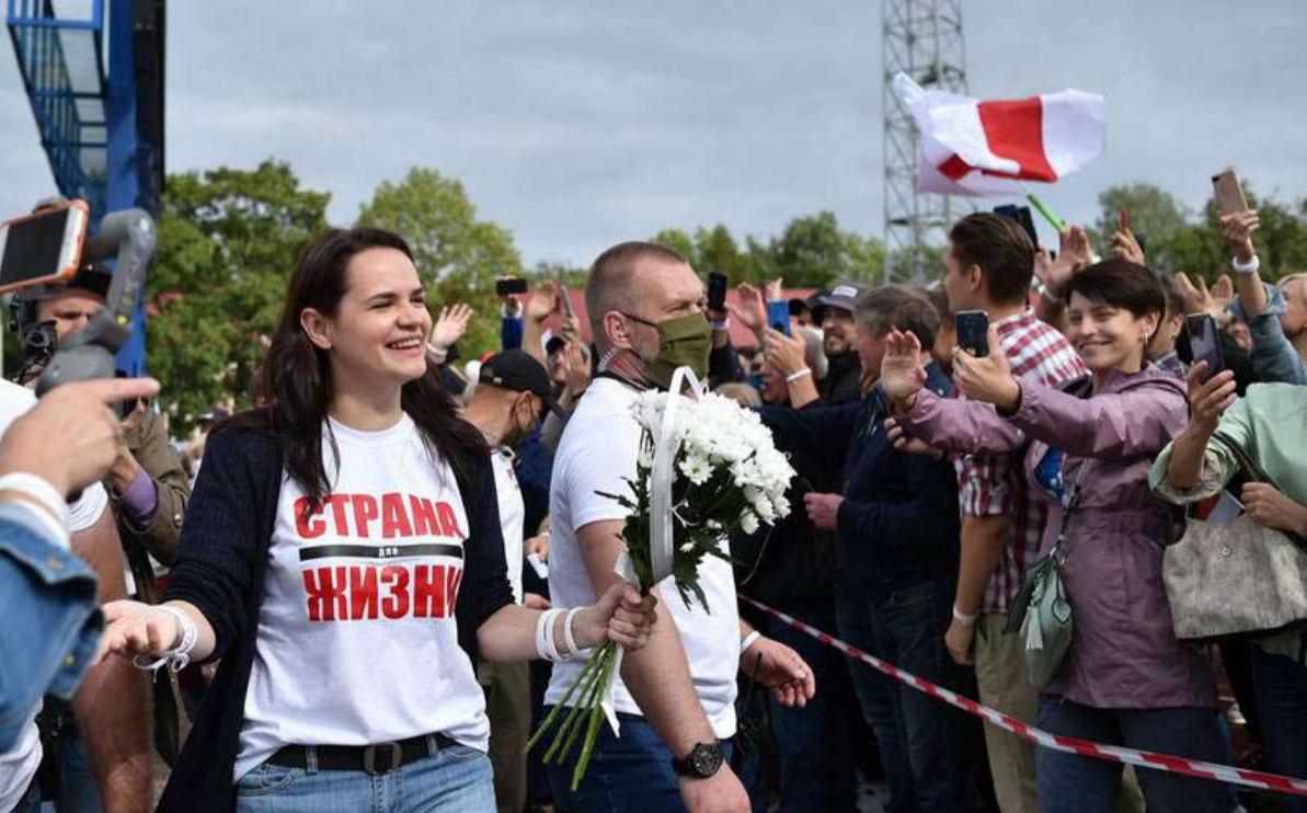
سفيتلانا تسبخانوفسكا، مرشحة المعارضة في الانتخابات