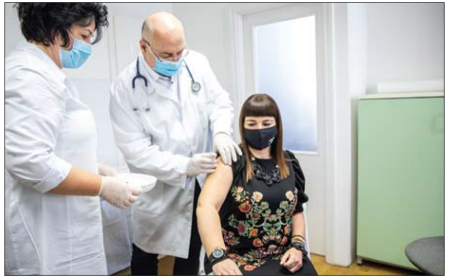
امرأة تتلقى اللقاح المضاد لكورونا بحد مراكز التطعيم في هنجاريا

• القدس-وكالات: اتهمت إسرائيل إيران أمس بتدمير عمليات الوكالة الدولية للطاقة الذرية، مؤكدة أن طهران تواصل تخصيب اليورانيوم، في خطوات تصعيدية أكدت أنها لن تهر دون رد. وقال وزير الخارجية الإسرائيلي في بيان إن إيران تواصل تخزين اليورانيوم المخصب وتخاذل وتحفي إصرارها على التوصل إلى سلاح نووي، كما تقوم بتدمير ما تبقى من عملية تفتيش الوكالة الدولية للطاقة الذرية. كما رأى أن خطواتها المتطرفة تتطلب ردًا دوليًا قويًا. واعتبر أن مساس إيران بالوسائل الخاصة بعمليات تفتيش المنشآت النووية ووقف العمل بالبروتوكول الإضافي هي خطوات متطرفة تتخطى كل الخطوط الحمراء التي وضعتها الأسرة الدولية.