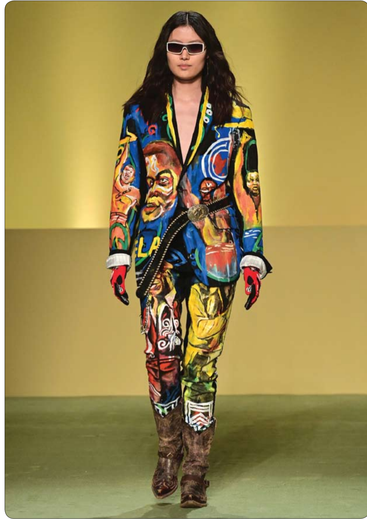
عارضة أزياء تقدم إبداعاً لمصمم الأزياء السنغالي بابي موكودو من مجموعة حياة سوداء مهمة في الموضة

بعد مرور عام، لا يزال القطاع يعاني التداعيات الاقتصادية والتنظيمية لوباء أصبح عالمياً. ومع ذلك، فإن نسخة هذه السنة من أسبوع الموضة في ميلانو التي تقام من 24 شباط/فبراير إلى 1 أبريل من آذار/مارس المقبل تتوسع إلى إظهار قدرة صناعة الموضة على التكيف والصمود.