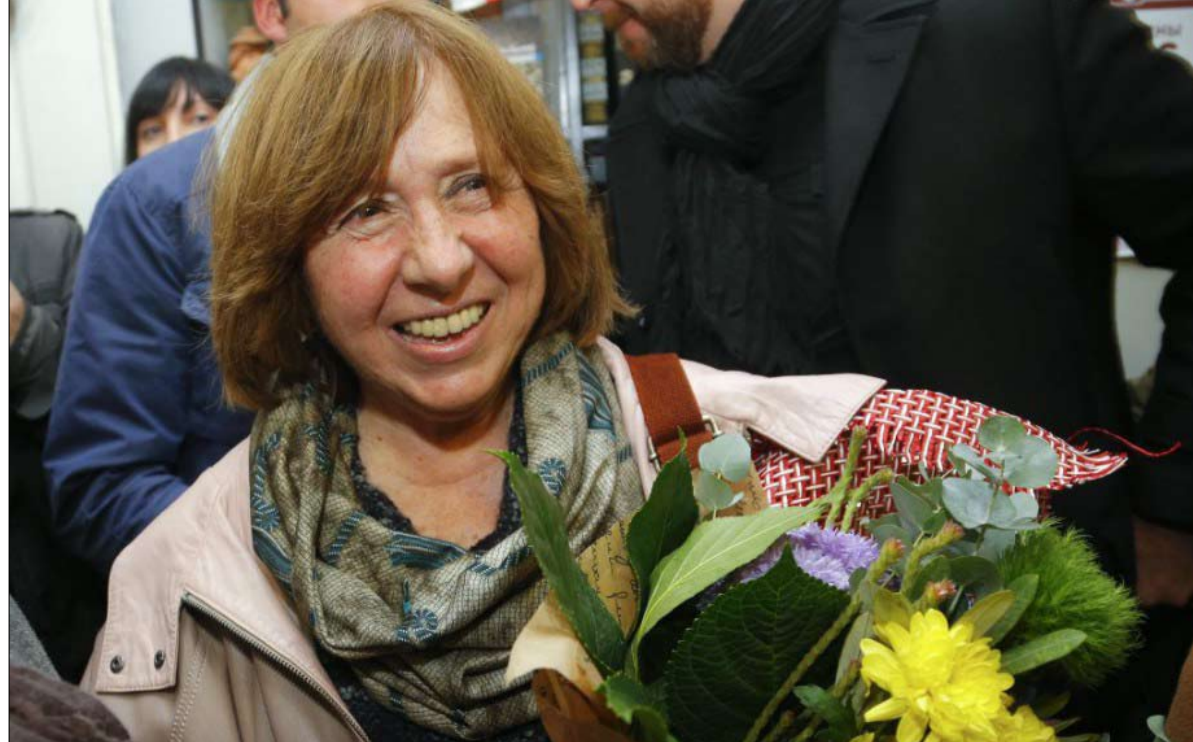
سفيتلانا ألكسييفيتش، الكاتبة الحائزة على جائزة نوبل للآداب