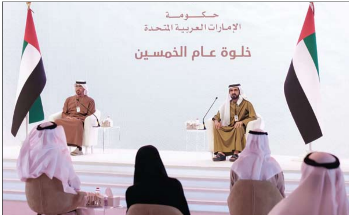
محمد بن راشد ومحمد بن زايد خلال ترؤسهما أعمال خلوة عام الخمسين بمشاركة وزراء الحكومة ومسؤولي الجهات الاتحادية والمحلية

• محمد بن راشد: في الإمارات لا نعترف بالاستحليل.. • لدينا القوة العلمية والاقتصادية ولدينا محمد بن زايد • محمد بن زايد: عودنا محمد بن راشد على الرقم واحد ولن نتخلى عنه وهدفنا المنافسة العالمية