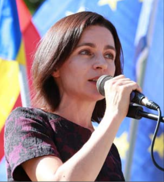
انتخاب مايا ساندو رئيسة في مولدوفا