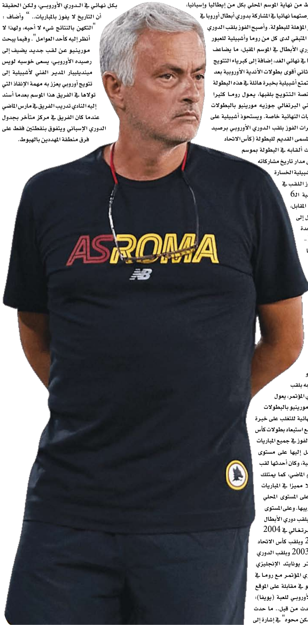
فرق منطقة المهددين بالهبوط.

العديدة التي أبرمها تشيلسي في الموسم المنقضي، سواء خلال فترة الانتقالات الصيفية أو في يناير الماضي، يطمح النادي إلى استغلال خبرة بوتشيتينو، الذي تولى أيضاً تدريب باريس سان جيرمان الفرنسي، في المنافسة بقوة بالموسم المقبل. وقال لورانس ستوارت وبول وينستاتلي مديرا الكرة في تشيلسي، على الموقع الإلكتروني للنادي: "خبرة بوتشيتينو وقدراته القيادية وشخصيته ستساعد في المنى قدمنا بفريق تشيلسي... نهجه التكتيكي والتزامه بالتطوير جعلنا منه مرشحاً استثنائياً". ويواجه تشيلسي مع بوتشيتينو أكثر من تحدٍ صعب في الفترة المقبلة، ويأتي في مقدمتها مدى قدرة المدرب الأرجنتيني على الاستفادة القصوى من الصفقات التي أبرمها الفريق في الموسم المنقضي، وكان من بينها التعاقد مع الأرجنتيني إنزو فيرنانديز الفائز بجائزة أفضل لاعب شاب في كأس العالم 2022، والذي أصبح الصفقة الأعلى لأي لاعب