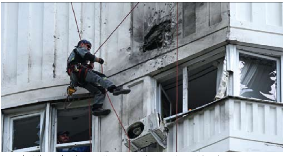
متخصص يتفقد الواجهة المتضررة لمبنى سكني ناتج عن هجوم بطائرة بدون طيار في موسكو

وتابعت تم صد 3 طائرات بوسائل الحرب الإلكترونية وفقدت السيطرة وانحرفت عن أهدافها. وأسقط نظام صواريخ باتستير-إس أرض جو 5 طائرات مسيرة في منطقة موسكو. من جانبه، نفى مستشار الرئاسة الأوكرانية مشاركة كييف بشكل مباشر