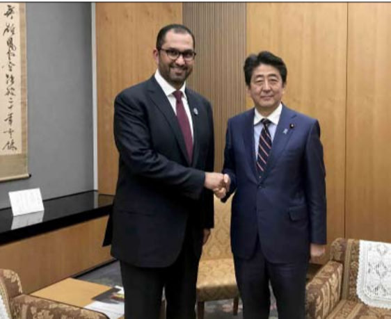
دولة الإمارات واليابان لاسيما في قطاع النفط والغاز والصناعات البتروكيماوية. وترتكز أدنوك على توسيع محفظة عملياتها في مجال التكسير والغاز والبتروكيماويات وترسيخ مكانتها ودورها كمورد موشوق للنفط والمنتجات المكررة لأكبر الطلب العالمي المتنامي على المنتجات البتروكيماوية خاصة في قارة آسيا. ومن المتوقع أن يرتفع الطلب على المنتجات البتروكيماوية والبتلاستيك في قارة آسيا لأكثر من الضعف بحلول عام 2040. وتواكب هذا الطلب تصف «ادنوك» عددا من المشروعات والتوسعات في مجالات التكسير والشتقات والبتروكيماويات لضاعة إنتاجها من البتروكيماويات ثلاث مرات بحلول عام 2025. وتتمتع أدنوك تخصيص ما لا يقل عن 40% من إجمالي مصاريفها الرأسمالية على مدى السنوات الخمس القادمة والبالغة قيمتها 109 مليارات دولار لتحقيق أهدافها في هذا المجال. وتتوي أدنوك توسيع مجمع الرويس ليصبح أكبر موقع متكامل في مكان واحد في العالم لعمليات تكرير النفط والصناعات

هبطت الأسهم الأوروبية امس واتجهت إلى تسجيل أكبر خسارة أسبوعية في ستة أشهر حيث تضرر القطاع المصرفي الذي انقل من هبوط أسهم دويتشه بنك بعد خسارة فاقت التوقعات. وأدى هبوط أسهم البنك الألماني بنسبة بلغت خمسة بالمئة وتسجيل خسائر في معظم القطاعات إلى تراجع المؤشر ستوكس 600 بنسبة 0.4 بالمئة بحلول الساعة 0810 بتوقيت جرينتش لينتج إلى تسجيل