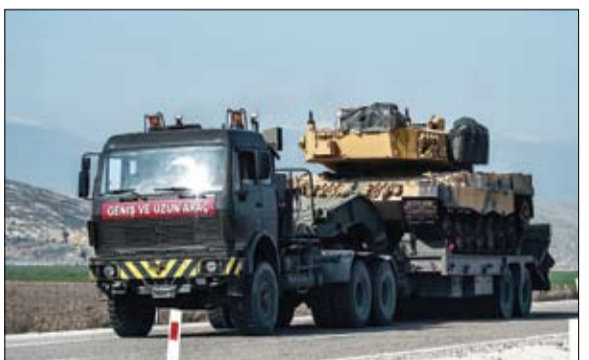
عواصم-وكالات: اليوم الرابع عشر على التوالي، يستمر الجيش التركي بمساندة من فصائل المعارضة السورية المسلحة المدعومة من أنقرة، عملياته العسكرية في عفرين السورية ضد المسلحين الأكراد. وكان الجيش التركي أصدر بياناً قال فيه إن طائراته دمّرت في الساعات الأخيرة 14 هدفاً للمسلحين، معلناً مقتل 21 إرهابياً. وأعلنت القوات المسلحة التركية، الخميس، أن عدد الإرهابيين الذين تم القضاء منذ بدء العملية في عفرين، وصل إلى 811. وتقول أنقرة إن العملية العسكرية في عفرين تستهدف أيضاً مسلحي داعش، فيما تنفي وحدات حماية الشعب الكردية وجود التنظيم في المنطقة. وقالت مصادر تركية إن المسلحين الأكراد في عفرين أطلقوا عدداً من الصواريخ على مدينتي هاتاي وكيليس التركيتين الحدوديتين، إيطاليا وأصاب أحدهما معلماً تاريخياً وسط كيليس مما أوقع

عواصم-وكالات: سقط عشرات المدنيين بين قتيل وجريح، امس الجمعة، في غارات للنظام السوري على مدن وبلدات حرستا وعربين في الغوطة الشرقية بريف دمشق، وفق ما أكد مركز الدفاع المدني في الغوطة لسكاي نيوز عربية. وتأتي الغارات بالتزامن مع قصف صاروخي ومدفعي مكثف على بلدات دوما وكفرطينا وحمورية وعدة مناطق في الغوطة الشرقية الدولية إن نقص الأسلحة. والأغذية والأدوية يساهم في أسوأ موجة سوء تغذية جراء الحرب التي اندلعت قبل 7 سنوات. الى ذلك، أعلنت إدارة الرئيس الأميركي، دونالد ترامب، أن حكومة الرئيس السوري بشار الأسد ربما تكون تطور أسلحة كيميائية جديدة أكثر تطوراً،