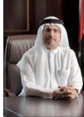
•• لندن-رويترز: التواصل الاجتماعي، والاستبيان الإلكتروني على الرابط www.dewa.gov.ae/

أكثر ميلاً إلى تشديد السياسة النقدية. لكن الارتقاء في العائد الذي من المفترض أن يقود الدولار إلى الصعود لم يحدث أثرًا إلى الآن. وأظهر مسح نشرت نتائجه الخميس أن الصناعات التحويلية في الاتحاد الأوروبي واصلت التحسن الشهر الماضي مما عزز التوقعات بأن يكون البنك المركزي الأوروبي على مسار تطبيع سياسته النقدية. وجرى تداول اليورو دون تغير يذكر مقابل العملة الأمريكية عند 1.2505 دولار، وهو مستوى قريب من الأعلى في ثلاث سنوات التي سجله في وقت سابق من الأسبوع عندما بلغ 1.2538 دولار. وخلال الأسبوع، زاد اليورو نحو 0.6 بالمئة.