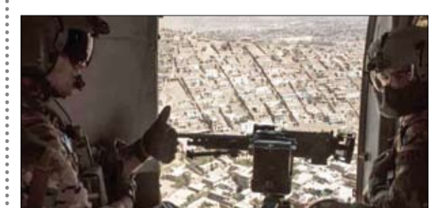
عواصم-وكالات: يسعون في الغوطة الشرقية التي تسيطر عليها المعارضة، وتحاصرها القوات الحكومية. الأغذية والأدوية يساهم في أسوأ موجة سوء تغذية جراء الحرب التي اندلعت قبل 7 سنوات. الى ذلك، أعلنت إدارة الرئيس الأميركي، دونالد ترامب، أن حكومة الرئيس السوري بشار الأسد ربما تكون تطور أسلحة كيميائية جديدة أكثر تطوراً،