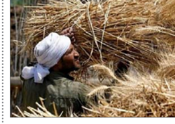
الهيئة العامة للسلع التموينية في السنة الأخيرة حيث كانت الغالبية العظمى من مشترياتها من ذلك المنشأ نظرا لضخامة الإمدادات والأسعار التنافسية.

إن الحد الأدنى المطلوب للبروتين في القمح الفرنسي أيضا جرى تخفيضه إلى 11 بالمئة من 11.5 في المئة. وهيم القمح الروسي على مشتريات