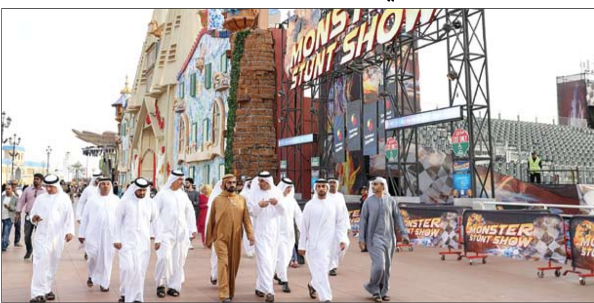
محمد بن راشد خلال جولته في القرية العالمية المشاركة في فعاليات القرية العالمية التي تفتح ابوابها للزوار والسياح والمتسوقين داخل الدولة وخارجها اعتباراً من الأول من نوفمبر وحتى السابع من ابريل القادم. وعرج صاحب السمو نائب رئيس الدولة ورئيس مجلس الوزراء والافريقية حيث كان سموه حريصاً خلال لقائه الضاممين على هذه القرى التراثية التي التعرف على ثقافات الدول

والحلويات وغيرها الى زوار القرية من عائلات وأطفال ثم توقف سموه عند "الصنعة" قرية فخر الأسر الإماراتية التي تصنع الأكولات الشعبية والمشغولات اليدوية التراثية وغيرها من المنتجات الوطنية التي تعكس تراث وثقافة ونمط معيشة شعب الإمارات. ثم واصل سموه جولته الميدانية حيث توقف عند محال دعم مشاريع الشباب التي تباع وتعرض منتجات هذه المشاريع الدعومة من مؤسسة محمد بن راشد آل مكتوم لدعم المشاريع الصغيرة والمتوسطة وتعرف سموه على هذه الصناعات التي تبدأ صغيرة ومتواضعة ثم تكبر عاماً بعد عام حتى تصبح مشاريع إنتاجية كبيرة تساهم في خلق فرص عمل للشباب وتدعم اقتصادنا الوطني وتسهم في تنوعه. (التفاصيل ص 2)