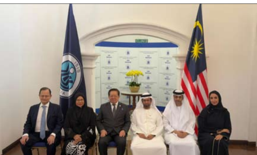
والتحريض، وما يترتب على دعم أدوات للتدخل في شؤون الدول، بما يقوض السلم والأمن الإقليمي والتنظيمات المتطرفة واستخدامها. يهدد أمن المجتمعات واستقرارها، والدولي.

مجتمعات قادرة على مواجهة الفكر المتطرف، وهو النهج الذي تبنته دولة الإمارات من خلال الاستثمار في الإنسان، وتمكين الشباب وتعزيز الحوار بين الأديان والشخصيات، وتطوير الخطاب الديني المعتدل، لترسخ قيم التسامح والتعايش، وتقديم نموذجاً عالمياً في بناء مجتمع آمن ومستقر يحضن أكثر من 200 جنسية. وحذر معالي النعيمي من استفحال الدين لتحقيق أهداف سياسية، ومن تشامي خطاب الكراهية