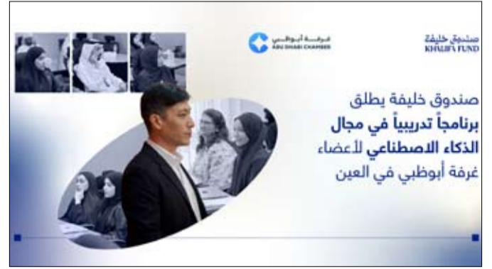
صندوق خليفة يطلق برنامجاً تدريبياً في مجال الذكاء الاصطناعي لأعضاء غرفة أبوظبي في العين