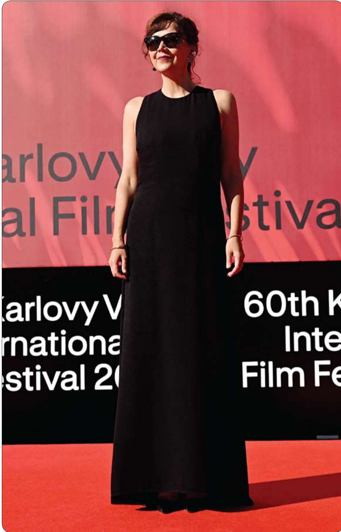
الممثلة الأمريكية ماغي جيلينهاال تتألق على السجادة الحمراء خلال افتتاح مهرجان كارلويفي فاري السينمائي الدولي في كارلويفي فاري، التشيك.

تمكن فريق طبي روسي من تحقيق إنجاز لافت في مجال جراحة القلب لدى الأطفال، بعدما نجح في إنقاذ حياة رضيع حديث الولادة كان يعاني من تشوه خلقي نادر ومعقد في القلب، عبر تقنية جراحية مبتكرة اعتمدت على استخدام أنسجة الطفل نفسه لتشكيل صمام قلبي جديد. بحسب ما ذكرت وكالة ريا نوفوستي الروسية. وأجريت العملية في المستشفى السريي الإقليمي رقم 1 بمدينة نيومين الروسية، تحت إشراف رئيس قسم جراحة القلب الدكتور كيريل غورباتيكوف، الذي قاد فريقاً متخصصاً للتعامل مع الحالة الاستثنائية. وأعلن حاكم منطقة نيومين، ألكسندر مور، أن الأطباء واجهوا تحدياً كبيراً تمثل في إيجاد حل طويل الأمد يضمن استمرار عمل القلب بكفاءة مع نمو الطفل. وأوضح أن الطرق العلاجية التقليدية تعتمد عادة على زرع صمام صناعي في الشريان الرئوي، إلا أن هذه الصمامات تحتاج إلى الاستبدال بشكل متكرر مع تقدم الطفل في العمر. لكن الفريق الطبي اختار مساراً مختلفاً، إذ نجح في تصميم صمام جديد باستخدام أنسجة مأخوذة من جسم الرضيع نفسه، ما يمنحه القدرة على النمو بصورة طبيعية مع نمو الجسم، ويقلل احتمالات الخضوع لعمليات جراحية إضافية في المستقبل.