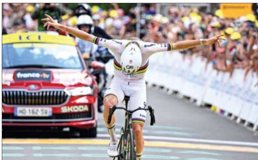
فرنسا والنمسا جاهزية الفريق للمنافسة على الألقاب، بفضل العمل الجماعي والانضباط التكتيكي والمستويات الفنية المتميزة التي يقدمها دراجوه في مختلف السباقات الدولية.