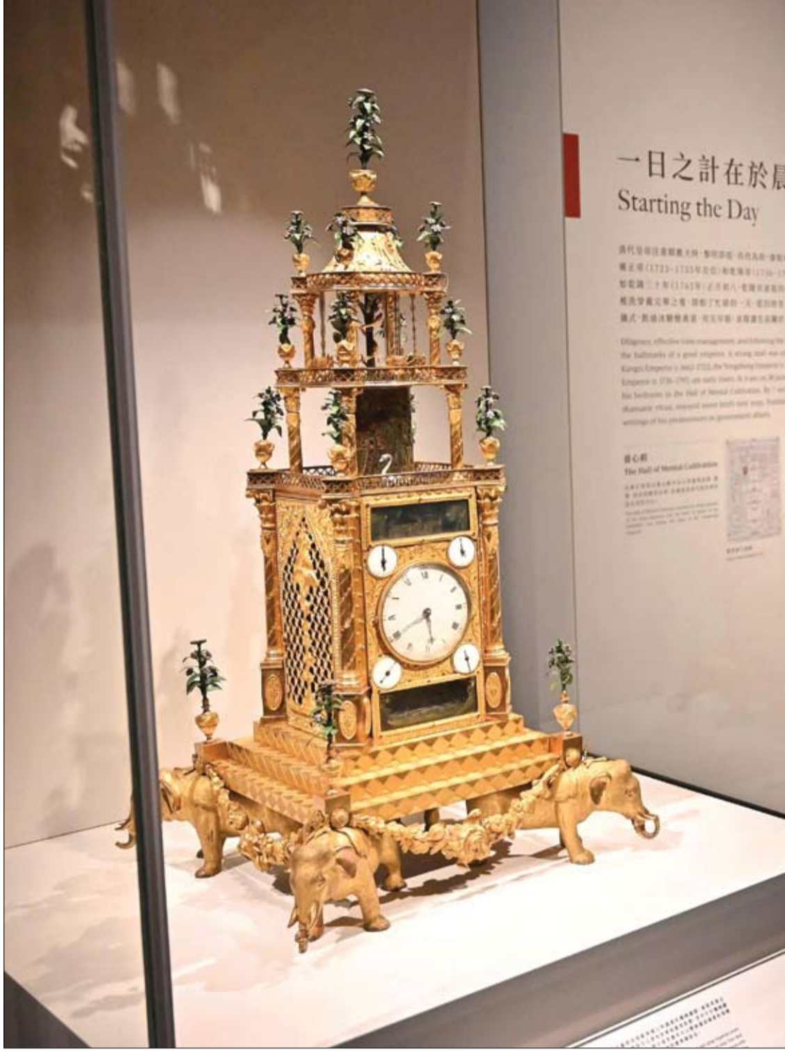
ساعة نحاسية مطلية بالذهب من القرن الثامن عشر في بريطانيا معروضة خلال معابنة إعلامية لمتحف قصر هونغ كونغ في الصين.

ويحسب الخبراء فإن النساء اللواتي شاركن في هذه الدراسة هن أمهات جدد حضرن في وقت حرج للغاية عندما كان أطفالهن بعمر أسابيع للمشاركة في بحث لمساعدة النساء الأخريات.