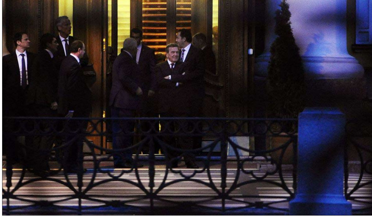
المستشار الألماني السابق جيرهارد شرودر يغادر قصر سانت بطرسبرغ حيث احتفل بعيد ميلاده السابعين

الأخيرة من العقوبات سرّعت هذه المرحلة. لكن رايتشل مينونغ لي من مركز ستيمسون للأبحاث تعتبر أن "بيونغ يانغ قد تترك هامشاً معيناً للمناورة، بناء على رد إدارة بايدن". مطلع الأسبوع، دعت الولايات المتحدة كوريا الشمالية إلى "وقف نشاطاتها غير القانونية والمزعزعة للاستقرار" وطالبت بفرض عقوبات دولية جديدة ضد بيونغ يانغ. ردّ المبعوث الصيني الخاص لشبه الجزيرة الكورية ليو شيابونغ على هذا الطلب، فكتب في تغريدة إن "مجلس الأمن (الدولي) ليس لديه نية مناقشة مشروع قرار مزعوم يتعلّق بعقوبات ضد جمهورية كوريا الديمقراطية الشعبية. يعتزم النظام الكوري الشمالي أكثر من أي وقت مضى، تعزيز قدراته العسكرية في ظل الأزمة الاقتصادية القوية التي تمرّ بها بيونغ يانغ التي تفاقمها العقوبات الدولية والإغلاق الصارم لحدود البلاد منذ 2020 لوبقاية من كوفيد-19. وفي الفترة الأخيرة، استأنف النظام الكوري الشمالي مبادلاته التجارية مع الصين. ففي نهاية الأسبوع الماضي، وصل قطار بضائع من كوريا الشمالية إلى مدينة اندونغ الصينية الحدودية للمرة الأولى منذ مطلع 2020.