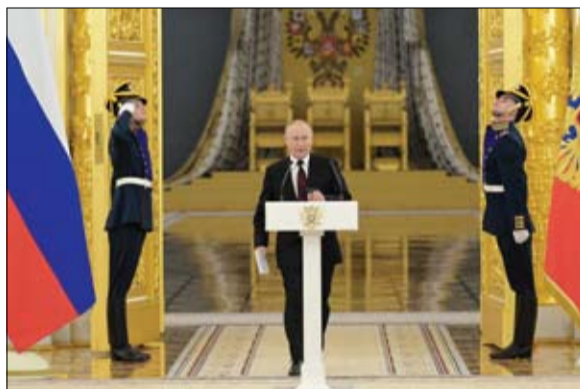
دبلوماسية تستمد جذورها من عهد القباصرة والسوفيات

كما أوضح أن العواقب التي واجهت الانتخابات تتلخص في الأحكام الصادرة عن لجان الطعون، فيما يخص ملفات مرشحي الرئاسة، مضيفاً أن تلك الأحكام لم تتسق مع نصوص قانون انتخاب الرئيس، فيما يتعلق بشروط الترشح. يذكر أنه في وقت سابق، اقترحت المفوضية العليا للانتخابات يوم 24 يناير الحالي موعداً لإجراء الجولة الأولى من الانتخابات الرئاسية، لكن الأسباب التي أدت إلى تأجيل الانتخابات وفشل إجرائها في ديسمبر لا تزال قائمة.