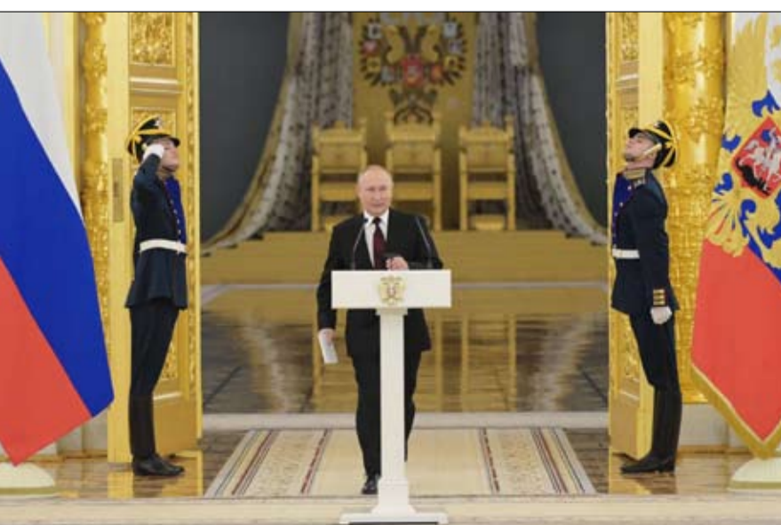
دبلوماسية تستمد جذورها من عهد القيصرية والسوفيات