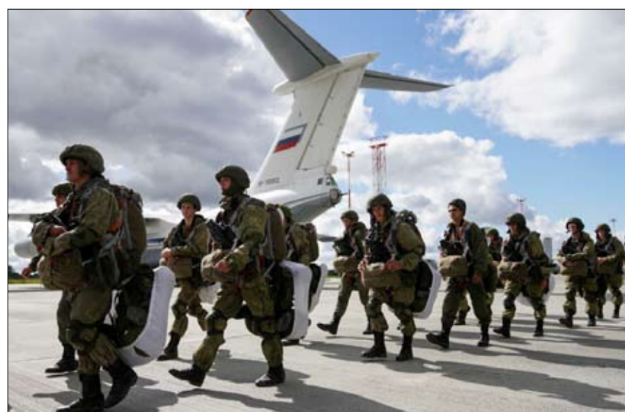
القوات الروسية تنتشر

إن التفكير في هذين المجالين من مجالات العمل على أنها منفصلان سيمنعنا فعلاً من فهم مصالح روسيا، وكذلك المخاطر التي تصاحب أفعالها. لذلك من المناسب العودة إلى أساس ما يشكل هذه الاستراتيجية.