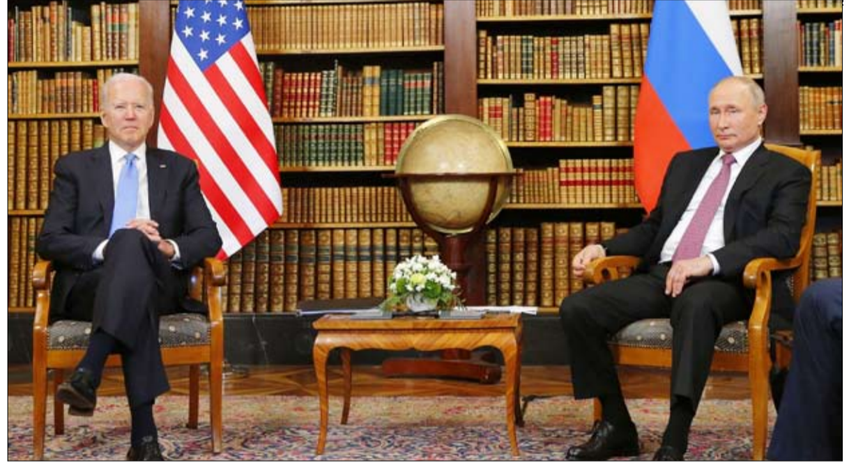
التفاوض من موقع قوة

الرجل الثاني في الدبلوماسية الروسية، سيرجي ريبكوف، قد يصبح لاحقاً وباطلاً بسبب ضغوط الصقور في موسكو التي تدفع باتجاه تبني موقف أكثر حزمًا وعدوانية.