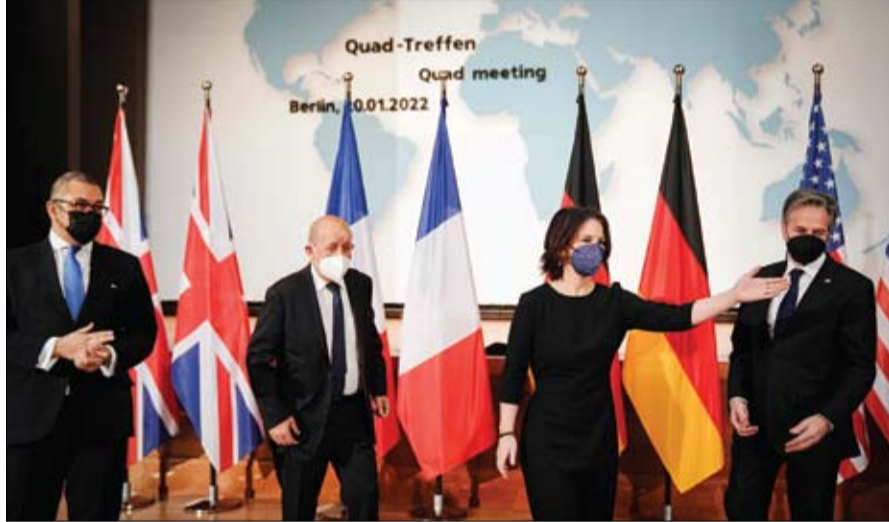
وزراء من بريطانيا وفرنسا وألمانيا وأمريكا يبحثون كيفية منع روسيا من الزحف إلى أوكرانيا

وروسيا وإيران سيجري تدريبات بحرية مشتركة الجمعة. وقال مصطفى تاج الدين وهو مسؤول علاقات عامة بالجيش الإيراني إن تدريبات الحزام الأمني البحري 2022 المشتركة ستجري في شمال المحيط الهندي. وأضاف أن الصين وروسيا وإيران بدأت التدريبات البحرية المشتركة في 2019 وستواصلها مستقبلاً.