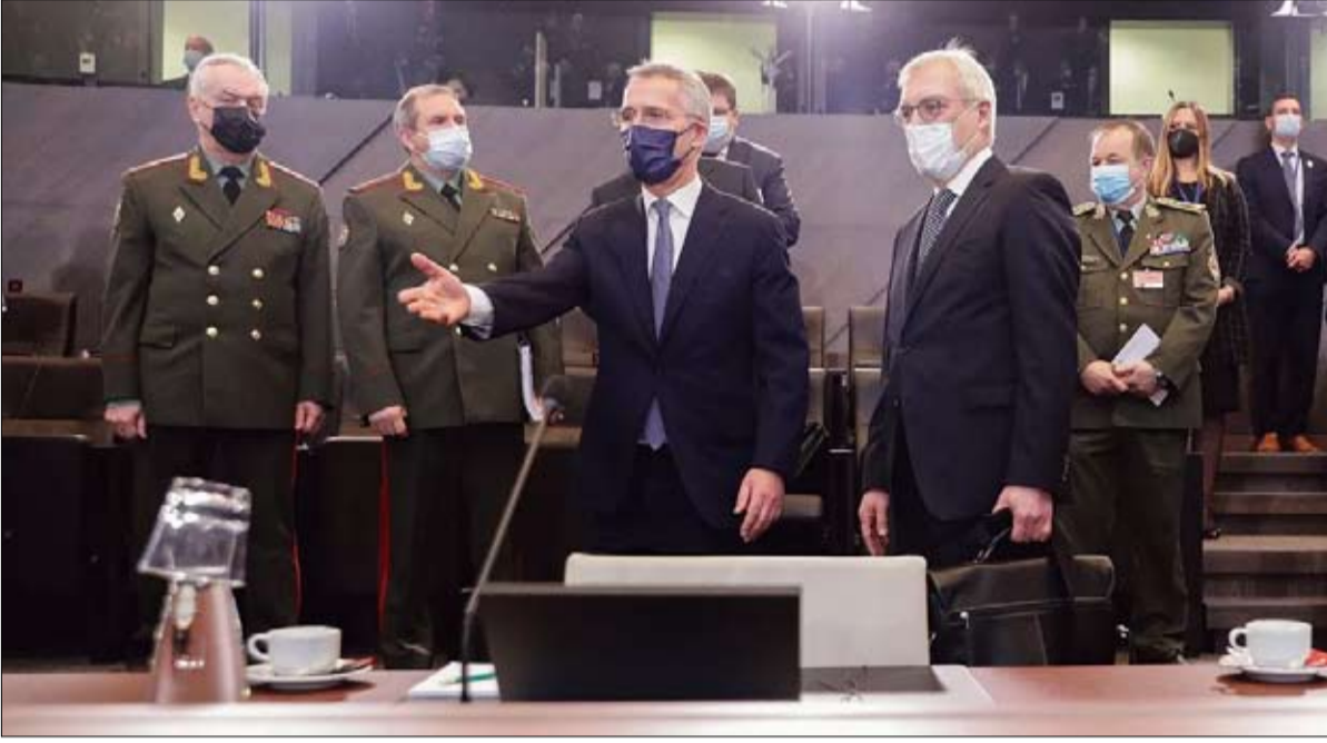
حوار ثنائي في جنيف بين الولايات المتحدة وروسيا من أجل الاستقرار الاستراتيجي