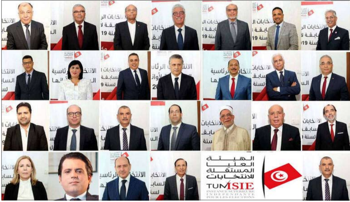
بعض المترشحين للانتخابات 2019

قررت الدائرة الجناحية السادسة بالمحكمة الابتدائية بتونس، أمس الخميس تأخير جميع القضايا المتعلقة بجرائم انتخابية تم ارتكابها في الانتخابات الرئاسية والتشريعية لسنة 2019 إلى جلسة يوم 7 فبراير المقبل.