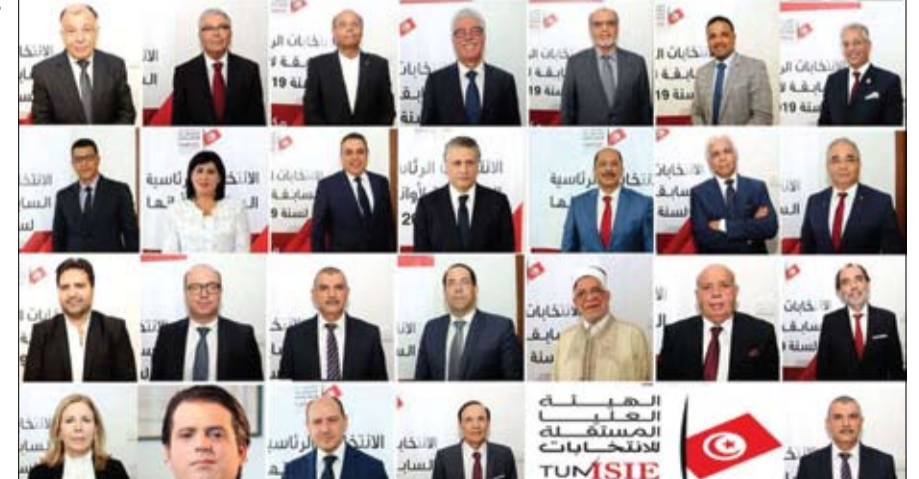
بعض المرشحين لانتخابات 2019

في تطور لافت، ارتفعت عدد الضربات الجوية الروسية على البادية السورية إلى 56 خلال نحو 48 ساعة الفائتة. في التفاصيل، ذكر المرصد السوري لحقوق الإنسان، أن روسيا شنت خلال الساعات الماضية غارات مكثفة على المكان لاستهداف عناصر من تنظيم داعش الإرهابي. وأضاف أن طائرات حربية رشاشة تابعة للنظام السوري شاركت في قصف البادية السورية، وضربت بادية حماة الشرقية، بينما تركز القصف الجوي الروسي على مواقع متفرقة من البادية السورية في كل من حمص ودير الزور، وذلك بعد توقفها نحو 5 ساعات متتالية. وبذلك، يرتفع إلى أكثر من 442 تعداد الغارات التي نفذتها القوات الروسية في البادية السورية منذ مطلع يناير.