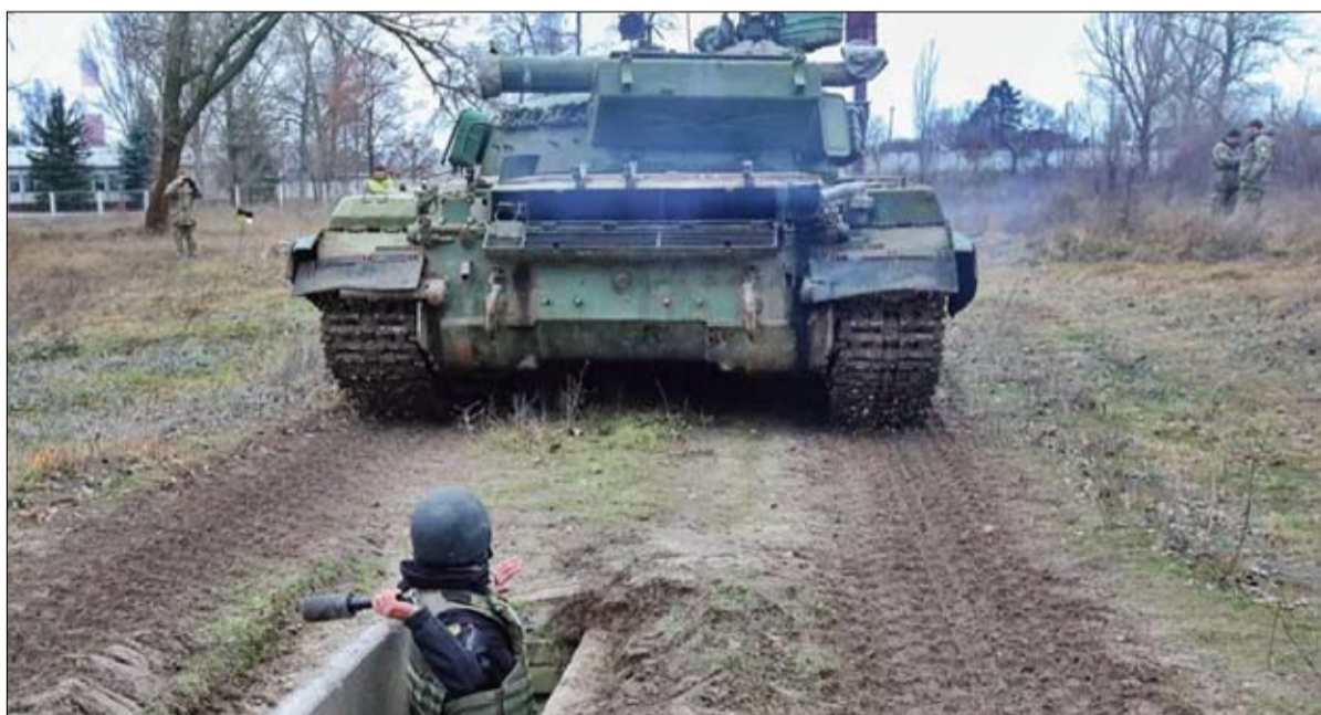
الجيش الأوكراني يستعد للاسوا

من خلال نشر هذه الاستراتيجية، تسعى موسكو إلى هدفين: من ناحية، تهدف روسيا إلى الحصول على ضمانات أمنية على طول حدودها. بالتاكيد، يعتبر الناتو العديد من الطالب الروسية المذكورة سابقاً مستحيلة. لكن بينما ترغب الإدارة