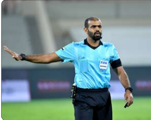
أول طاقم من خارج القارة العجوز، ويتولى إدارة مباريات في بطولة كأس الأمم الأوروبية عبر التاريخ، وسيظهر 4 حكام عرب في النسخة

وتأتي فرنسا والأرجنتين في الواجهة بعد اختيار 4 حكام من كل دولة بينهم واحد لتقنية الفيديو، وسيقود الطاقم الفرنسي حكم الساحة الشهير كليمنت توربين الذي حصل على جائزة أفضل حكم في فرنسا عام 2016 قبل أن يُشارك في بطولة «يورو»، في نفس العام، وظهر توربين مع مساعديه المختارين لـموندiales أبوظبي، في كأس العالم 2018 وكذلك نهائي بطولة «يوروبا ليغ 2021»، في حين يقود فرناندو راياليني طاقمه الأرجنتيني الذي راهقه أيضاً في إدارة مباريات «يورو 2020»، ليكون