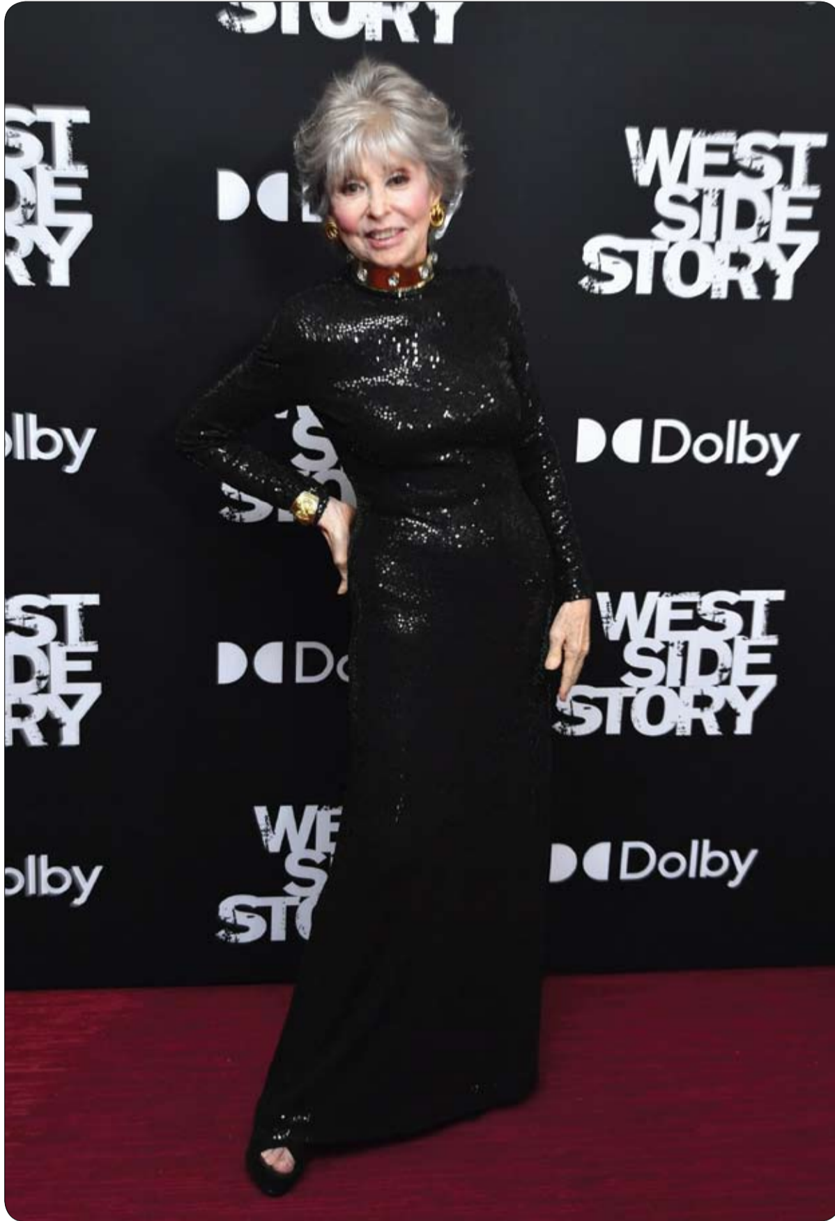
ريتا مورينو خلال حضورها العرض الأول لفيلم «قصة الجانغ الغربية» في مركز لينكولن بنيويورك.

وقدمت هذه الأحذية الرياضية في حزيران/يونيو 2021 لجموعه Louis Vuitton لربيع وصيف 2022، والتي تولى فيها فيرجيل أبلوه، ملك أزياء الشارع الفاخرة، منصب المدير الفني "الرجالي". وتويء أبلوه، مصمم الأزياء ومنسق الأسطوانات المولع بموسيقى الهيب هوب والستشاز السابق لغني الرب كانييه ويست، بسبب السرطان في نهاية تشرين الثاني/نوفمبر عن 41 عاماً. وجرى تحديد سعر الانطلاق في المزاد عند ألفي دولار، ويشمل أيضاً حقيبة برتقالية.