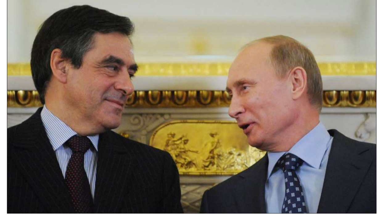
أقام فرانسوا فيلون وفلاديمير بوتين علاقة ودية عندما كانا رئيسين للوزراء

مركز النزاهة الديمقراطية، إلى أن "الحزب الاشتراكي الديمقراطي، حيث يظل مؤثراً، قدم دعماً حاسماً لتحقيقه". ما الذي يمكن أن يقدمه فيون لروسيا؟ "يهدف تعيينه إلى إظهار أن موسكو لا تزال شريكاً منفتحاً على الساحة الدولية؛ إنه رافعة تأثير لشركتي سيور وزارويجنتف"، يرى الخبير