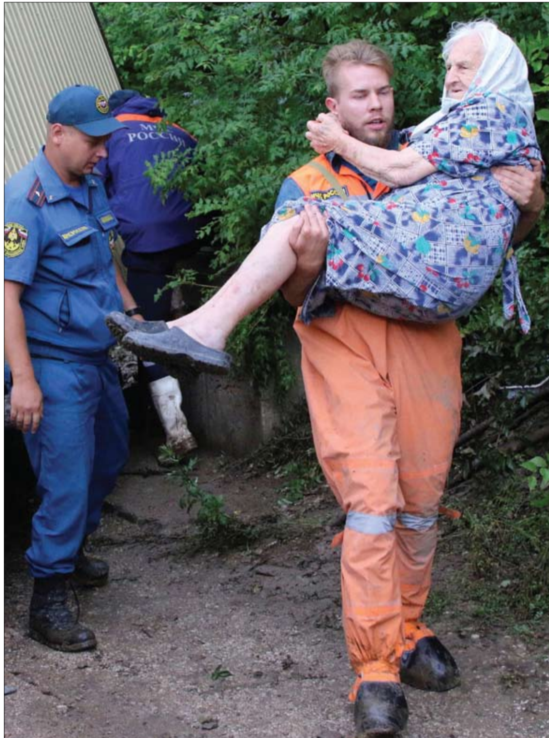
رجل إنقاذ يحمل امرأة مسنة، بعد هطول أمطار غزيرة تسببت في فيضانات بالقرب من ياخشيساري، القرم.