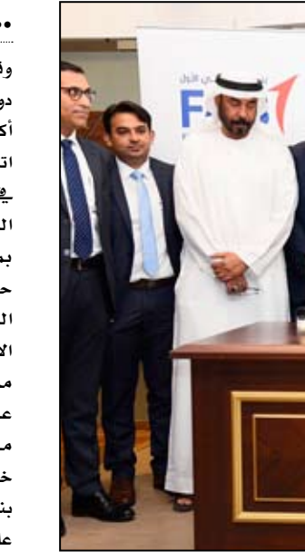
بمعية رأس الخيمة Ras Al Khaimah Municipality