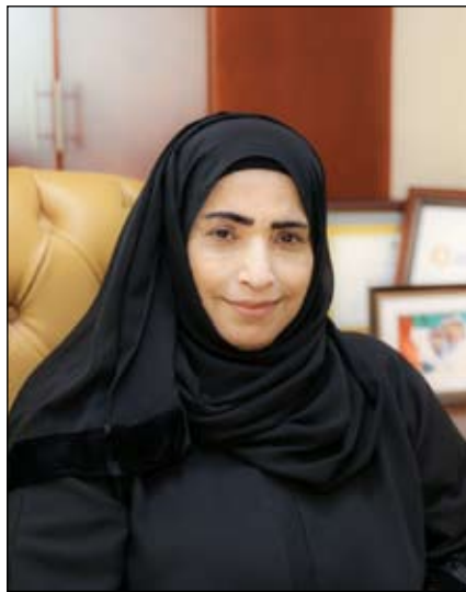
تحت شعار «على نهج زايد»