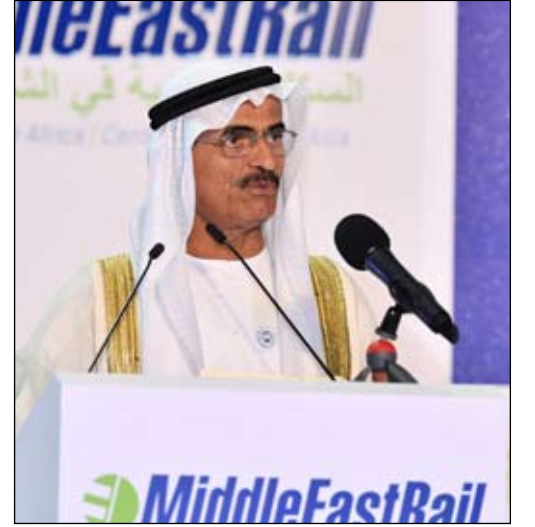
تحت رعاية منصور بن زايد