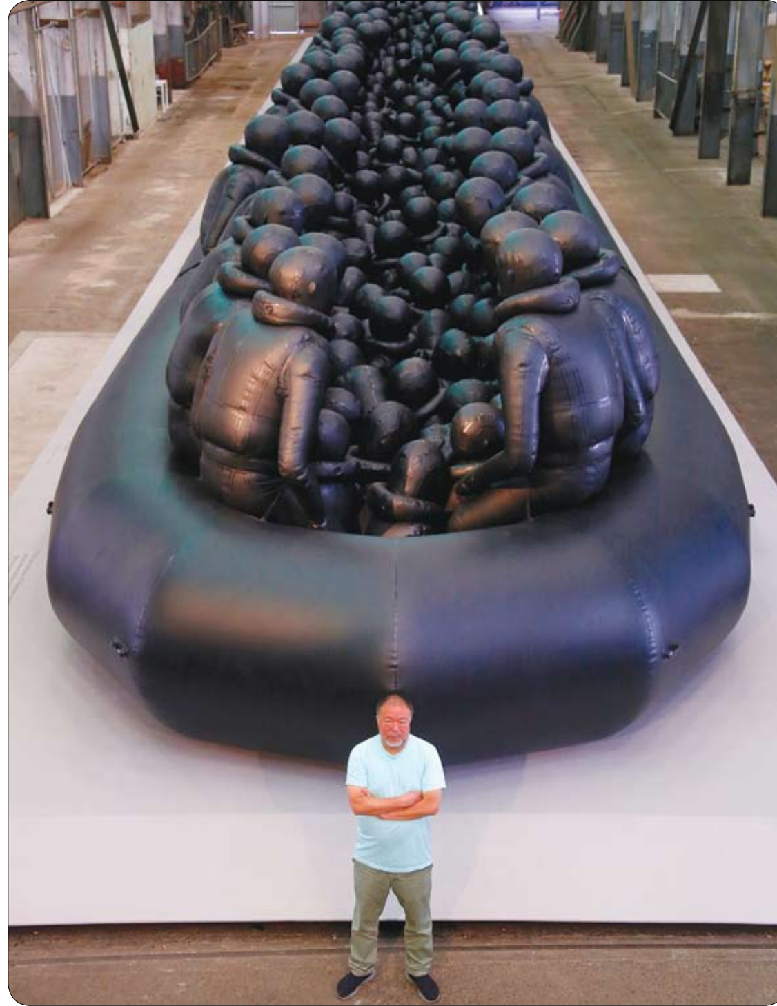
الفنان الصيني آي ويوي يقف أمام عمله الفني الذي يجسد طوافة مطاطية بطول 60 مترًا تحمل عنوان "قانون الرحلة" وتضم حوالي 300 شخص يمثلون اللاجئين، خلال تقديم إعلامي لبيئاني سيدني.