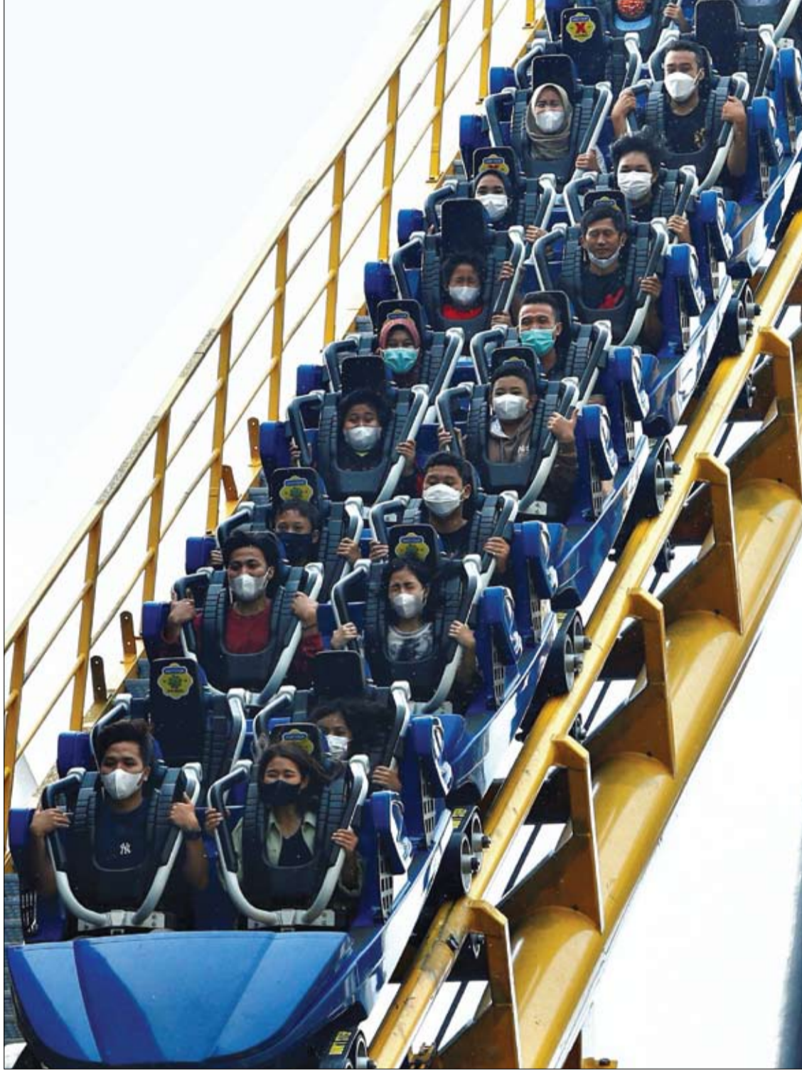
أشخاص يرتدون أقنعة واقية ولوجه يركبون أفعوانية في ترائس ستوديو، في جاكارتا، إندونيسيا.

أعلن الدكتور ألكسندر ميروشينكو، خبير التغذية الروسي، أن نمط الحياة الخامل والنظام الغذائي غير الصحي، من أسباب ارتفاع مستوى ضغط الدم، مشيراً إلى وجود مواد غذائية تساعد على تخفيضه. ويشير الخبير في حديث تلفزيوني، إلى أنه من الضروري قبل كل شيء الانتباه إلى التفاح. لأن التفاح يحتوي على ألياف غذائية - البكتين، الذي له تأثير إيجابي في الجهاز الهضمي، ويساعد على تخفيض مستوى الكوليسترول وضغط الدم الشرياني. والميعار اليومي للوقاية من ضغط الدم هو تناول تفاحة أو تفاحتين. ويضيف، المادة الغذائية الثانية، التي تساعد على تخفيض مستوى ضغط الدم هي البنجر. وهذه المادة بالإضافة لاحتوائها على نسبة جيدة من البكتين، تحتوي على أوكسيد النترريك المسؤول عن توسع الأوعية الدموية. لذلك عند ارتفاع مستوى ضغط الدم، ينصح الأطباء بتناول عصير البنجر. ويساعد المشمش المجفف أيضاً على تخفيض مستوى ضغط الدم لأنه يحتوي على ثلث حاجة الجسم من عنصر البوتاسيوم، الضروري لتتظيم تقلص العضلات، بما فيها عضلة القلب، وتوسع الأوعية. ويضيف الخبير، تفيد الأحماض الدهنية أوميغا3- كثيرًا القلب والأوعية الدموية. وهذه الأحماض موجودة بنسبة عالية في سمك الرنجة. لذلك ينصح من يعاني من ارتفاع مستوى ضغط الدم بتناول هذا النوع من السمك ويفضل ألا يكون معلباً. ويشير إلى المواد الغذائية المحتوية على بروتين نباتي- العدس والحمص والفاصوليا وغيرها، التي ينصح بتناولها 2-3 مرات في الأسبوع.