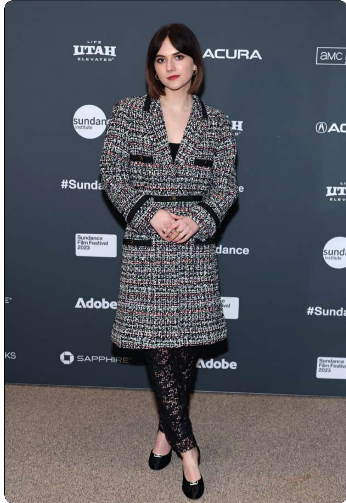
إميليا جونز لدى حضورها العرض الأول لفيلم "كات بيرسون"، في مهرجان صندانس السينمائي في بارك سيتي. (ا ف ب)

شهدت ولاية أريزونا الأمريكية مؤخراً بيع طراز فريد من السيارات الكلاسيكية التاريخية الشادرة، التي أنتجتها العلامة التجارية Simplex بين عامي 1906 و1915. وبيع طراز 50HP 5 Passenger 1912 Torpedo Tourer لأعلى مزيد في مزاد للسيارات في أريزونا الأسبوع الماضي وتم شراؤها مقابل 4.85 مليون دولار. ويحمل هذا السيارة التي يبلغ عمرها 111 عاماً رسمياً أعلى سيارة قبل الحرب العالمية الأولى على الإطلاق، وكانت آخر مرة عرضت فيها هذه السيارة في المزاد في عام 2006. وحطمت السيارة التاريخية تقديراتها السابقة لتبيع البالغة 2.5 إلى 3.5 مليون دولار لتمثل جائزة لدار المزادات التي باعها.