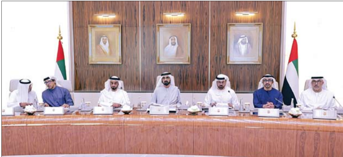
محمد بن راشد ترؤسه اجتماع مجلس الوزراء

بأبوظبي أوراق اعتماد 16 سفيراً جديداً تم تعيينهم لدى الدولة. ورحب سموه بالسفراء الجدد مع