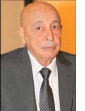
رئيس مجلس النواب عقيلة صالح