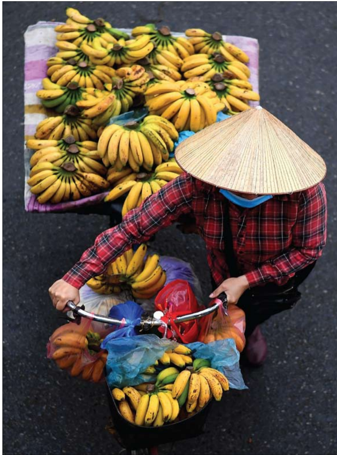
بائعة تحمل موزاً للبيع على دراجتها على طول شارع في هانوي، فيتنام.

وما يزال الباحثون غير واضحين بالضبط كيف تؤثر النترات بشكل إيجابي على وظيفة العضلات. ومع ذلك، يقترحون أن النترات قد تحسن وظيفة الأوعية الدموية وتدفق الدم. وأوضح الدكتور سيم: "نعلم من الأبحاث السابقة أن أكسيد النيتريك هو موسع للأوعية الدموية، ما يسمح بتدفق المزيد من الدم إلى عضلاتك". وفي الواقع، يستخدم الرياضيون كمكملات النترات لتحسين القدرة على التحمل والأداء. ويأمل الباحثون أن تشجع النتائج الناس على دمج المزيد من الخضار الورقية في وجباتهم الغذائية. وأضاف سيم: "يجب أن نتناول مجموعة متنوعة من الخضراوات كل يوم، على أن تكون واحدة منها على الأقل من الخضراوات الورقية لاكتساب مجموعة من الفوائد الصحية الإيجابية للجهاز العضلي الهيكلي والقلب والأوعية الدموية. ومن الأفضل أيضاً تناول الخضراوات الغنية بالنترات كجزء من نظام غذائي صحي بدلاً من تناول المكملات الغذائية. وتوفر الخضار الورقية الخضراء مجموعة كاملة من الفيتامينات والمعادن الضرورية للصحة".